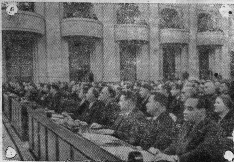
Москва 27 января в зале заседаний Большого Кремлевского дворца открылся внеочередной XXI съезд КПСС.