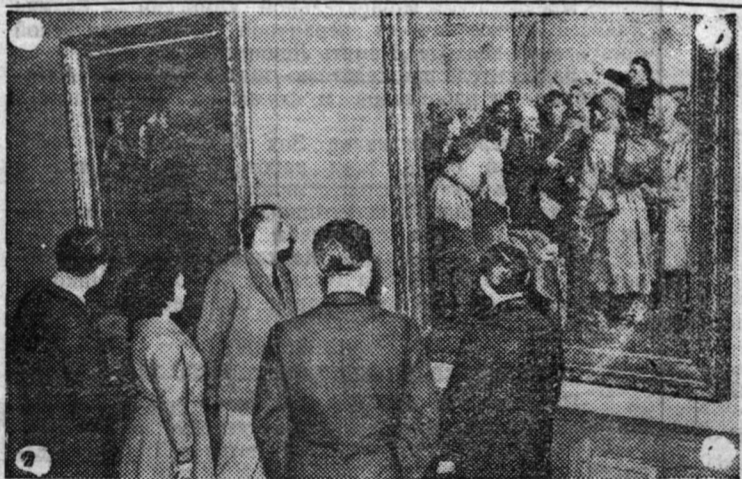
Москва. В Государственной Третьяковской галерее открыта выставка произведений советских художников и скульпторов.

В связи с ликвидацией Биряковского склада „Сельхозснаб“ передачей его РТС просьба ко всем колхозам и учреждениям срок до 15 февраля 1959 года предъявить претензии по взаимным счетам. После указанного срока претензии приниматься не будут. „Сельхозснаб.“