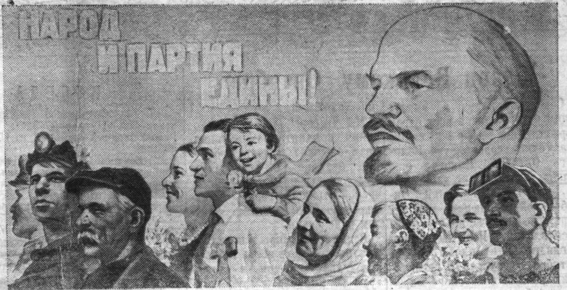
Плакат работы художников С. Забалуева и Коминареца. (Государственное издательство и изобразительного искусства).

На 20 октября с. г. обязательство по мясу выполнено на 123,7 процента, по молоку на 113,8 процента, по шерсти на 108, по яйцу на 105 процентов и по натуроплате на 100 процентов. А. Быкова.