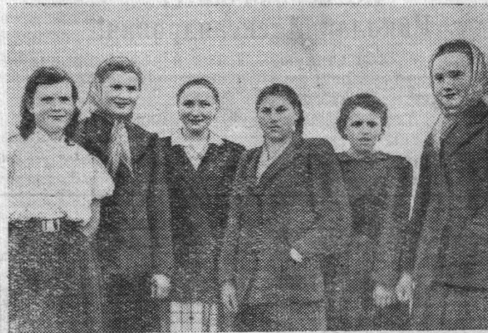
Доярки колхоза «8-е Марта» Вологодского района за весь прошлый год получили в среднем от каждой коровы по 2108 килограммов молока. В ответ на инициативу животноводов колхозов «Серп и молот» и «Красная звезда» они решили получить к 40-летию Великого Октября не менее 2800 килограммов, а к концу года—3000 килограммов молока от каждой коровы.