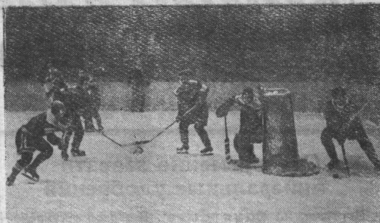
Москва. На искусственном катке „Сокольники“ состоялась международная встреча по хоккею между сборной командой Японии и командой „Спартак“ (Москва). Игра закончилась со счётом 4:1 в пользу команды „Спартак“.

Торжественные собрания, посвящённые этой знаменательной дате, прошли в колхозе имени Ленина, имени Сталина и других.