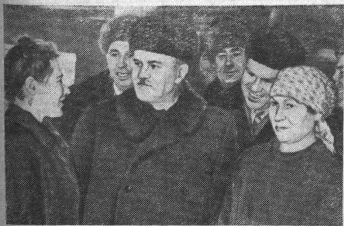
Пребывание в Воронеже Первого заместителя Председателя Совета Министров СССР В. М. Молотова по случаю награждения Воронежской области орденом Ленина.