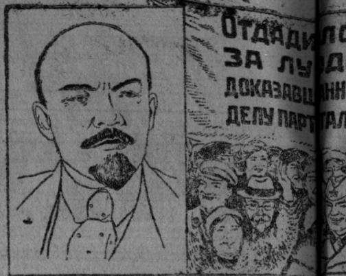
Рисунок В. Баркова и В. Лисевича.

Центральный Комитет Всесоюзной Коммунистической партии (большевиков). 20 декабря 1939 г.