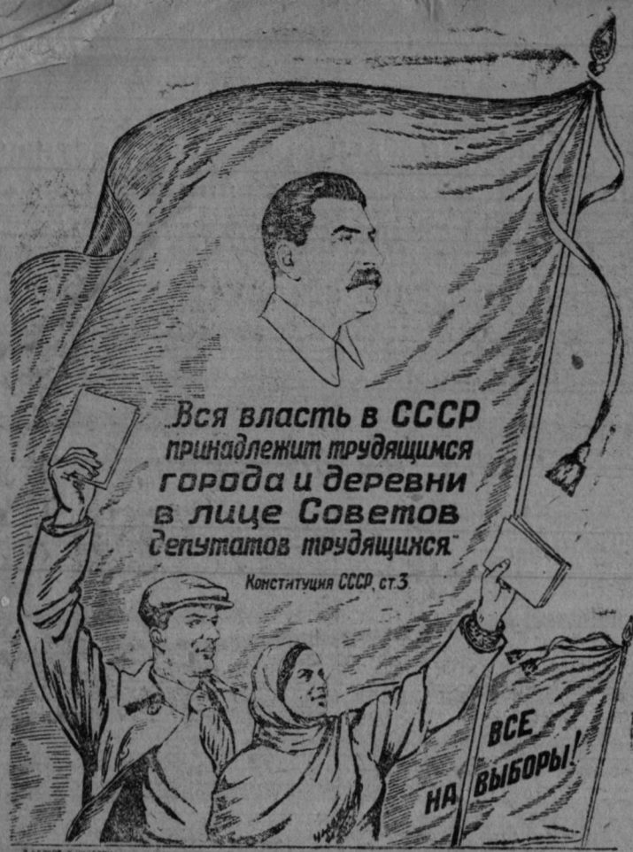
Рисунок В. Баркова и В. Лисевича