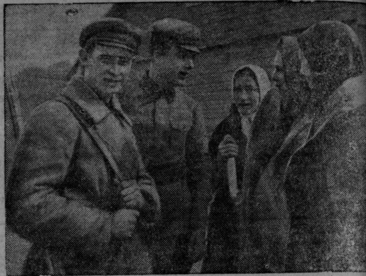
На снимке: Красноармейцы беседуют с крестьянами.