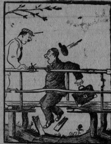
Рисунок М. Отарова.