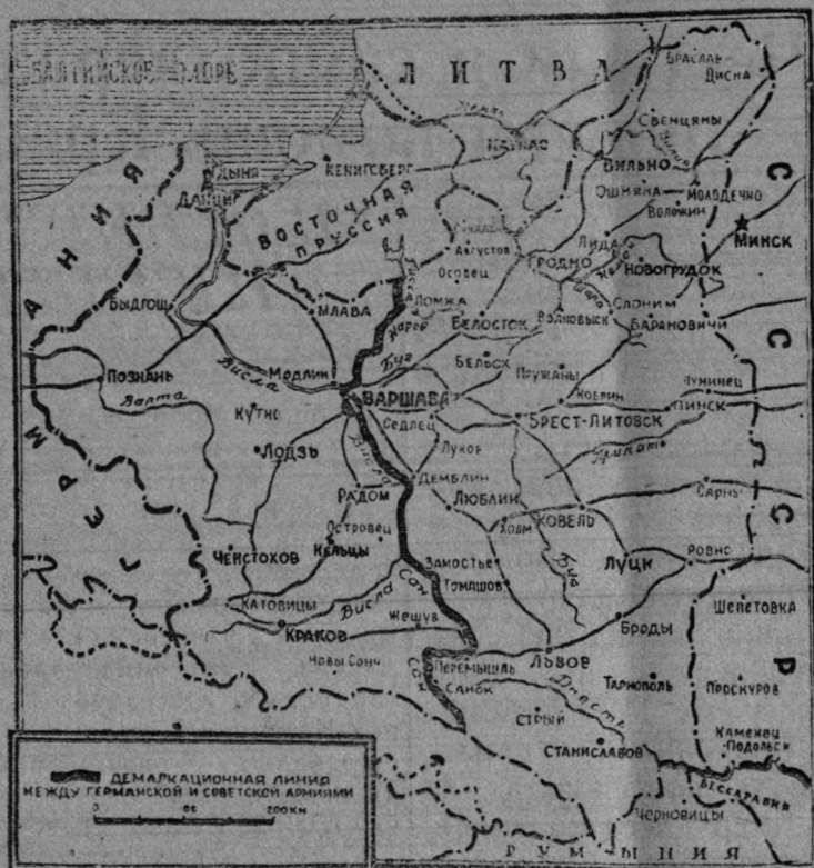
Репродукция с карты, помещенной в газете "Правда" от 23 сентября 1939 года.