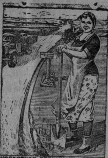
КОЛХОЗНАЯ ВОРОННАЯ БРИГАДА ЛУЧШАЯ ФОРМА ЧЛЕНСТВА СЕЛЬСКОГО НАСЕЛЕНИЯ В СТРОИТЕЛЬСТВЕ И РЕМОНТЕ ДОРОГ