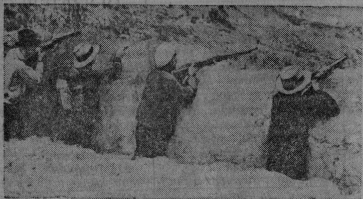
Многочисленные китайские партизанские отряды вместе с регулярной армией успешно ведут борьбу с японской военной силой. На снимке: Огонь китайского партизанского отряда в провинции Гуандун.