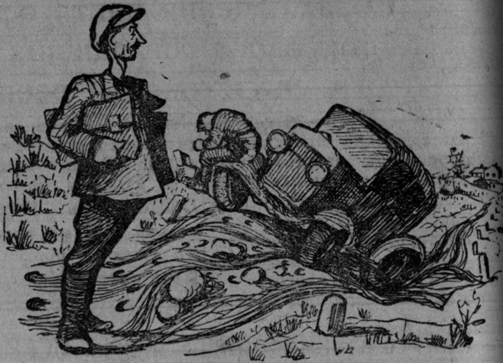
— Эта дорога обошлась мне в 30.000 рублей: сто рублей и вложил на ее ремонт да три машины разбил... Рисунок Ю. Левченко.