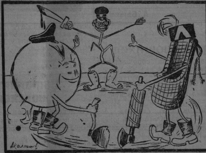
К заключению военного союза агрессоров.