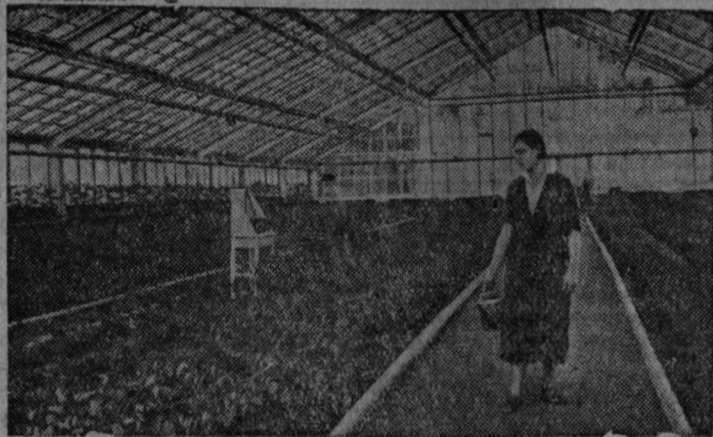
На снимке: одна из теплиц овощного участка Наркомзема РСФСР

На строительстве Всесоюзной сельскохозяйственной выставки