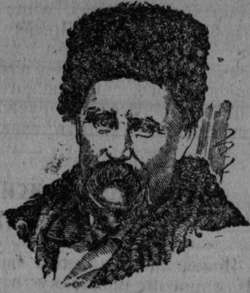
На снимке: Т. Г. Шевченко.