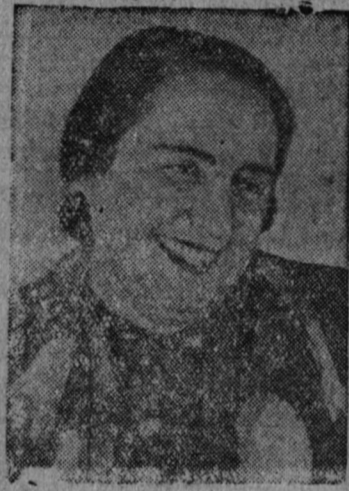
На снимке: член ЦК Испанской компартии Долорес Ибаррури (Пассионария).

Пример счастливых советских женщин воодушевляет трудящихся женщин капиталистических стран, вселяет в них веру в свое освобождение и близкую победу над кровавым врагом человечества — фашизмом.