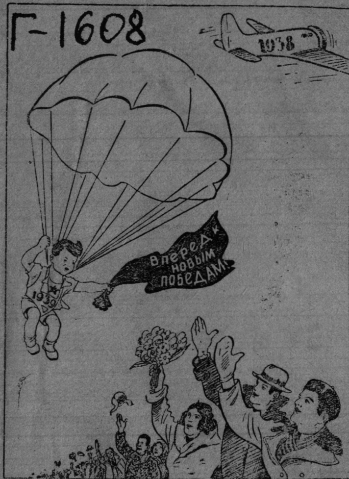
С новым годом, с новыми успехами!