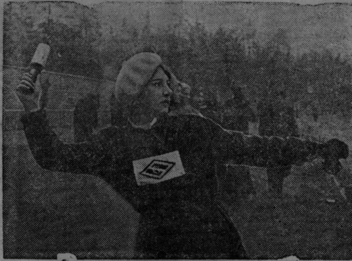
Московские мастера гранатометания на стадионе ЦДКА в Сокольниках.

В 1938 году закончено строительство первой очереди