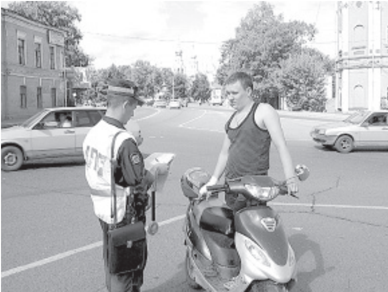
Водители мототехники признались, что часто маневрируют между рядами транспорта.

Автомобилисты же на второе по распространенности место поставили превышение водителями мотоциклов, скутеров и мопедов