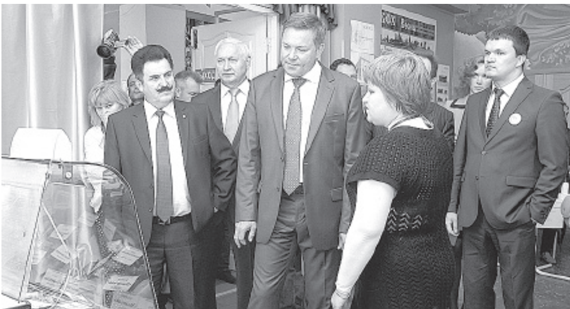
В ходе поездки в Вологодский район Олег Кувшинников ознакомился с продукцией предприятий района, оценил качество инвестиционных проектов, реализуемых в муниципальном образовании.

По инициативе врио губернатора области предлагается внести поправки для решения вопросов, касающихся увеличения финансирования медицинских учреждений, финансируемых за счет бюджета области и оказывающих психиатрическую, наркологическую, фтизиатрическую и иную помощь, - 8,6 миллиона рублей. Кроме того, на реализацию мероприятий по улучшению состояния здоровья детей, находящихся на искусственном вскармливании, в части обеспечения их адаптированными молочными смесями планируется направить 2,45 миллиона рублей.