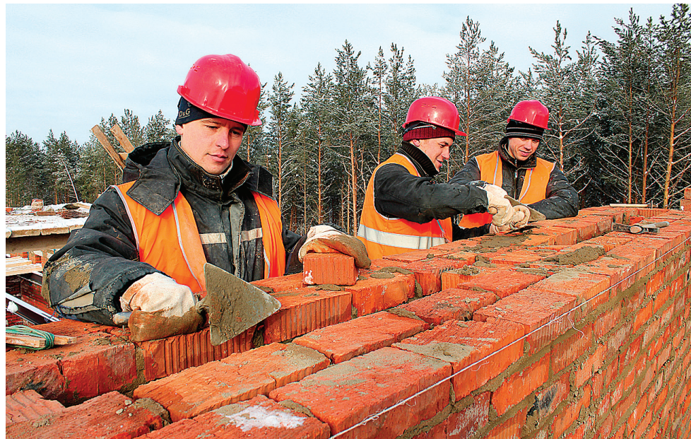
Компания «Стройбизнес» укомплектована настоящими профессионалами своего дела.

Свидетельство от 06.06.2013 № 1020.03.2011-3526021697-С-131, выдано саморегулируемой организацией, основанной на членстве лиц, осуществляющих строительство. Некоммерческое партнерство «Саморегулируемая организация «Объединенные производители строительных работ».