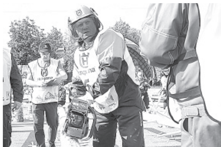
Лесозаготовители показали высокий класс мастерства.