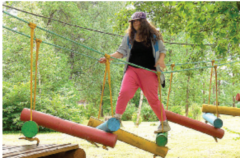
Две недели назад в парке появился новый аттракцион: детская полоса препятствий.

Действительно, начиная с лета прошлого года в КИО появилось сразу несколько новых аттракционов. В их числе детские американские горки, площадка для мини-гольфа, басейн с шарами. А буквально две недели назад здесь открыли и детскую полосу препятствий. Почти все эти аттракционы, как и несколько новых торговых точек, появились благодаря частным инвесторам и предпринимателям. Кто-то из них пришел работать в парк самостоятельно, кого-то привлекли через Агентство городского развития. Поверив в позитивные перемены, обратили внимание на череповецкий КИО и представители бизнес-сообщества из других городов. Питерские предприниматели, к примеру, застелили часть парка искусственным газоном, устроив здесь зону развлечений с