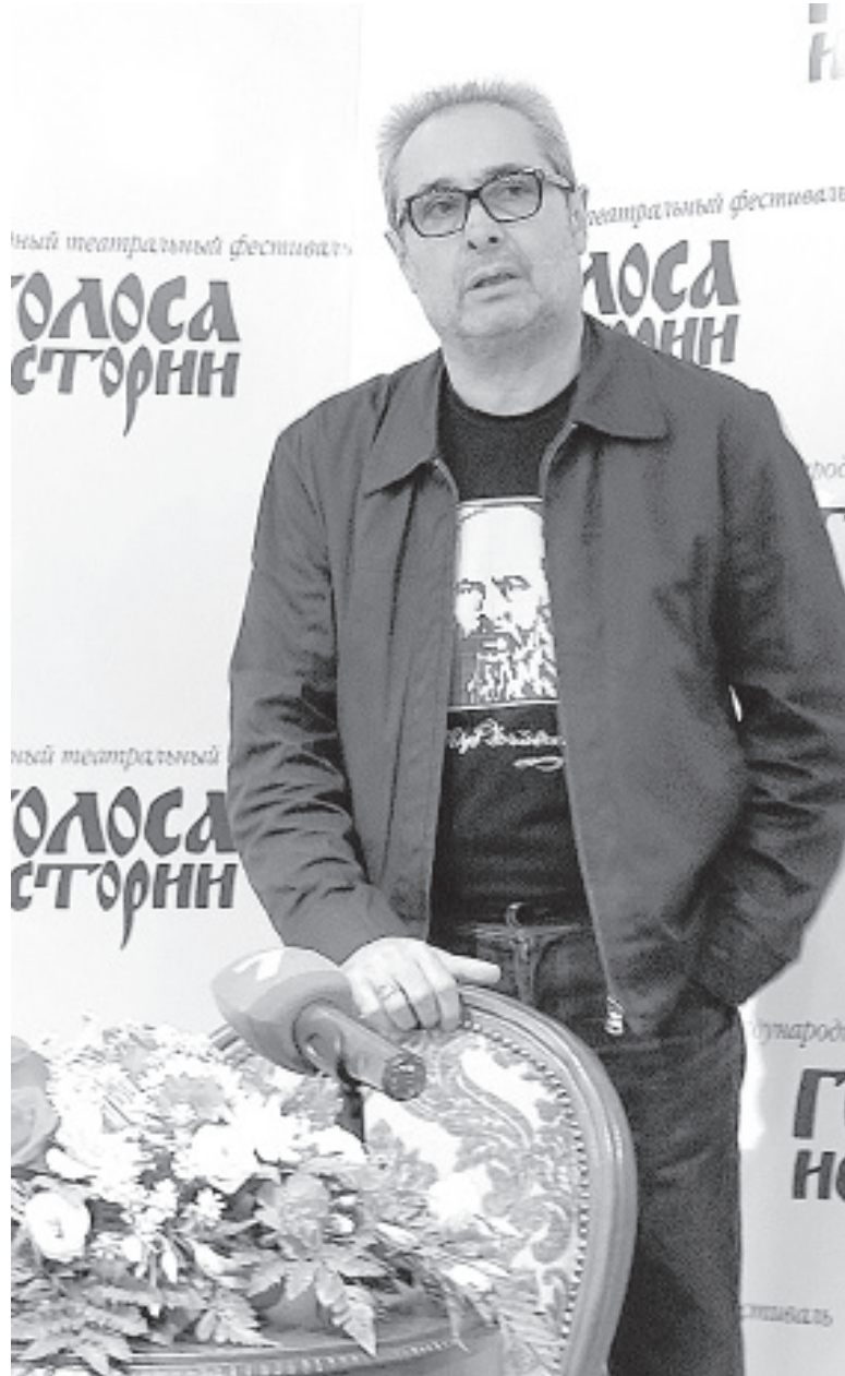
Художественный руководитель Александринского театра Валерий Фокин.

- Они возникают всегда и без «Золотой маски». Это конкуренция. Особый разговор - работа жюри. Одни тянут влево, другие - направо. Одни утверждают - надо разрушить ретроградность, другие защищают традиции. Важно найти золотую середину, не играть в игры, а оценивать честно.