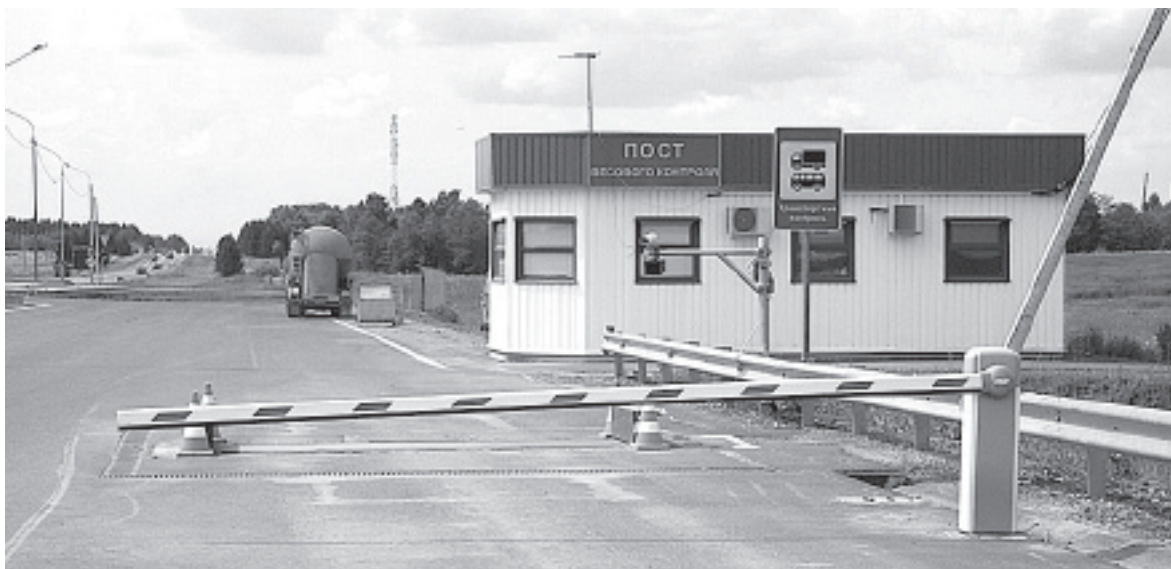
Через пост весового контроля на трассе Вологда - Новая Ладога под областным центром ежедневно проходит свыше 30 тысяч транспортных средств.