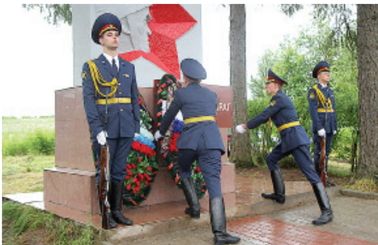
В Вытегре состоялось открытие обновленного монумента «Здесь был остановлен враг».

Атмосферное давление 758 - 760 мм рт. столба.