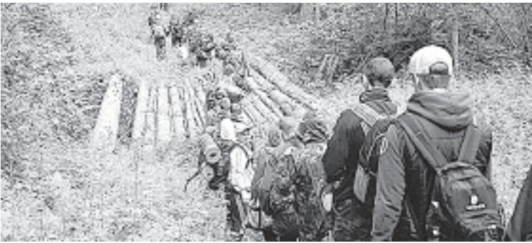
В таких масштабах «Зарница» в Вологде проводилась впервые.

Алексей ТРЕТЬЯКОВ, по материалам «Вологда-портала»