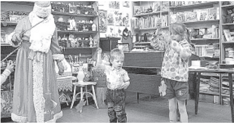
Так детишки из Пери встречали Деда Мороза.