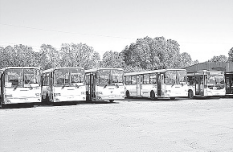
Предприятие постепенно обновляет автобусный парк.