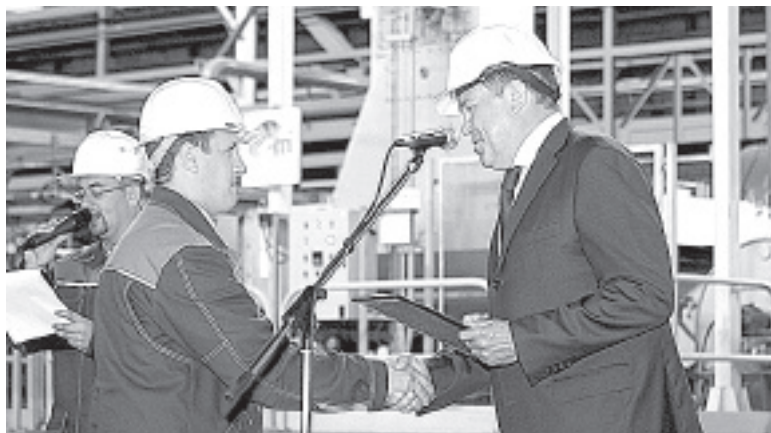
В ходе церемонии были отмечены передовики производства.

Широкая география поставок нашла свое отражение на импровизированной карте, где стрелки связывают Череповец со Всеволожском, Тольятти, Ульяновском, Минском, Самаркандом и другими города-