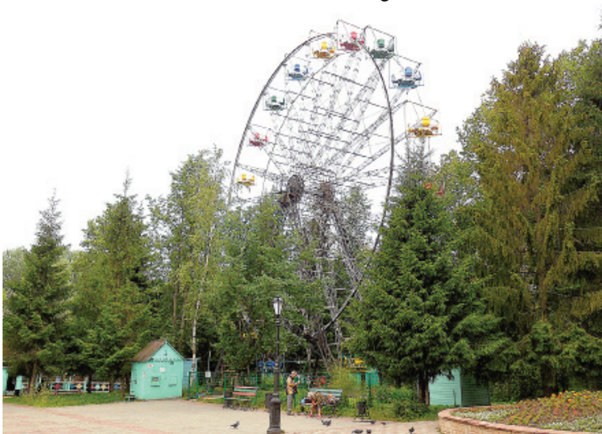
В череповецком КИО теперь есть как классические аттракционы, так и новые, современные.