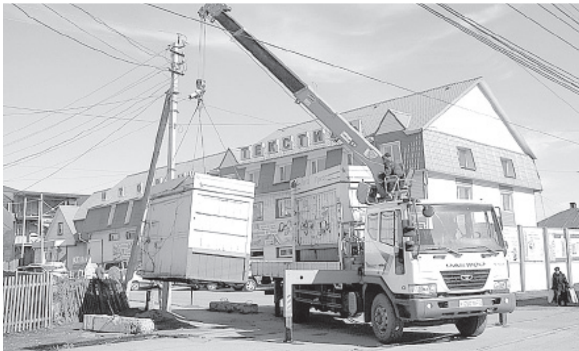
Некоторые павильоны убирают в том числе потому, что они портят облик города.

Сегодня на ситуацию в нестационарной торговле влияет целый ряд как объективных, так и субъективных факторов. Один из основных моментов связан с изменениями в федеральном законодательстве, запрещающими торговать в киосках алкогольной продукцией и табачными изделиями. А ведь раньше именно этот ассортимент приносил большую часть доходов таким точкам. Получается, что сейчас владельцам павильонов, по идее, надо перепро-