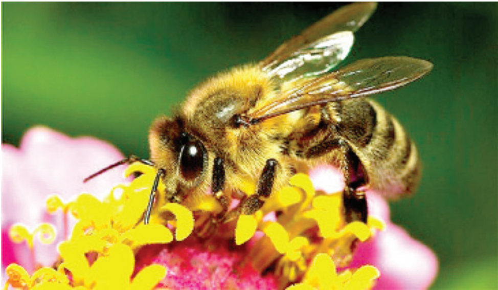
Летом пчела создает запасы корма на зиму.

Во время хорошего медосбора не рекомендуется осматривать пчелиные семьи днем, когда пчелы усиленно работают. Учитывая это обстоятельство, магазинные надставки и медовые корпуса снимают под вечер, когда пчелы уже прекращают вылет из ульев. Перед отбором меда в надставку сверху подают несколь-