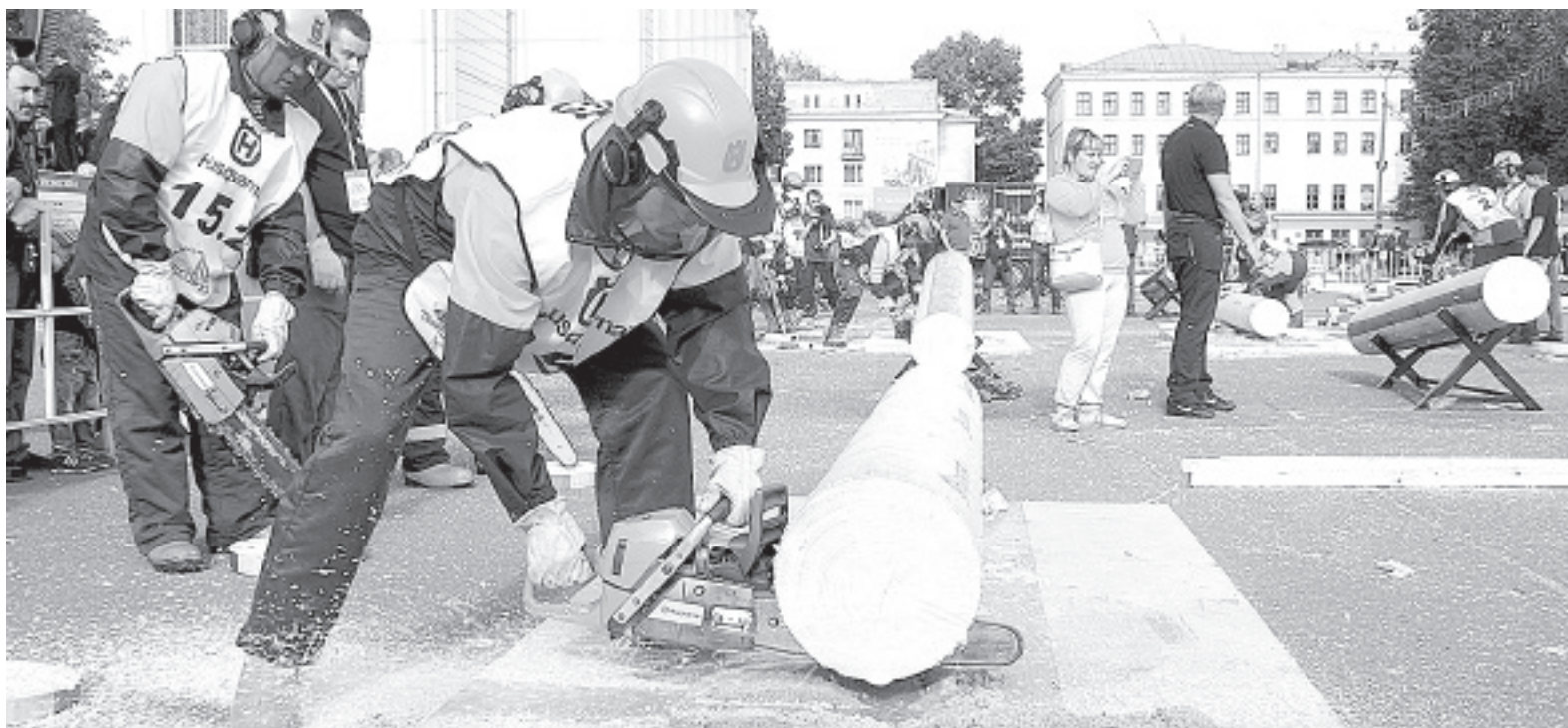
Всероссийский чемпионат лесорубов в этом году собрал представителей 53 регионов страны.