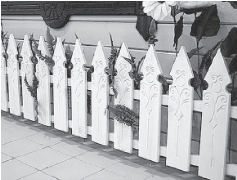
Жюри конкурса оценит красоту установленных жителями Тотемы заборов, ограждений, палисадников.

Жюри конкурса будет оценивать красоту изготовленных и установленных жителями Тотемы заборов, ограждений, палисадников у индивидуальных и многоквартирных жилых домов. В нем могут принять участие все желающие: как отдельные граждане, так и творческие коллективы, группы, предприятия, организации города и района. Как отмечают организаторы конкурса, представленные ограж-