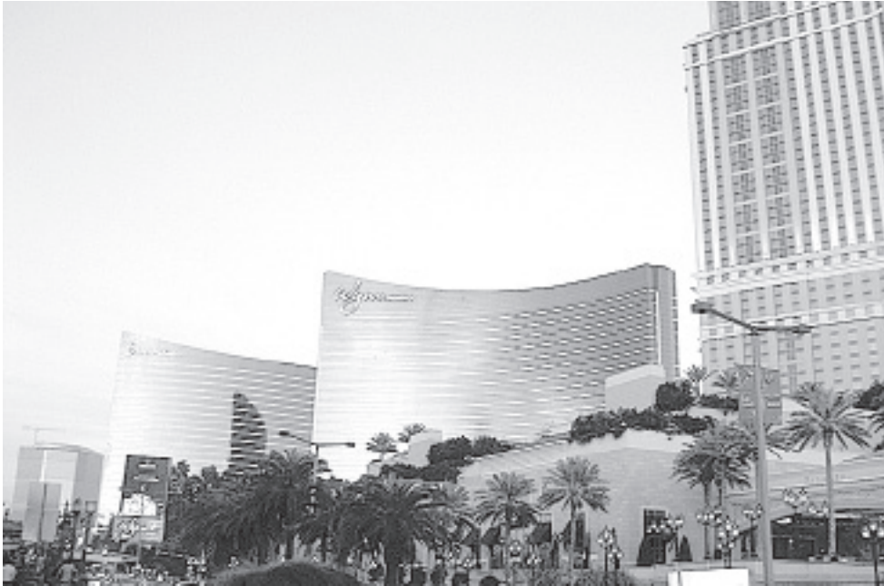
Лас-Вегас восхищает своей грациозностью.