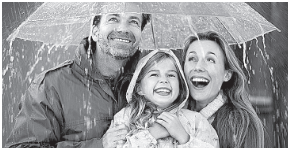
Сбербанк откроет широкие возможности для сохранения и приумножения накоплений.

Важно отметить, что можно самостоятельно выбрать срок вклада, который вам необходим, в диапазоне от одного месяца до трех лет - с точностью до дня. Это гораздо удобнее, чем вклады с фиксированным сроком.