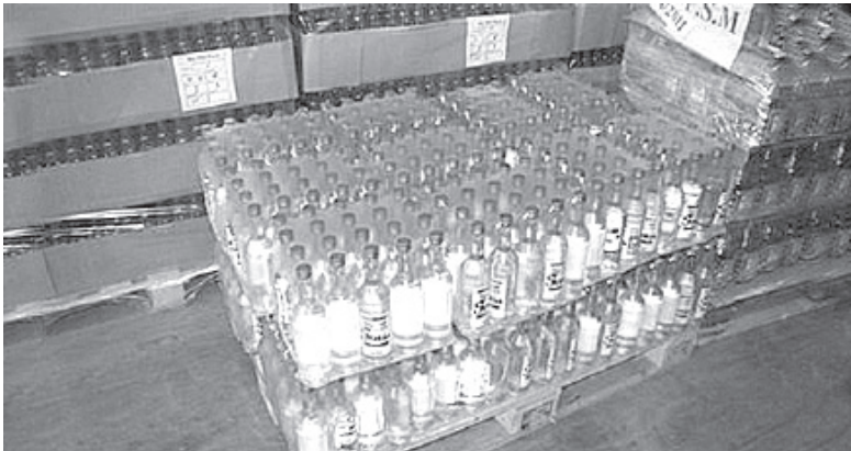
Полицейские изъяли 12 000 бутылок с контрафактным алкоголем.

Как сообщили в пресс-службе УМВД области, по предварительным данным, изъятый алкоголь принадлежит 38-летнему череповчанину, продукция завезена на скла-