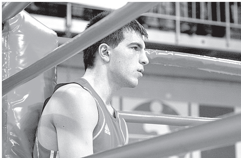
Перед последним раундом. А потом - победа!