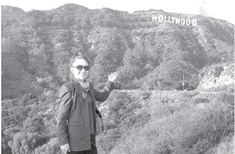
Автор письма на фоне легендарного символа роскоши и славы.