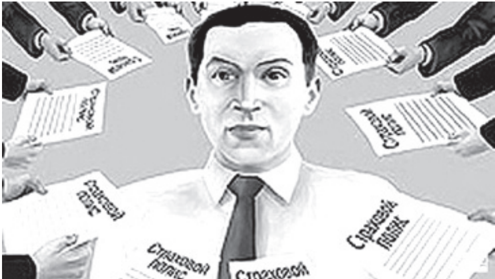
Кроме полиса ОСАГО от клиентов в обязательном порядке требовали оформить и другие страховые услуги.

- К сожалению, данное нарушение системное, характерное и для других российских регионов. Например, в Башкортостане Росгосстрах навязывал к ОСАГО полис ДОСАГО. Дело дошло до Высшего арбитражного суда, который поддержал позицию антимонопольного органа, выдавшего предписание о прекращении навязывания полиса ДОСАГО. После этого башкирский Росгосстрах стал благополучно навязывать полис «РГС-Фортуна «АВТО». Что же, начинать процесс сначала? Мы прекрасно понимаем, что