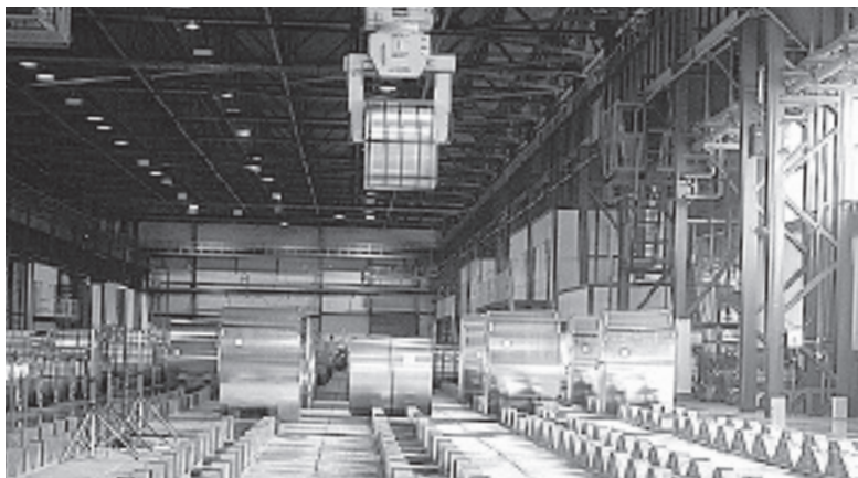
Юбилейная тонна металлопроката отгружена автопроизводителям.

Промышленная линия по производству горячеоцинкованного листа («Севергал») была запущена на Череповецком меткомбинате в 2005 году. Тогда это событие, по сути, стало настоящим прорывом в отечественной металлургии. Причем не только потому, что авторынок рос как на дрожжах и продукция череповецких металлургов была востребована у отечественных и ведущих мировых производителей автомоби-