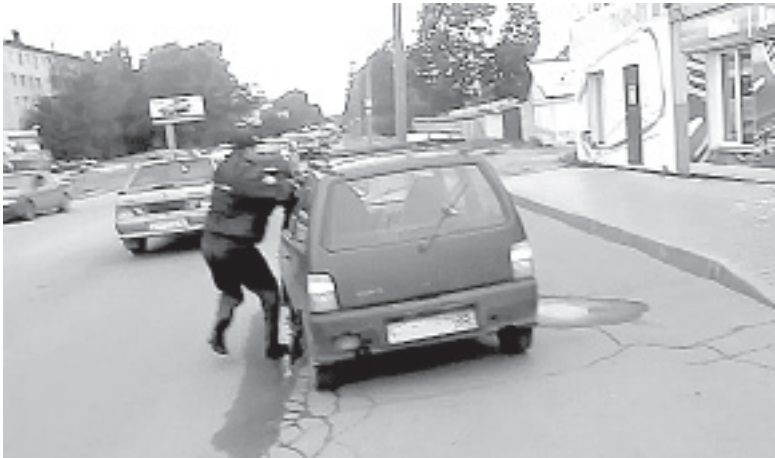
Водитель попытался скрыться в тот момент, когда его проверял сотрудник ДПС.

Инцидент произошел в пятницу, 20 июня. Наряд дорожно-патрульной службы наблюдал за движением автотранспорта на улицах областного центра, находясь у дома № 2 в Тепличном микрорайоне. Один из инспекторов заметил автомобиль «Ока», ехавший с выключенными фарами. Езда без ближнего света фар или габаритных огней правилами дорожного движения запрещена. Чтобы пресечь административное правонарушение, сотрудник полиции жестом потребовал от водителя остановиться. В ходе беседы инспектор обратил внимание на не совсем адекватное поведение молодого человека, который сидел за рулем «Оки», и заподозрил, что тот находится в состоянии опьянения. Между тем водитель отказался предъявлять полицейскому водительское удостоверение и документы на автомобиль. Вместо этого он неожиданно поднял боковое стекло машины со своей стороны, отчего рука инспектора, находившаяся в проеме окна, оказа-