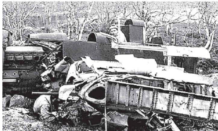
Поисковики внимательно изучили сбитый самолет Ил-2 и тщательно обследовали местность вокруг.