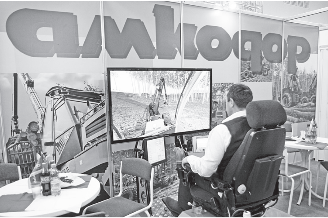
Особенный интерес у многих посетителей выставки вызвали специальные тренажеры управления лесной техникой.