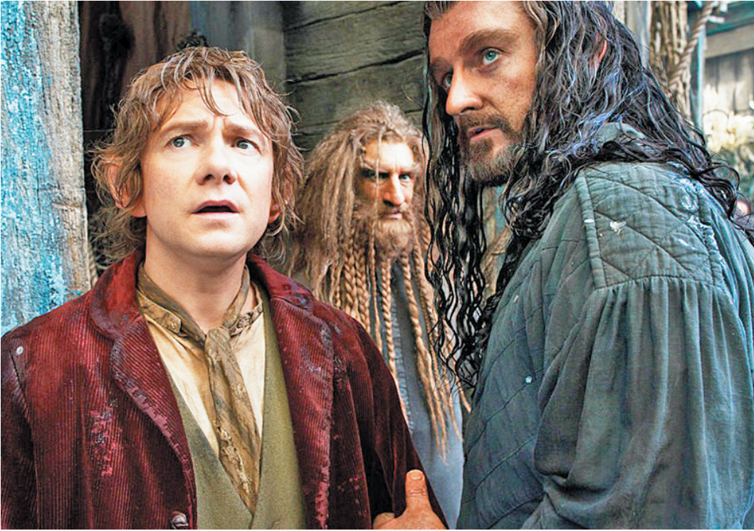
Героев фильма ждут новые опасные приключения.

«Хоббит: Пустошь Смауга» (12+) расскажет нам о дальнейшей судьбе отряда гномов, идущих к логову дракона - Одинокой горе.