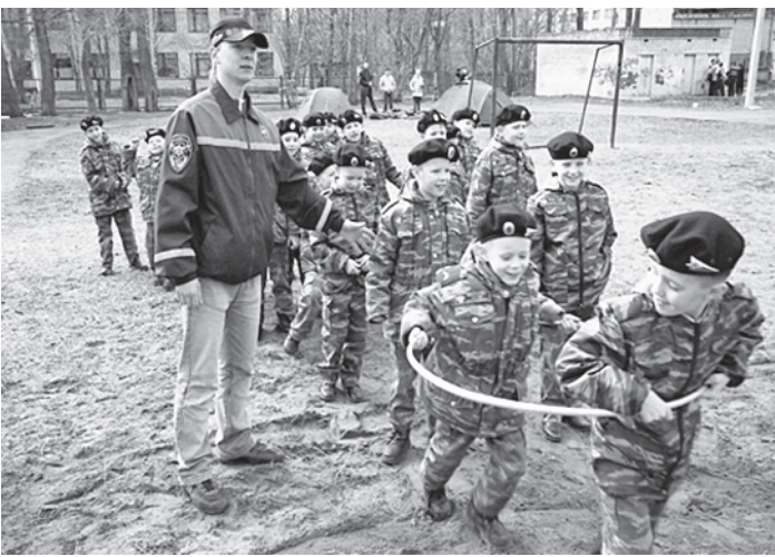
Подрастает юная смена спасателей.