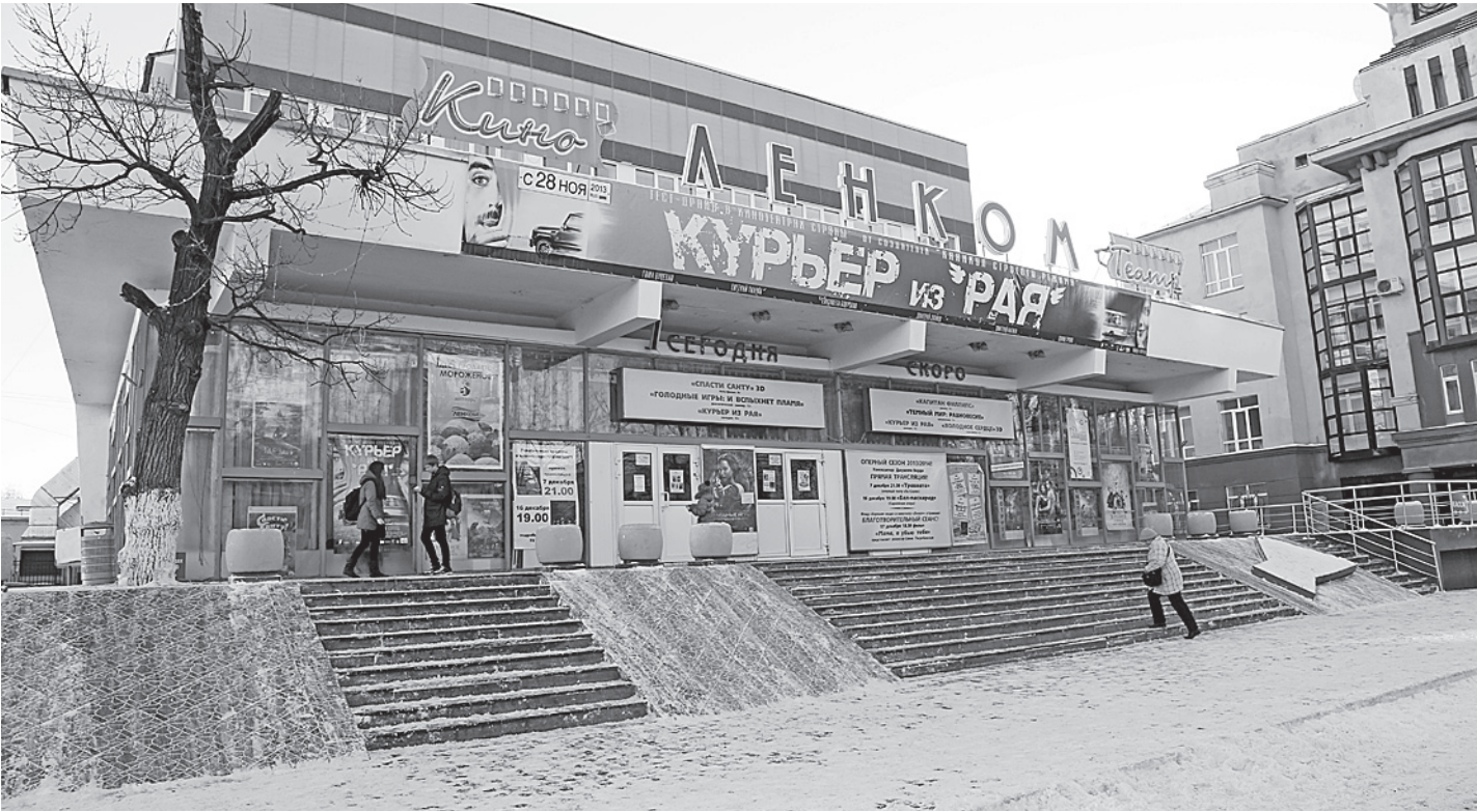
Сейчас городские власти уже не рассматривают вопрос о проведении повторного аукциона по продаже кинотеатров «Ленком» и «Салют».

Подобные ограничения, пишут авторы доклада, необходимо ввести из-за того, что после реформы 2012 года в России появилось слишком много партий.