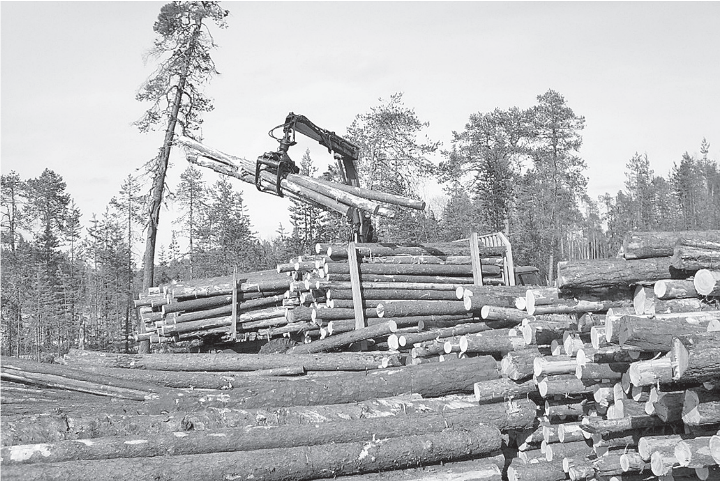
Одна из главных задач, стоящих перед работниками лесного комплекса, - модернизация действующих и создание новых производств.