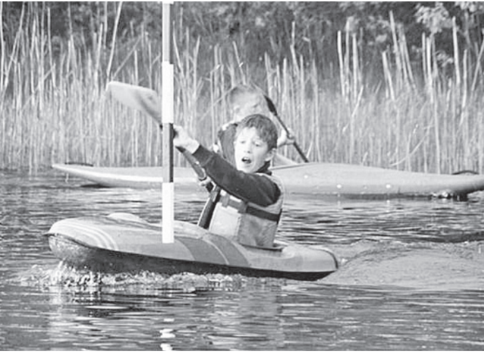
Гонки на воде - экзамен на мужество.