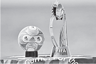
Кубок мира по пляжному футболу в 2013 году вновь у россиян.