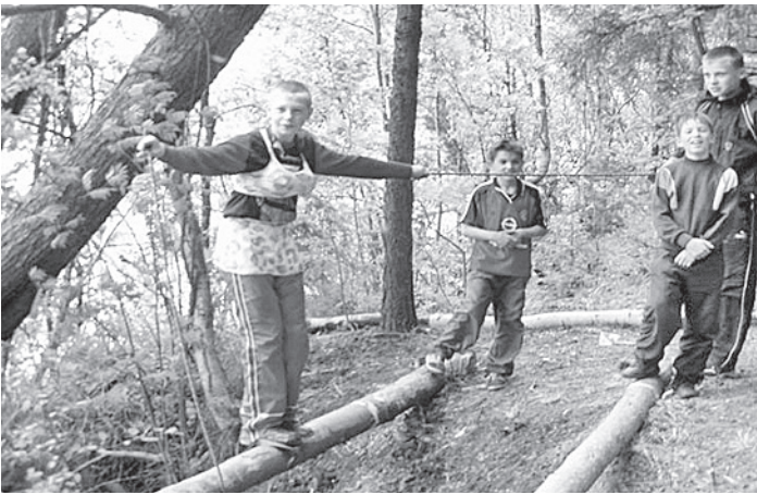
Чтобы преодолеть полосу препятствий, требуются и навыки, и смекалка.