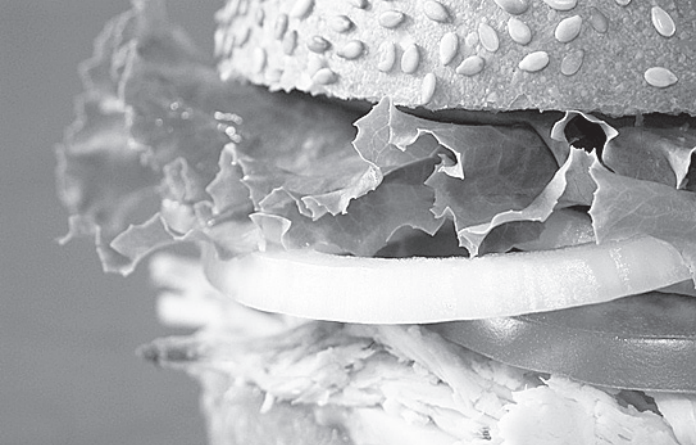
Гигантский бутерброд был съеден за 36 минут.

В настоящий момент на Гуаме обитают около двух миллионов коричневых бойг. Ожидается, что сброс пропитанных ядом мышей поможет значительно сократить популяцию этих рептилий.