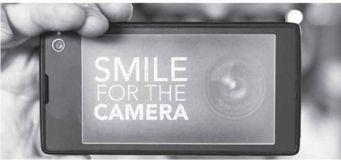
Первый российский смартфон уже подарили премьеру Дмитрию Медведеву.

Портал Superjob спросил россиян, рассчитывают ли они на получение новогодних премий и подарков от руководства своих предприятий и организаций. Большинство на щедрость не рассчитывает.