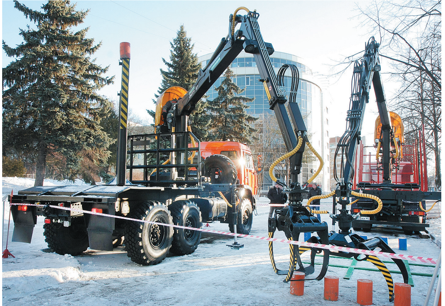
На выставке «Российский лес» по традиции были представлены самые современные образцы лесной техники.