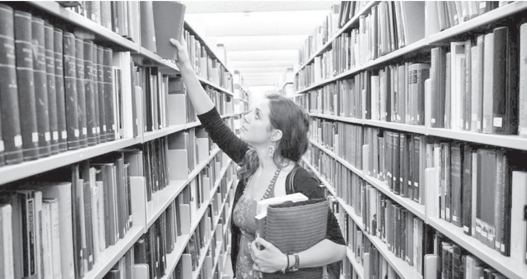
Сегодня библиотечная сеть Вологды насчитывает 21 филиал. В будущем предполагается довести их число до 40.