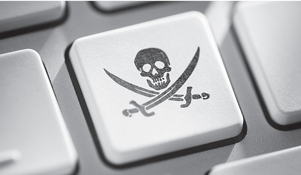
Скачать «пиратский» контент из Интернета с нового года станет заметно сложнее.

И до музыки доберутся Получается, что единственным контентом, который пока не попал под действие законопроекта, остается музыка.