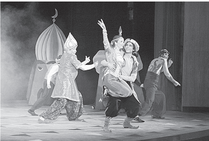
Спектакль «Волшебная лампа Аладдина» предназначен для семейного просмотра.

На занятия в школу правовой и коммунальной грамотности приглашаются все заинтересованные волонтеры. Полученные знания горожане смогут применить в работе со своим домом, двором или подъездом. Ведь конечная цель как сотрудников Центра по работе с населением, так и слушателей занятий - сделать жизнь в городе лучше и комфортнее.