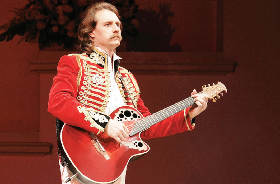
Имя Дмитрия Шведа хорошо известно почитателям романсов.

- Программа Никиты Мндоянца - это собрание шедевров мирового фортепианного репертуара, - сообщила нам пресс-секретарь Вологодской филармонии Ольга Сыч-Мишина. - Первое отделение посвящено одной из наиболее ярких страниц русской фортепианной классики - сюите Модеста Мусоргского «Картинки