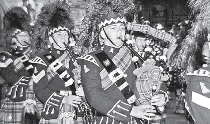
Независимостью от Лондона грезит почти половина населения страны.

Предыдущий рекорд длительности горения человека в спецкостюме без доступа кислорода был установлен в Калифорнии 27 марта 2011 года. Автором достижения стал Джейсон Думениго. Он продержался в горящем костюме пять минут и 25 секунд. Попытки преодолеть этот результат предпринимались неоднократно, но только Джо Тодлинг сумел обойти американца.