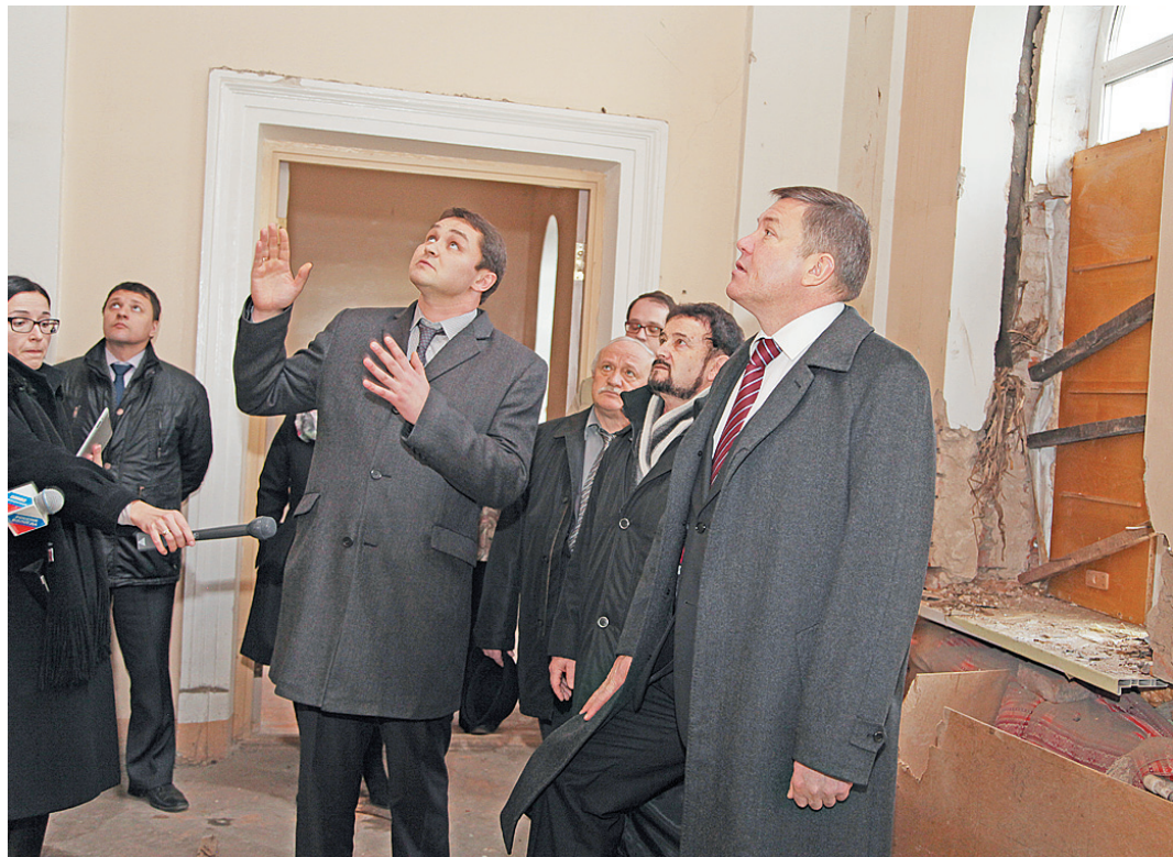
Губернатор осматривает состояние помещений общежития.