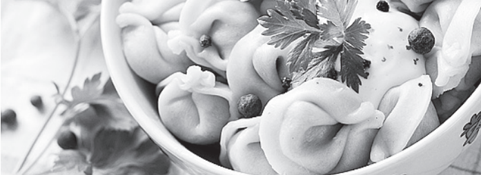
Одному из главных российских блюд посвящают целый фестиваль.

Это звание за собой решил застолбить Челябинск. Накануне в уральском городе открылась уникальная выставка «Вокруг пельменя».