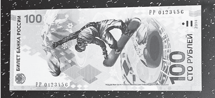
Так выглядит сторублевая «олимпийская» купюра.

Современный уютный и теплый ФАП не только повысит качество медицинского обслуживания в селе, но и заметно улучшит условия труда медработников.