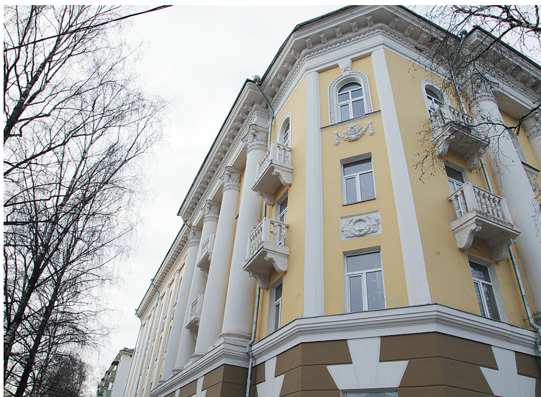
Общежитие областного музыкального колледжа.