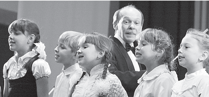
Юные исполнители впервые выступали на одной сцене с профессионалами.