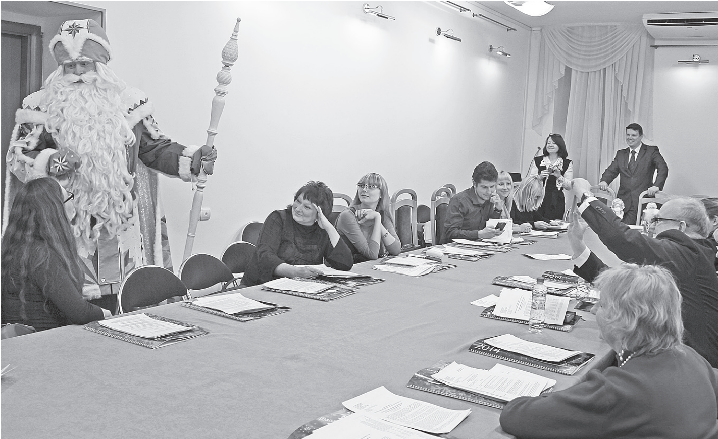
Дед Мороз заверил участников встречи в том, что Вологда будет радовать гостей настоящей праздничной атмосферой и красотой зимней природы.

В том, что на предстоящие праздники Вологда была выбрана «Новогодней столицей России», правительством области не видит случайности и считает это естественным для красивого старинного города, активного участника межрегионального туристического про-