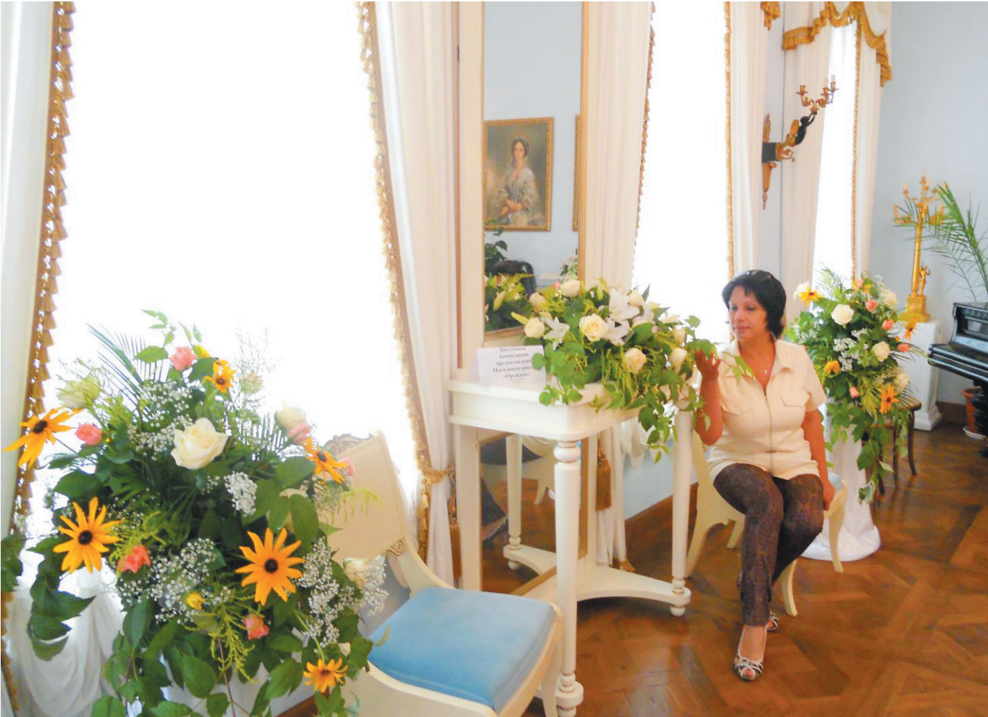
Экспозиция цветов в усадьбе Гальских Череповецкого музейного объединения.

Сотрудники Великоустюгского государственного историко-архитектурного и художественного музея-заповедника получат возможность потратить средства гранта от ОАО «Северсталь» на создание «Детской художественной галереи» - центра творческой самореализации для младших школьников. Воплощение проекта в жизнь даст возможность малышам и подросткам не только развивать творческие способности, но и презентовать горожанам и туристам собственные достижения. Череповецкому музейному объединению предстоит решать не менее сложную задачу. Их проект-победитель «Всего понемножку, или загад-