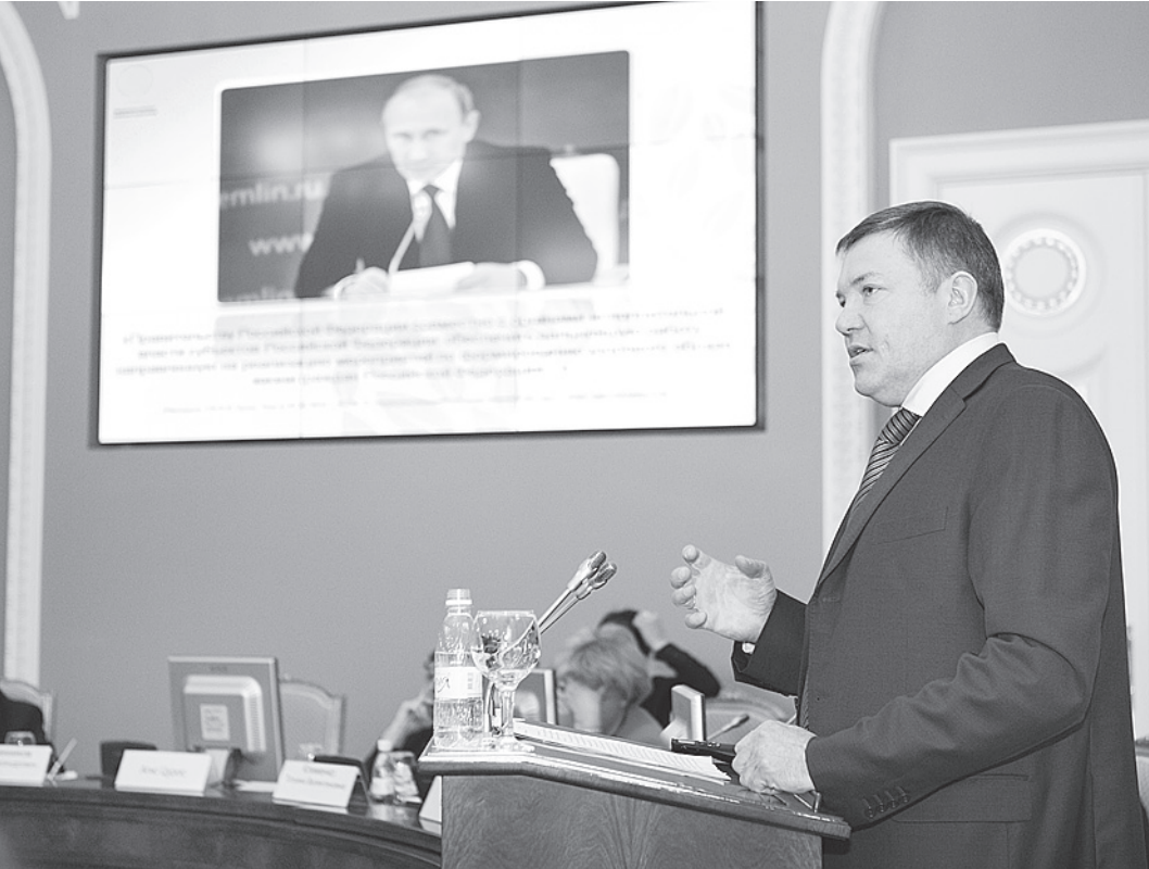
Олег Кувшинников подчеркнул, что лучшие наработки регионов будут представлены Президенту России на заседании Госсовета.

Также на форуме прошло общее собрание Ассоциации.