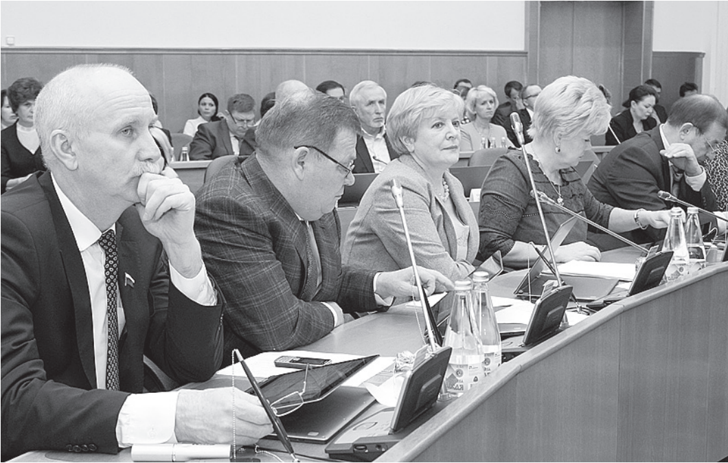
После оживленной дискуссии на сессии был принят ряд важных поправок в главный финансовый документ нынешнего года.

Областные финансисты прогнозируют и падение поступления налога на прибыль от естественных монополий. Платежи «Газпрома» за 10 месяцев нынешнего года сократились по сравнению с прошлогодними показателями в два раза и составили 400 миллионов рублей, РЖД - в три раза до 150 миллионов, «Транснефть» - в 2,5 раза до 45 миллионов рублей. Общее снижение пла-