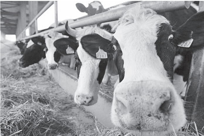
Новую ферму предприниматель смог открыть благодаря гранту областного правительства.

Артем ПОМЯЛОВ, по данным информационных агентств