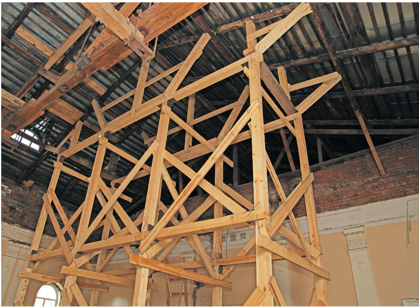
Подпорная стенка посередине зала на четвертом этаже здания не позволила обвалиться кровле.