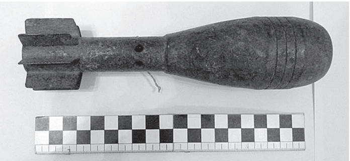
Взрывоопасные предметы были изъяты и уничтожены.