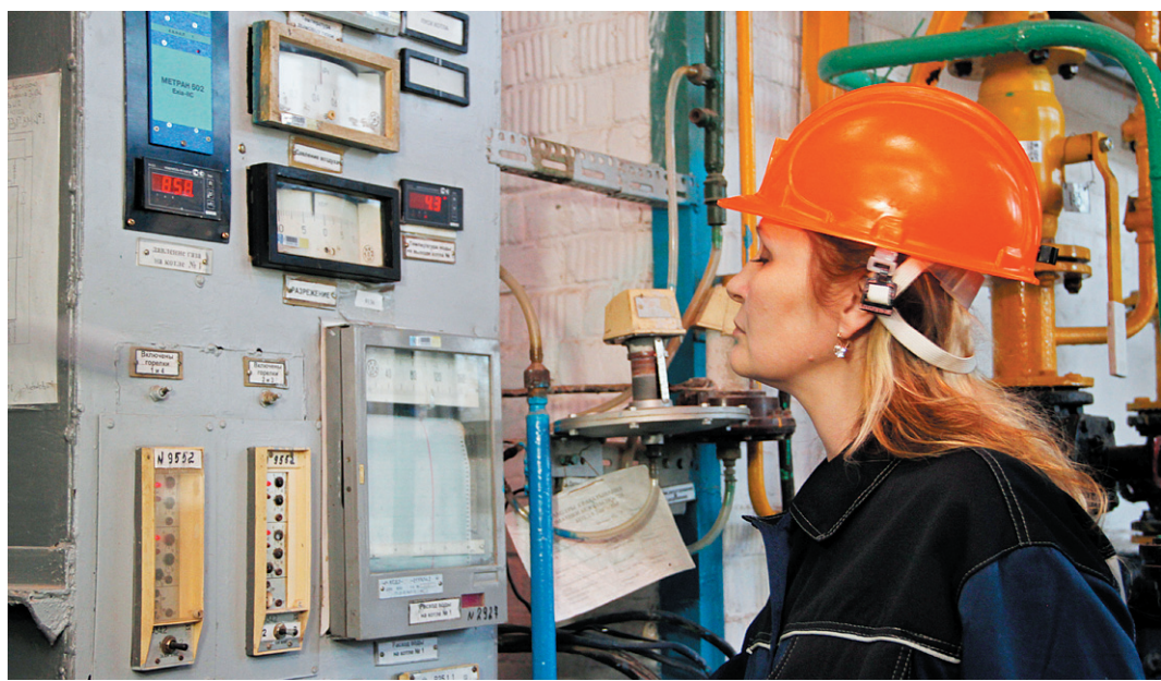
Котельные подготовлены к зиме вовремя.