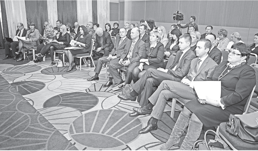
Количество членов Ассоциации «Здоровые города, районы, поселки» увеличивается с каждым годом.