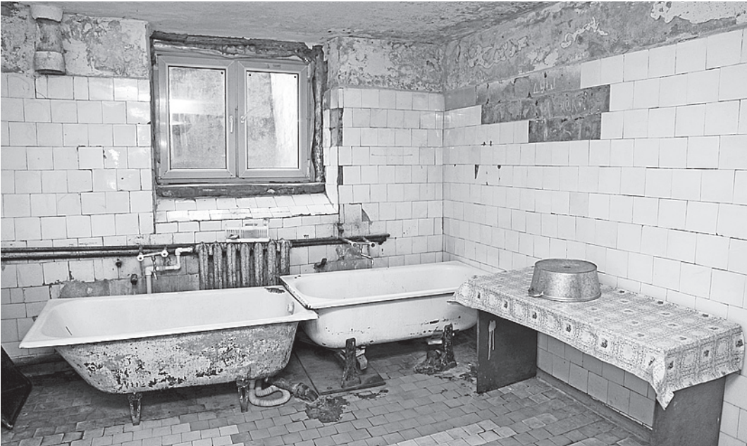
Санитарное состояние некоторых помещений оставляет желать лучшего.

Показали главе региона и находящиеся в удручающем состоянии душевные комнаты. В сыром и влажном подвале меньше десятка самых обычных «леек». Можно представить, какая очередь выстраивается в душевую по вечерам, если общежитие рассчитано на проживание 300 учащихся. Рядом с входом в подвал стоят резиновые сапоги. При сильных ливнях подвал затопливает, так