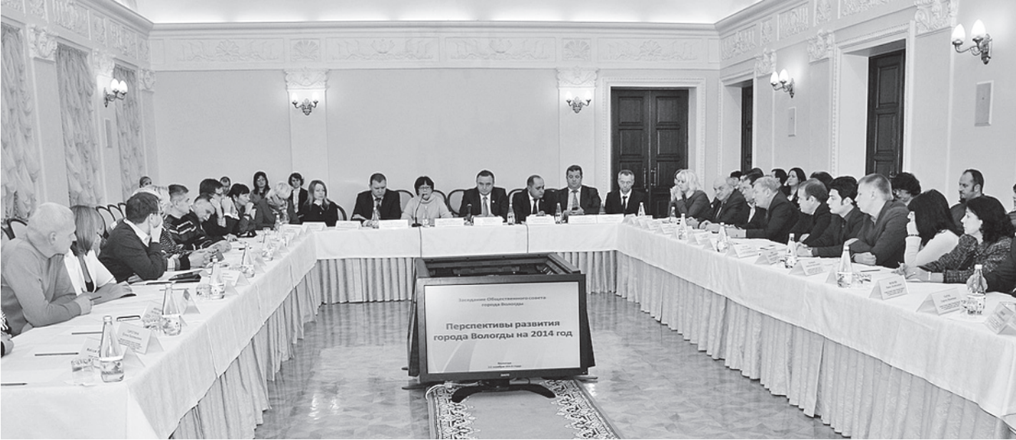
Заседание Общественного совета Вологды.

ных центров на профилактическую деятельность, на вовлечение граждан в создание вокруг себя здорового пространства. Кроме того, важно изменить менталитет людей. Россияне должны понять, что здоровый образ жизни - путь, которым они должны следовать. Такому заданию Ассоциация «Здоровые города, районы и поселки» перед собой и ставит, - подчеркнул Олег Кувшинников. КС