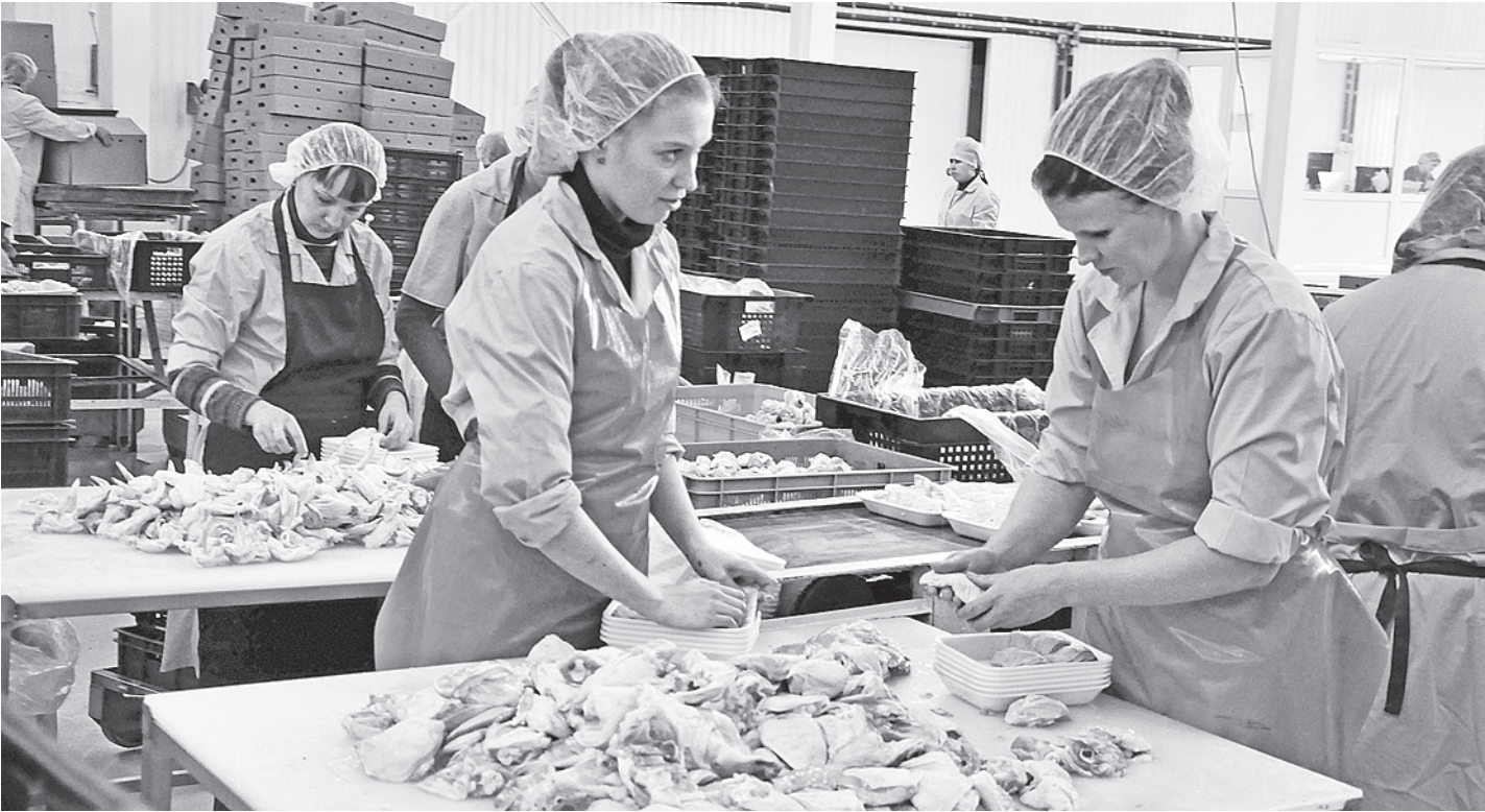
На птицефабрике рассчитывают к концу года выйти на полную мощность и производить ежемесячно 800 тысяч цыплят-бройлеров.

Созданная в 2007 году госкорпорация финансирует капремонт и строительство нового жилья на долевой основе с субъектами РФ. В настоящее время в ее программах участвуют 82 региона страны.