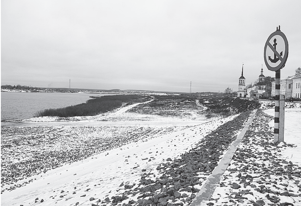
Укрепление берега Сухоны - залог безопасности Великого Устюга в период паводка.