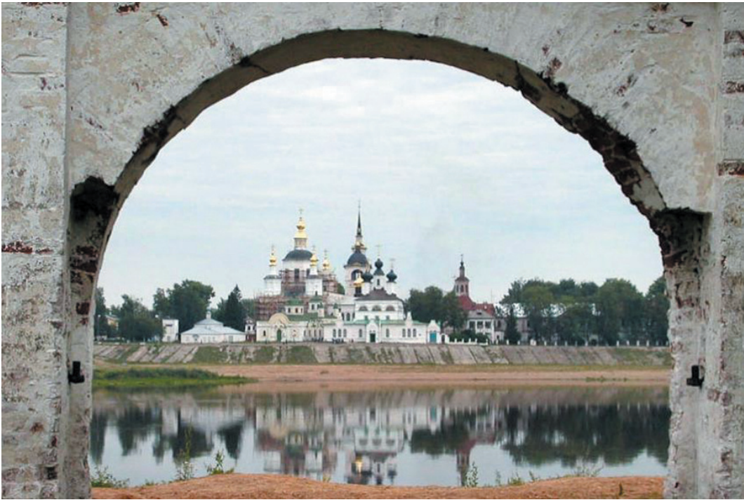
Соборное Дворище Великого Устюга - одна из главных достопримечательностей древнего города.