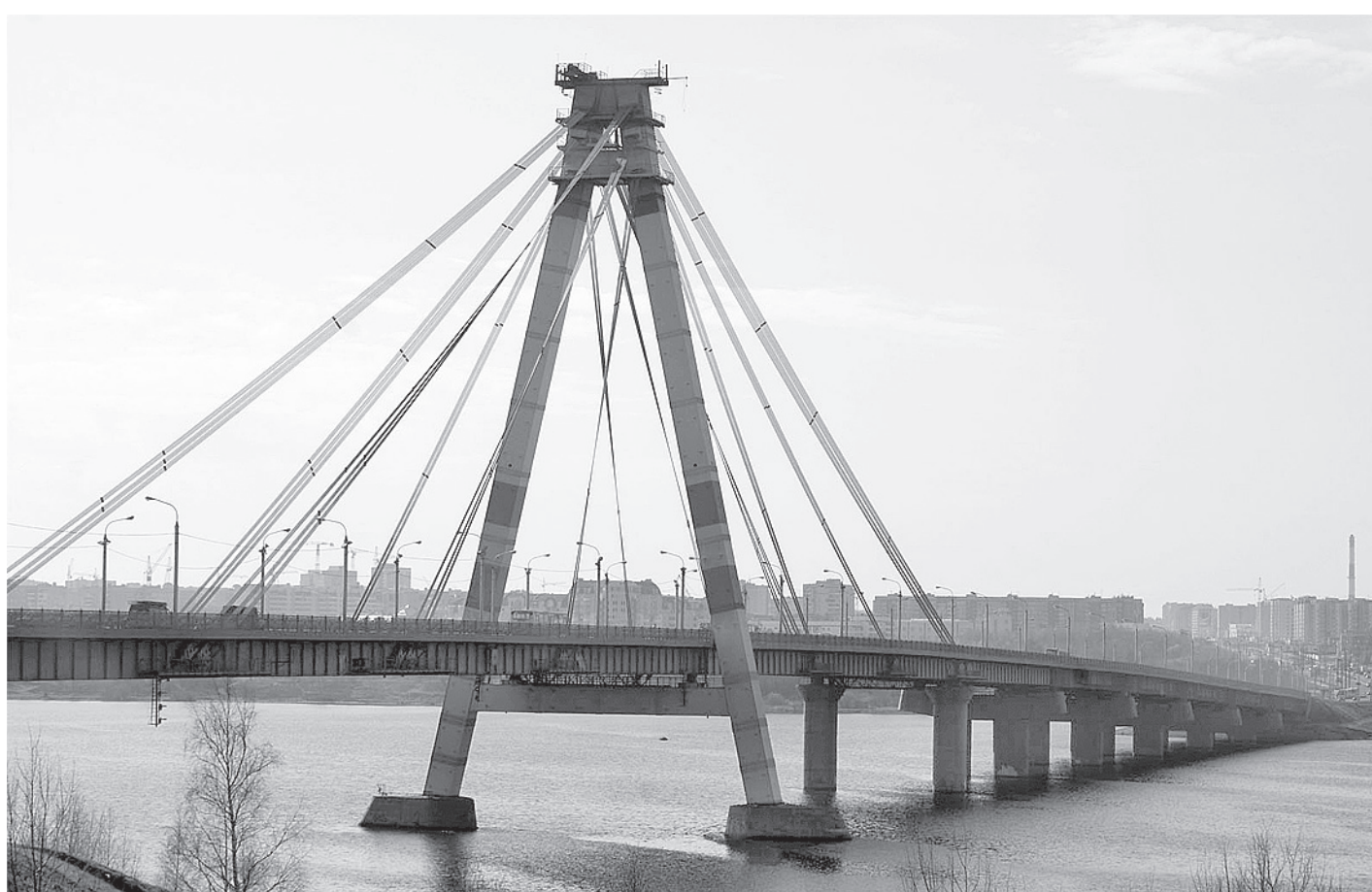
Череповец стал эффективным муниципальным образованием Вологодской области.

даря реализации программы «Поддержка и развитие малого и среднего предпринимательства в Вологодской области на 2013 - 2016 годы».