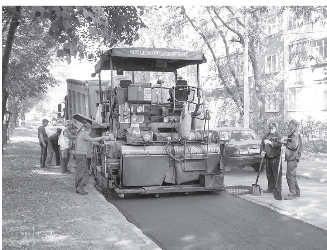
В Череповце почти 100% дорог соответствуют установленным требованиям. Хотя многие череповчане, возможно, с этим и поспорят.

Вологда по уровню среднемесячного дохода (26,3 тысячи рублей) оказалась на третьем месте по этому показателю. Недалеко от областного центра ушел Бабаевский район, где за счет тех же га-