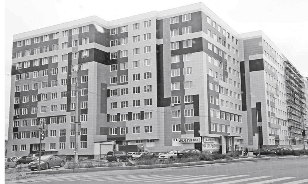
Вологда среди городов занимает лидирующие позиции по темпам жилищного строительства.

Хотел бы, чтобы вы внимательно ознакомились с докладом, посмотрели, какие есть точки приложения ваших усилий, с тем чтобы скорректировать эти показатели в сторону улучшения. От муниципальных органов власти в конечном итоге зависит рейтинговая оценка всей Вологодской области, - обратился Олег Кувшинников к главам муниципальных образований Вологодчины. кс