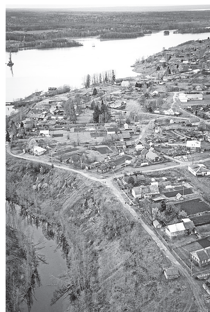
Вытегорский район, по итогам комплексной оценки, занял последнее место.

В среднем по области в 2012 году удовлетворены деятельностью органов местного самоуправления 54,8% жителей. Причем по этому пока-