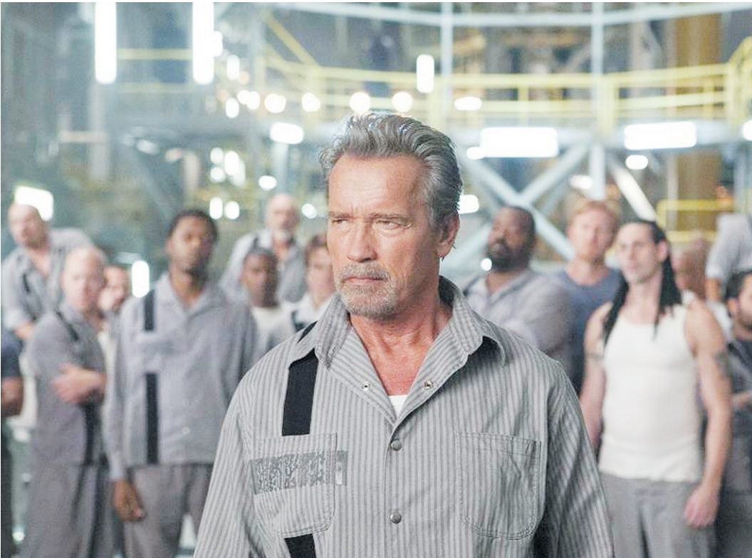
Борцам за справедливость лента придется по вкусу.

Поняв, что зрителя, закормленного всяческими компьютерными боевиками и героическими экшнами, гложет ностальгия по старому доброму кинематографу 90-х, в Голливуде воскресили звезд ушедшей эпохи. Пробным камнем стал проект «Неудержимые» о ветеранах спецподразделений, спасающих мир от ветеранов наркомафии и международного террористического подполья. «Камень» оказался кассово успешным, и теперь ленты с Ван Даммом, Дольфом Лундгреном или Джетом Ли, которые прочно ассоциируются у зрителей по всему миру с боевиками докомпьютерной эры, выходят в прокат в небывалом количестве. Разумеется, застрельщиками в этом деле являются не просто крепкие парни со стальными подбородками, которые приходили в