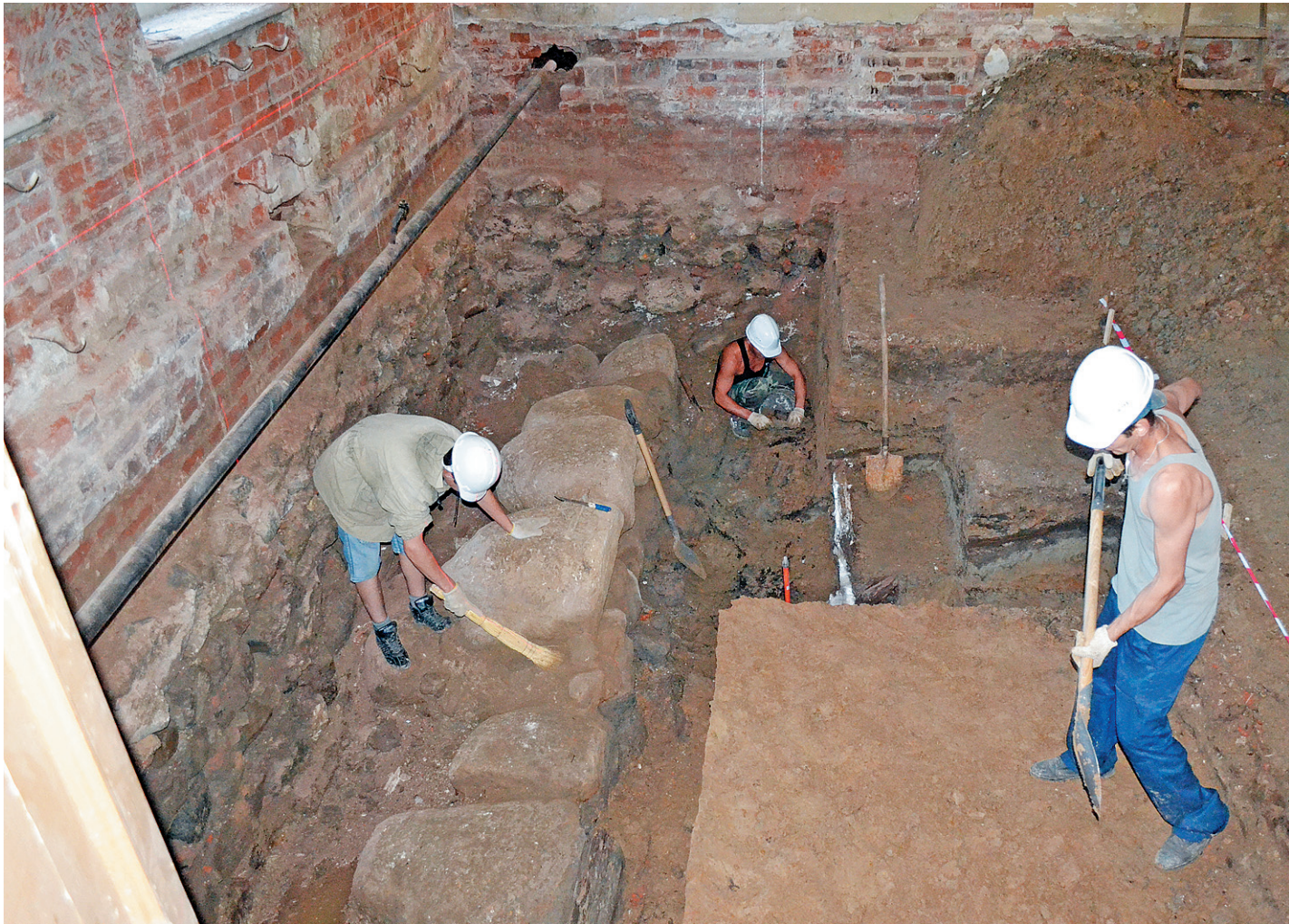
Идет расчистка фундамента Глухой башни.

Совместив собранные данные с местом расположения фундамента здания на улице