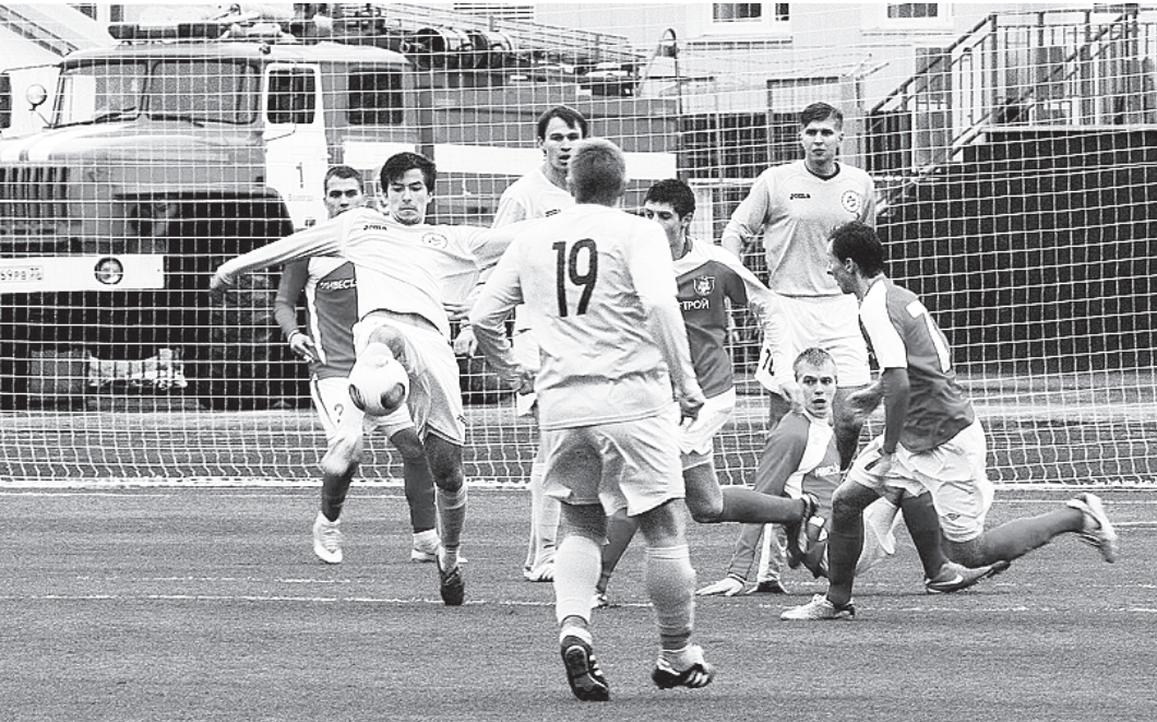
5 октября ФК «Вологда» и «Знамя труда» так и не выяснили, кто из них сильнее, - матч завершился вничью - 1:1.