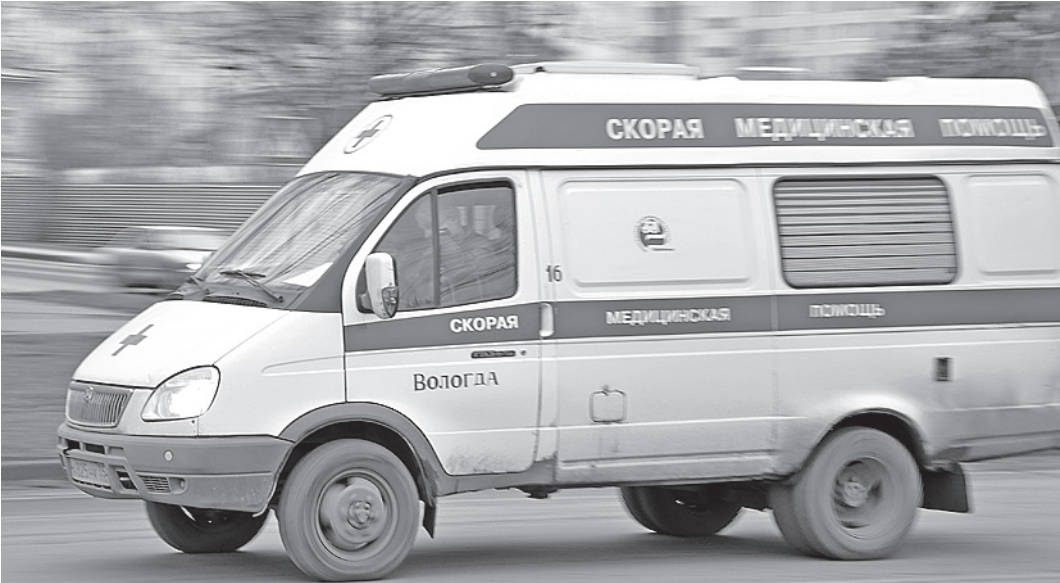
На первом этапе планируется обновить 12 автомобилей для Вологды и 8 - для Череповца.

На первом этапе планируется обновить 12 автомобилей для Вологды и 8 - для Череповца, а в дальнейшем - полностью перейти на аутсорсинг транспортных услуг. По словам Олега Кувшинникова, на то, чтобы обновить парк машин «скорой помощи» в масштабах области в рамках данного проекта, понадобится примерно пять лет.