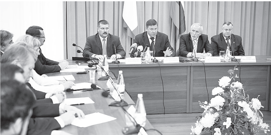
На заседании Общественного совета Вологодской области обсудили новые инициативы, которые позволят населению участвовать в управлении регионом.

- Я буду делать все возможное, чтобы наше сотрудничество было эффективным, чтобы общественные организации, которые стоят за Общественной палатой Вологодской области, видели и понимали эффективность и важность ее работы для становления и развития гражданского общества, для