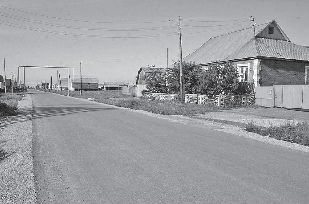
Приход крупных инвесторов на новые территории способен улучшить положение в глубинке. Особенно речь идет о транспортной инфраструктуре, новых дорогах.

Например, в Калужской области с нуля был построен автомобильностроительный кластер. И сейчас на территории региона действует уже более 30 автомобильных и смежных производств. Но наличие таких примеров скорее подтверждает правило: необходимо раз-