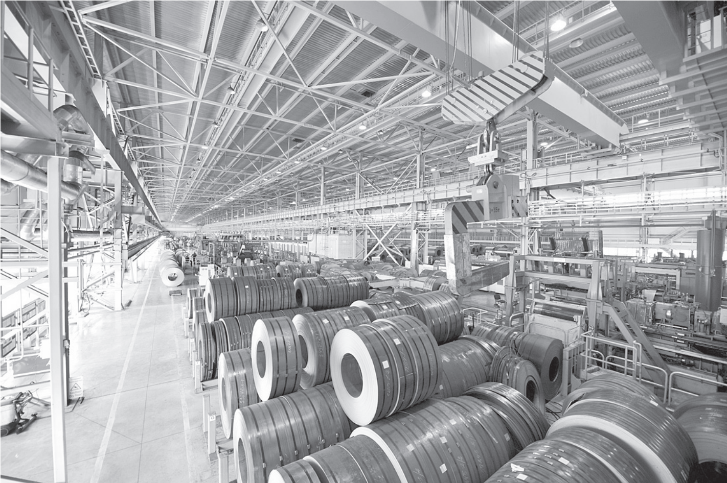
В нашей области развиваются индустриальные парки в Шексне и Соколе.

Сейчас в России 80 индустриальных парков, отвечающих всем требованиям. Это касается и качественного управления, и транспортной состав-