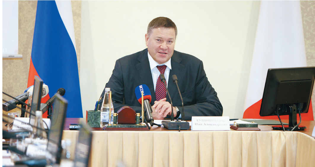
Олег Кувшинников рассказал главам районов, как с начала следующего года будут выстраиваться межбюджетные отношения.

В первую очередь речь идет об изменении подходов к выравниванию бюджетной обеспеченности муниципальных образований. При определении бюджетных расходов в основу расчетов лягут не нормативы расходных потребностей, а коэффициенты разли-