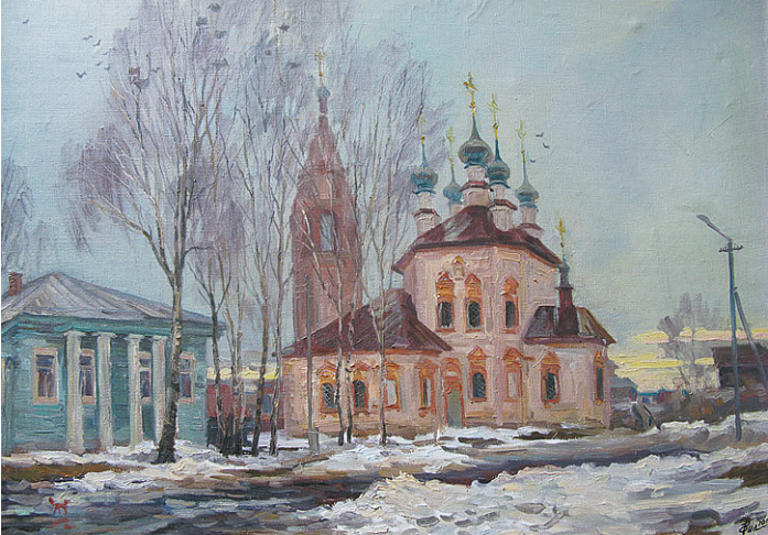
Вера Филиппова. «Дыхание весны. Устюжна. Благовещенская церковь».

городского литературного объединения, член Ассоциации искусствоведов России (АИС).