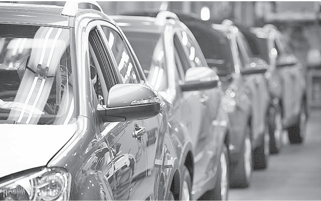
Продажи на авторынке падают. Серьезного падения удалось избежать благодаря программе льготного кредитования.

Так, в городах-миллионниках (а затем и повсеместно) в ближайшие пять-семь лет могут быть приняты нормы въезда в центральные районы. Ведь согласно исследованиям экологов, 60% загрязнения в больших городах приходится именно на автозагазованность. Предполагается, что въехать в центр Москвы или Екатеринбурга смогут лишь экологически «приличные» авто, то есть машины высоких экологических классов. Каким образом