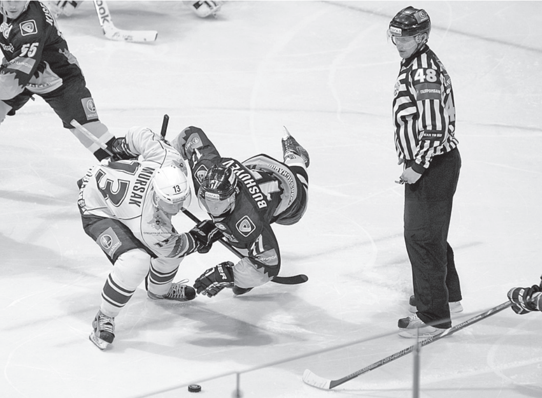
Накал борьбы в третьем периоде был особенно высок - решалась судьба всей встречи.

- Вышли на матч после 13 игры с 13 очками на 13 месте, - прокомментировал встречу главный тренер череповчан Игорь Петров. - Собрали все эти «13» в кучу, так что отступать было некуда. Начали неплохо, забили два гола, затем два-