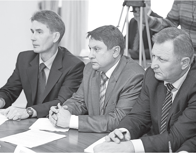
В новой модели построения межбюджетных отношений учтены и пожелания глав муниципальных районов.