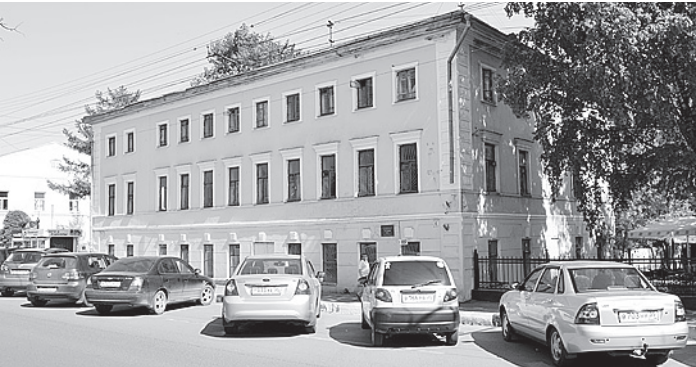
Внутри памятника архитектуры девятнадцатого века по улице Мира, 15 находится памятник шестнадцатого века.