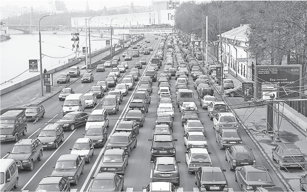
Экологическое давление на крупные города будет расти. Поэтому в России может появиться экологический налог.

Однако, если за эти семь-восемь месяцев не предпримут автопрому ничего нового, то уже с лета 2014-го падение продаж и спроса на машины может раскошегариться с новой силой. - Вряд ли покупательская