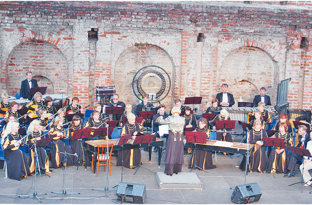
Губернаторскому оркестру народных инструментов исполняется 20 лет.