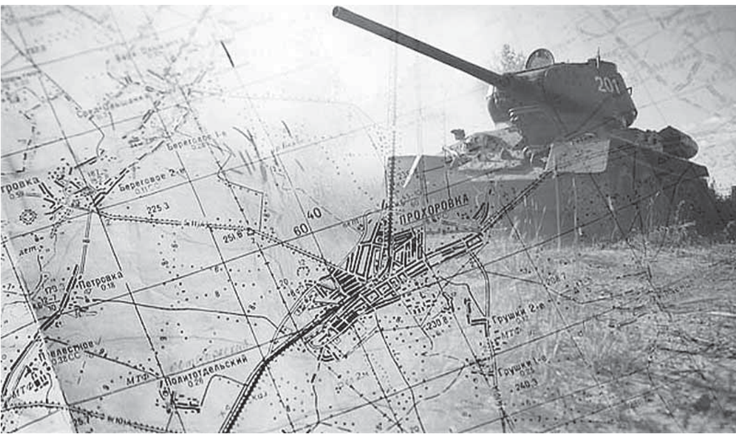
Курская битва стала одним из важнейших сражений Второй мировой.

19 августа в Вологодской областной библиотеке на улице Марии Ульяновой, 1 откроется выставка «Огненная дуга: семьдесят лет Победы».