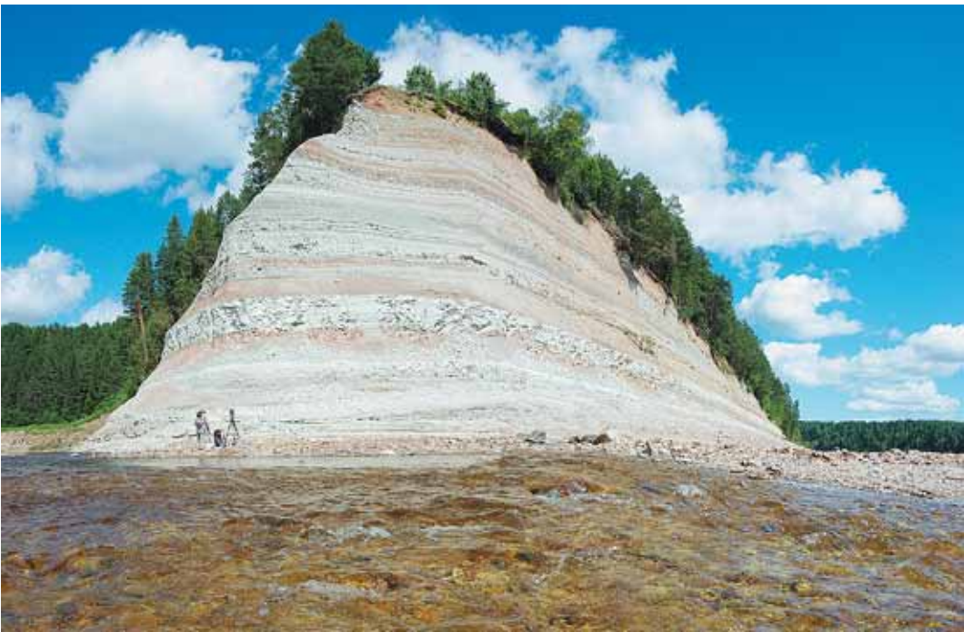
Памятник природы - Мыс Бык.

норамы и составляются галереи фотоснимков, обобщается научная информация. Создаваемая виртуальная экскурсия способна заинтересовать многих. Надеюсь, что благодаря инициативе местных предпринимателей и ярким популяризаторским проектам сельский туризм может уже в недалеком будущем стать одной из прочных опор экономики Вологодской области, - подчеркнул директор Вологодского музея-заповедника Александр Суворов. Да, Вологодская область богата красивыми местами, буквально в каждом районе есть своя «изюминка», то особенное, что заинтересует туристов. И думается, что виртуальные экскурсии побудят наших земляков и гостей города отправиться в настоящее путешествие с рюкзаком за плечами. кс