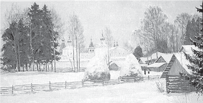
«Первый снег. Феропонтово».