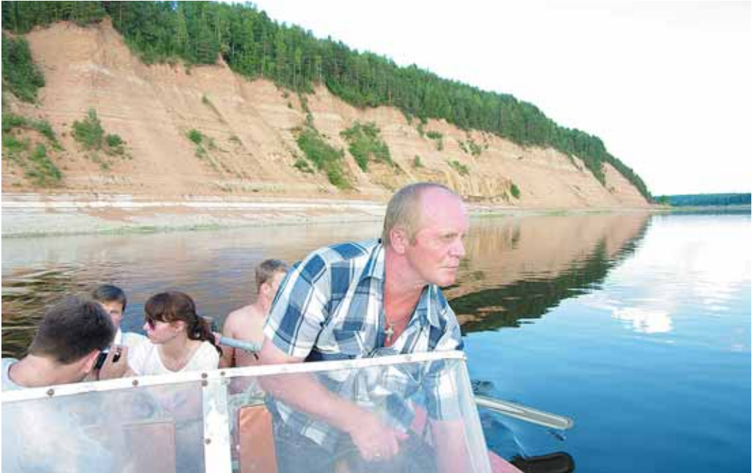
До уникальных памятников природы иногда можно добраться только на катере.