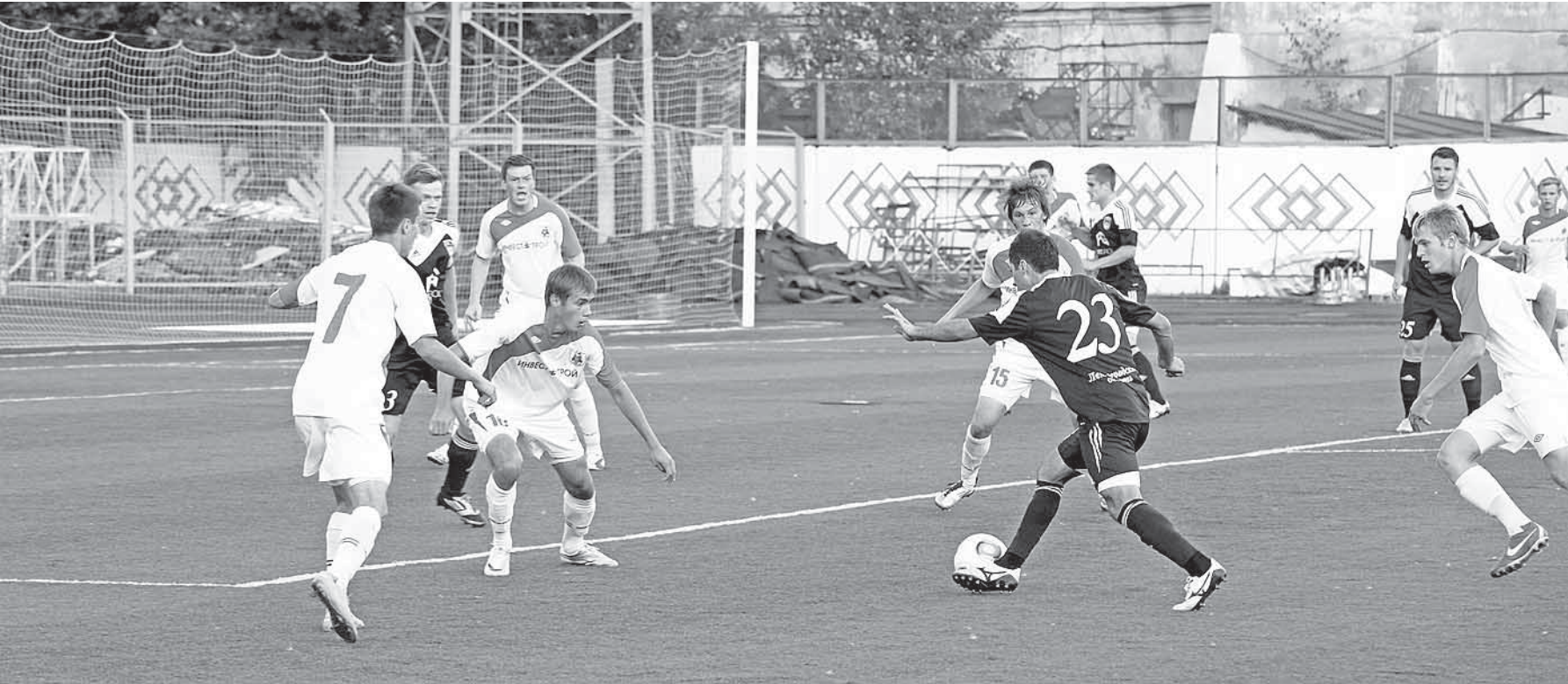
И снова опасный момент у ворот «Динамо».

Так оно и получилось. С первых минут тосненцы овладели инициативой, и нашему врата-