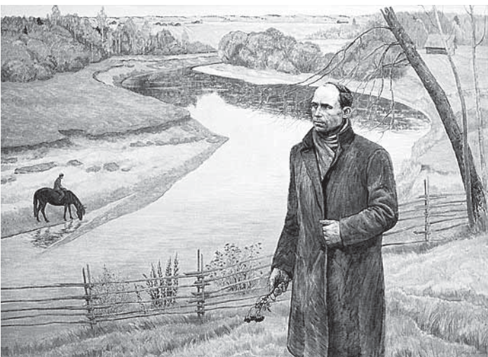
«В минуты музыки. Поэт».

В Белозерском областном краеведческом музее начала работу персональная выставка известного вологодского художника Евгения Соколова.