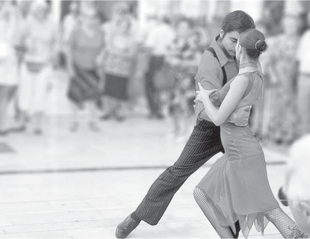
Испанские и итальянские курорты демпингуют в борьбе за клиента.