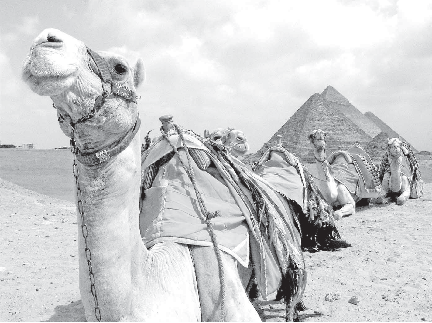
Беспорядки в Египте могут привести к «туристической распродаже».

Детонатором резкого снижения цен стала кризисная Греция.