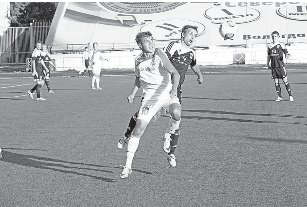
Борьба за мяч на «верхних этажах» была напряженной.

Вчера ФК «Вологда» принимал «Псков-747». КС