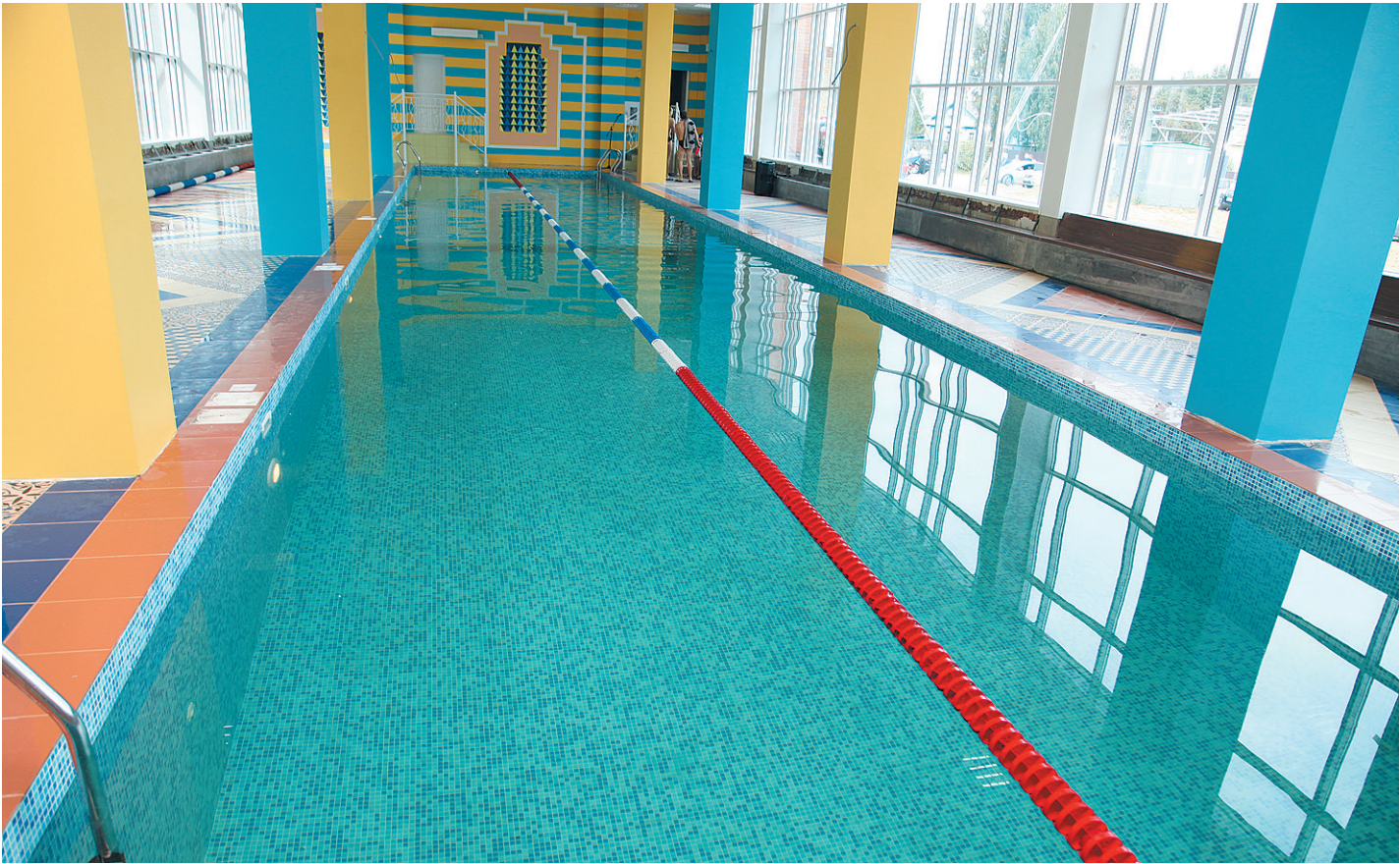
В строительстве бассейна использованы современные материалы и технологии.

вители спортивных организаций. - Уважаемые друзья, я хотел бы особо подчеркнуть, что сегодня мы присутствуем на уникальном событии, - сказал Андрей Травников, обращаясь к участникам церемонии. - В последнее время очень много говорится о необходимости комплексного подхода к разви-