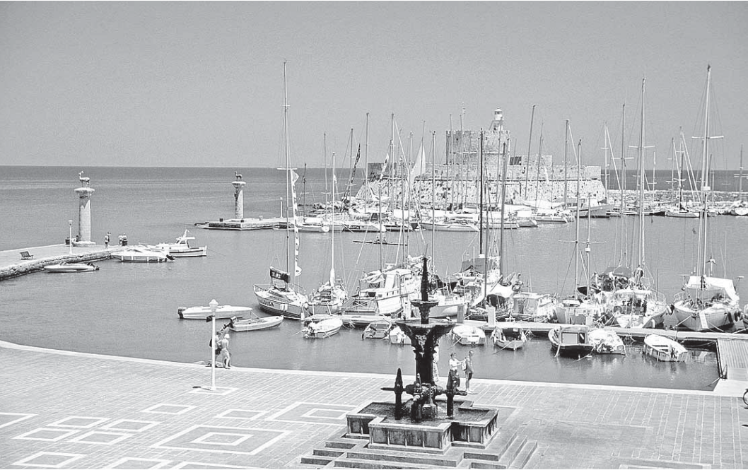
Поездка в Грецию сейчас выгодна, как никогда.

Еще в конце прошлой недели из Египта в срочном порядке начали эвакуировать французских, британских и немецких туристов. Об «отзыве» своих, правда, немногочисленных отпускников в Стране пирамид задумались Соединенные Штаты Америки и Канада. Нашим же туристам было рекомендовано не выходить за территорию отелей для безопасности.