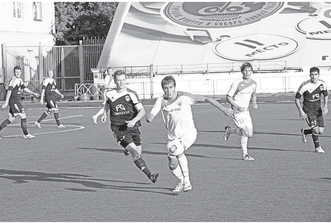
Во втором тайме вологжане стали чаще атаковать.