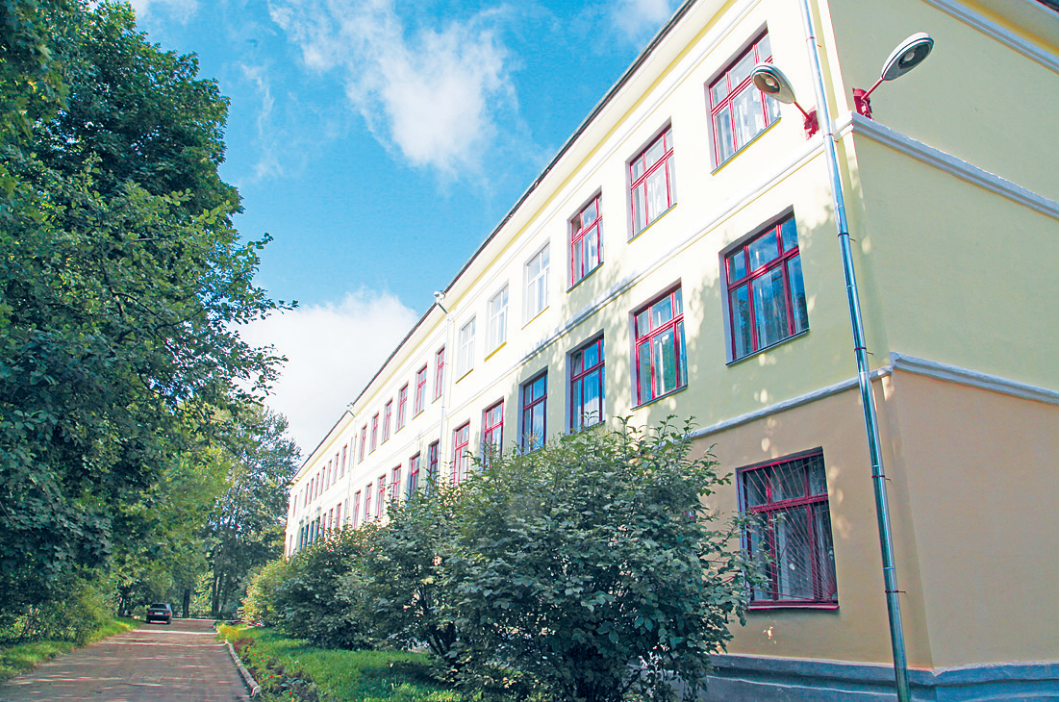
Завершить работу по приемке образовательных учреждений к новому учебному году планируется к 20 августа.

ли ситуация стала заметно лучше. Так, на сегодняшний день завершили приемку образовательных учреждений уже семь районов Вологодчины: Вашкинский, Вологодский, Грязовецкий, Междуреченский, Тарногский, Усть-Кубинский и Шекснинский. В связи с замечаниями органов Роспотребнадзора и Госпотребнадзора перенесены сроки приемки 26 образовательных учреждений в Бабушкинском, Белозерском, Верховажском, Вытегорском, Кичменгско-Городецком, Никольском, Тотемском, Чагодощенском, Череповецком районах, а также в Вологде и Череповце. В общей сложности к началу нового учебного года необходимо принять 1100 образо-