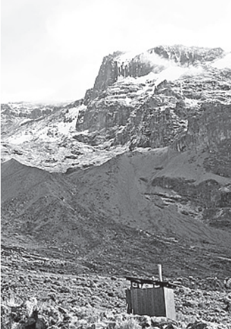
Килиманджаро расположена на высоте 5895 метров над уровнем моря.