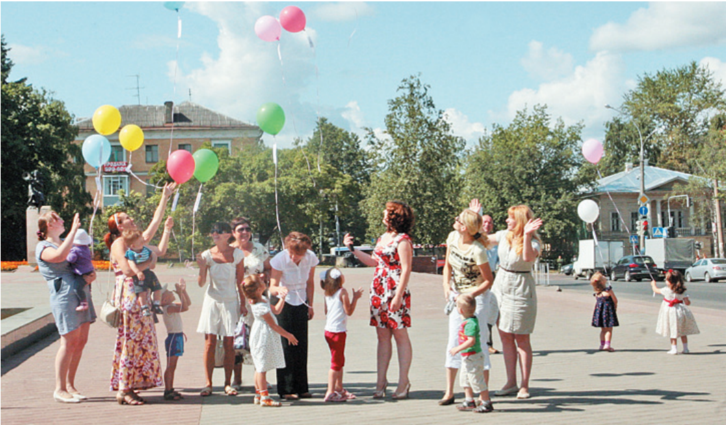
К шарикам были привязаны записки с названием акции и именами детей - как символ того, что однажды всем этим малышам мамы подарили жизнь.