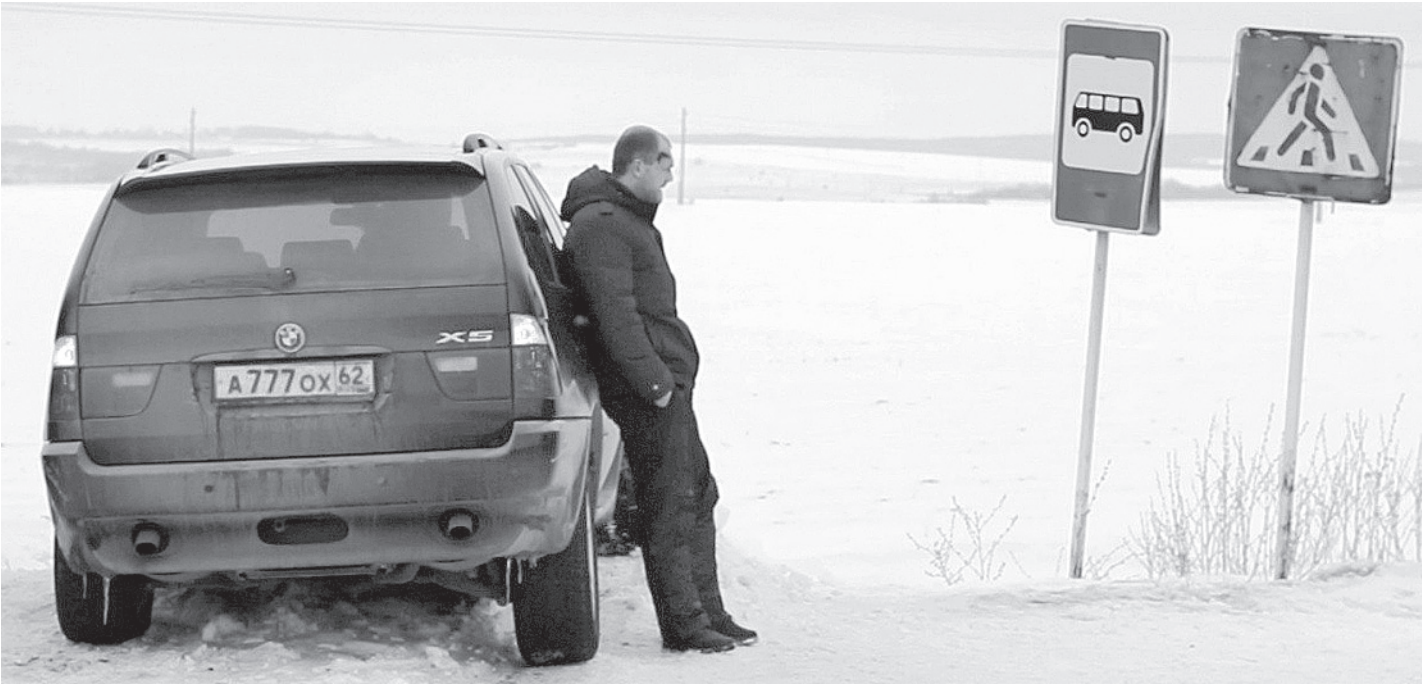
Лента «Майор» получила главный приз и на крупном фестивале в Шанхае.