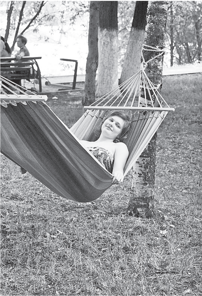
На пикнике VOICES можно было слушать лекции, лежа в удобных гамаках.