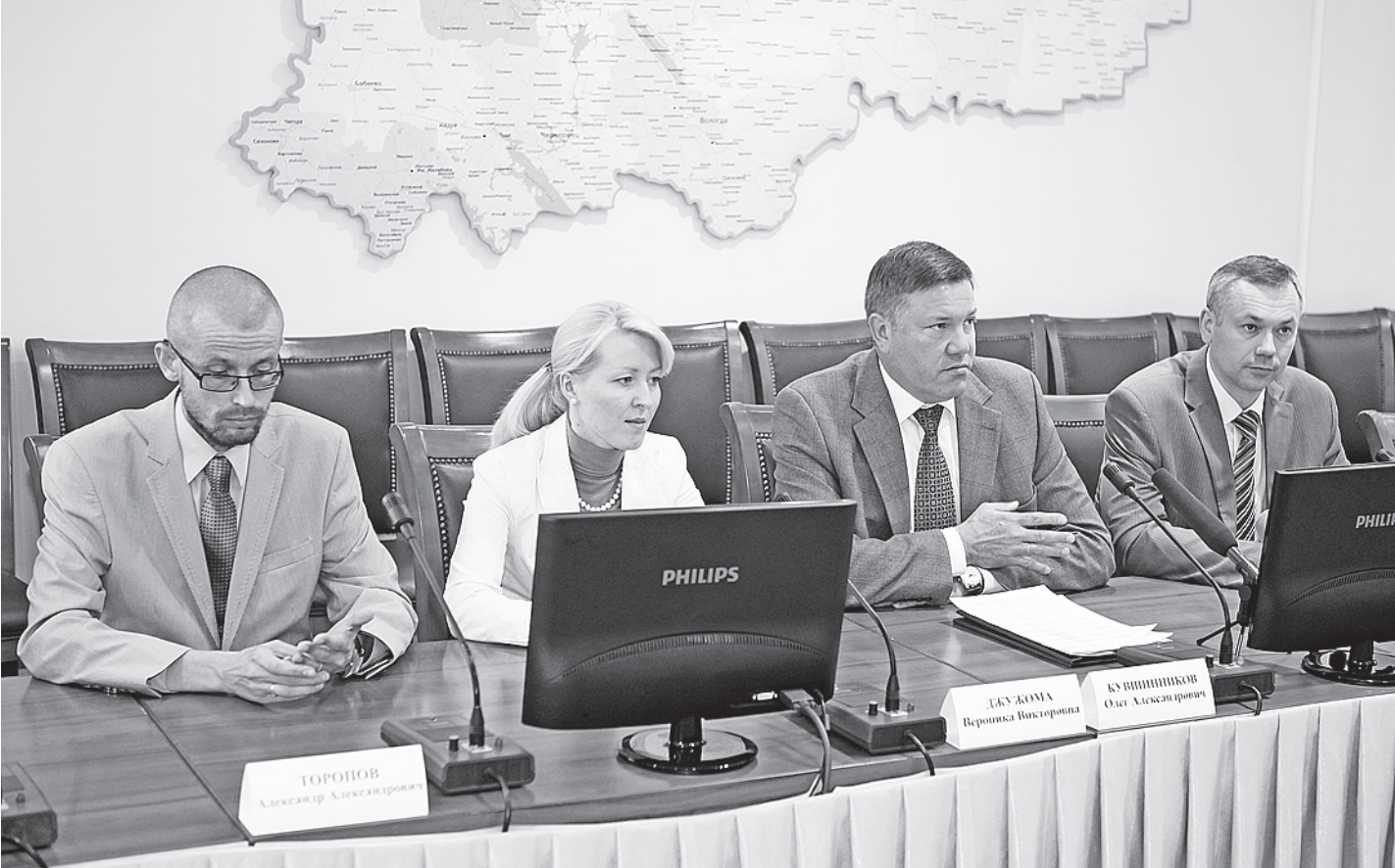
Представители власти и эксперты считают, что новый закон о федеральной контрактной системе позволит проводить государственные и муниципальные закупки гласно и открыто.

12 с лишним миллиардов рублей составляет общий объем государственных и муниципальных закупок в Вологодской области.