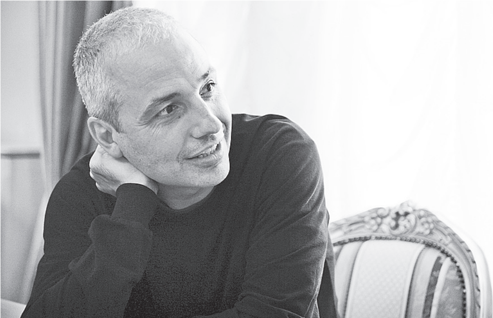
Пабло Бергер мечтает еще когда-нибудь побывать в Вологде.

Любой фестиваль для режиссера самое настоящее приключение. С фильмом «Белоснежка» за год я объездил многие фестивали. До Вологды был, например, в Мюнхене. И могу с уверенностью сказать, что на VOICES была самая сильная конкурсная программа, которую я на фестивалях за это время видел. Пабло Бергер, испанский режиссер