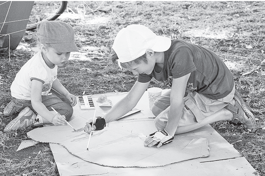
Самые маленькие киноманы смогли на пикнике найти занятие по душе - рисовали все, что им нравится.