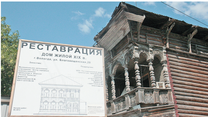
Специалисты называют этот дом одним из наиболее интересных памятников деревянного зодчества в Вологде.

Начальник управления историко-культурного наследия департамента культуры и