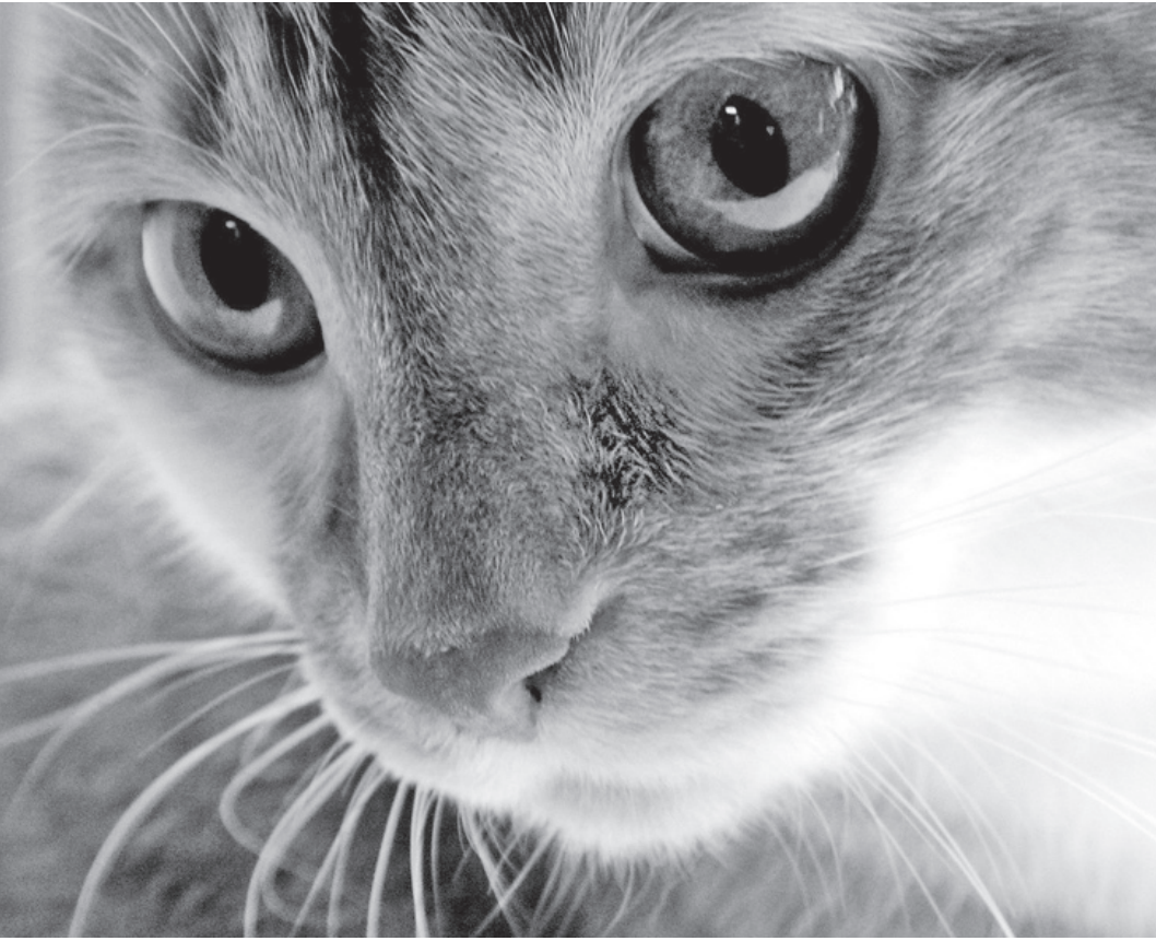
Пуля прошла через тело животного и застряла в лапке.