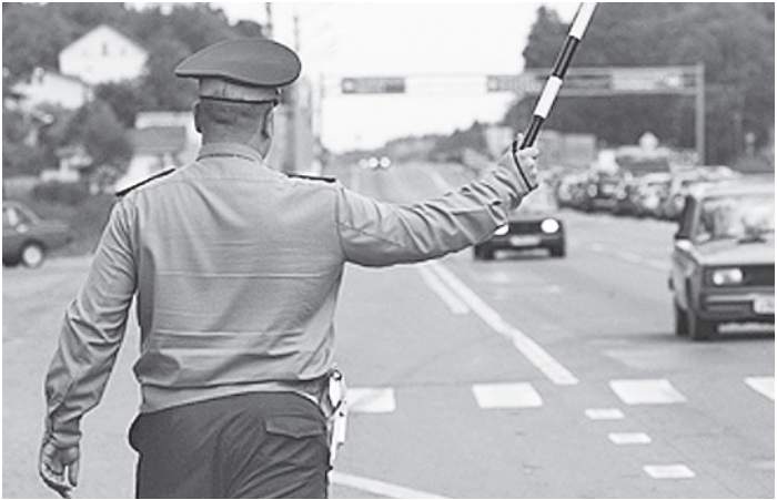
Ударившая инспектора женщина может оказаться за решеткой.

Как оказалось, убежать мужчина хотел напроста. По внешним признакам сразу было понятно, что он пьян. Кроме того, управлял молодой человек машиной, не имея водительских