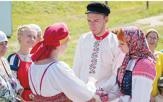
Свадебная церемония получилась веселой и богатой на сюрпризы.