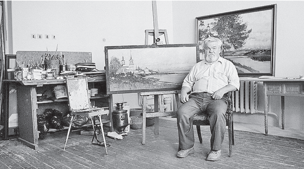
Валерий Страхов удостоен почетного звания «Народный художник Российской Федерации» за большие заслуги в области изобразительного искусства.

Указом Президента России Владимира Путина за большие заслуги в области изобразительного искусства почетного звания «Народный художник Российской Федерации» удостоен художник Валерий Страхов, член Вологодского регионального отделения Всероссийской организации «Союз художников России». Валерий Николаевич - признанный в России мастер русского национального ландшафтного и архитектурного пейзажа, продолжатель традиций московской реалистической пейзажной школы XIX - XX веков. Он родился 25 февраля 1950 года в Череповце. Валерий Страхов прошел серьезную трудовую жизненную школу. До и после армии он работал в Череповце, на металлургическом и сталепрокатном заводах. Первые уроки изобразительного искусства получил в студии при художественном отделе Череповецкого краевого музея. С 1972 по 1976 год учился в Ярославском художественном училище, а затем в Москве, в Художественном институте им. В. И. Сурикова. Позднее художник говорил, что относит себя к московской школе живописи, для которой характерно особое чувство историзма. В 1983 году Валерий Страхов окончательно переехал в Вологду. В 2002 году ему присвоено звание заслуженного художника России, а еще раньше, в 2001-м, он был избран членом-корреспондентом Академии художеств России. Награжден дипломом Российской академии художеств за вклад в развитие отечественного искусства. В 2003 году Страхов был выдвинут на Государственную премию Российской Федерации.