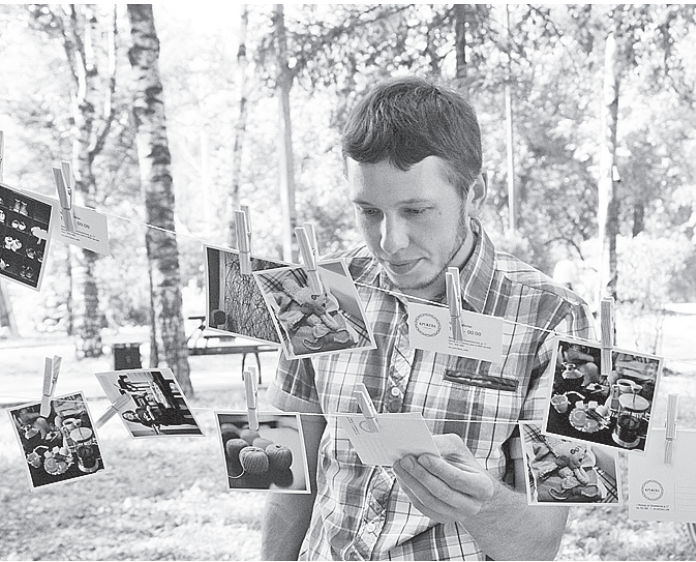
На всех площадках фестиваля можно было заметить множество фотографий-любителей.