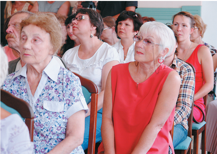
В зале собрались многочисленные поклонники творчества Александра Яшина.