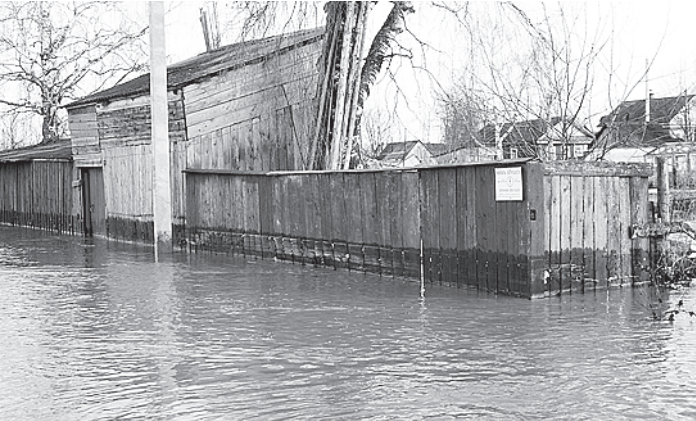
Больше всего пострадали Великий Устюг (на фото) и Красавино.

Более 72 миллионов рублей составил ущерб от паводка в Великоустюгском районе. Напомним, в конце апреля в зоне подтопления рек Сухоны, Юга и Малой Северной Двины оказались 13 городских и сельских поселений. Больше всего пострадал районный центр (ущерб - 23,7 миллиона рублей), а также город Красавино (19,8 миллиона).