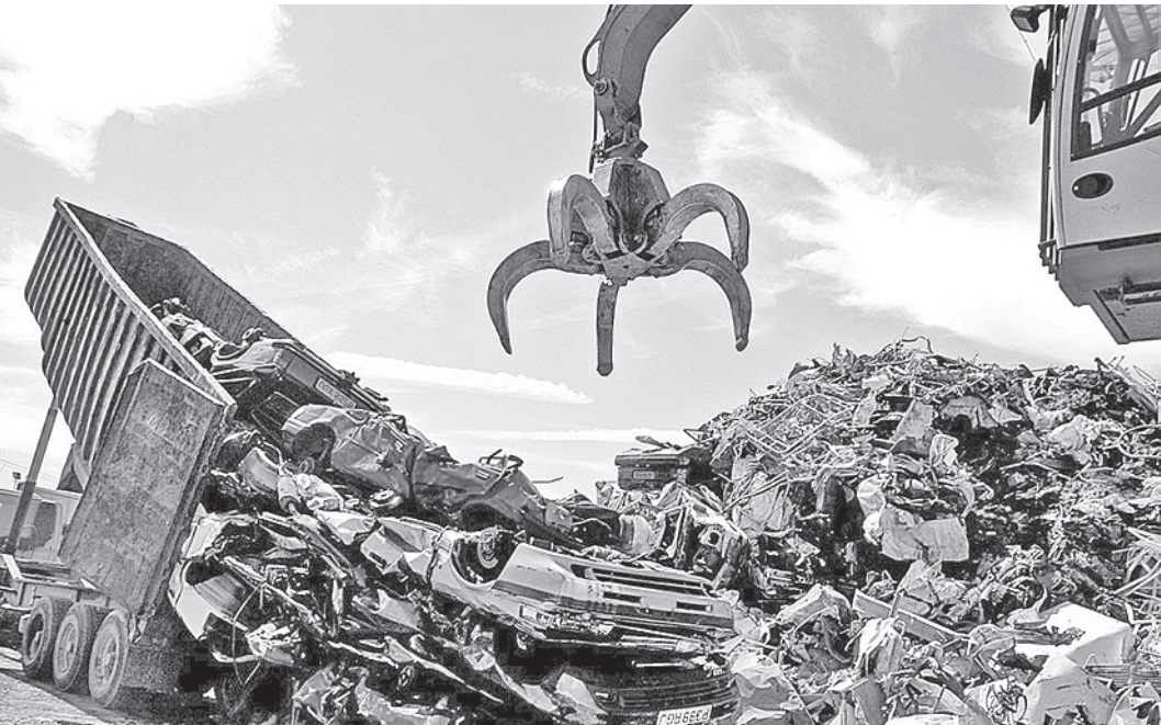
В скором времени отечественные автопроизводители могут обязать платить утилизационный сбор наравне с их зарубежными коллегами.

В пояснительной записке говорится, что с помощью поправок Россия исполнит свои обязательства члена ВТО по созданию равных условий для отечественных производителей и импортеров». Утилизационный сбор был введен после официального присоеди-