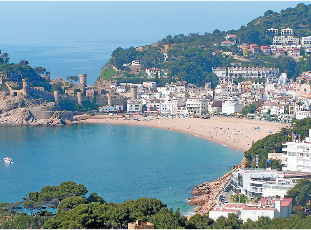
В южные страны лучше ехать в начале осени: и дешевле, и не так жарко.

Если вы собираетесь много ездить по городу, то лучше всего купить специальный туристический проездной. Он предполагает скидки на поездки практически всеми видами транспорта: от 3 до 7%. Разумеется, не во всех городах такая программа существует, но в Лиссабоне, Мадриде или Мельбурне подобные скидки вполне реальны. Так что прежде чем ехать за границу, узнайте, как можно сэкономить на городском транспорте в выбранной вами стране.