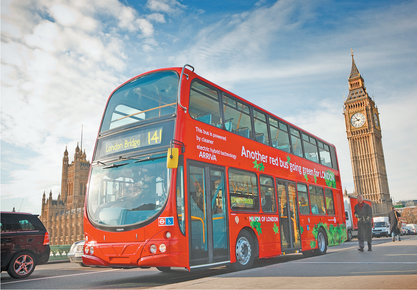
В крупных городах можно сэкономить на общественном транспорте.

Между тем цены на курортах за последний год выросли довольно значительно. В той же Турции средний чек в ресторане, по официальным данным, подскочил на 15%. В Чехии и Скандинавии на 5-6% подорожали продукты, а в Испа-