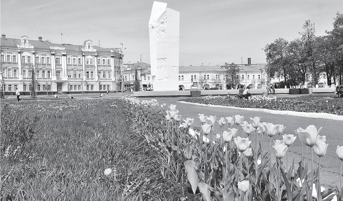
В первом экологическом рейтинге городов России, который составлен по международным критериям оценки, Вологда заняла четвертое место.

Эксперты особо подчеркивают тот факт, что при составлении первого экологического рейтинга использовались методики международного консалтингового агентства «Ernst & Young», а также критерии Организации экономического сотрудничества и развития (ОЭСР). «Принципы ОЭСР были адаптированы к России, и тот факт, что мы их использовали, позволяет нам сравнить международные данные по городам мира и российским городам, то есть можно понять, как мы выглядим в мире», - отметил министр природных ре-