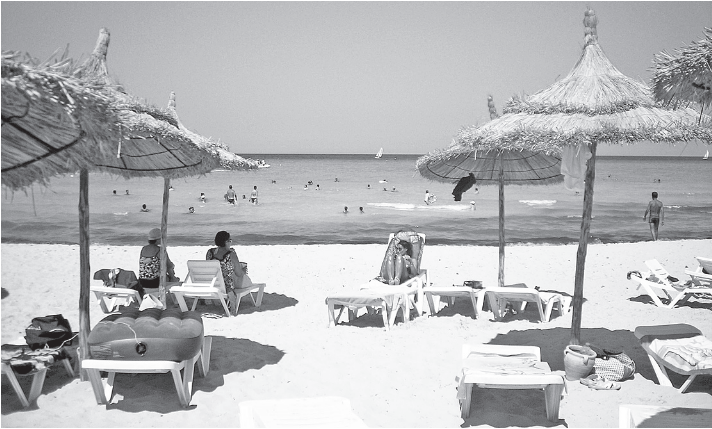
С появлением фонда «Турпомощи» отдых российских туристов должен стать еще более безмятежным.