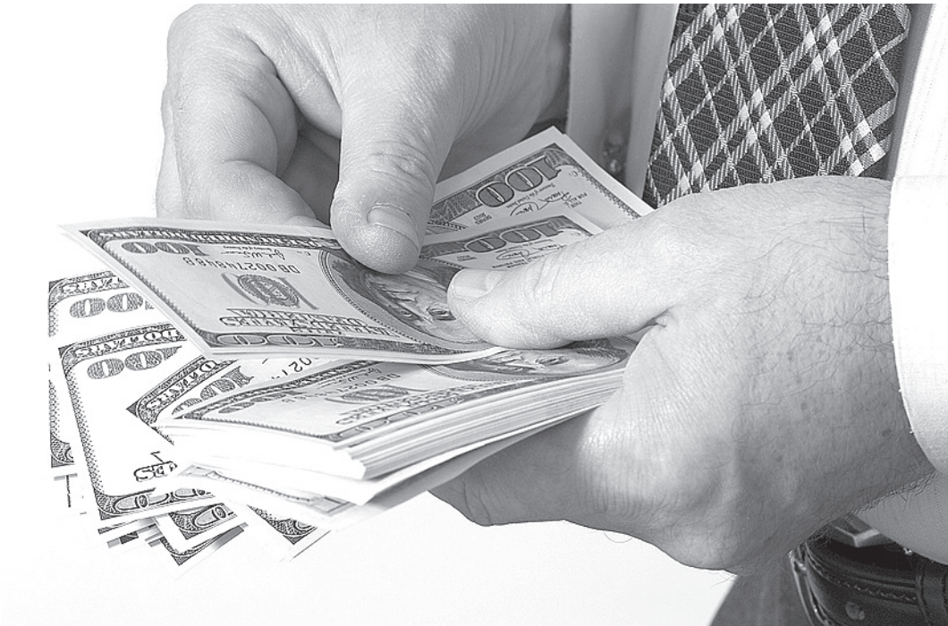
Банки охотнее выдают кредиты госслужащим, чем представителям других профессий.

Банки считают госслужащих самыми надежными заемщиками, показало исследование бюро кредитных историй «Эквифакс». Процент одобрения их кредитных заявок самый высокий. Согласно данным системы FPS (система анализирует данные, указанные в заявлении заемщиков), 70,3% заявок чиновников доходят до выдачи займа. Следующими по надежности заемщиками банки признают военных, преподавателей и финансистов. Процент одобрения их кредитных заявок составляет 66,93%, 65,54% и 64,61% соответственно.