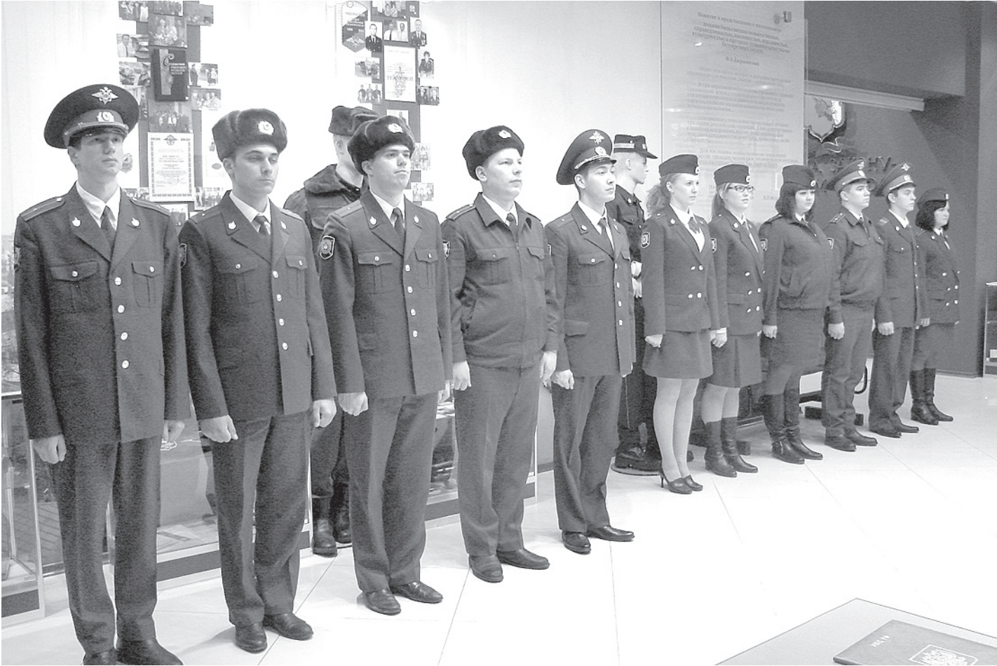
В Кирилловском и Кадуйском районах станет больше сотрудников полиции.

Нюксеницы, Никольский - Кичменгского Городка, Сокольский - Усть-Кубинского, Тотемский - Бабушкинского и Харовский - Вожегодского районов. Три отдела: Вологодский, Вытегорский и Шекснинский - оста-