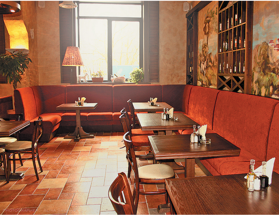
Маленькие рестораны в Европе дешевле, а еда там значительно вкусней.