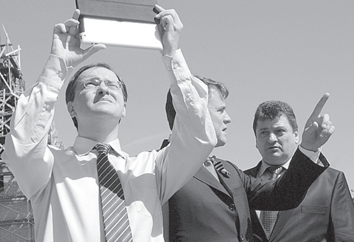
Владимир Мединский выступает за ужесточение штрафов не только в отношении интернет-пиратов, но и тех, кто нелегально скачивает в сети музыку и фильмы.

Пользователям Сети, которые раздают фильмы или музыку на торрент-трекерах или скачивают с них нелегальный контент, придется заплатить 5 тысяч рублей, если же в пиратской деятельности будет уличено должностное лицо, штраф вырастет в десять раз и составит 50 тысяч рублей. Предприниматели же или юридические фирмы будут наказаны еще строже - на один миллион рублей. Прибегнуть к таким жестким мерам Минкульт вынуждает катстрофическая ситуация с авторскими правами, которая сложилась в русскоязычном сегменте Интернета. Фильмы, которые еще идут в кинотеатрах и должны собирать кассу, чтобы оправдать расходы на их производство, можно найти в Сети. Например, картину «Легенда № 17», которая еще идет в кинотеатрах страны, можно совершенно бесплатно скачать и посмотреть в Интернете. Такая же