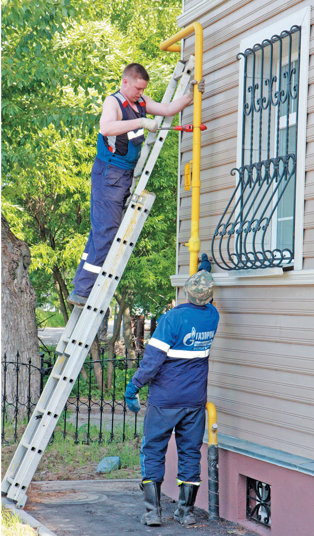
Специалисты газовой службы перекрыли газ в коттедж должника.

Добавим, что мероприятия по отключению от газоснабжения в Вологде проводятся газораспределительной организацией 8 раз в месяц, по вызову задолженности за природный газ по решениям суда со службой судебных приставов - 4 раза в месяц. кс