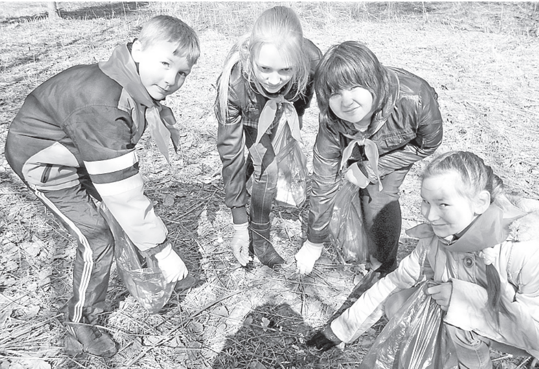
В акции приняли участие более тысячи учащихся из 21 школы Вологодского района.

72-04-61, 72-00-33, 72-04-62, 72-02-72, 72-55-30.