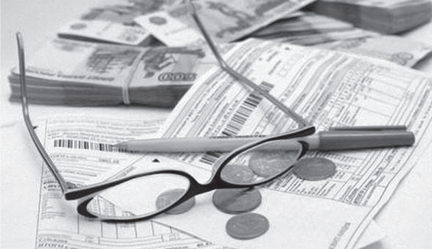
Правительство выполнило свое обещание: с 2015 года введены повышающие коэффициенты на оплату коммунальных услуг для тех собственников и нанимателей, в чьих квартирах не установлены приборы учета.