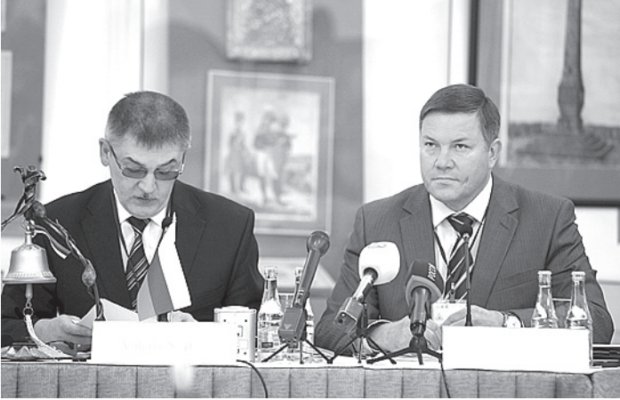
Олег Кувшинников выступил перед участниками Международного форума «Общество за безопасность», который состоялся в Вологодском кремле.

По сценарию учений, теплоход с 63 пассажирами на борту столкнулся с сухогрузом. Гремит взрыв, у нашего корреспондента от неожиданности выпадает из рук планшет - звук взрыва производит впечатление настоящего происшествия. Однако это только имитация. Далее, по легенде, из сухогруза в воду начинают выливаться нефтепродукты, некоторые пассажиры теплохода оказываются в воде. Начинается спасательная операция. Первыми к пострадавшему пассажирскому теплоходу прибывают спасательные катера. На огромной скорости они проносятся мимо зрителей, стоящих на берегу. Акваторию затягивает дымом. Для локализации утечки нефтепродуктов в район бедствия входит специальный катер, с которого начинают устанавливать боновые ограждения. В общем, все выглядит очень серьезно. Через считанные минуты на берег доставляют первых «пострадавших». Катер на воздушной по-