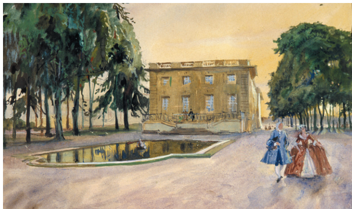
А. Н. Бенуа. Трианон. Версальская серия. 1906. Бумага, акварель.