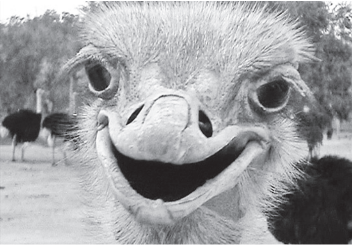
В зоосаде Деда Мороза обитают четыре страуса.

6 июня, в день рождения великого русского поэта Александра Пушкина, состоялась акция «Читающий район», на которую пригласили всех жителей города и села. В детском отделе прошла литературно-творческая игра по сказкам Пушкина. На взрослом абонементе можно было познакомиться с книжной выставкой «Вокруг «Евгения Онегина», посвященной 180-летию со дня выхода романа в свет, во время заседания клуба «Энтузиаст» посмотреть электронные презентации о жизни и творчестве великого поэта.