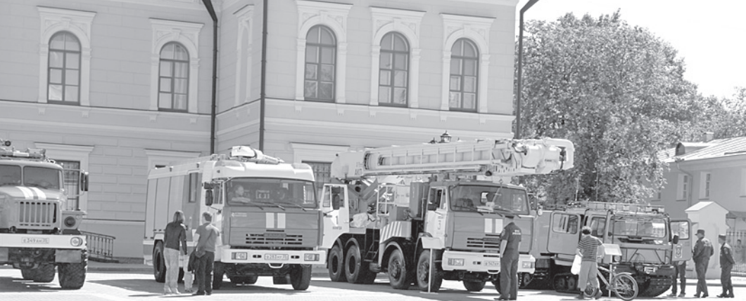
На Кремлевской площади в Вологде подразделения МЧС России представили образцы современной противопожарной техники, которую сегодня закупают для регионов.

гории: 5, 10 и 15 минут - по возможному времени их прибытия на место пожара. Если пожар серьезный, вызывают «пятиминутников», потом подтягиваются те, кто способен развернуть свои «гидранты» в течение 10 или 15 минут. В любом случае, каждая бригада отвечает за определенный участок территории и добирается до пожара значительно быстрее профессионалов. Кстати, недавно в Эстонии провели специальный опрос, чтобы узнать, что же все-таки движет добровольцами. Большинство из них уверены, что реально помогают властям и защищают жителей родных деревень и хуторов. Эксперты считают, что патриотические настроения - основной фактор, который может заставить россиян организовывать добровольные пожарные дружины во всех муниципальных образованиях страны. Предполагается, что на Вологодчине добровольные пожарные появятся практически в каждом населенном пункте к 2017 году. Артем ПОМЯЛОВ