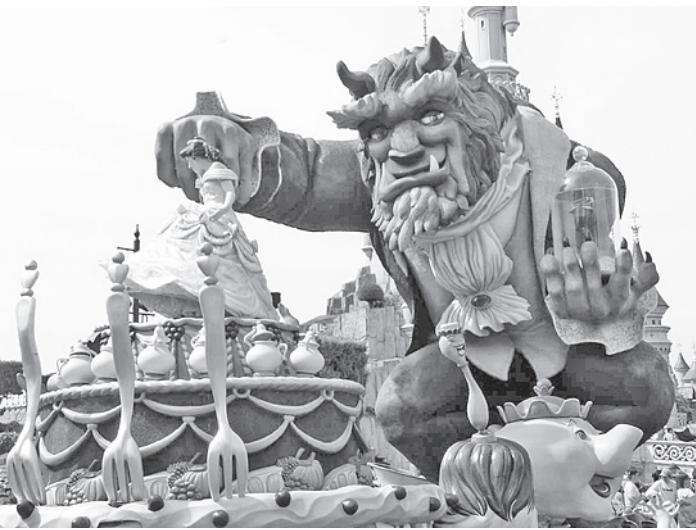
Парк неплохо заработал на любви арабского принца к мультикам.

Такого числа погибших от гроз в мире еще не было. Фактом даже заинтересовались в Книге рекордов Гиннесса. Правда, пока в руководстве издания существуют разногласия - включать ли такой трагический случай в число мировых рекордов или обойти его вниманием. Предыдущий печальный рекорд принадлежал Таиланду. Там за сутки в 2007 году от молний погибли 19 человек.