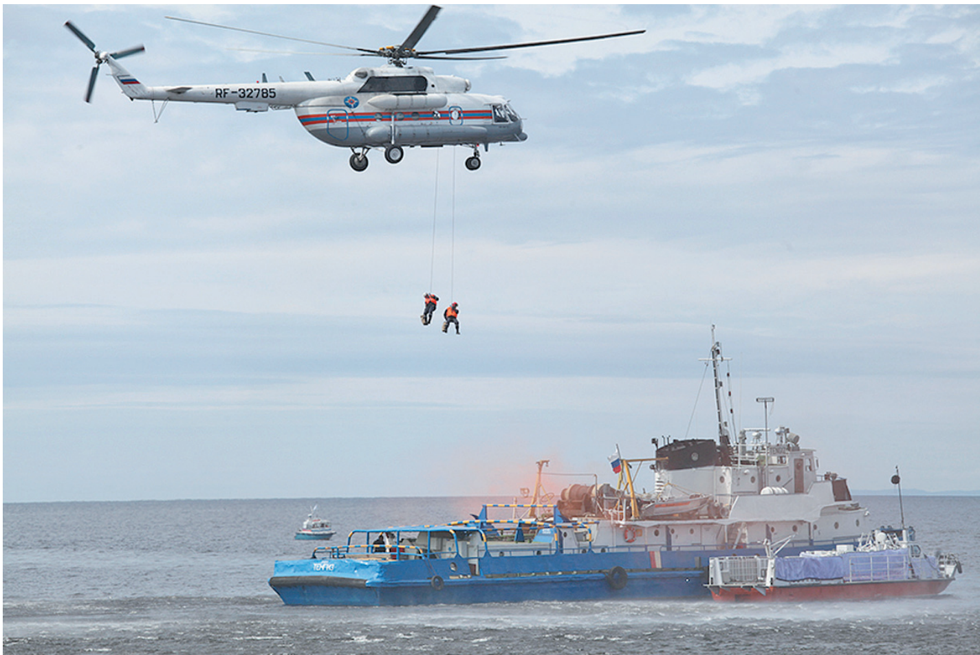
На сухогрузом, который по легенде учений терпит бедствие, зависает вертолет МИ-8, с него на судно спускаются парашютисты-спасатели.

Помимо пленарного заседания на территории учебно-спасательного центра прошли тактико-специальные учения на акватории Онежского озера. Целью тренировки ста-