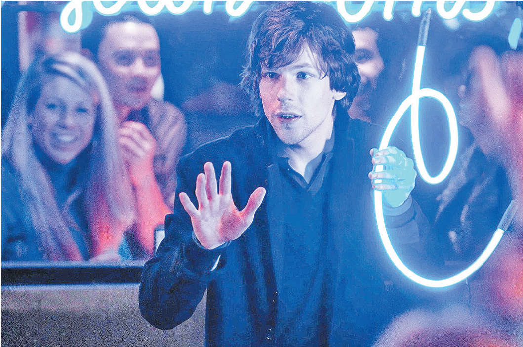
Сочетание разных жанров и хороший сценарий делают картину «Иллюзия обмана» одной из самых ожидаемых лент этого лета.

Затем режиссер и боссы киностудии приняли неадекватно дорабатывать и без того неплохой сценарий.