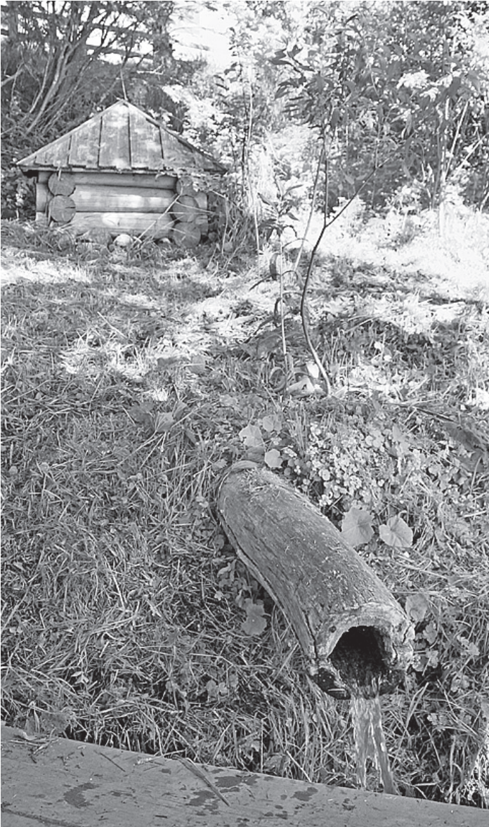
В местечке Лукинки Кирилловского района родниковая вода течет по осиновому «водопроводу».

жительный пример активного благоустройства источников, - считает председатель комитета ЗСО по экологии и природопользованию Михаил Ставровский. - Очень важно привлечь внимание к естественным источникам. Лучше, чем природа, ничто не очистит воду. Родники всегда в деревнях, поселениях были источниками водоснабжения. И конкурс направлен на то, чтобы жители попытались вместе с детьми и с помощью местных администраций восстановить источники, сделать доступными для местных жителей и для тех, кто сюда приезжает.