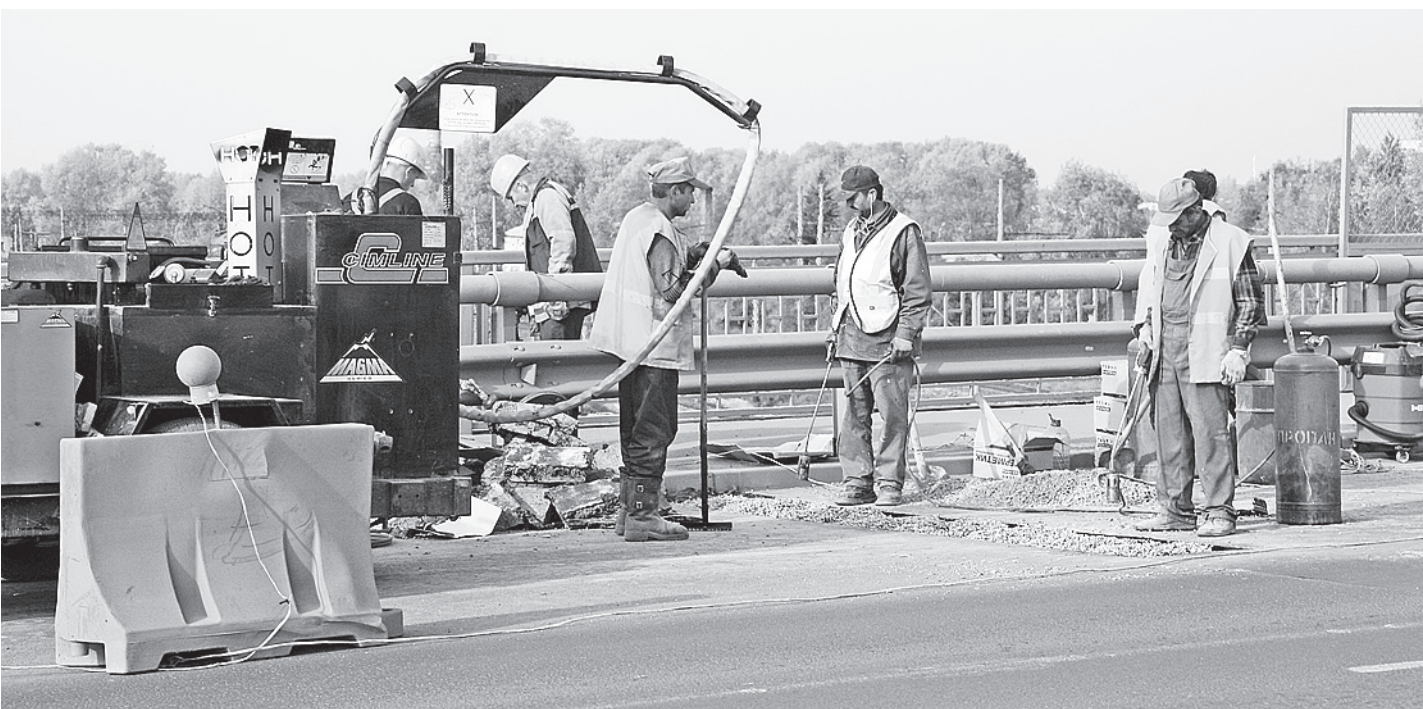
Все мосты планируется привести в порядок в течение ближайших пяти лет.

- На период пребывания в нашем центре родителям приостанавливается лишь выплата пособия на ребенка, - уточнила Юлия Тройнич. - Бывают случаи, когда одиноким матерям необходимо лечь для улучшения здоровья в стационар, родни нет и оставить ребенка элементарно не с кем. А недавно к нам обратилась женщина, у которой чрезвычайно напряженный график работы, круглосуточное дежурство. Поэтому в целях профилактики социального сиротства мы ей, естественно, не отказали и приняли ребенка в наш центр. Владимир ПЛАТОВ