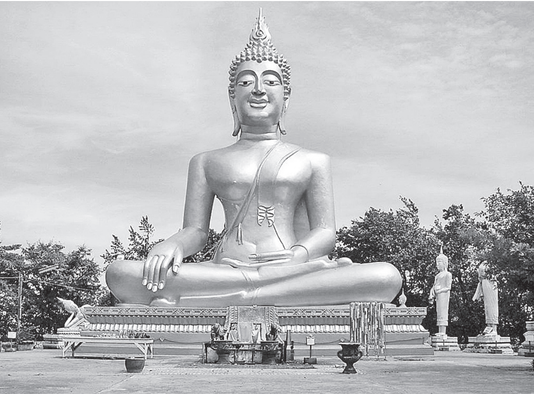
При визите в Таиланд с собой надо иметь загранпаспорт и заполненную миграционную карту.

Также существует информация о так называемом «сирийском штампе». Его якобы ставят в паспорт бесплатно, если вы прибываете в аэропорт Шарм-эль-Шейха и не собираетесь в ходе пребывания в Египте покидать пределы Южного Синая, к которому относится побережье от Шарм-эль-Шейха до Табы. Однако в консульском отделе посольства Египта в Мо-