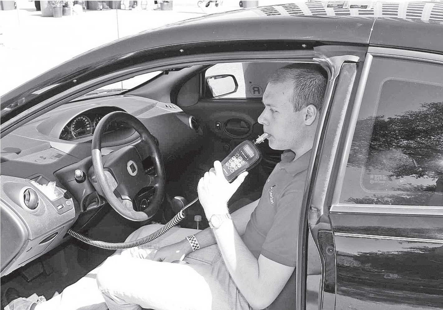
По статистике, 12% водителей, лишенных прав в прошлом году, имели в крови не более 0,2 промилле алкоголя.

- Кефир и квас не дают никакой реакции алкотестеров, - уверен премьер-министр Дмитрий Медведев. - Это все страшилки, которые распространяют разные люди, в том числе и лоббирующие интересы производителей алкоголя. Мои коллеги, не буду их называть, проводили над собой эксперимент. Они пили кефир, пили лекарства, пили квас. И дышали в ал-