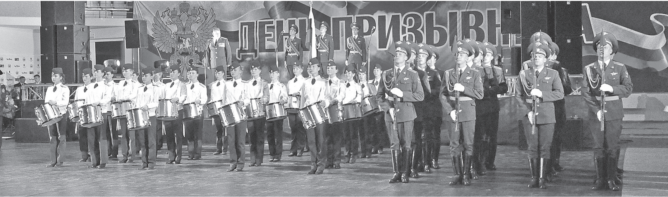
Организаторы Дня призвыника превратили его в яркий запоминающийся праздник.