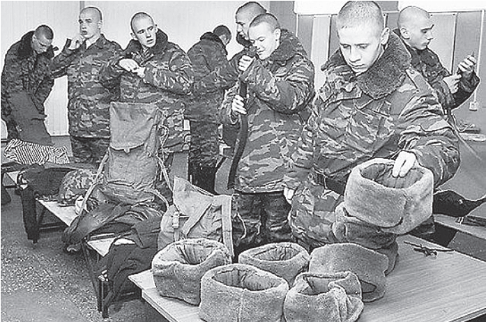
Решение одеть солдат в льняную форму может обеспечить загрузку целой цепочки наших предприятий, занимающихся производством и переработкой льна.

Кроме того, эта ткань является природным антисептиком. Лен убивает микробы, инфекции, подавляет вредную микро-