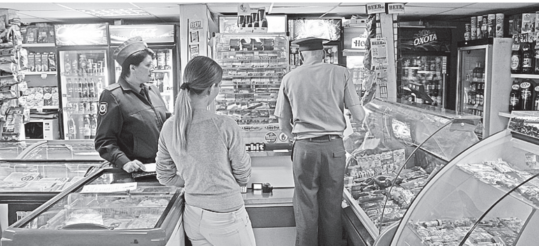
Торговать алкоголем ночью станет невыгодно.