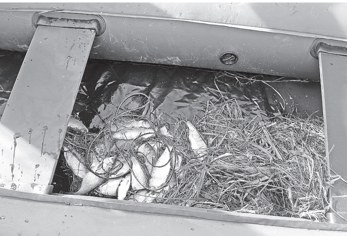
Несмотря на запрет, браконьеры использовали сети.

дов - совместно с ГИМС и правоохранительными органами. В итоге выявлено 179 нарушений, изъято девять единиц оружия и зарегистрирован один случай огнестрельного ранения в Усть-Кубинском районе. В этом году весенняя охота на водоплавающую и боровую дичь осуществлялась в области в течение десяти календарных дней: в южных районах - с 27 апреля по 6 мая, в северных районах - с 1 по 10 мая. Было выдано свыше 17 тысяч разрешений на добычу пернатой дичи. К сожалению, об итогах добычи трофеев говорить пока рано, так как в настоящее время в соответствии с установленными сроками идет возврат охотникам выданных разрешений и сбор информации. В среднем ежедневно на территории области в сезон весенней охоты добывается более 23 тысяч особей пернатой дичи. В их числе - около 650 глухарей, около 450 тетеревов, око-