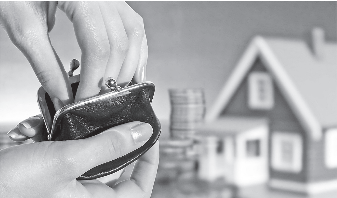
Минфин предлагает установить предельное значение доходов от продажи недвижимости, которые будут освобождены от налога.

Минфин предлагает облагать налогом все доходы от продажи недвижимости, кроме продажи единственного жилья либо недорогого дач, сообщил журналистам заместитель министра финансов Сергей Шаталов.