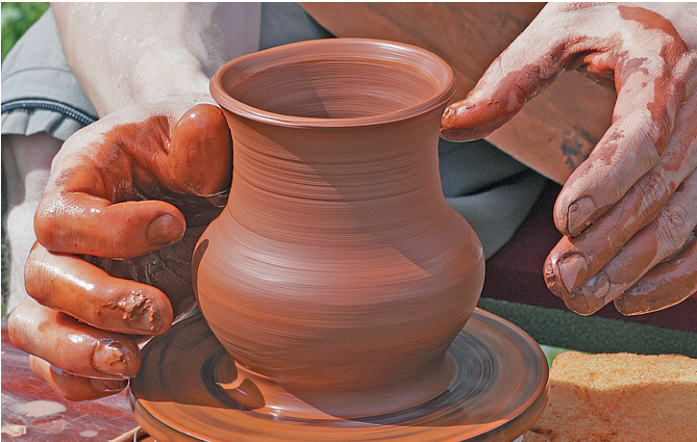
Гончарное дело - тонкая работа.