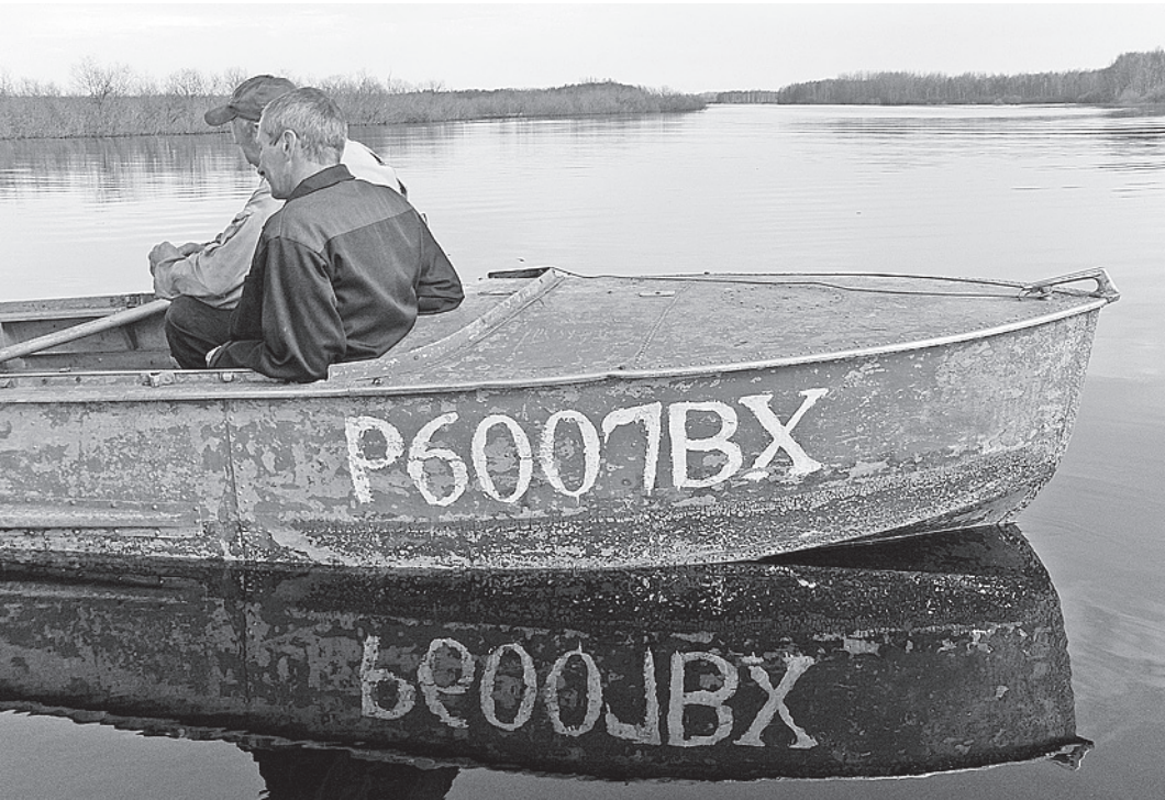
На нарушителей был наложен штраф, у них также изъяли запрещенные снасти.

Как сообщает пресс-служба Северо-Западного территориального управления Росрыболовства, несколько дней назад в районе реки Мондомы рыбаки-любители, несмотря на запреты, орудовали ставными сетями. По итогам рейдов составлено пять протоколов об административных правонарушениях, наложено штрафов на сумму семь тысяч рублей. У браконьеров изъяли три незаконных орудия лова и 20 килограммов леща. Кроме того, в департаменте по охране, контролю и регулированию использования объектов животного мира подвели итоги весенней охоты. За этот период было проведено 780 рейдов по охране охотничьих угодий, из них 50 рей-