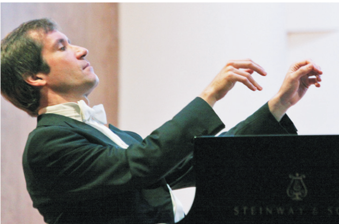
Участником фестиваля «Покровские встречи» стал выдающийся современный музыкант-просветитель Николай Луганский.