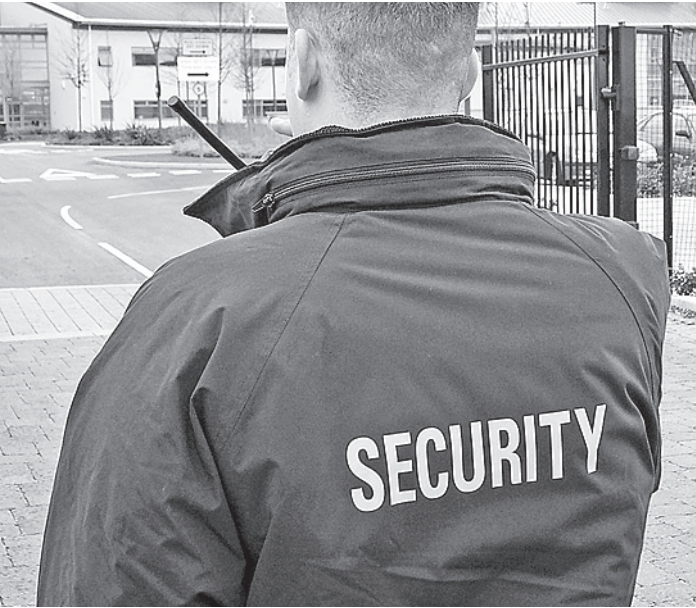
Охранник - одна из самых распространенных мужских специальностей в России.

Так, по оценке сопредседателя «Деловой России» Алексея Репникова, 500-700 тысяч высококвалифицированных рабочих мест дадут малые предприятия при вузах, занятые внедрением научных разработок. Основную массу рабочих мест «светлого будущего» обеспечит система повышения квалификации, считает директор направления «Мо-