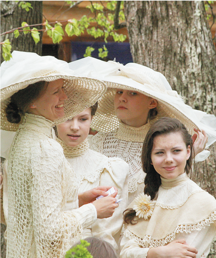
Костюмы XIX века и современным женщинам к лицу.