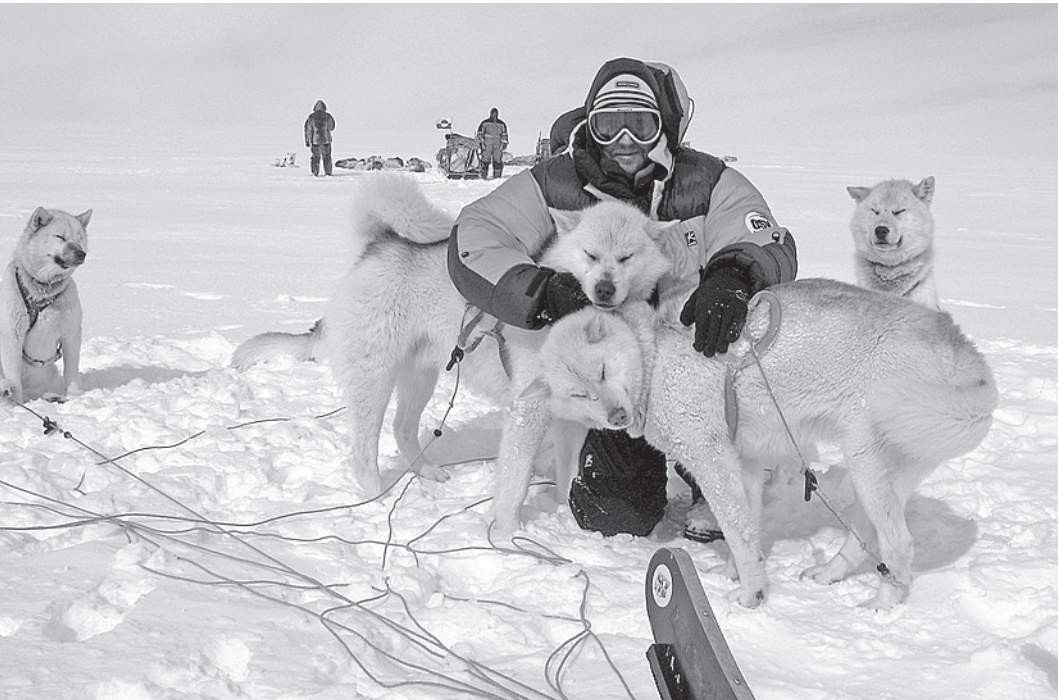
Транспортировать вологодские продукты путешественникам помогают собаки - чукотские ездовые.