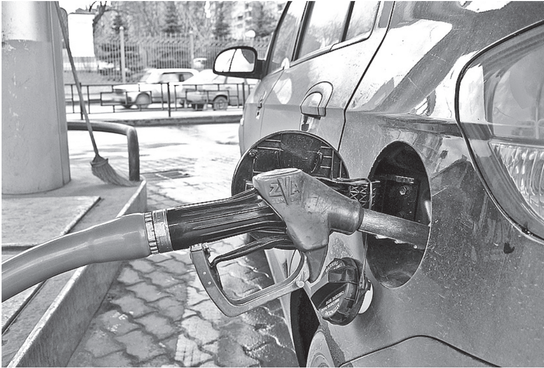
Рост акцизов на нефть неизбежно приведет к росту цен на бензин, но государство будет максимально сдерживать этот рост.

С каждым днем облагаемого более низкими налогами топлива на рынке становилось все больше, что в итоге привело к сокращению поступлений в дорожные фонды. Минфин оценил выпадающие доходы дорожных фондов в 2013 - 2015 годах в 110 миллиардов рублей. - Выхода у правительства было два, - поясняет аналитик Центра изучения сырьевой конъюнктуры Павел Шадринцев. - Резко сократить объемы дорожного строительства и ремонтов, которые и так невелики, или же резко увеличить акцизы на бензин «Евро-4» и «Евро-5». Оба варианта были бы для правительства не очень желанными. Всю весну проводили консультации, проводились согласительные комиссии - власть