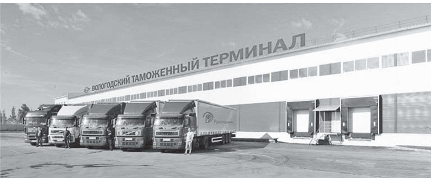
Вологодский Союз промышленников и предпринимателей выступает за возвращение таможни в Вологде.

Увеличивая страховые взносы, в качестве основного аргумента государство проводило необходимость поднять со-