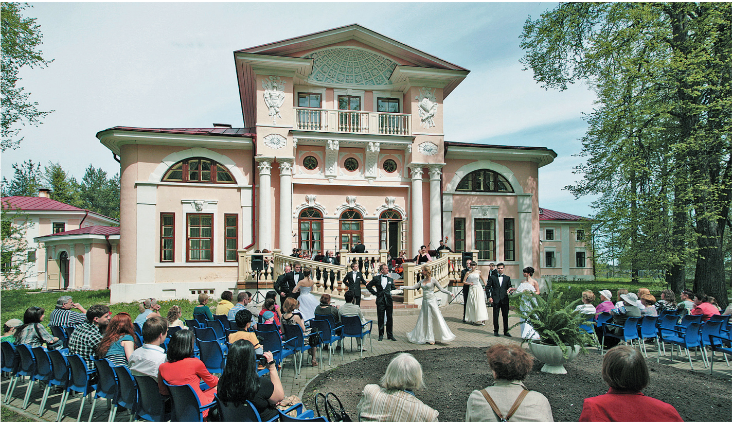
Весенние ассамблеи в Покровском включали в себя балетные танцы, камерную музыку под открытым небом, знакомство с парковой культурой минувших столетий.

Приехавшие на фестиваль гости отмечают его особую атмосферу - душевную, заставляющую пусть на время забыть о проблемах, погрузиться в мир старинной русской усадьбы. Кс