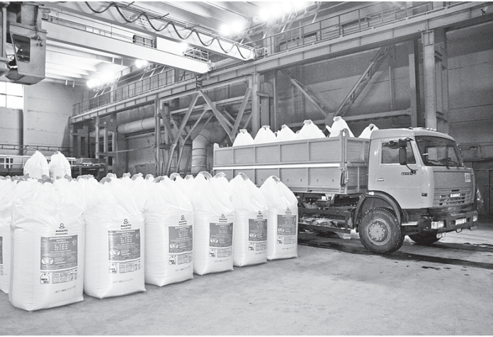
Компания делает ставку на выпуск комплексных удобрений.

Компания «ФосАгро», опубликовав финансовую отчетность за прошлый год и итоги производственной деятельности за первый квартал 2013-го, продемонстрировала увеличение выпуска удобрений и, как следствие, прибыли.