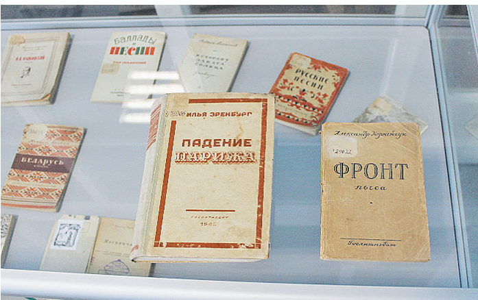
Большой популярностью пользовались у читателей публицистические произведения Ильи Эренбурга.

В областной библиотеке, стараясь сохранить память о Великой Отечественной войне, создали картотеку в электронном виде, где можно узнать основную информацию о той или иной заинтересовавшей вас книге, а уникальных изданий здесь много.