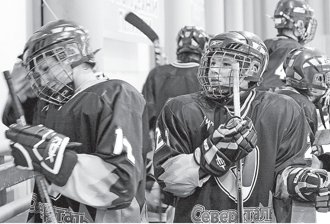
В хоккейной школе «Северстали» подрастают будущие чемпионы.

- В нашей хоккейной школе занимаются примерно 670 де-