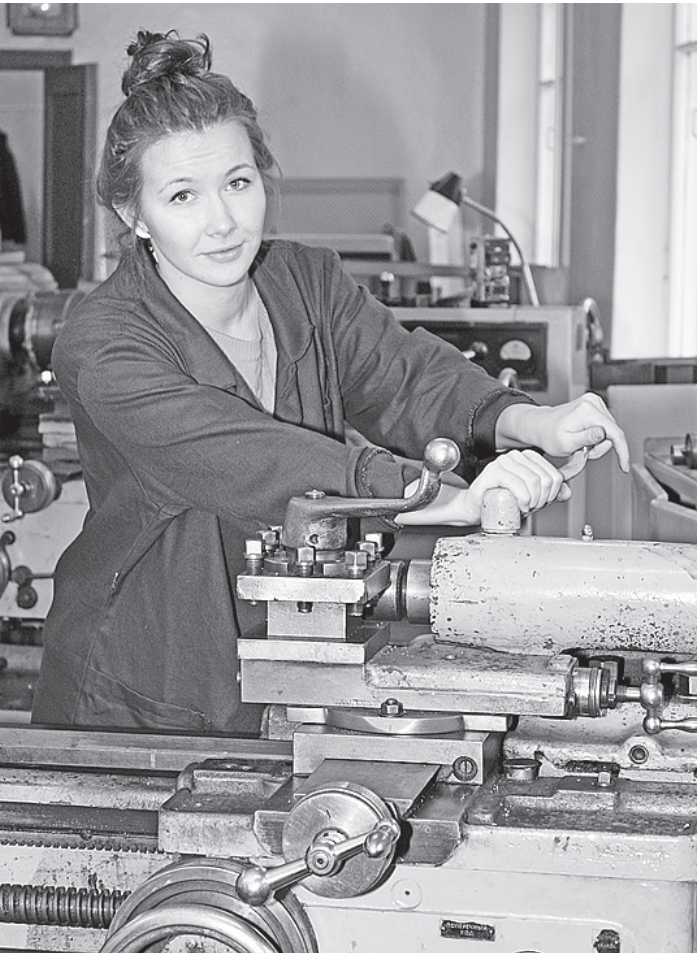
Предприниматели в регионах очень надеются на поддержку на федеральном уровне.

Еще одним способом избежать неработающих законов, по мнению членом ОКС, могла бы стать практика «обкатки» резонансных законопроек-