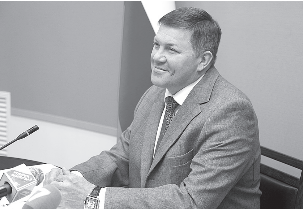
Перед началом конференц-связи Олег Кувшинников тепло поздравил ветеранов с Днем Победы.