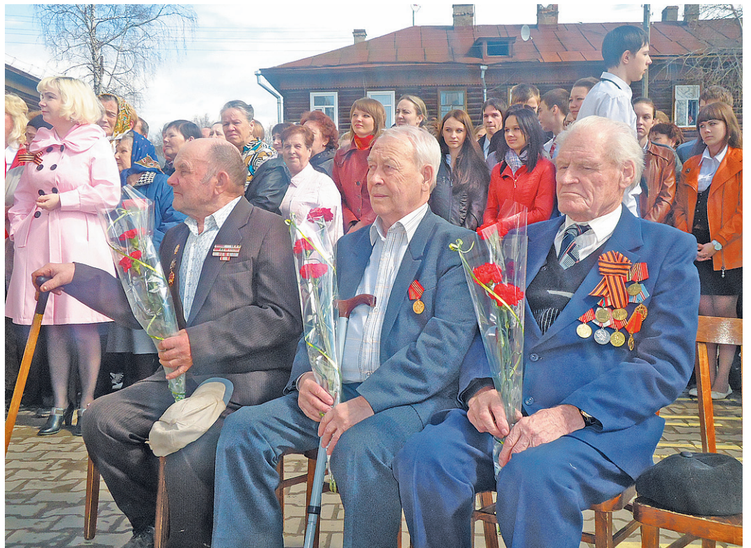
На праздник пригласили ветеранов-фронтовиков.

Еще за несколько минут до начала торжественной линейки шел дождь. Но сразу после по-