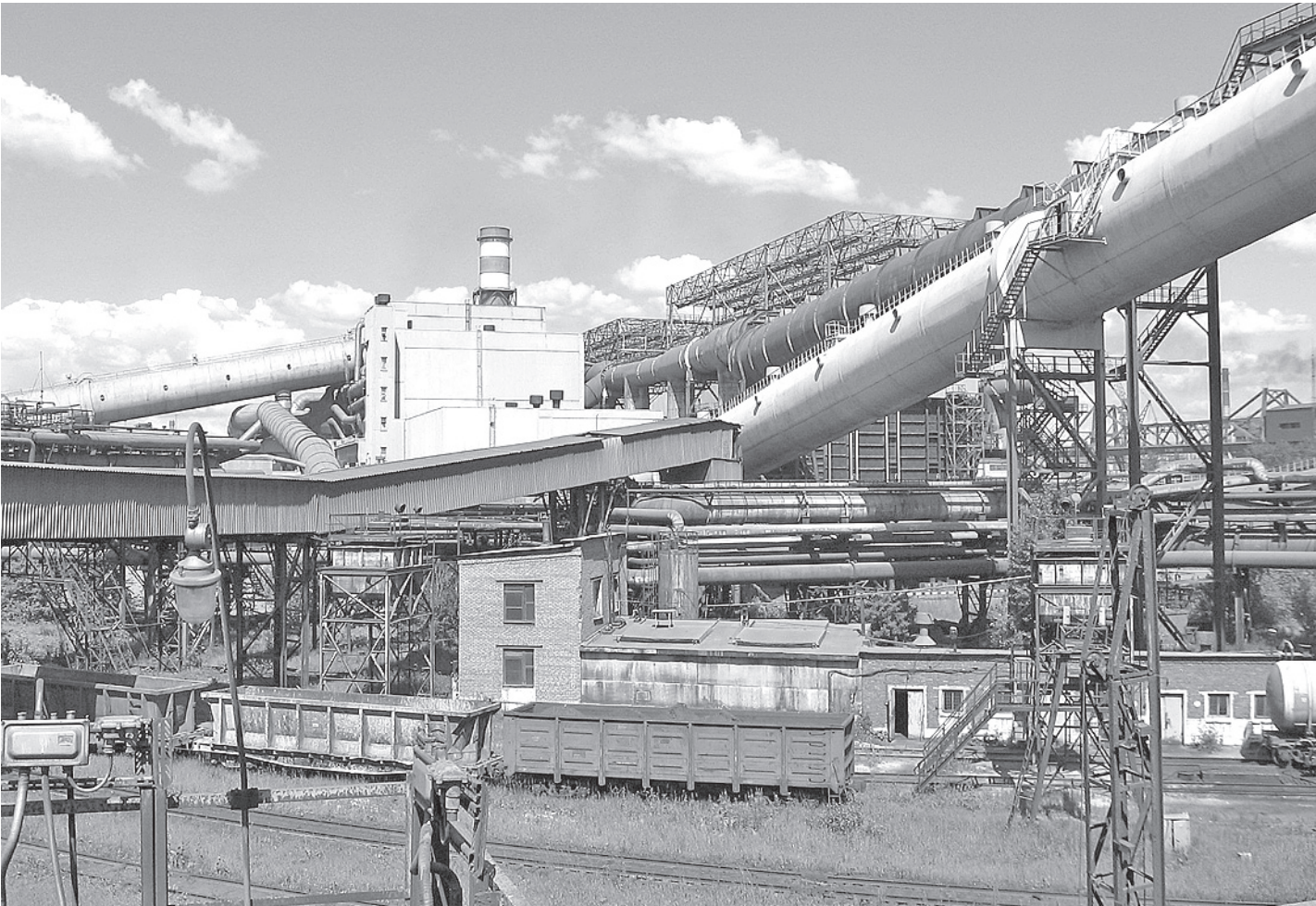
Инвестиционная программа компании на 2013 год оценивается в 1 миллиард 300 миллионов долларов. Значительная часть этих средств будет направлена на экологические мероприятия.

- Сегодня мы видим, как нам кажется, существенную неэффективность сферы здравоохранения в Череповце, массовые жалобы по низкое качество и недоступность медицинских услуг, - под этими словами Алексея Мордашова могли бы, пожалуй, подписаться не только череповчане, но и жители