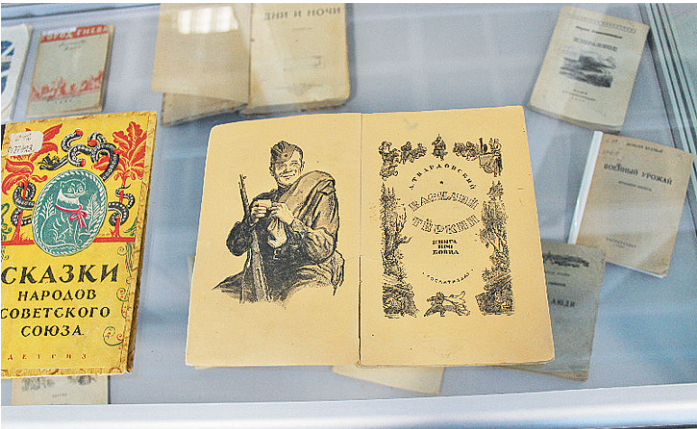
Многие бойцы знали наизусть отрывки из поэмы о Василии Теркине.