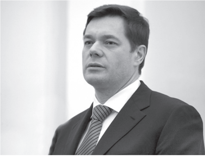
Алексей Мордашов считает положение компании устойчивым.

- Существует расхожий миф, что наши фонды стали