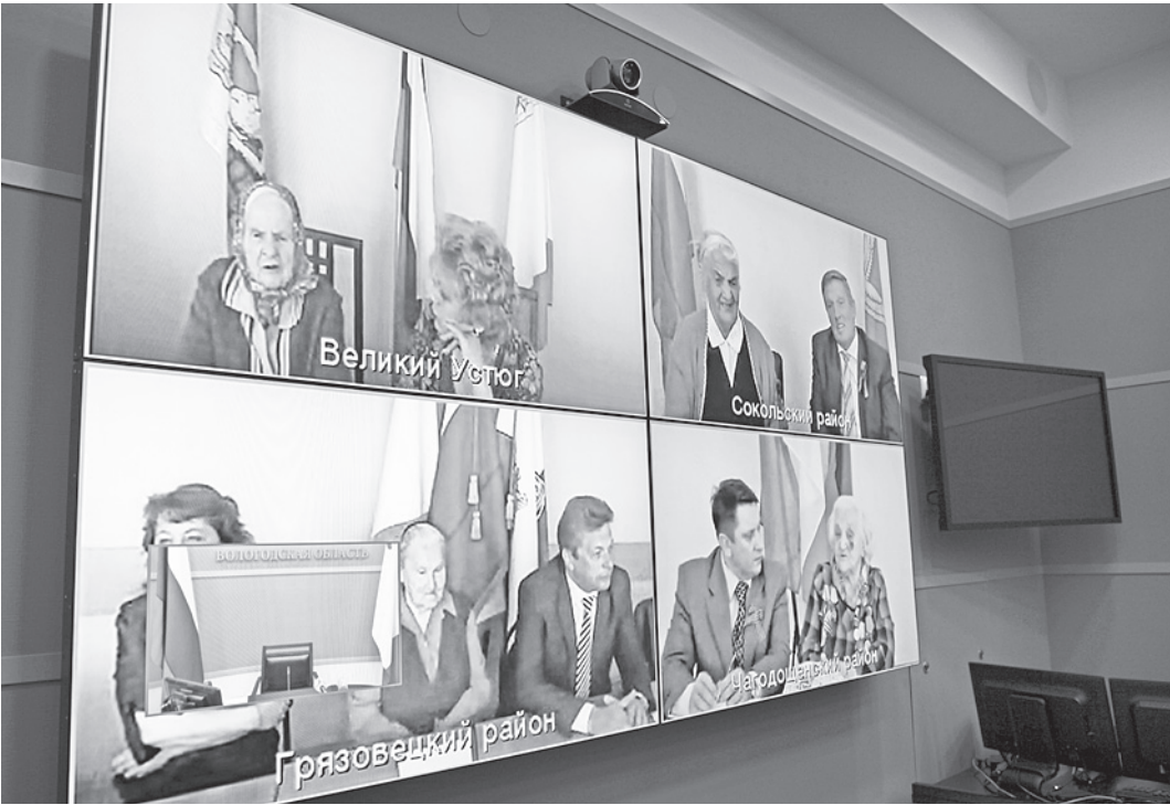
Ветераны общались с руководителем области, заняв свои места перед экранами мониторов.