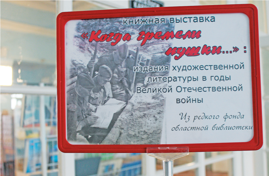
Книжная выставка «Когда гремели пушки...» будет интересна всем вологжанам.

Широко издавались и пользовались спросом произведения руководителей страны и, конечно же, книги об истории нашей Родины. В Ленинграде их вышло около 120. Нарасхват шли произведе-