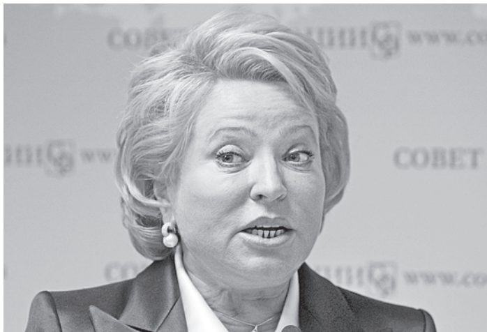
Валентина Матвиенко предложила перевести штаб-квартиры крупнейших отечественных бизнес-структур из Москвы в регионы.

Минфин согласен реструктурировать часть бюджетных кредитов регионам, сообщил министр финансов Антон Силуанов. «Мы по ряду субъектов РФ перенесли срок погашения кредитов с этого года на следующий в рамках трехлетнего периода действия этого бюджетного кредита. Это потребует дополнительно 70 миллиардов рублей источников финансирования дефицита бюджета, которые мы будем закрывать», - цитирует чиновника РИА Новости. Силуанов уточнил, что эти средства регионы должны будут вернуть в следующем году. Напомним, субъекты Федерации в 2013 году должны погасить перед федеральным бюджетом долги на 420,6 миллиарда рублей. При этом общий объем задолженности на 1 января 2013 года составил 1,36 триллиона рублей, что соответствует 26,1% доходов региональных бюджетов. В 2014 году ситуация для реги-