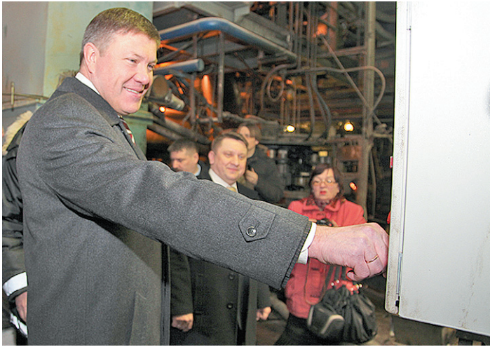
Глава региона считает, что такие производства - пример диверсификации экономики и импортозамещения.