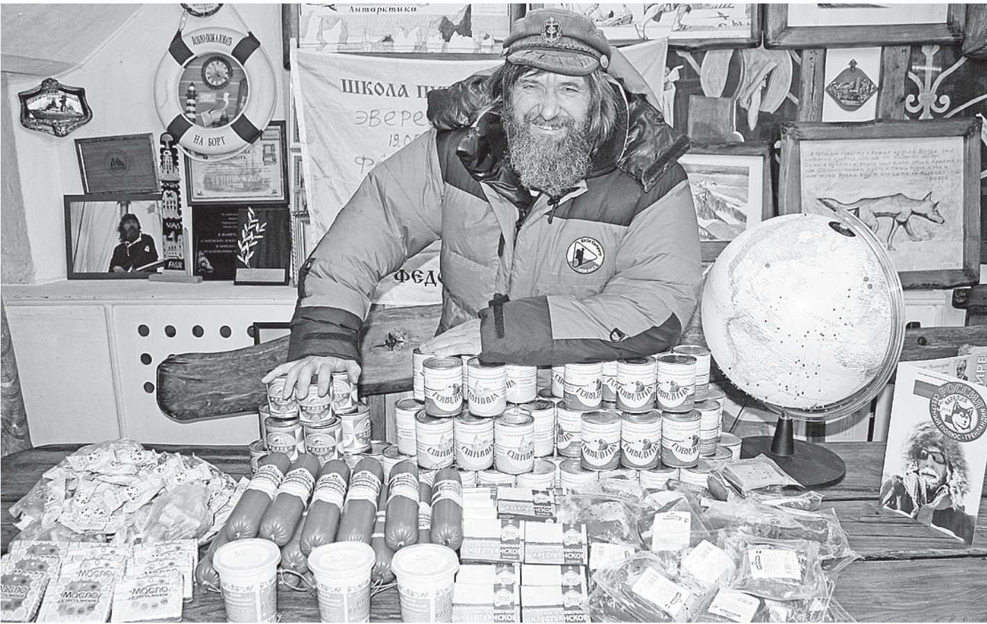
По мнению Федора Конюхова, в дальних экспедициях натуральные и экологически чистые вологодские продукты - «самое то!».