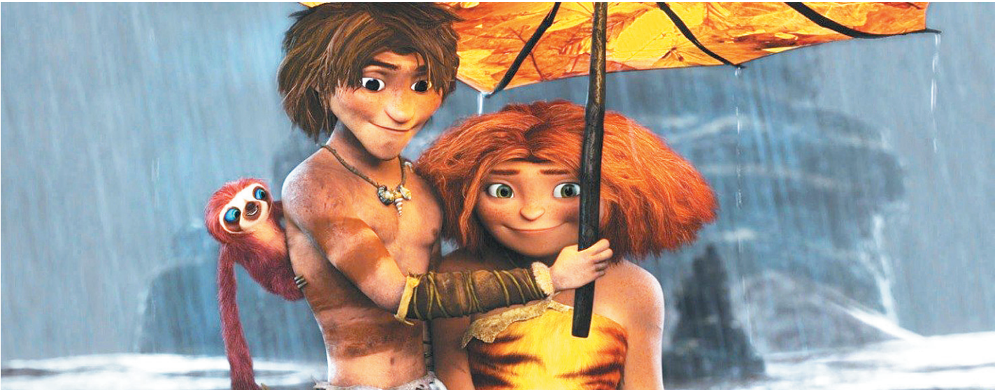
И зонты они тоже уже придумали.