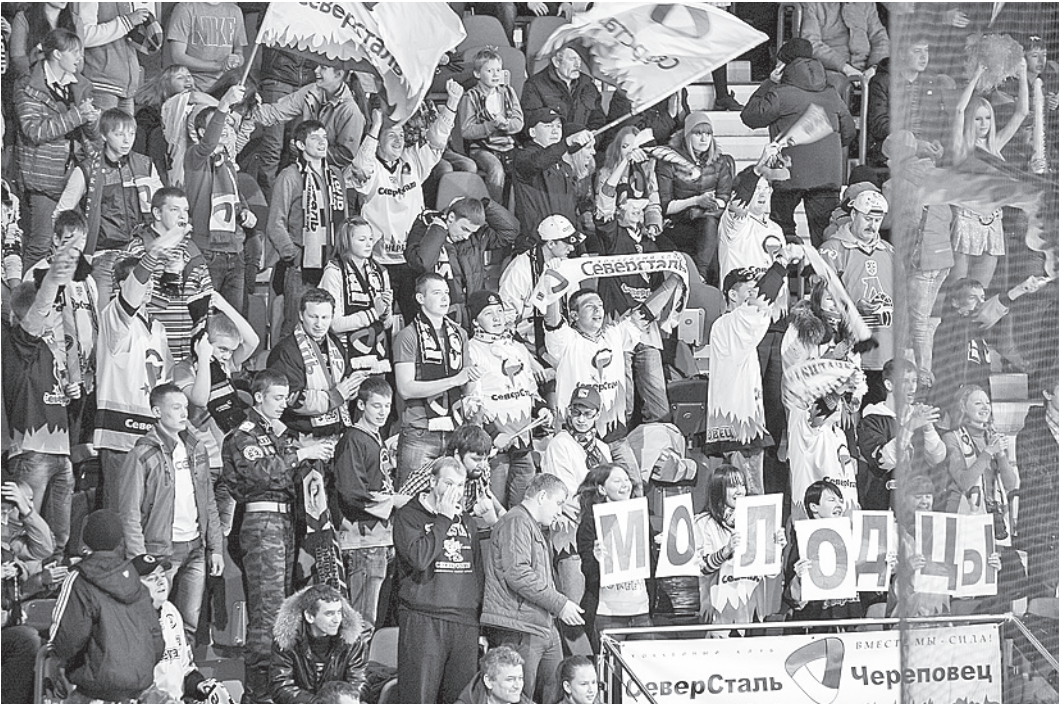
Болельщики весь сезон активно поддерживали команду.