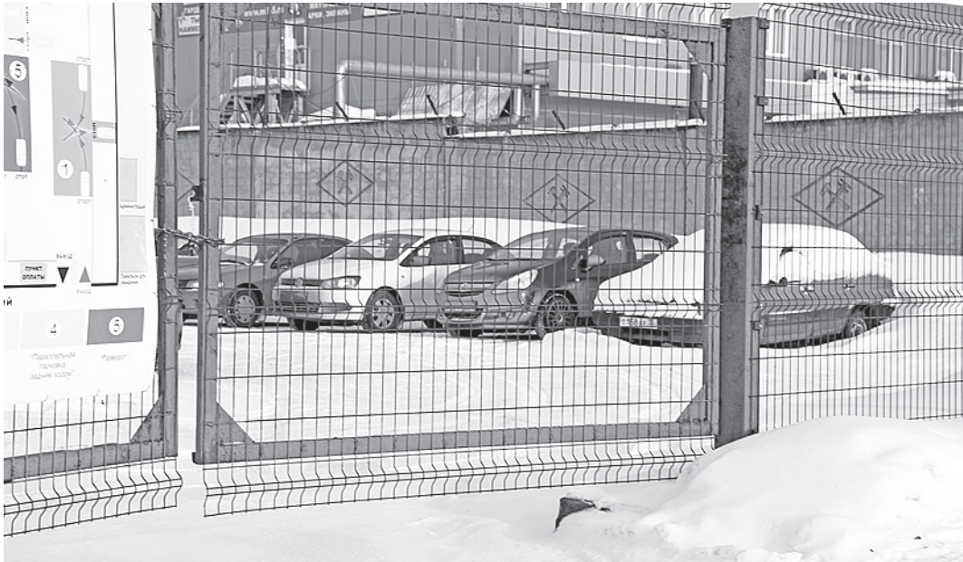
Резонансный закон о штрафстоянках может быть принят уже на мартовской сессии ЗСО.

Пакет внесенных губернатором законопроектов уже прошел согласование на коллегии ЗСО и, судя по настрою подготавливающего большинства депутатов, должен быть принят в окончательном чтении без каких-либо проволочек. Обсуждался на коллегии и перечень других предварительных вопросов, которые депутаты намерены обсудить на сессии 27 марта. Среди них - областной закон «О развитии сельского хозяйства», а также уточняющие поправки в ранее принятый закон «Об установлении меры государственной поддержки по оплате первоначального взноса по ипотечному кредиту молодым учителям образовательных учреждений области». Будет внесен на сессию и резонансный законопроект о штрафстоянках. Напомним, что на февральской сессии депутаты приняли этот законопроект, официальное название которого звучит так: «О порядке перемещения задержанных транспортных средств на специально отведенное охраняемое место (специализированную сто-