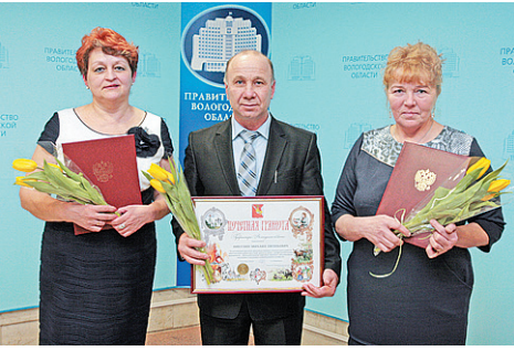
В Вологде поздравляли работников торговли с их профессиональным праздником.