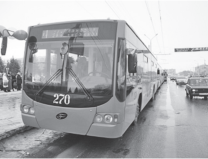
Вологодская техника, как отметили в Оренбурге, решает и важную социальную проблему, так как приспособлена для заезда инвалидов-колясочников.

Шесть новых низкопольных троллейбусов, собранных в Вологде, начали перевозить пассажиров в Оренбурге. На каждом из шести городских троллейбусных маршрутов этого города теперь будет работать по одному вологодскому троллейбусу.