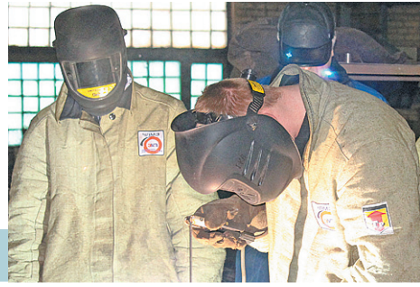
Нужны ли России сегодня инженеры и рабочие?