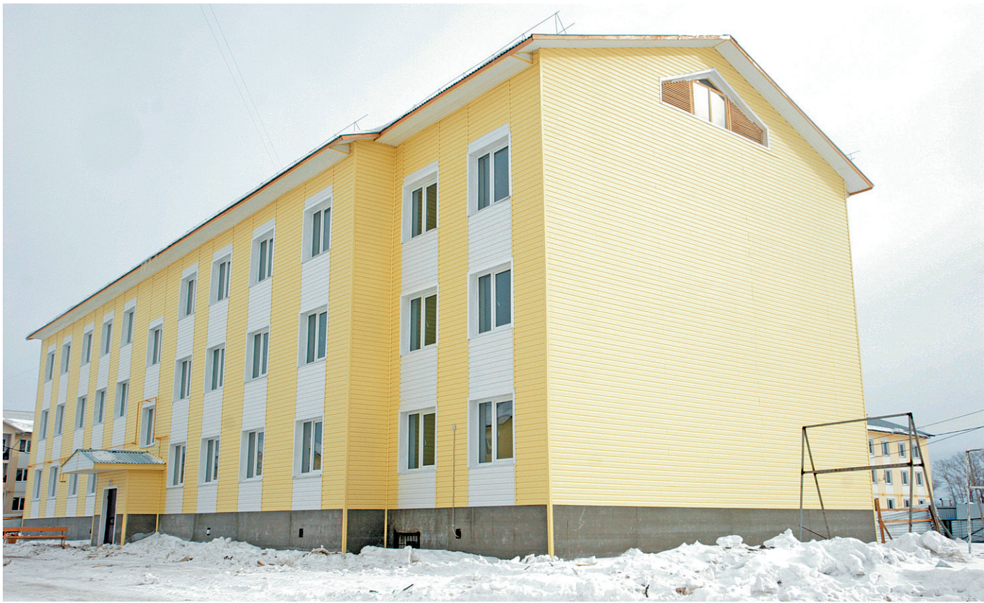
В такие дома в ближайшие месяцы переедут 178 семей вологжан.

Еще одна цель поездки главы в Прилуки - проинспектировать строительство нового со-