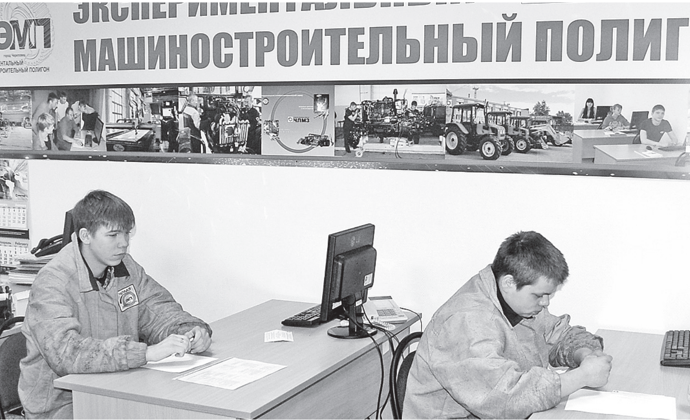
С повышением уровня качества профессиональной подготовки молодых специалистов повышается их уровень конкурентоспособности в условиях рыночной экономики.

Отвечая на вопрос о том, нужны ли стране инженеры, отвечу, слегка перефразируя известную поговорку: если страна не хочет кормить своих ученых и инженеров, то ей придется кормить чужих и оплачивать мероприятия технического прогресса в странах-победителях. Но в любом случае каждый из нас может и должен быть инженером своей судьбы и своего счастья, главной формулой достижения которого остается призыв: «Учиться, учиться и еще раз учиться!» кс