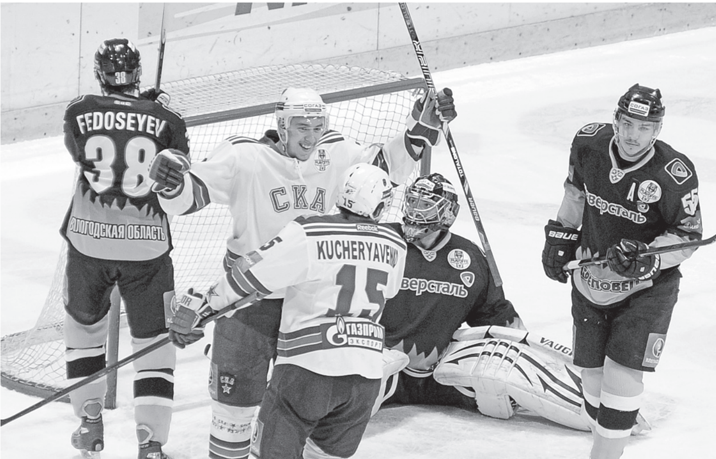
Питерские армейцы в четырех матчах подряд выиграли у «Северстали» и вышли в полуфинал Кубка Гагарина.