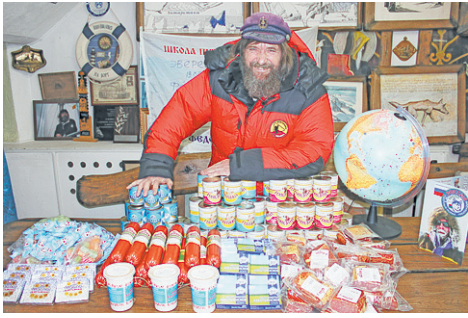
Федор Коннохов возьмет с собой на Северный полюс вологодские продукты.