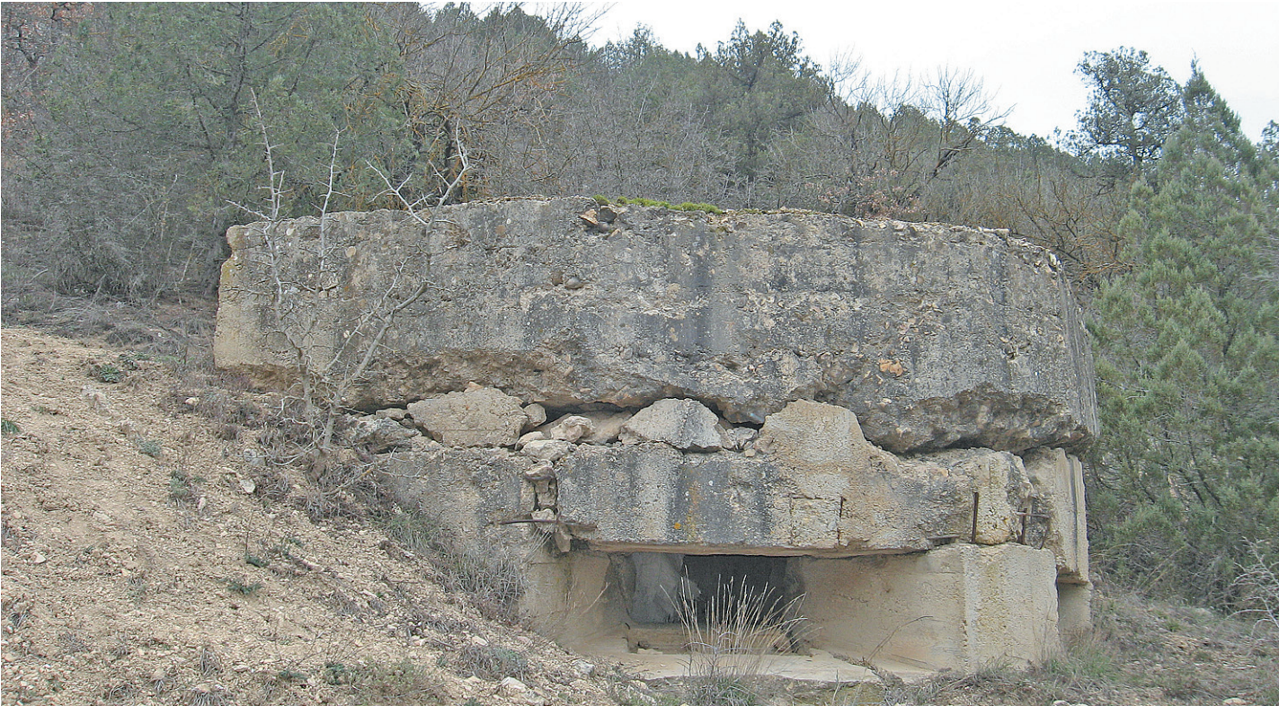
Представители Вологодского землячества в Крыму намерены восстановить Инкерманский ДОТ к маю 2014 года, к 70-летней годовщине освобождения города от немецко-фашистских захватчиков.

Считается, что из 80 вологодско-краснодарских курсантов непосредственно на этом поле боя полегли более 60 человек. Еще семеро скончались от полученных ранений. Остальные были убиты во время уличных боев или пленены на мысе Херсонес (из Севастополя, к сожалению, удалось эвакуировать лишь небольшую часть старших офицеров и политработников Красной Армии, тогда как