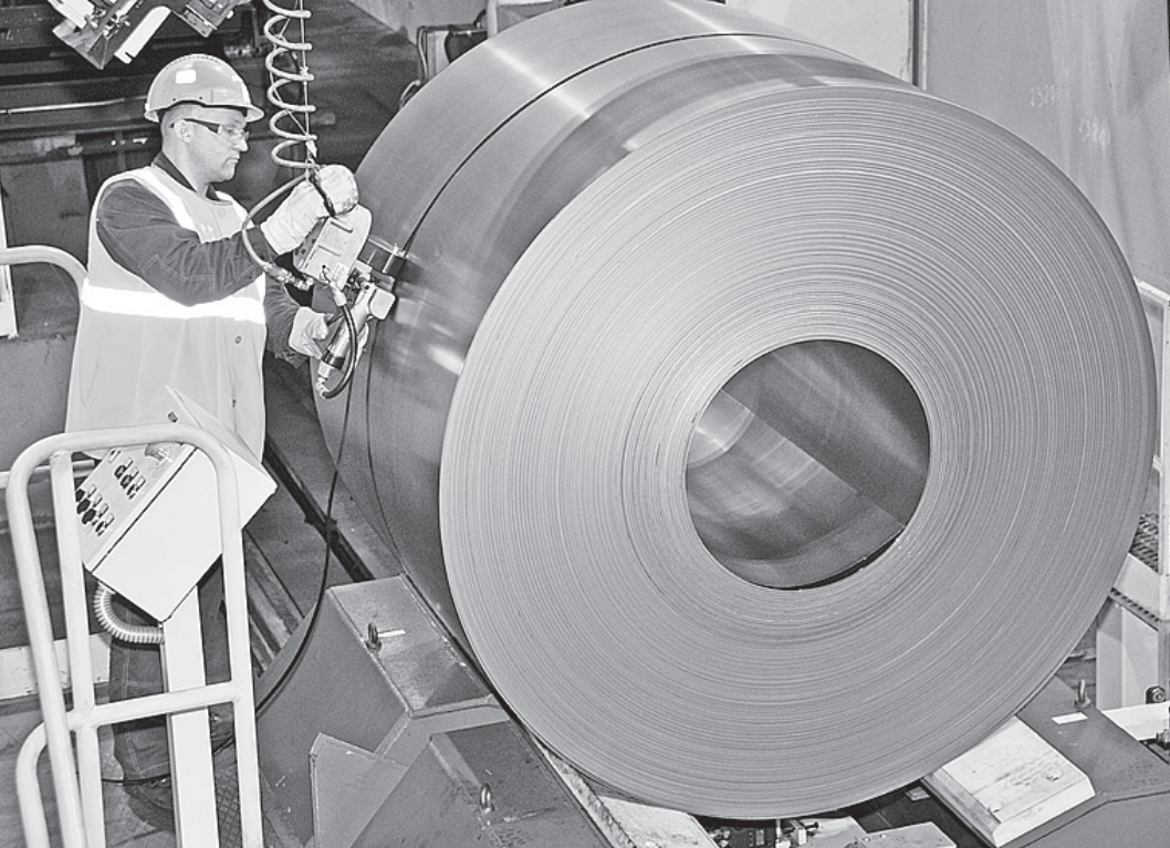
Холоднокатаную сталь компания поставляет прежде всего автопроизводителям.