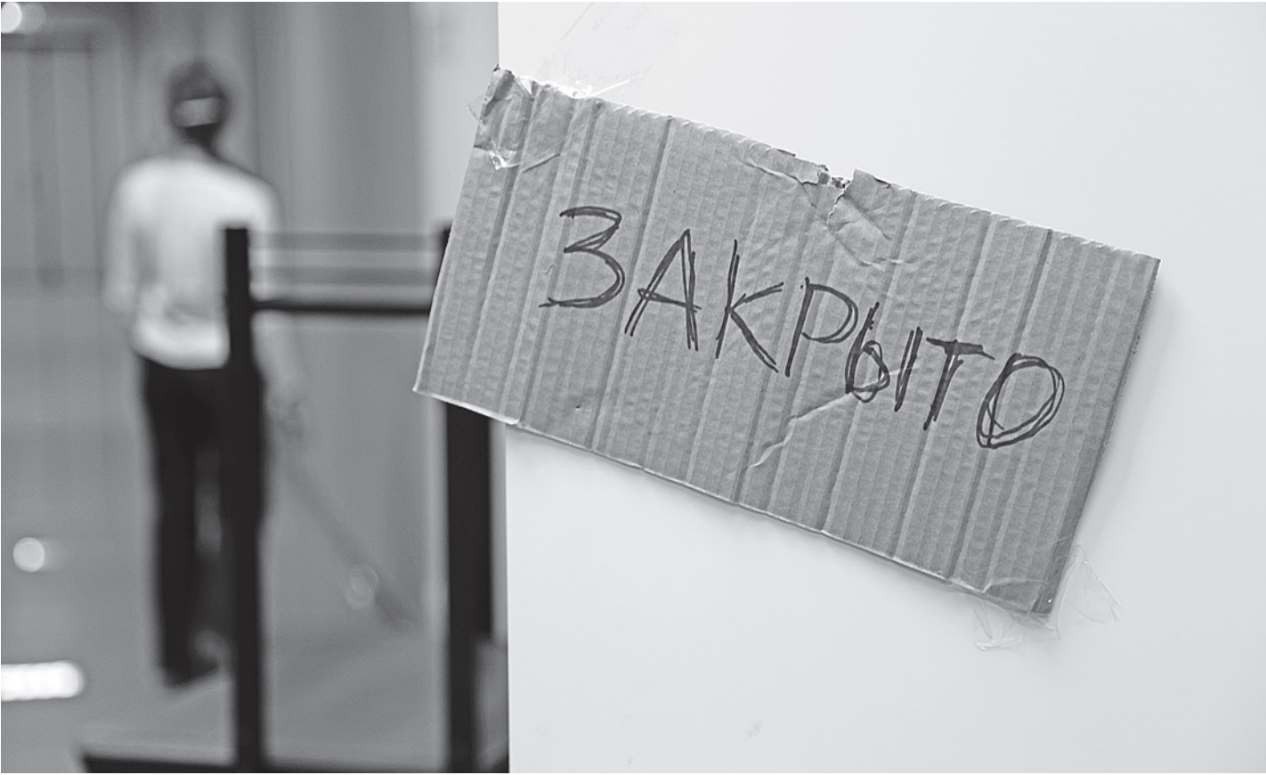
Резкое увеличение налоговой нагрузки вынудило предпринимателей уйти «в тень».

Впрочем, резкое повышение страховых выплат далеко не единственный аргумент, заставляющий предпринимателей сворачивать легальный бизнес или всерьез задумываться об этом. В качестве дру-