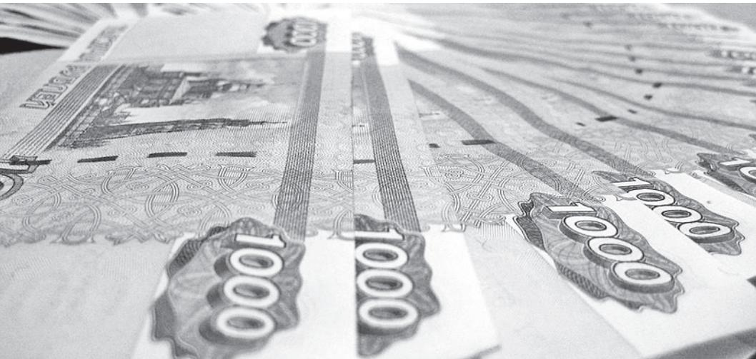
Главная цель нового законопроекта - противодействие отмыванию денег и финансированию терроризма.

База данных на всех без исключения жителей России, привели к счетам в отечественных банках, - это предложение Росфинмониторинга. Цель, по мнению правительственных чиновников, - приведение российской законодательства в соответствие с требованиями ФАТФ - межправительственной орга-