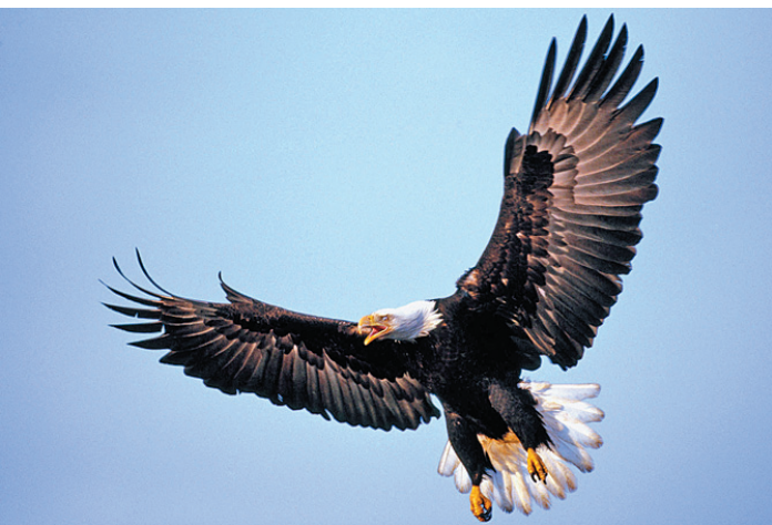
Размер крыльев орлана-белохвоста может превышать два метра.