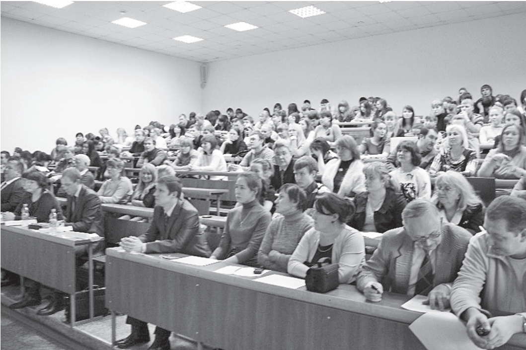
В академии проходит ежегодная научно-практическая конференция «Первая ступень в науке».

лось хорошее удобрение для бобовых трав.