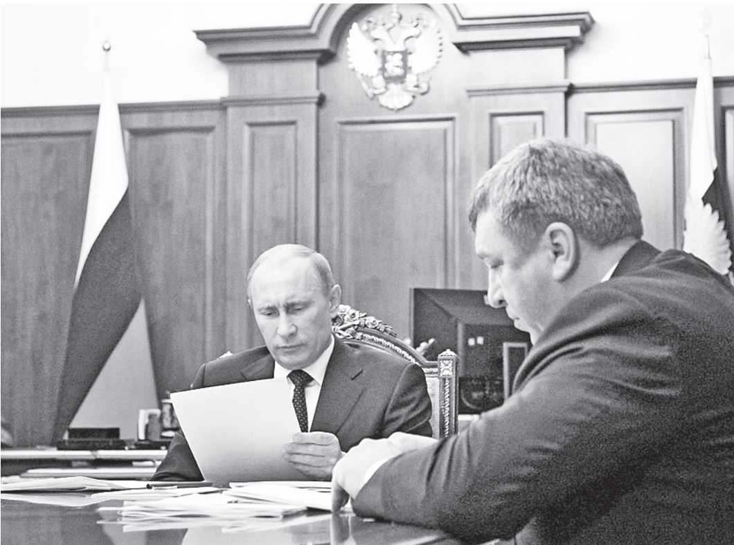
По требованию Владимира Путина может быть введено более жесткое ограничение по росту стоимости платежей за коммунальные услуги.