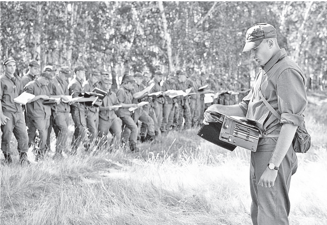
Идея прохождения военной службы студентами без отрыва от образования вызвала широкий резонанс в обществе.

Предполагается, что студенты ежегодно будут проходить службу в воинских частях по три месяца. На строевую и физическую подготовку будет отведено два часа в день, остальное время молодые люди будут учиться по военно-учетной специальности. Еще три месяца, которых не хватает для полного годичного срока службы, будут зачитаны как время обучения на военной кафедре. При этом части будут подбирать по тер-