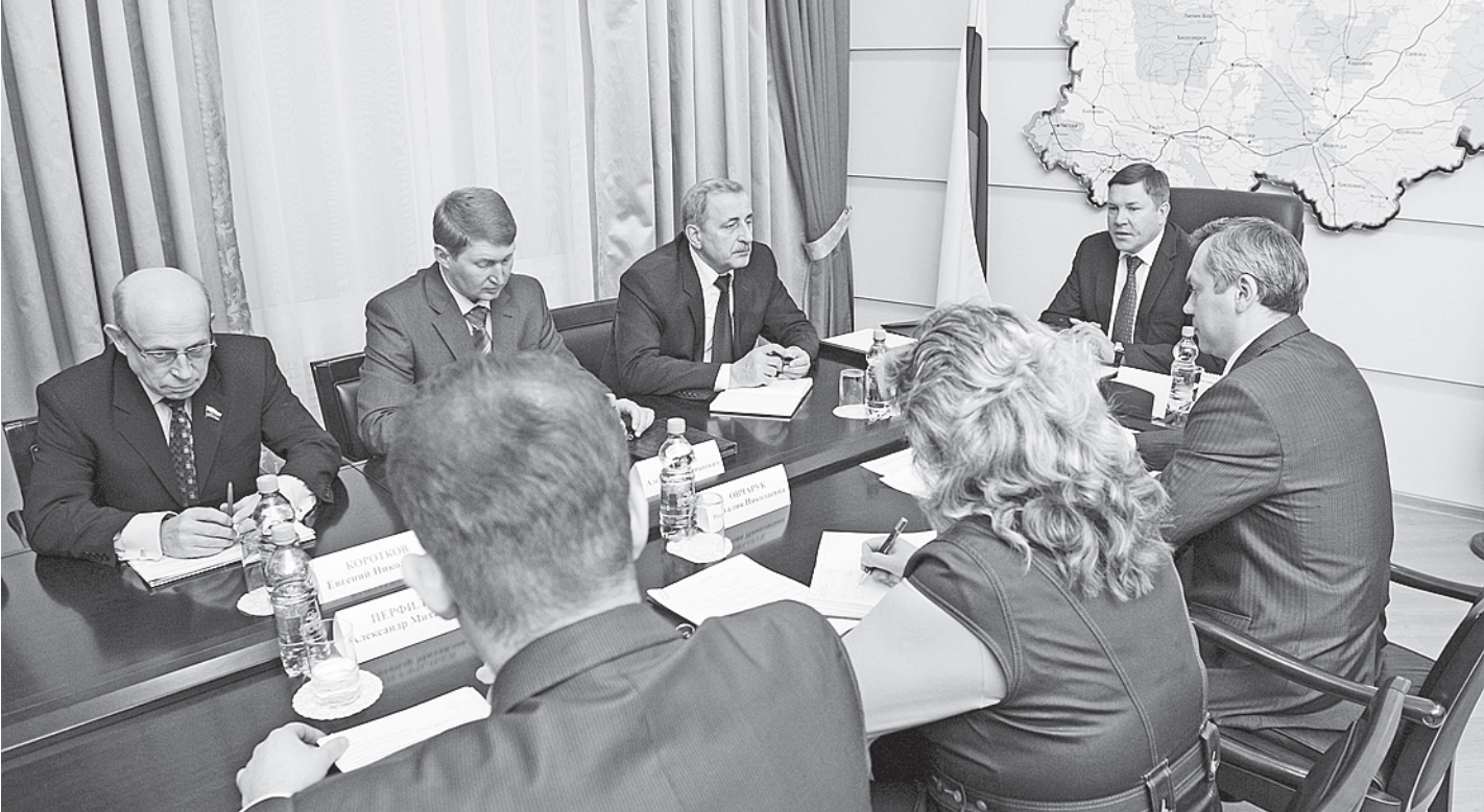
По словам Олега Кувшинникова, вся грантовая поддержка по линии департамента экономики должна быть сфокусирована на поддержке малого и среднего бизнеса в отрасли производства.

Инвестиционный совет был создан, чтобы определить приоритетные направления инвестиционного развития области, обеспечить эффективность инвестиционной политики. В состав Инвестиционного совета входят губернатор, члены правительства области, руководители ряда департаментов, депутаты Законодательного Собрания, директора крупнейших предприятий области и представители общественных организаций.