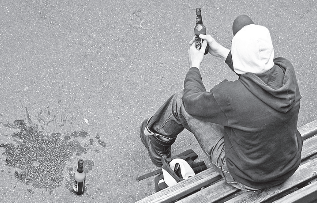
Ежегодно до полумиллиона россиян умирают от последствий употребления алкоголя.

- Смотрите, на прилавке большого супермаркета может быть около 3% контрафакта,