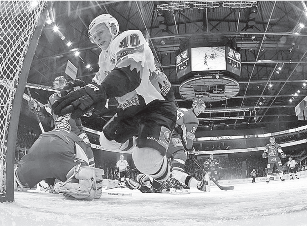
Борьба на пятачке была жаркой.