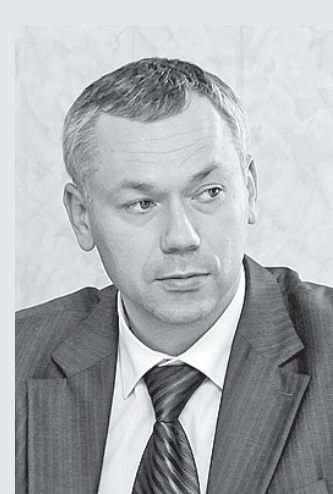
Андрей Травников, первый заместитель губернатора Вологодской области:

«В связи с увеличением выплат страховых взносов в Пенсионный фонд с 1 января 2013 года по всей России пошла волна снятия индивидуальных предпринимателей с учета. Очевидно, что при принятии этого решения не был проведен предварительный анализ. Сегодня мы отслеживаем количество предпринимателей и юридических лиц, снявшихся с учета. Но причины этого на основании имеющейся статистики мы проанализировать не можем. Некоторые политические силы пытаются подать это как особенность Вологодской области. В связи с тем, что в 2012 году мы были вынуждены предпринять меры по укреплению доходной базы бюджета, в том числе меры по ужесточению налогового администрирования, погашению задолженности. Мы знаем, что многие общественные предпринимательские объединения как в Вологодской области, так и в России в целом достаточно активно заявляют о том, что повышение страховых взносов было слишком резкое и поспешное. И в поддержку этого областные власти совместно с налоговой службой готовят аналитику по последствиям, к которым может привести увеличение налоговой нагрузки на бизнес».