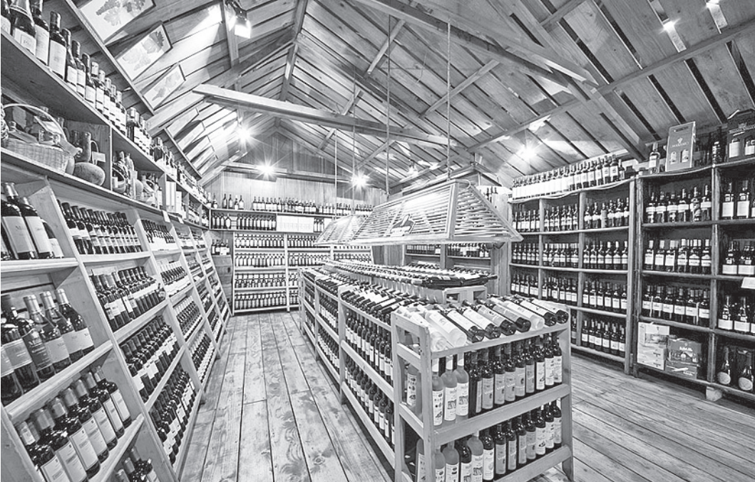
Возвращение грузинских вин в Россию может негативно сказаться на легальном рынке алкоголя.