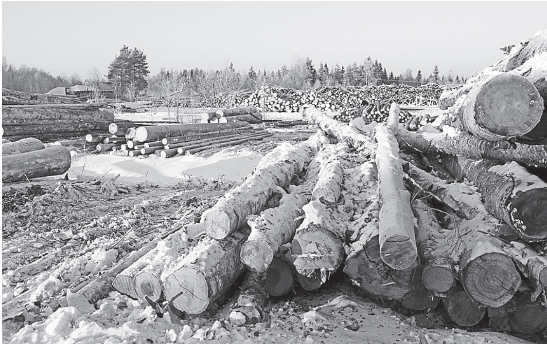
Местным предпринимателям выделяются участки для легальной заготовки древесины.