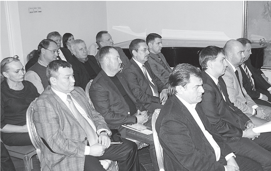
Представители Клуба делового общения намерены вкладывать силы и средства в развитие региона.