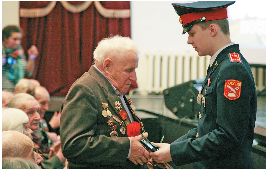
Молодое поколение равняется на тех, кто спас мир от фашизма.