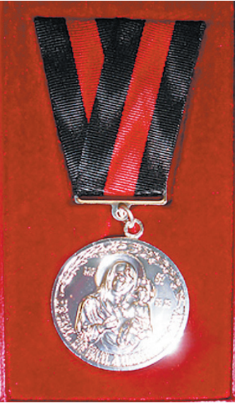
Медаль «В память 200-летия победы в Отечественной войне 1812 года».

Участникам мероприятия были презентованы новый вы-