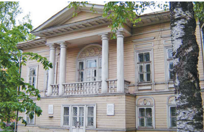
Дом Соковикова входит в число наиболее значительных деревянных построек Вологды.