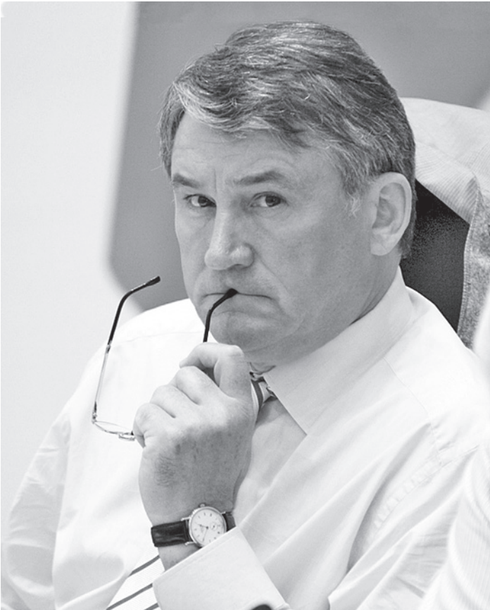
Юрий Воробьев: «Сегодня я все силы вкладываю в развитие Вологодской области».

всегда это возвращается потом добром. И уважением. Она причала к трудолюбию, поскольку сама верила, что в основе воспитания человека лежит труд. Отсюда и постоянная ежедневная работа, стремление эту работу сделать всегда хорошо.