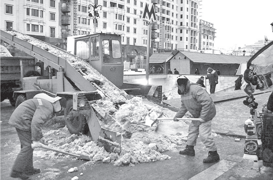
Ежедневная уборка Москвы обходится бюджету примерно в 300 миллионов рублей, и часть этих средств расхищается через фиктивные акты о выполненных работах.

уборка Москвы обходится бюджету примерно в 300 миллионов рублей и часть этих средств расхищается через фиктивные акты о выполненных работах, которые подписывают чиновники.