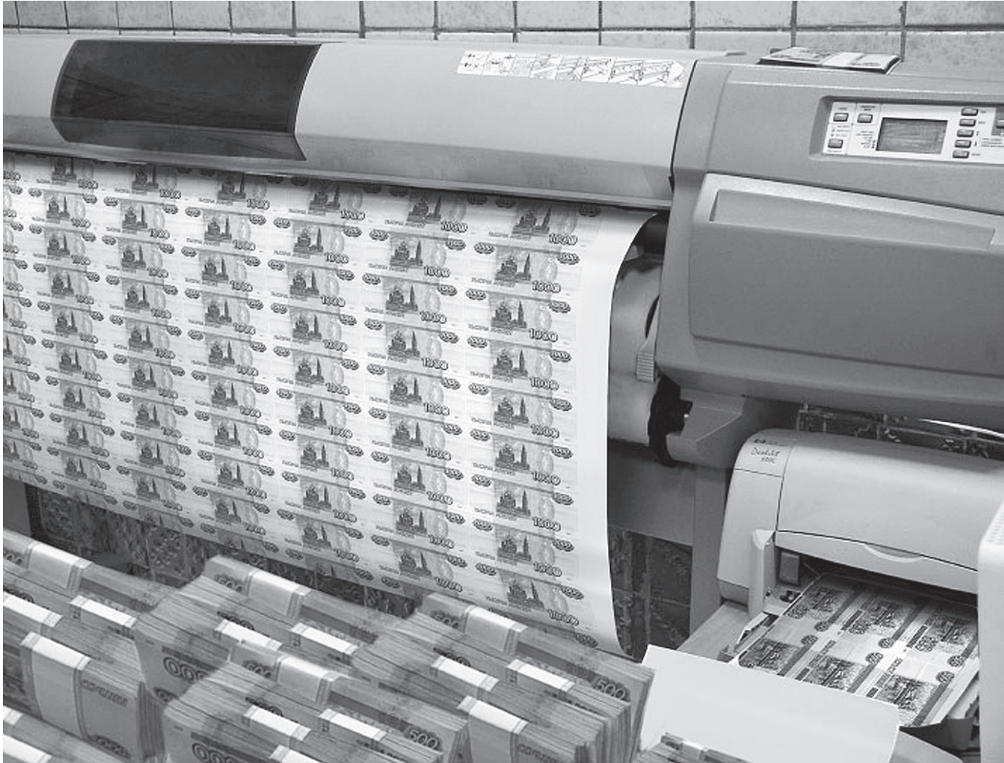
Правительство России стремится более эффективно использовать имеющиеся финансовые резервы.

К таким проектам могут быть отнесены проекты по строительству энергетических