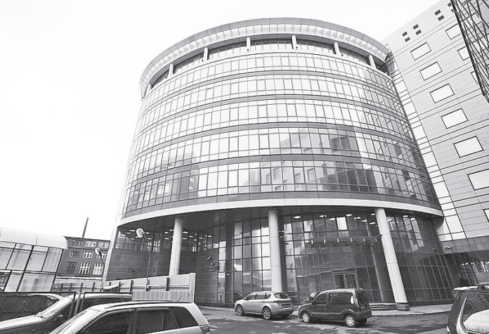
Введение налога с рыночной стоимости ударит в основном по крупному бизнесу, у которого в собственности много недвижимости в центре крупных городов.

Вводить аналогичные правила для бизнеса нужно, но сделать это с 2014 года не получится, считает чиновник Минфина: если установить единые правила, налог с организаций станет местным, а сейчас он полностью поступает в региональный бюджет. «У регионов останется только транспортный налог, непонятно, чем покрывать их потери», - говорит собеседник «Ведомостей». Нужно оценить такое имущество, чтобы определить ставку, объясняет он.