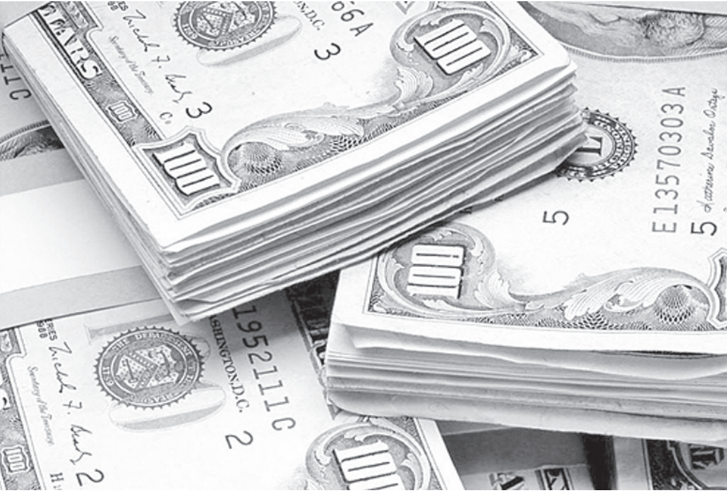
Специалисты наметили три варианта социально-экономического развития России до 2030 года, в соответствии с которыми доллар будет стоить 46,3 рубля, 42,4 рубля и 35,8 рубля.

По уровню доходов на душу населения к 2030 году мы догоним еврозону. Доля среднего класса к этому времени составит 48% от населения страны. В качестве основного критерия отнесения граждан к среднему классу министерство закладывает уровень дохода свыше 6 прожиточных минимумов. В 2030 году уровень дохода, позволяющего относиться к этой