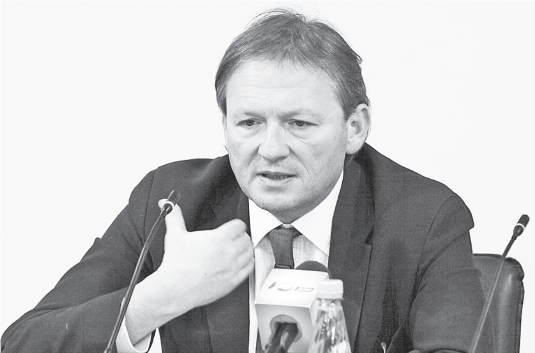
Борис Титов делает все возможное, чтобы права российских предпринимателей не были ущемлены.

«РБК-daily» ознакомились с первыми резонансными делами по ущемлению прав российских предпринимателей, на защиту которых встал бизнес-омбудсмен Борис Титов. Два бизнесмена пострадали от одного из самых популярных в регионах способов рейдерского захвата: власти обвинили предпринимателей по самой модной и удобной статье «Мошенничество» в похищении госсубсидий.