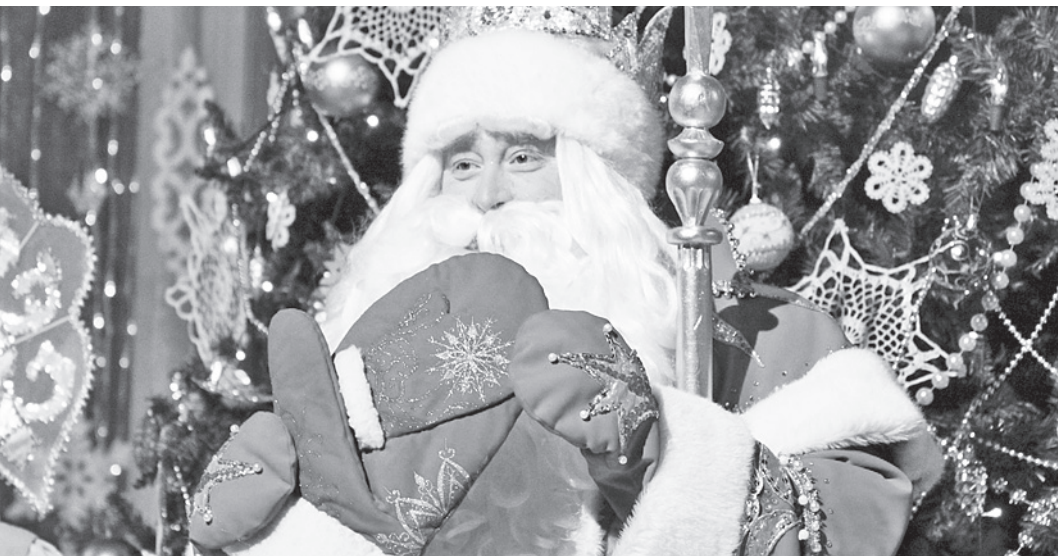
Зимний волшебник оставил в музее свои варежки как символ тепла и доброты.