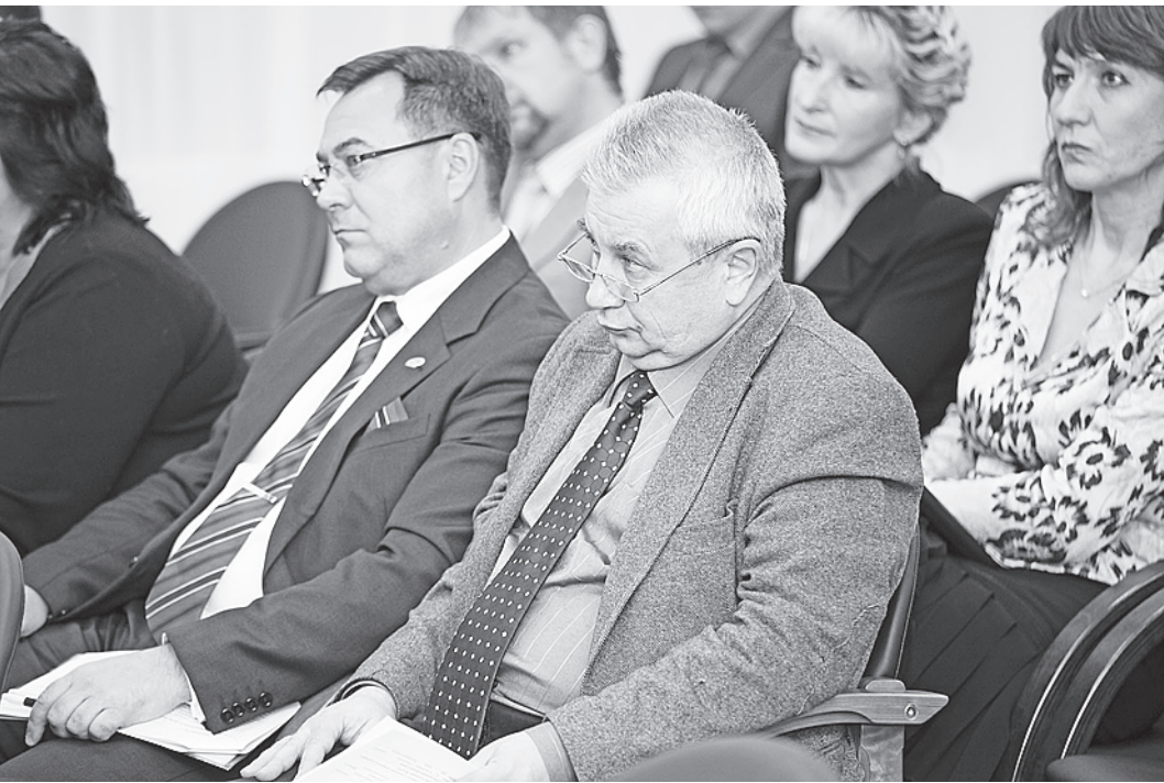
Участники заседания высказали целый ряд замечаний к разработчикам программы.

Третье направление дорожной карты - ежегодный мониторинг реализации прописанных мероприятий, которые, в случае необходимости, могут быть скорректированы.