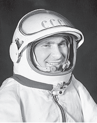
Воложанин Павел Беляев стал советским космонавтом № 10.

Каким он парнем был! Выставка «Космонавты первого набора», рассказывающая о малоизвестных страницах из жизни пока еще единственного вологодского покорителя орбитальных просторов Павла Беляева, открылась недавно в Подмосковье.