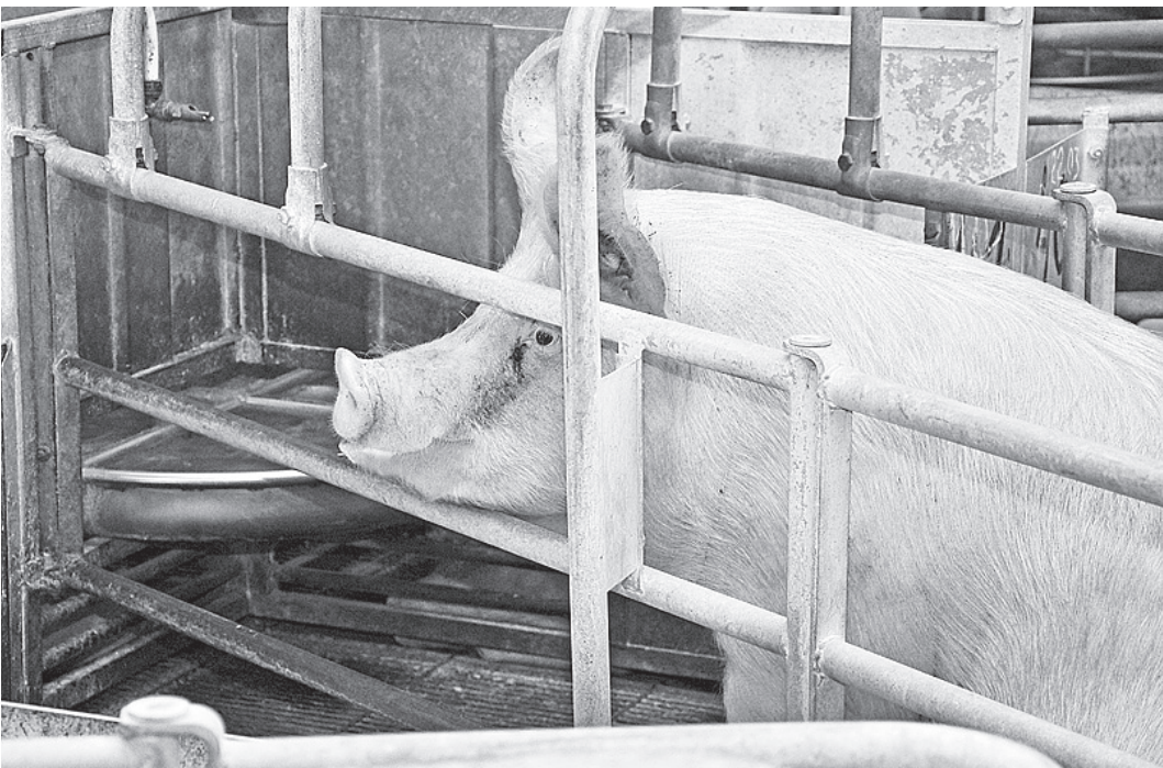
Свиноводческая деятельность на предприятии практически приостановлена.

- Аварийные многоквартирные дома не находятся в управлении управляющих компаний, плата за содержание и текущий ремонт общего имущества не начисляется. К сожалению, проводимые органами местного самоуправления открытые конкурсы по отбору управляющих компаний из-за отсутствия претендентов на такие дома объявляются несостоявшимися и обязанности по выполнению таких работ никто не несет. Тем не менее часть неотложных ремонтов выполняется и в таких домах. КС