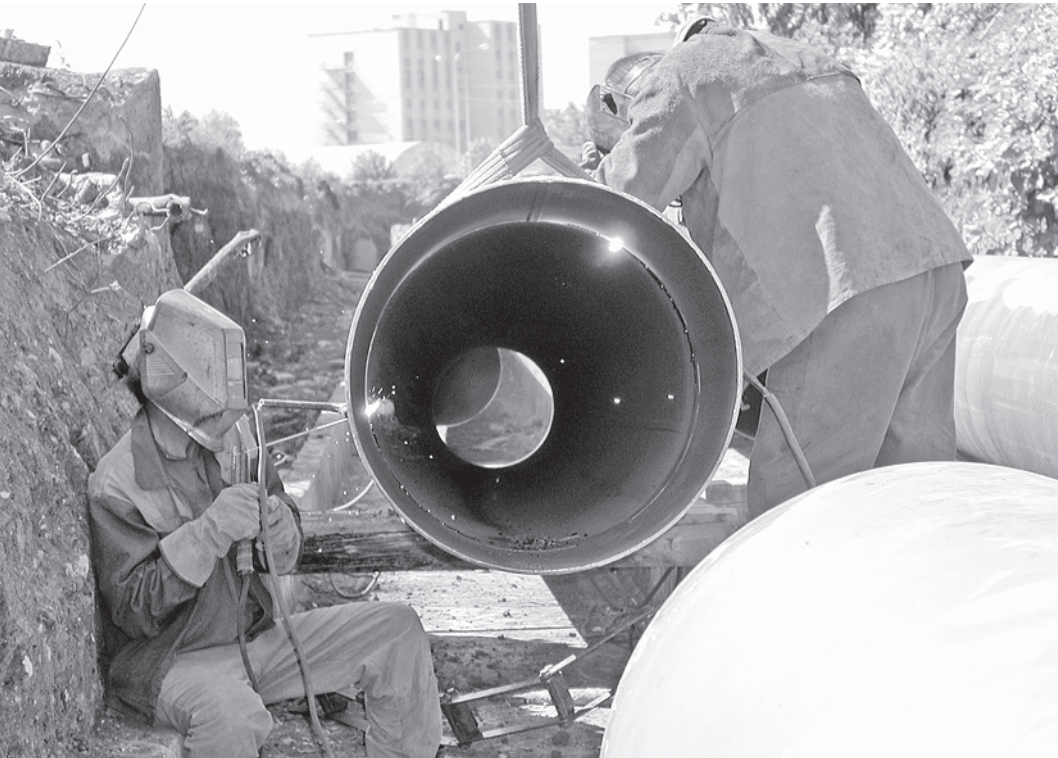
Более 25 километров тепловых сетей заменены на новые.

- Нормативы потребления холодного и горячего водоснабжения, водоотведения ра-