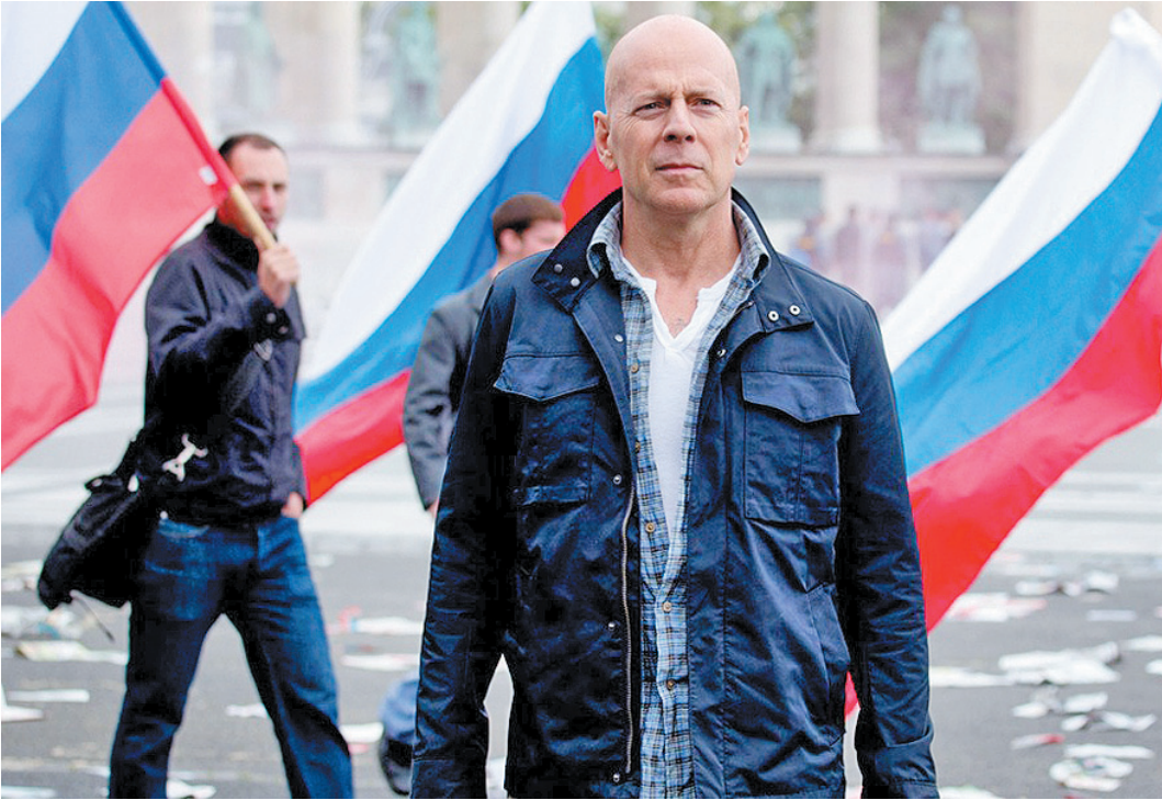
Приключения Брюса в Москве только начинаются.

Как это ни странно для кинофраншизы, но каждая часть «Крепкого орешка» получается лучше, ярче предыдущей. Первый фильм о лысеющем детективе был по большому счету обычным боевиком в стиле поздних 80-х, где мужик со стальными мускулами крушит своих врагов направо и налево. Второй фильм превратил историю в очень прилично скроенный триллер с массой нестандартных ситуаций и сцен, от которых у зрителя просто захватывало дух. Третья лента с ее тикающими бомбами, мусоровозами с золотом и актерским тандемом Уиллис - Джексон вообще вошла в число лучших триллеров 90-х. Казалось, дальше-то куда? Но зрительский успех трилогии и желание в очередной раз подзаработать сподвигли продюсе-