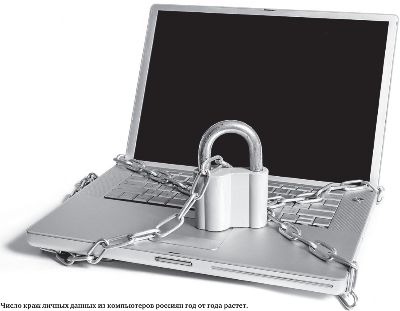
Число краж личных данных из компьютеров россиян год от года растет.

Правда, даже этого порой не бывает достаточно. В сере-дине января была обезвреже-на группа хакеров, взламывав-ших серверы государственных ведомств, банков, крупных тор-говых компаний по всему миру.