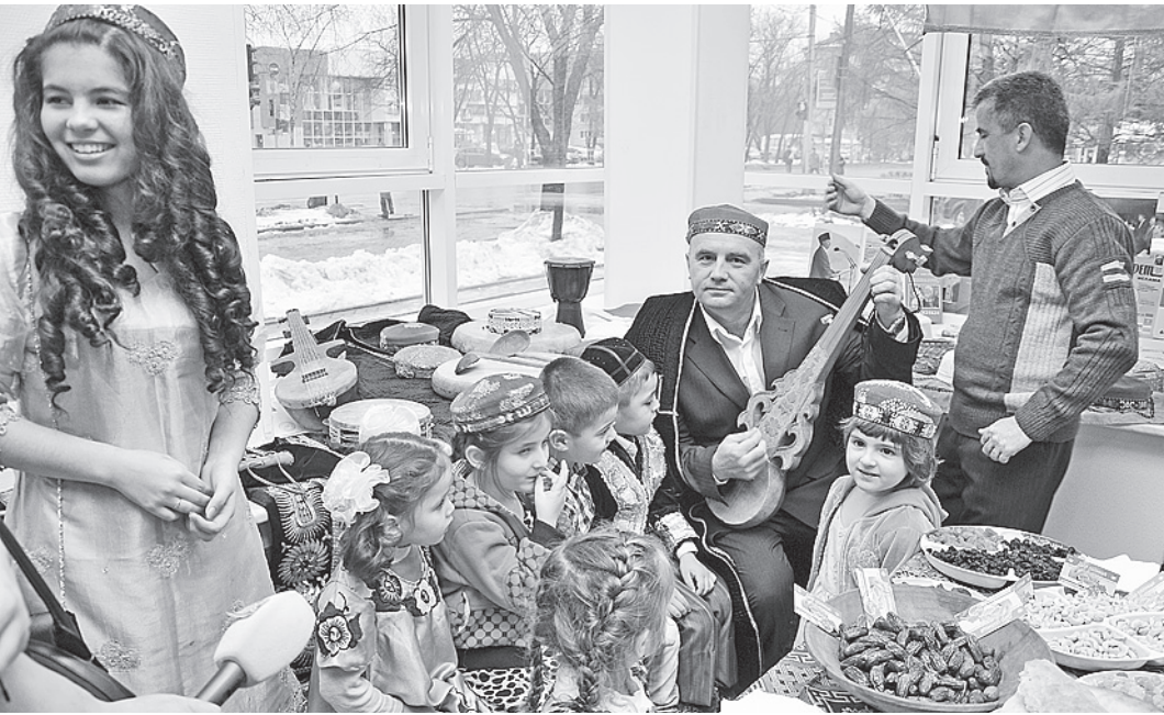
В Вологодской области регулярно проводятся мероприятия, направленные на сближение народов.

это стало темой серьезного обсуждения на заседании.