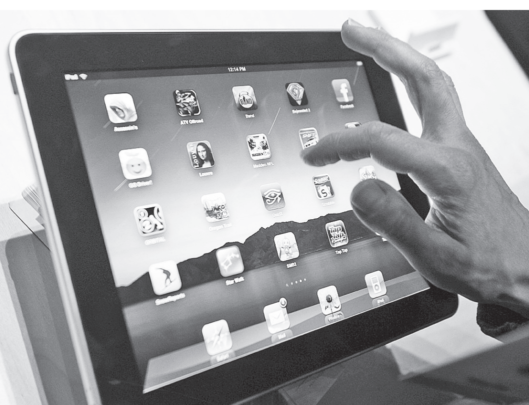
В применении систем защиты нуждается не только стационарный компьютер, но и переносные цифровые устройства.

Другим вариантом защиты данных является покупка внеш-них дисков и накопителей со встроенными средствами шиф-