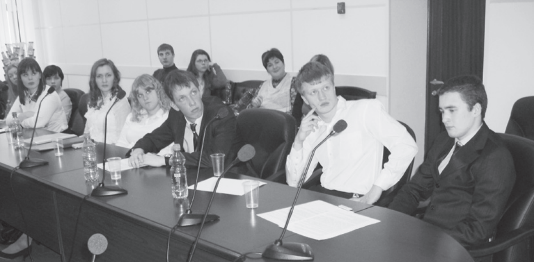
Участники проекта «Команда Губернатора: Ваша оценка» защитили перед экспертами свои социальные проекты.

13 марта определится десятка победителей. Помимо губернаторской стипендии им будут предложены вакантные места в органах государственной и муниципальной власти в Вологодской области. КС