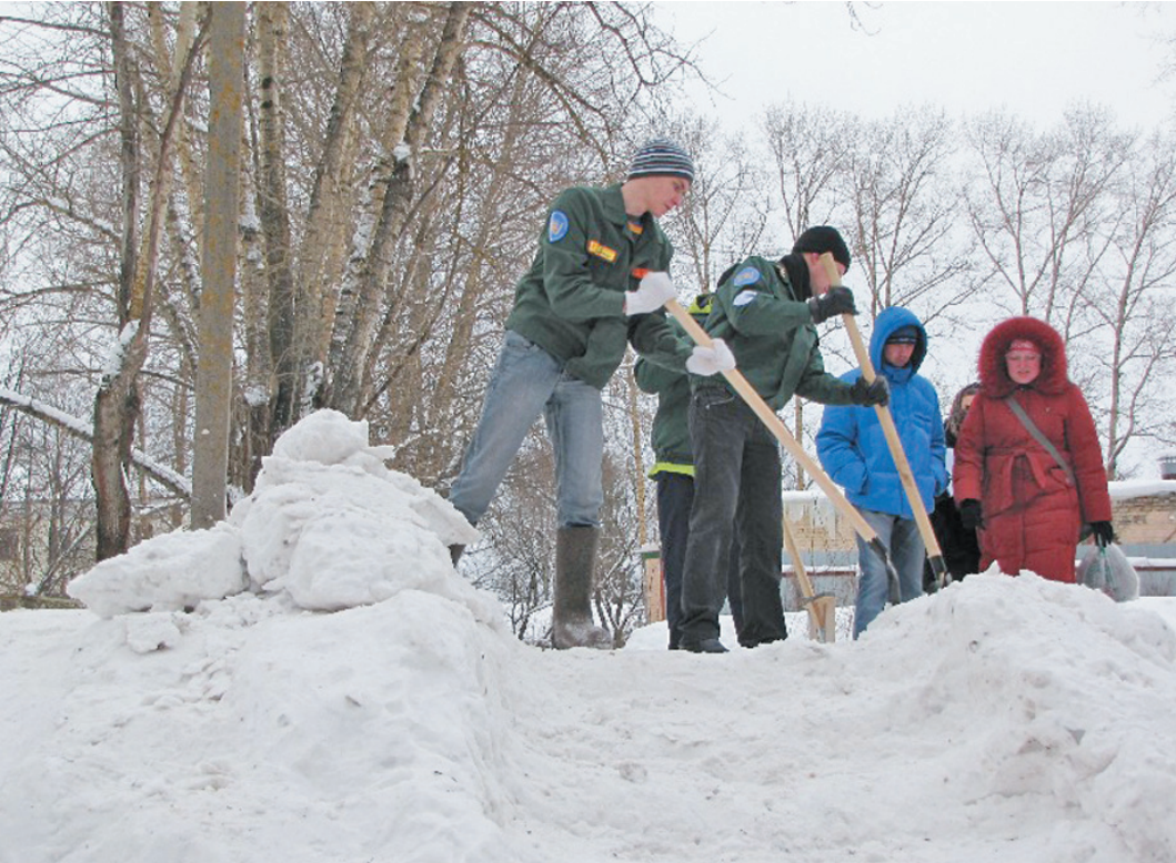
Огораживающий горку бортик почти готов.