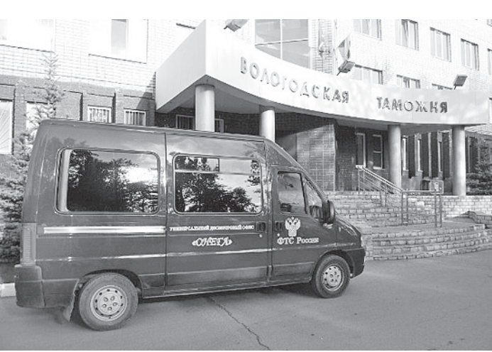
Реорганизация затронула и Вологодскую таможеню.

Штат Вологодской таможни, где до последнего времени работали 224 сотрудника, после 5 февраля уменьшится больше чем наполовину: теперь в Вологодской области останутся 102 таможенника.