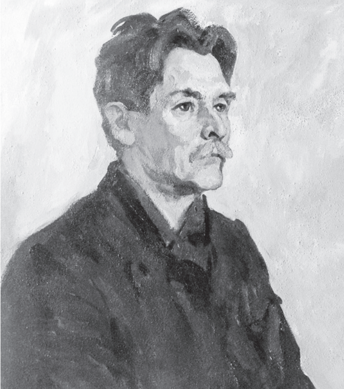
В. Н. Корбаков. «Портрет поэта Яшина». 1966.

«Вологодская областная картинная галерея уже давно собирает разножанровый материал об А. Яшине. То, что любил писатель, о чем он писал, то, чем гордился и о чем болел душой, нашло свое воплощение в выставке. Вологжанам будет представлено более 200 работ - тематические картины и портреты писателя, пейзажи и натюрморты, скульптура, декоративно-прикладное и народное искусство, современная иконопись, выполненные художниками из Вологды, Череповца, Великого Устюга, Сокола, Тотмы, Грязовца и Сямжи. Организация выставки «Спешите делать добрые дела...» - это не только дань памяти Александру Яковлевичу, но и возможность показать все многообразие духовно-творческого облика земли вологодской. Творчество художников-вологжан является закономерным продолжением культурных традиций Русского Севера, отличается боль-