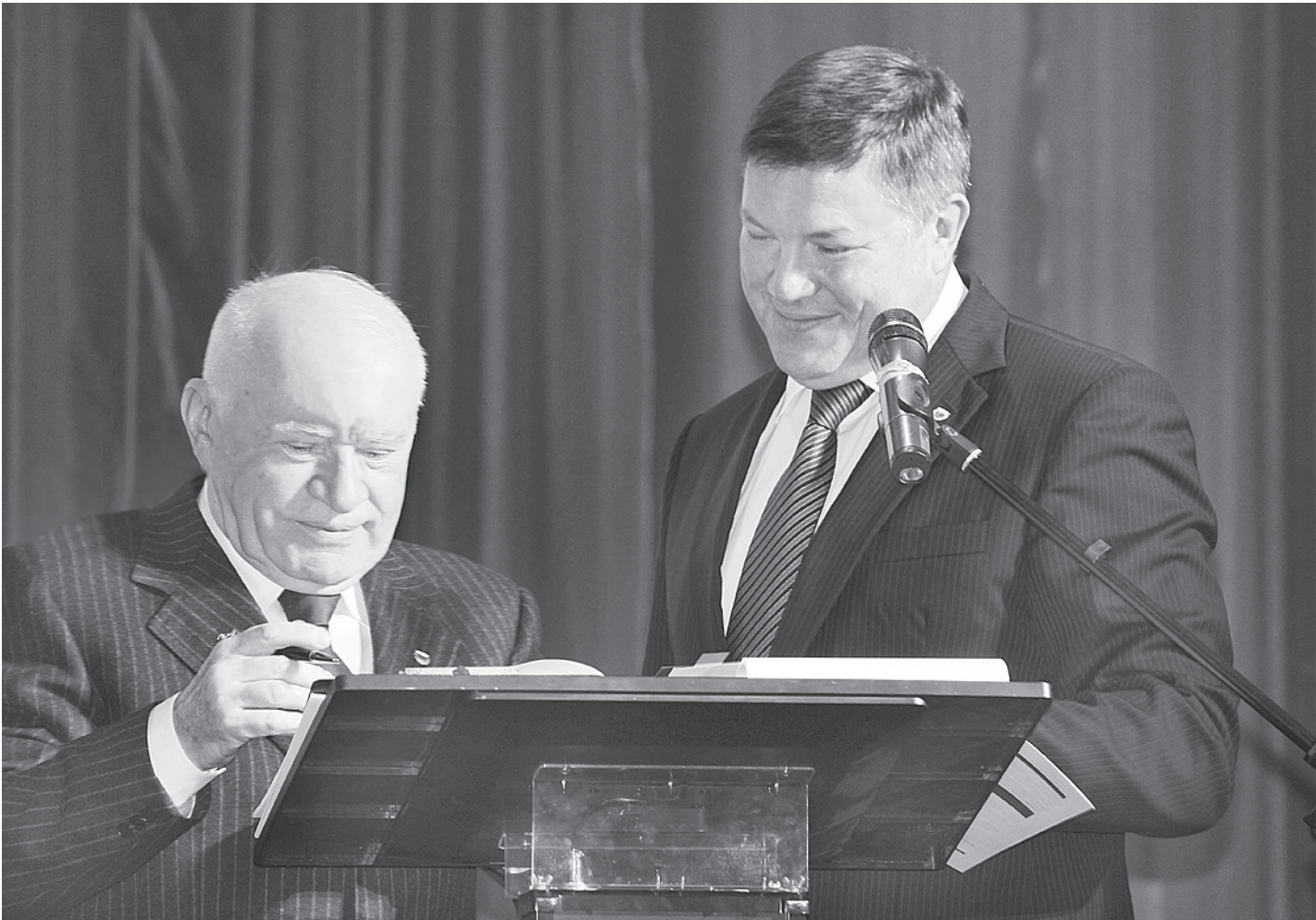
Свои подписи под соглашением поставили известный врач, президент «Лиги здоровья нации» Лео Бокерия и председатель Российской ассоциации «Здоровые города, районы и поселки» Олег Кувшинников.

Организируются обучающие конференции по развитию программ формирования здорового образа жизни, семинары и «круглые столы», в которых участвуют члены правительства области, депутаты Законодательного Собрания, руко-