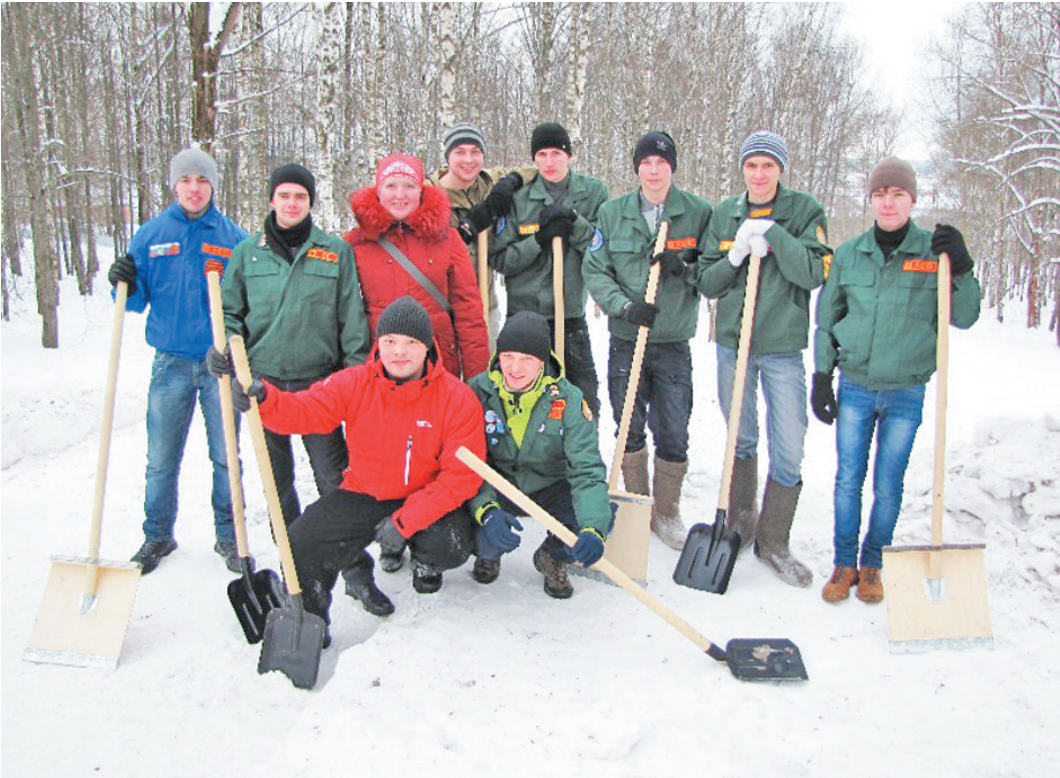
Общими силами студентов горка будет реконструирована к ближайшим выходным.