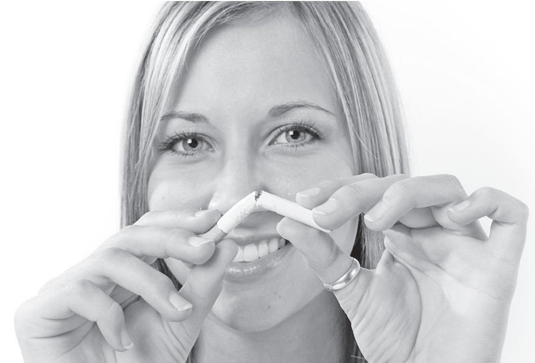
Антитабачный закон окончательно может быть принят уже этой зимой.

Придется подстраиваться под новый закон и владельцам кафе и ресторанов.