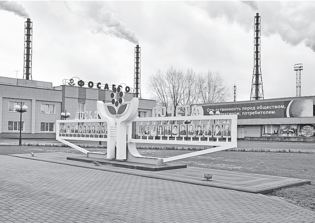
Руководство группы «ФосАгро-Череповец» расширяет круг потенциальных инвесторов.