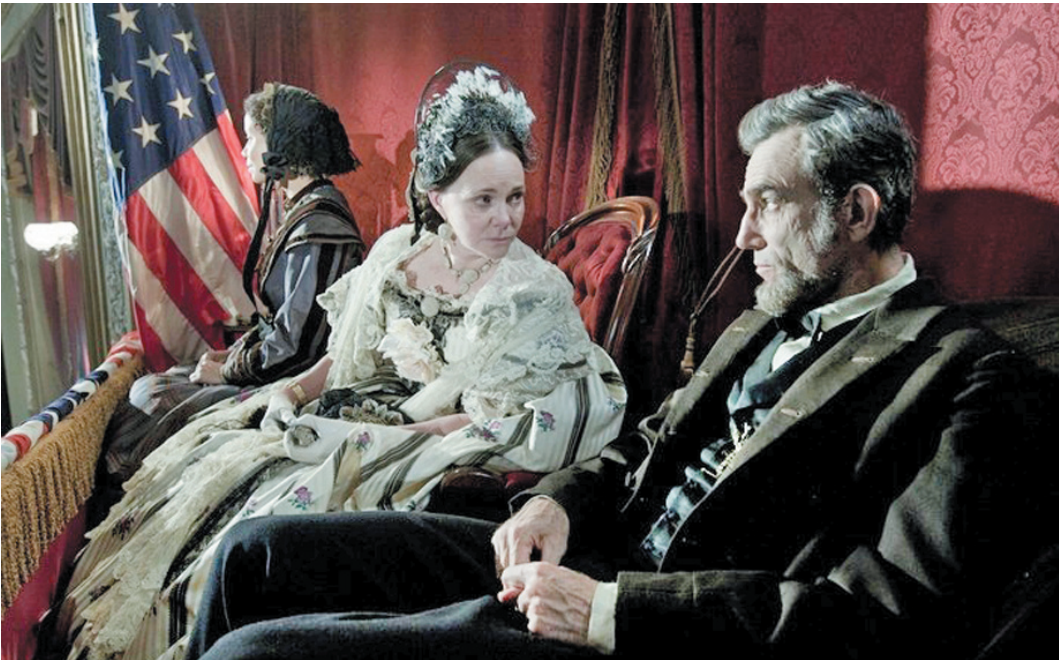
Президент, супруга и американский флаг.

Для создания сценария был «выписан» уже знакомый Стивену по работе над драмой «Мюнхен» Тони Кушнер.