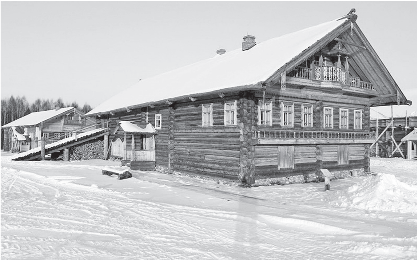
Проект «Мы, собравшись, постановили» будет реализован на базе «Дома Храповых» архитектурно-этнографического музея «Семенково».

Вместе с тем выборная должность, к примеру старосты, налагала на человека массу обязанностей. Не освобождала она и от уплаты многочисленных податей. Поэтому желающих занять этот сельский «пост», как и должность десятника (выборное должностное лицо из крестьян, исполнявшее полицейские обязанности - прим. ред.), было не так уж много. Другое дело, что самоотводы в ту пору практически не применялись.