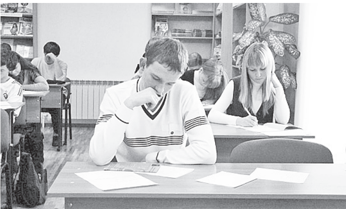
Победители регионального этапа олимпиады будут представлять Вологодчину на российском уровне.