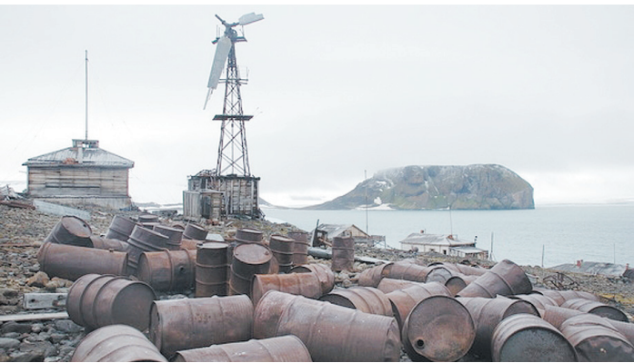
С Земли Франца Иосифа в Арктике необходимо вывезти очень много металлолома и прочего мусора.