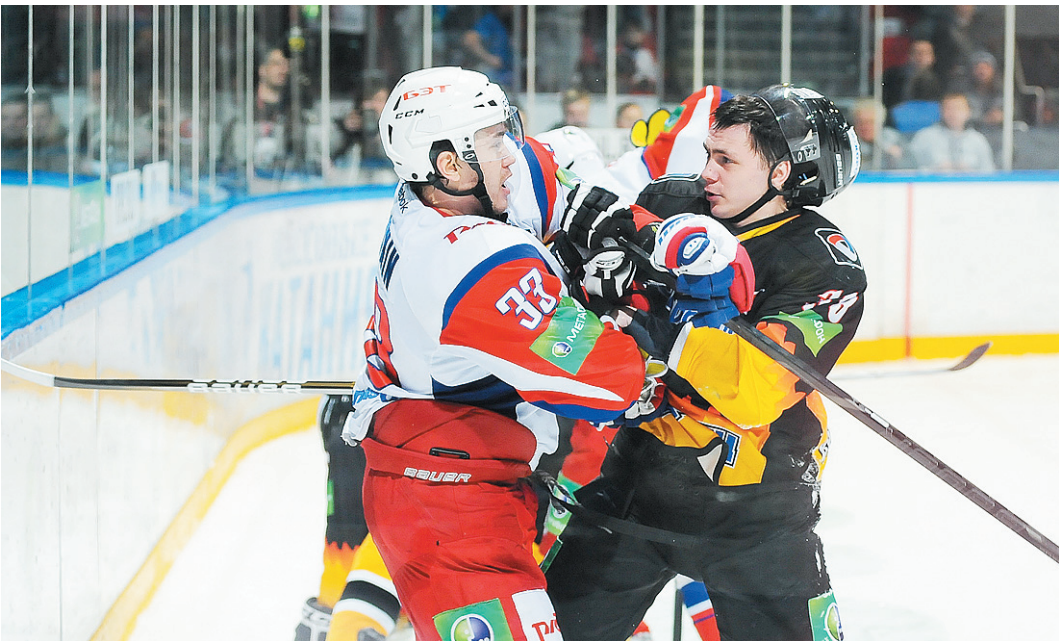
Борьба на площадке была очень напряженной - никто не хотел уступать.

ботали одно очко, показав достойную игру.