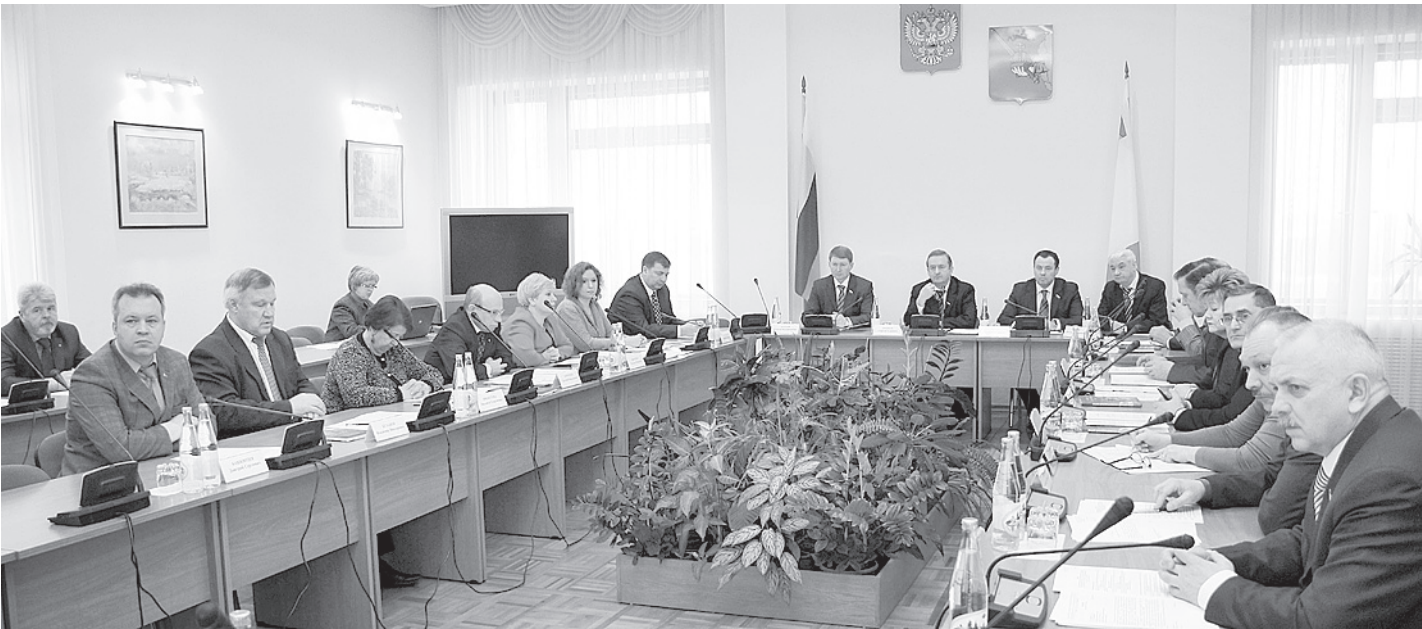
На коллегии звучали разные мнения о том, как заставить педагогов соблюдать обязательства социального контракта.

Определили депутаты и предварительный список других вопросов, которые будут вынесены на рассмотрение в