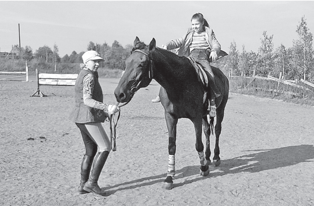
Участники проекта «Океан надежды» на занятиях в конноспортивном клубе «Виват» поселка Молочное.

ны центром для реабилитации детей-инвалидов. В конкурсах участвуем ежегодно. Один выиграем, тут же готовимся участвовать в другом. В 2011 году участвовали в 11 конкурсах и восемь из них выиграли. Из крупных это четвертый грант. Первым был проект «Социальная гостиная». Полученные деньги позволили обустроить помещение в центре для женщин, оказавшихся в трудных жизненных ситуациях. За счет Федеральной программы «Дети России» и при финансовой поддержке департамента социальной защиты населения Вологодской области Центр социальной помощи