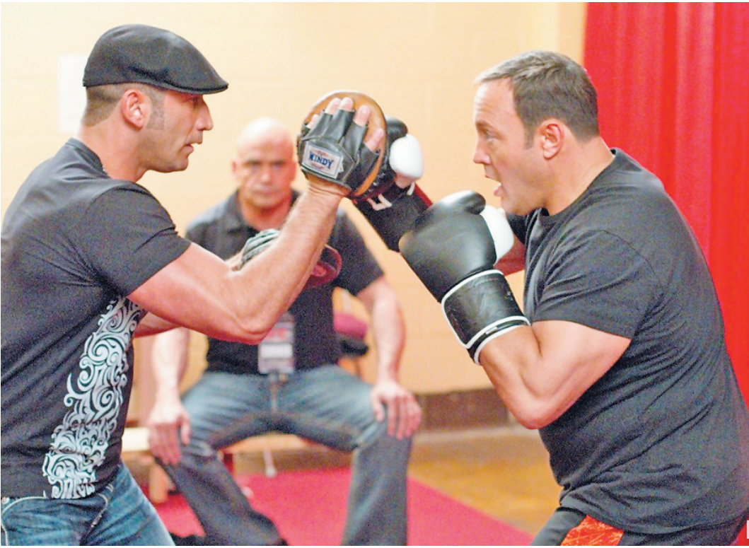
Тренировки лучше всего начинать с классического бокса.

Самое сложное и опасное, что есть в мире единоборств, - бои смешанного стиля. Здесь могут надрать кое-что десятками разных способов: от классического бокса и каратэ до тайских боевых практик и боевого самбо. Разумеется, интерес зрителей к соревнованиям, в которых участвуют лучшие атлеты - представители абсолютного всех боевых искусств - просто огромен. Логично, что и гонорары у рестлеров здесь самые большие. Также решил и скромный учитель биологии из самой обычной средней американской школы. Чтобы каким-то образом наскрести деньги на