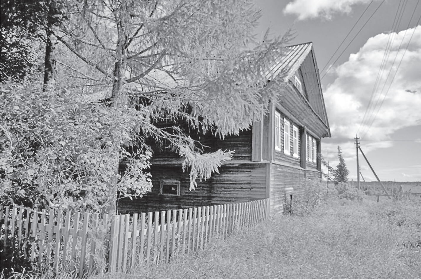
Дом писателя Белова в деревне Тимониха Харовского района. Август 2012 года.

Василий Белов любил своих земляков, свою родину, он старался понять основы русской национальной жизни. Эта любовь к России, ее истории и героям, ее фольклору и быту естественно привела писателя к Православию. В этом Василий Белов повторил путь таких выдающихся сынов России, как Александр Сергеевич Пушкин, Федор Михайлович Достоевский и многие другие. Люди большого таланта, незаурядного интеллекта не могут не прийти к