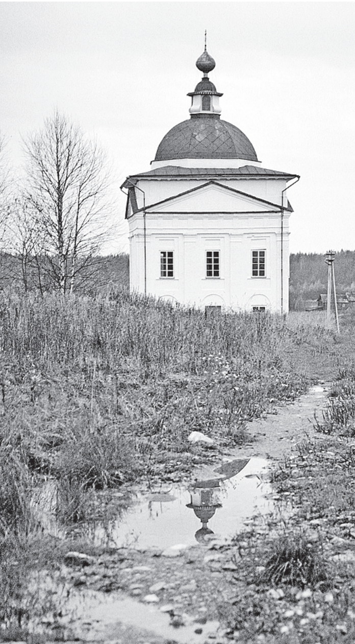
Никольский Сохотский храм. Октябрь 2012 года.

Гражданская панихида пройдет в Вологодском областном драматическом театре 7 декабря, с 8.00 до 10.30. Василий Иванович Белов будет похоронен в деревне Тимониха Харовского района.