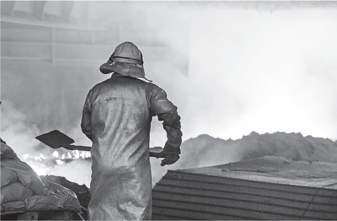
Продолжающийся кризис в еврозоне может привести к закрытию четверти сталелитейных мощностей и сокращению 100 тысяч человек.

Аналитики уверены: закрытие одного лишь итальянского предприятия ILVA будет иметь последствия для всей мировой экономики. Какие же отголоски последуют, если работу прио-