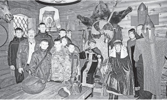
Яркие впечатления остались у кадетов от поездки в Белозерск.

«Шли солдаты на войну». Танцуют мальчишки замечательно! - Давно не было такого концерта. Радостно видеть на сцене столько юношей, будущих военных, патриотов Отечества. Ребята доказали, что их школа достойна носить имя Белозерского полка. Приезжайте к нам почаще с такими концертами! Кадеты не теряли времени даром - ознакомились с экспозициями Белозерского областного краеведческого музея, музея «Княжеская гридница», совершили экскурсию по территории кремля, одним словом, собирали необходимую информацию о Белозерском полку. В течение учебного года запланировано участие кадет-