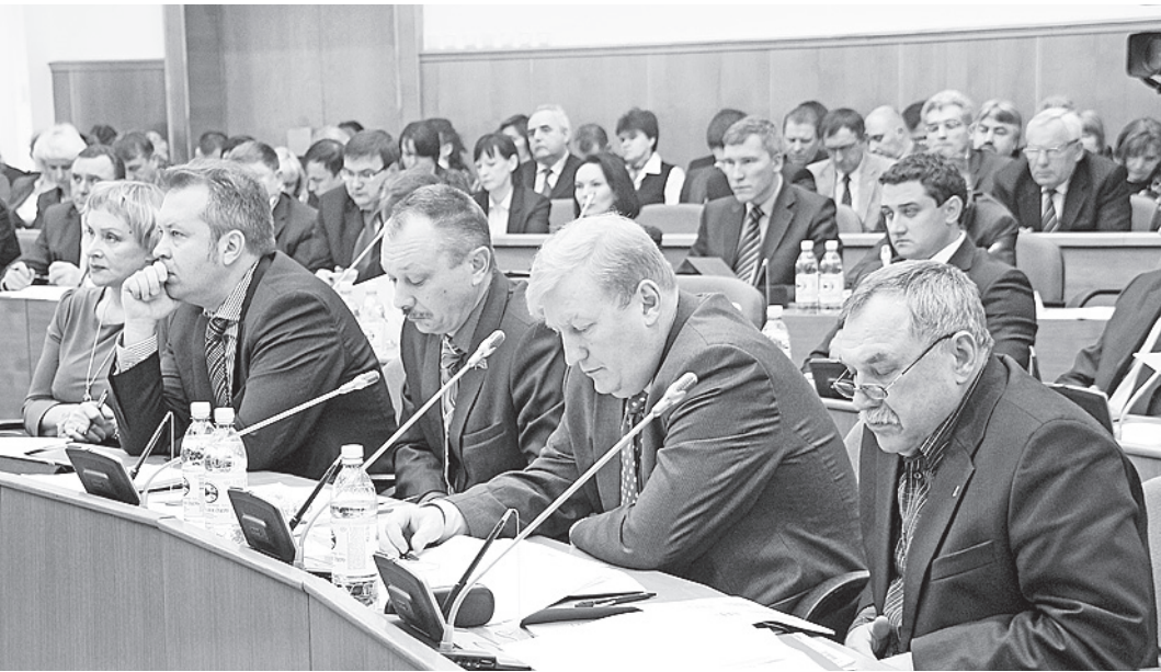
Участники слушаний отметили, что бюджет 2013 года останется социально ориентированным.

Бюджет вновь будет социально ориентированным. К примеру, расходы на образование составят 14-15 миллиардов рублей. Более восьми миллиардов из них - по программе развития образования: 5,5 - на общее и дополнительное образование, 1,4 миллиарда - на