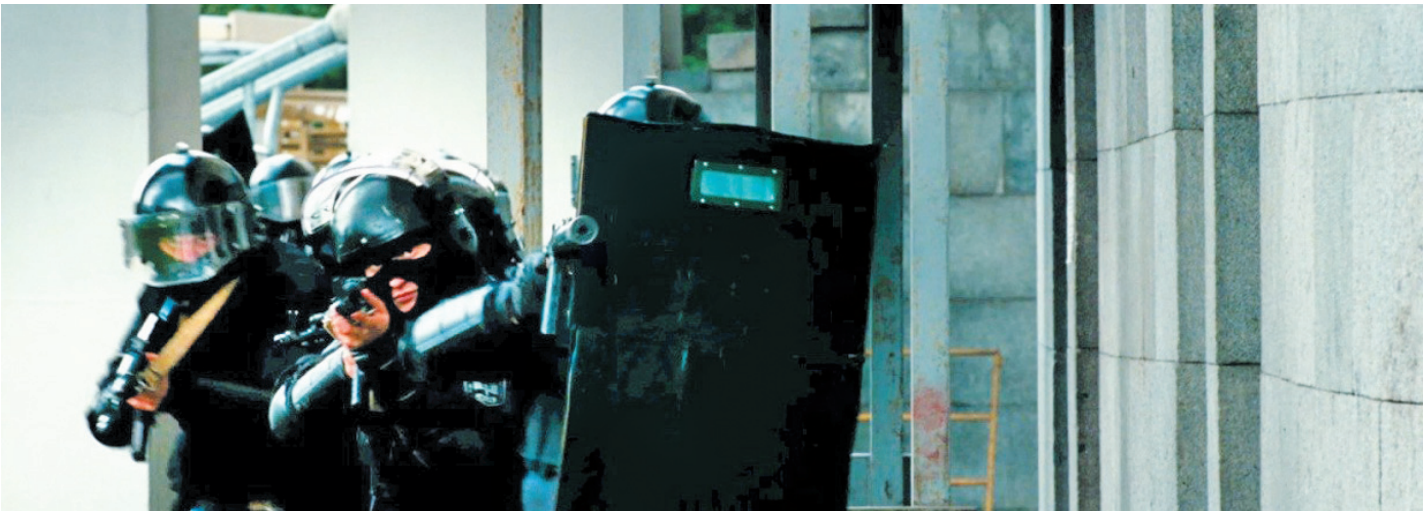
Продолжение легендарного сериала вышло довольно средненьким.

История ленты крутится вокруг супруги и сына Саши Белого. Семья криминального авторитета живет в Америке и пытается забыть все, что связано с Россией и делами, которыми ворочал в этой стране герой Безрукова. Но по зову крови и, разумеется, по бизнес-делам отпрыск Белого приезжает в Москву. И тут его начинают пресовать бывшие «товарищи» отца. Логично, что у паренька выиграла гордость и проснулось чувство мести тем, кто подставил папашу. Ну а дальше вы все знаете: погони, разборки, перестрелки, парочка любовных интриг, большие деньги и итоговое отмщение. Сразу предупреждаю: те,