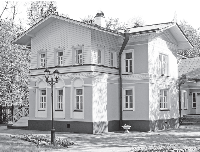
Построенный в XIX веке «Дом Милютинна» считается культурным памятником регионального значения и ныне используется как музей.

Есть в центре Череповца и даже свой дом Высоцкого. И хотя популярный бард в 1978 году действительно приехал на гастроли в город металлур-