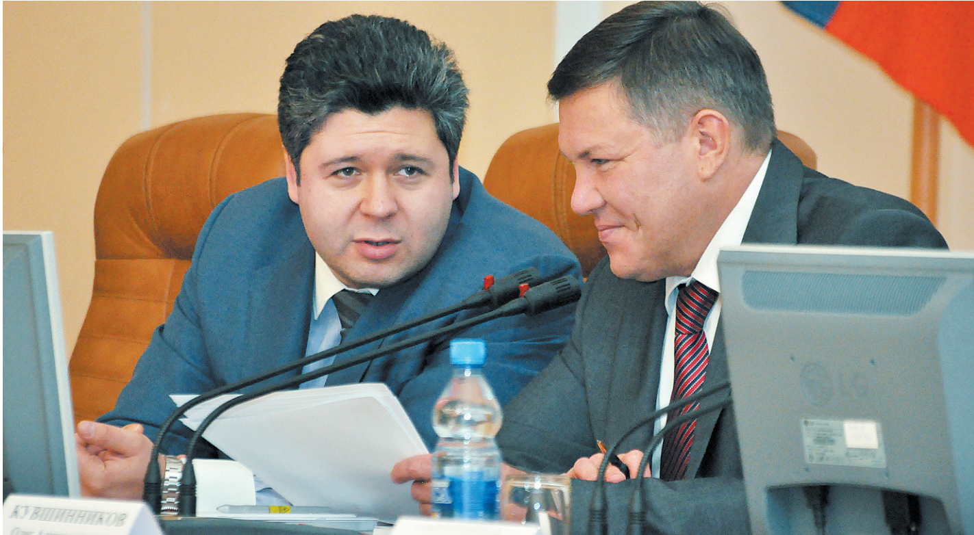
Член Общественной палаты РФ, директор некоммерческого Фонда исследования проблем демократии Максим Григорьев и губернатор Олег Кувшинников.

- Стратегические направления построения нового качества власти, как открытой, эффективной и ответственной, были обозначены мной в начале 2012 года и определили работу правительства области, - говорит Олег Кувшинников. - Я считаю, что новое качество жизни в регионе невозможно без изменений власти, без диалога между властью и обществом. За это время для оперативного решения проблем вологжан была создана онлайн-приемная губернатора - практически 50% из 11,5 тысячи поступивших ко мне обращений были направлены именно в онлайн-режиме. На сайте правительства появились форумы заместителей губернатора. Был реализован про-