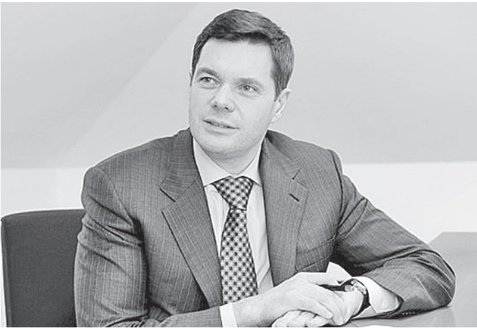
Алексей Мордашов: «Северсталь» продемонстрировала в третьем квартале достойные результаты».

Неблагоприятные для металлургов тенденции на рынках сбыта стальной продукции сказались и на финансовых результатах ОАО «Северсталь». За 9 месяцев с начала 2012 года выручка компании по сравнению с прошлогодними показателями сократилась на 9%, прибыль - на 42%. На этом фоне особым образом стоит дивизион «Северсталь Российская сталь», который сумел в третьем квартале за счет увеличения продаж металлопроката компенсировать потери от снижения цен.