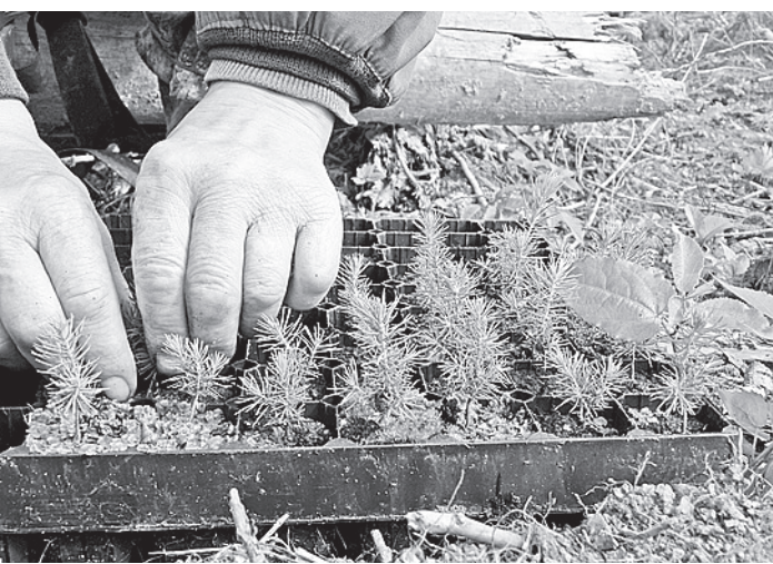
В этом году в вологодские леса по новой технологии было высажено более одного миллиона саженцев ели.