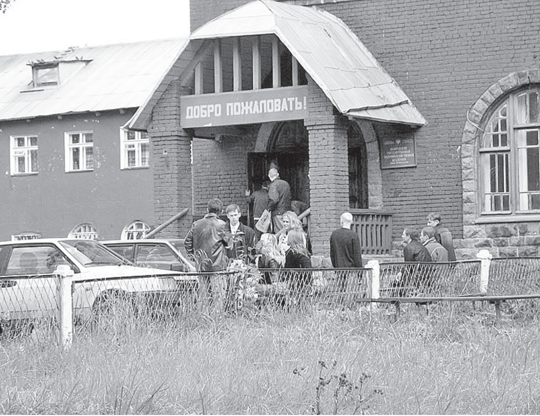
Руководству ВГМХА рекомендовано представить программу развития по устранению признаков неэффективности.