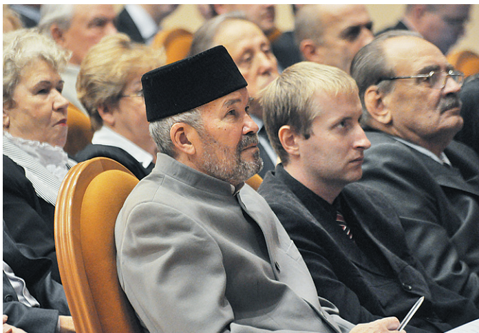
Участники Гражданского форума.