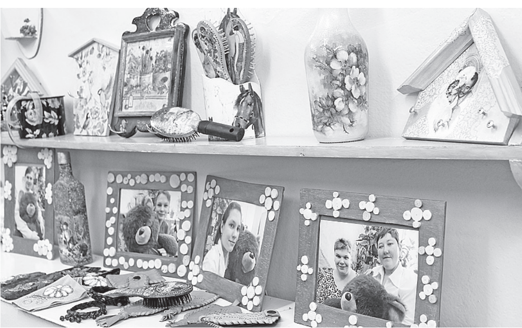
Оригинальные рамки для фотографий ребята сделали самостоятельно.