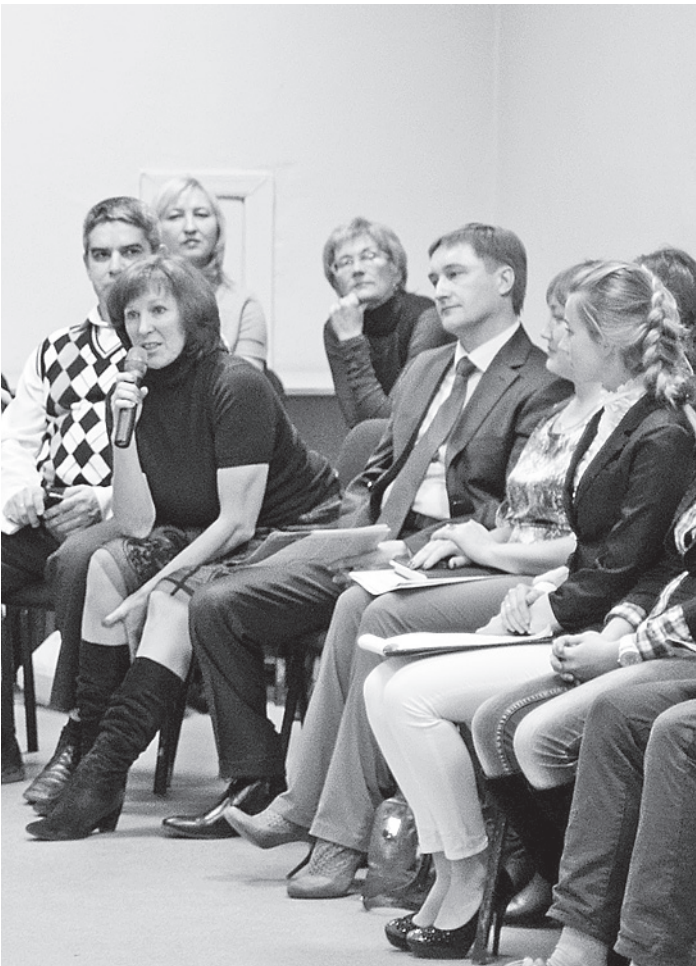
Состоявшиеся предприниматели пообещали будущим бизнесменам протянуть руку помощи и даже поддержать финансами.