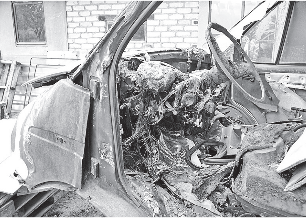
Злоумышленники обливали бензином моторный отсек и поджигали.

В настоящий момент устанавливаются истинные мотивы преступлений, а также степень вины каждого из семи подозреваемых. По ходатайству следствия судом заключены под стражу сам заказчик, а также два исполнителя. В отношении участников группы возбуждено уголовное дело по части 2 статьи 167 Уголовного кодекса («Умышленное уничтожение или повреждение чужого имущества»). Кс