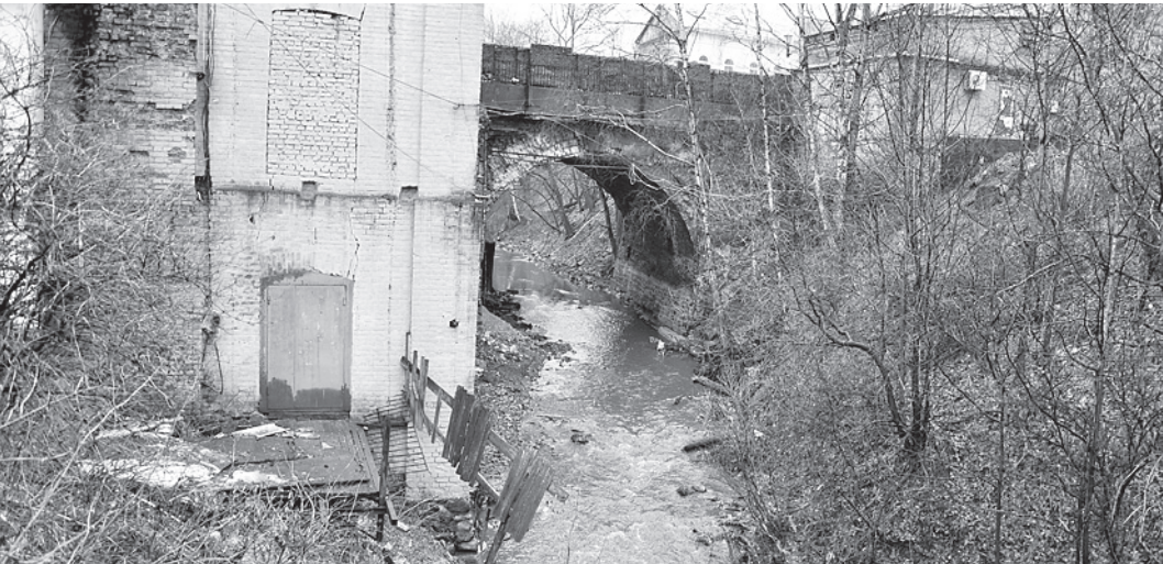
Даже маленькая речка может представлять большую угрозу.

Как пояснила старший помощник руководителя регионального следственного управ-