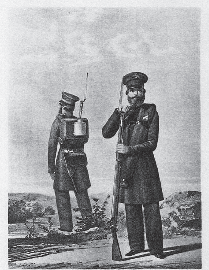
Так выглядел в то время вологодский стрелок-ополченец.

- Думаю, порядка 5000 человек, из них 4500 - рядовые солдаты. Среди офицеров отме-