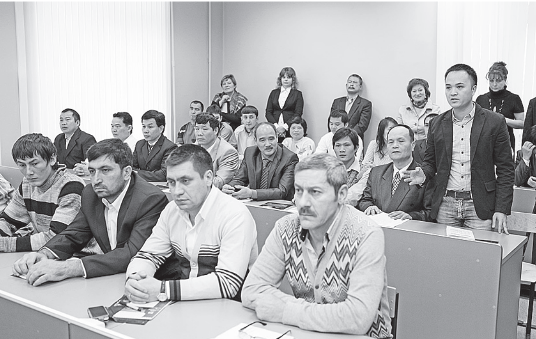
Сертификат, который иностранным гражданам выдадут в школе мигранта, позволит им в дальнейшем получить разрешение на работу.

Проект «Школа мигранта», который реализуется в нашей области, как раз направлен на обучение трудовых мигрантов основам русского языка, куль-