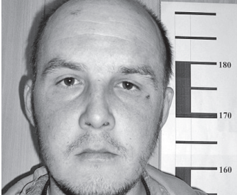
Подозреваемые в совершении мошенничества.

договаривались о покупке имущества с рассрочкой платежа. Как правило, граждане соглашались, так как покупатели оставляли расписки, куда вписывали из паспортов свои настоящие данные, и оговаривали срок, до которого требовалось расплатиться. Но, получив товар, молодые люди исчезали. Как выяснилось, имущество воложан они реализовывали, а вырученные деньги тратили по своему усмотрению. Свою деятельность, по данным полиции, предприимчивые пе-