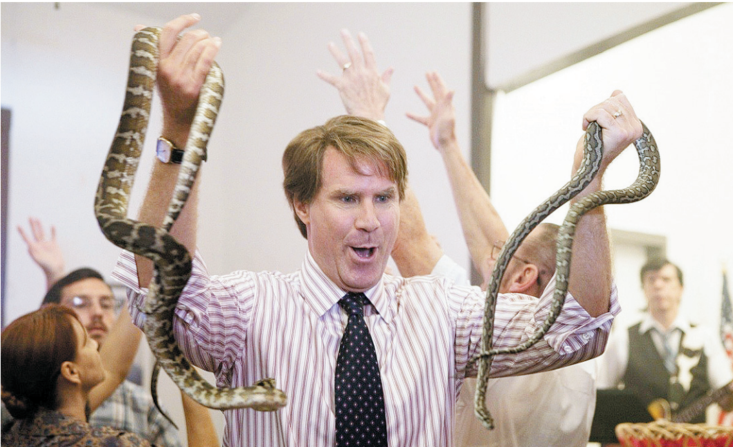
Фильм «Грязная кампания за честные выборы» придется по вкусу любителям эксцентрических комедий.

Однако лента придется по вкусу и тем, кто ценит даже в легком жанре отличную актерскую игру. К слову, проект еще до запуска в работу потенциально потерял несколько звучных имен в титрах. Главные роли должны были играть Энн Хэтэуэй и Марк Уолберг. По разным причинам звездная парочка из проекта выбыла, но продюсеры практически тут же заманили на