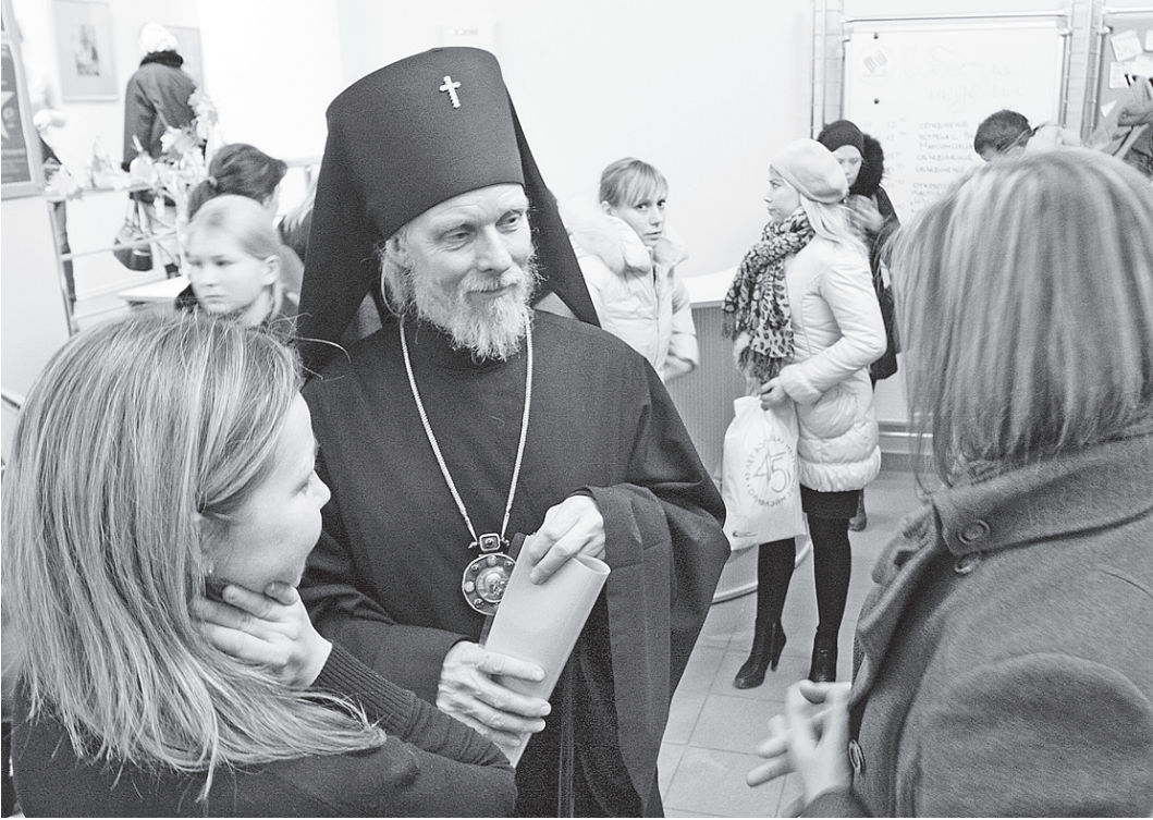
Владыка был готов к любым вопросам, даже самым острым.

Владыка не давил авторитетом, он рассказывал доброжелательно, спокойно. Он не убеждал, а знакомил молодых людей