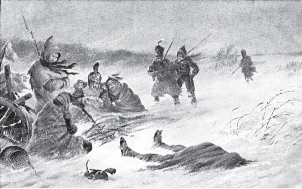
Открытка 1912 года. Так изобразил пленных французов художник Борис Зварыкин.

- При открытии в Вологодском музее-заповеднике выставки о войне 1812 года