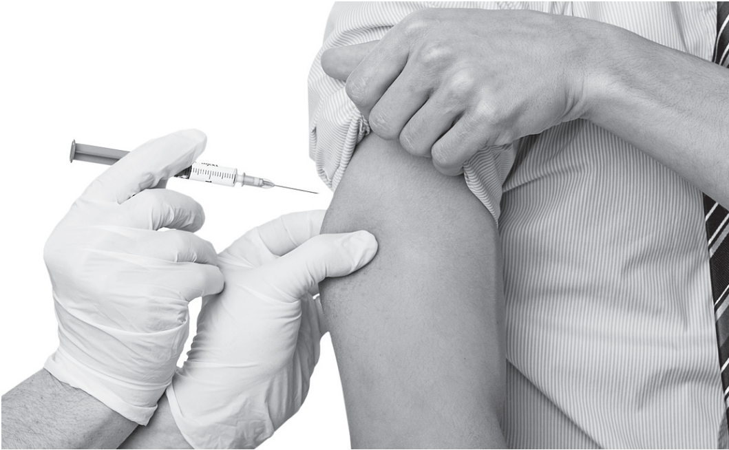
По словам медиков, сейчас оптимальное время для проведения вакцинации.