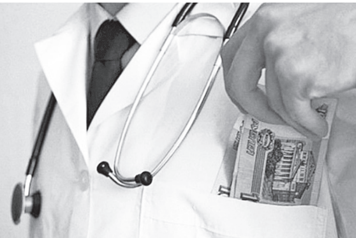
Взятка дорогого обошлась врачу.