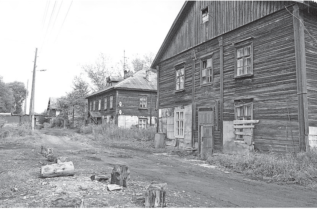
Нормативы на благоустройство территорий, возможно, будут пересмотрены. Может, после этого улица Свердловская в Соколе станет опрятной?

Тесно связан с процессом бюджетирования и еще один важный законопроект - о нормативах расходных потребностей. Как известно, деньги на