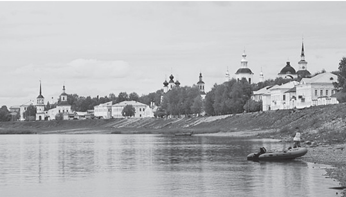
Укрепление левого берега Сухоны позволит защитить исторические памятники Великого Устюга.