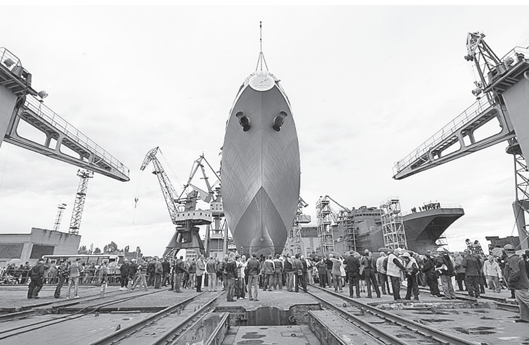
Для строительства военных сторожевых кораблей нового поколения компания «Северсталь» отгрузила более двух тысяч тонн листового металлопроката.