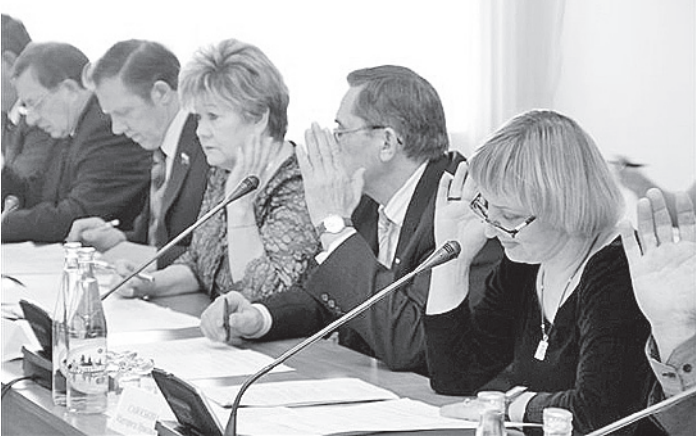
Депутаты приняли повестку дня предстоящей сессии.

Еще одним положительным моментом должно стать более чем трехкратное сокра-