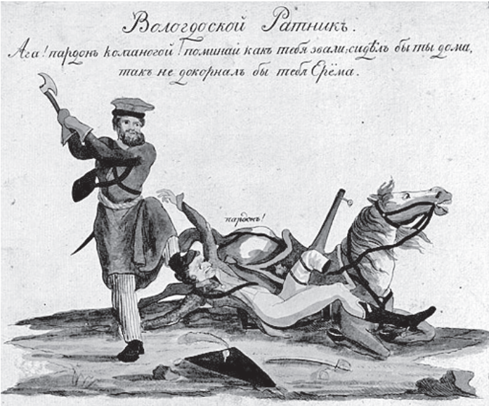
Вологодский ратник. Открытка начала XIX века.

Большой вклад внесла Вологодчина в формирование воинских подразделений, которые своими ратными подвига-