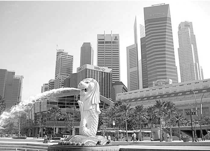
Сингапур - самая здоровая страна в мире.

- Логично, что в верхнюю часть списка попали государства с развитой экономикой, - рассказывает член редколлегии «Бюллетеня ВОЗ» Владимир Школьников из Института демографии общества Макса Планка (Германия). - Однако следует обратить внимание на то, что, например, Норвегия на 18-м месте, а Израиль - на 6-м, хотя Норвегия богаче. Для здоровья населения важнее все же социальная ориентация государства. Например, в ФРГ невозможна ситуация сбора де-