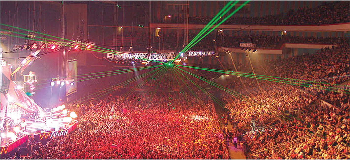
Билеты на концерты звезд в столичных мегаполисах можно купить в среднем за 3-4 тысячи рублей.

Теперь о звездах зарубежных. Первым из мастодонтов наши палестины посетят рок-электронщики «Paseo» (18 сентября). Цены очень демократичные - 1,5-3,5 тысячи целковых.