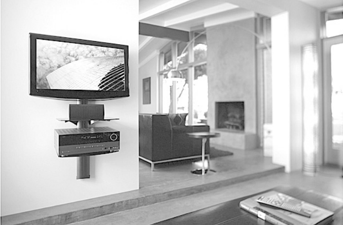
Причин для повышения цен на технику пока нет.