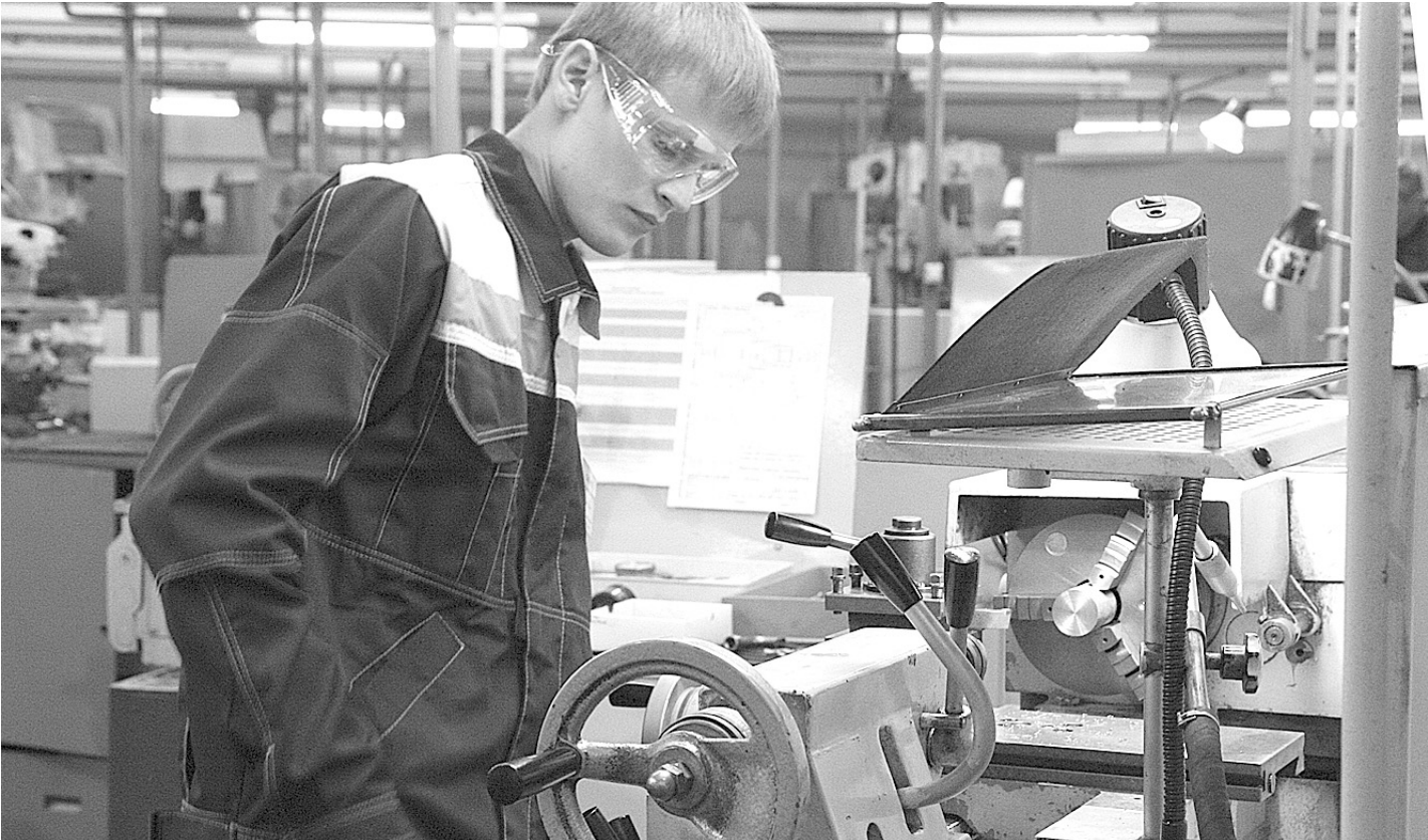
Проведение конкурсов профмастерства способствует повышению престижа рабочих профессий.

Как сообщает интернет-журнал Республики Карелия ( http://rk.karelia.ru ), из 200 миллионов рублей треть средств на реализацию проекта будет выделена из федеральной казны, также организаторы надеются и на привлечение инвестиций. По мнению специалистов туристической отрасли, главные проблемы в развитии туризма на Северо-Западе - это отсутствие достойной инфраструктуры, неважное состояние дорог и дороговизна гостиниц.