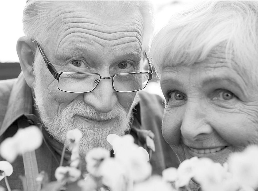
Правительство, похоже, определилось, как сократить дефицит Пенсионного фонда.

По мнению эксперта, в 2015 году россияне не станут добровольно возвращать накопительную часть, потеряв веру в этот механизм. «Я считаю, что это позиция страха. Очевидно, что министерство хочет отказаться от накопительной части пенсии,