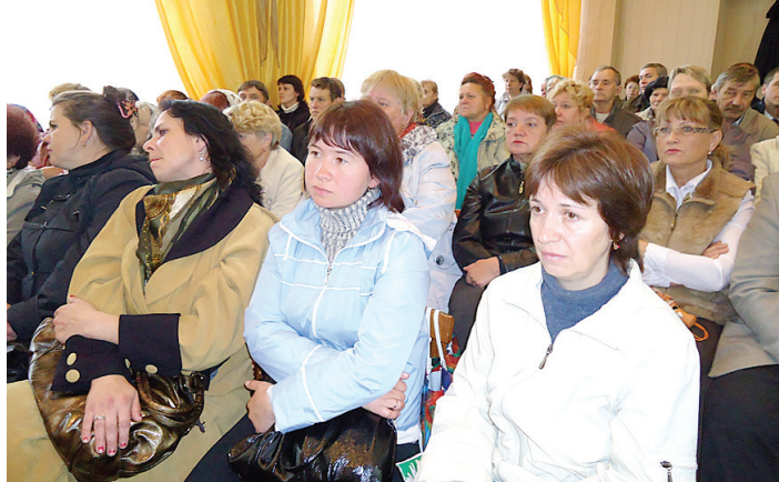
Глава региона пообещал, что людей, попавших в трудную жизненную ситуацию, трудоустроят в самом Красавине.

Есть в Красавине и другие проблемы. Хотя у Дома культуры и спорта отремонтированы входная группа, зрительный зал и помещение для дискотек, фасад оставляет желать лучшего. Совсем гнетущий вид у физкультурно-оздоровительного комплекса. Более 10 лет он находится в аварийном состоянии, а око-