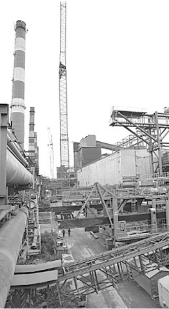
Новый агрегат сократит выбросы пыли в атмосферу на 20%.

На Череповецком металлургическом комбинате завершается реконструкция коксовой батареи № 7. Уже в сентябре она будет поставлена на разогрев, а в первом квартале следующего года даст промышленный кокс.