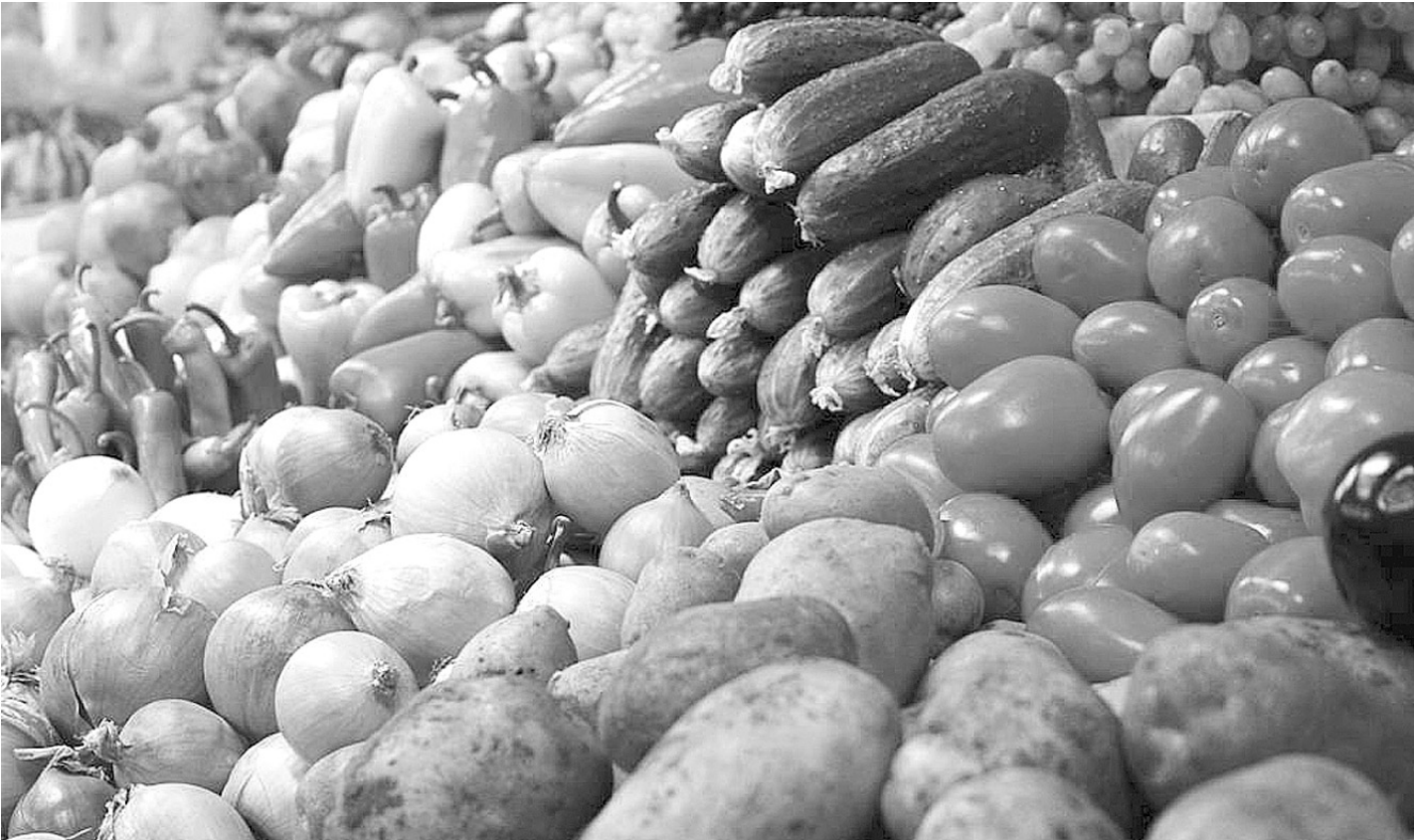
В среднем рост цен на продукты питания осенью может составить 5-7%.