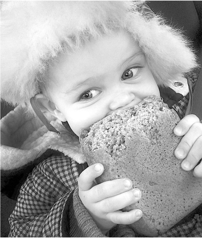
Правительство уверено, что серьезного роста цен на хлеб в регионах не предвидится.

Происходит незначительное колебание цен. Чтобы рынок сорвался в одну или в другую сторону, нужны серьезные экономические предпосылки, а их как не было, так и нет. Строительная бума в регионе до конца 2012-го точно не намечается. Спрос должен сохраниться на нынешнем уровне. Рост покупательной способности населения тоже достиг некоторого пика. Поэтому специалисты ждут лишь небольшой повышающей кор-