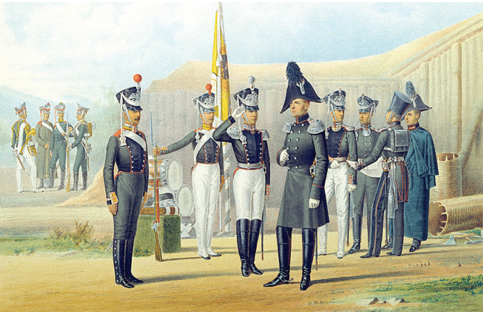
Война 1812 года - главная тема многих экспозиций этой осени.

Испанских, американских и китайских современных фотографов выставляют с середины сентября в Доме фотографии. В общем, есть на что посмотреть.