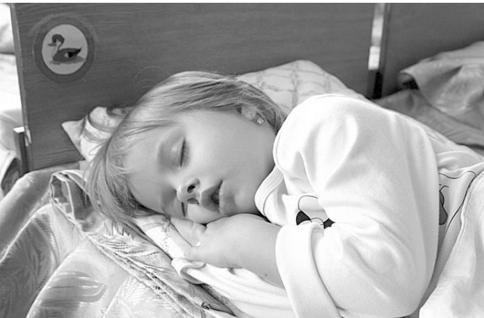
Теперь можно будет учиться и во сне? Ответ на этот вопрос учеными пока не найден.

Хотя в данном случае изучалась способность запоминания с точки зрения обоняния, ученые намерены продолжить ис-