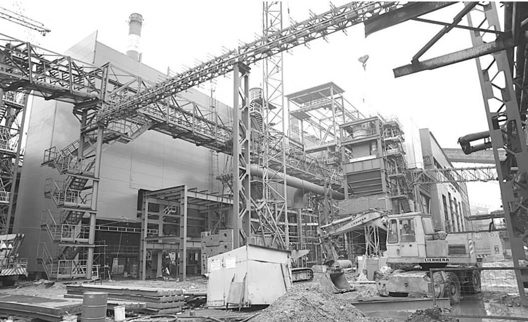
Реконструкция КБ-7 стала самым инвестиционноемким современным проектом на Череповецком меткомбинате.