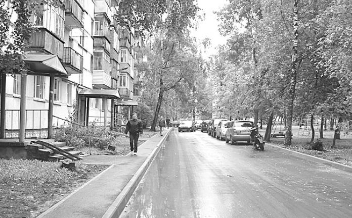
Качество работ вологжан устраивает.

ного центра, комплексное благоустройство Вологды позволяет не только выявлять проблемы микрорайонов, но и вовремя их ликвидировать. Городские власти и жители уже убедились в этом в 2011 году, когда шел ремонт дворов в микрорайоне Тепличный. Рассказать о недоче-