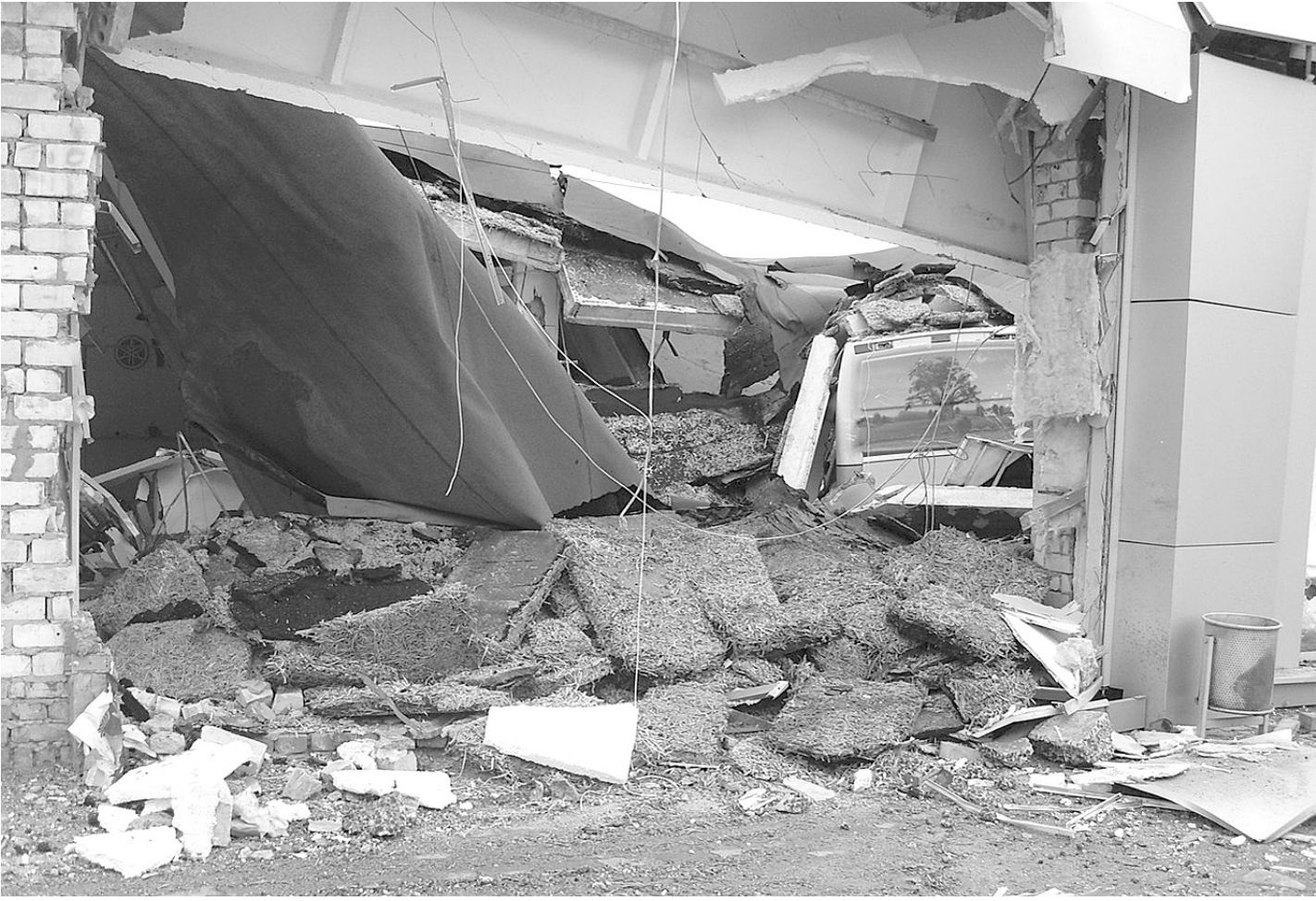
Остановиться неуправляемая машина смогла только въехав в автосалон «Ямаха».