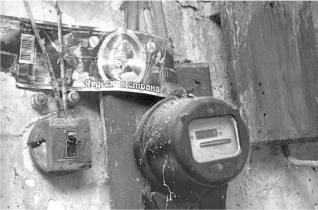
Программа модернизации ЖКХ пока отложена.