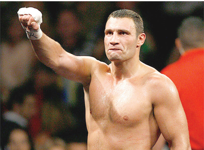
Бой Виталия Кличко в столице - главное спортивное событие осени.