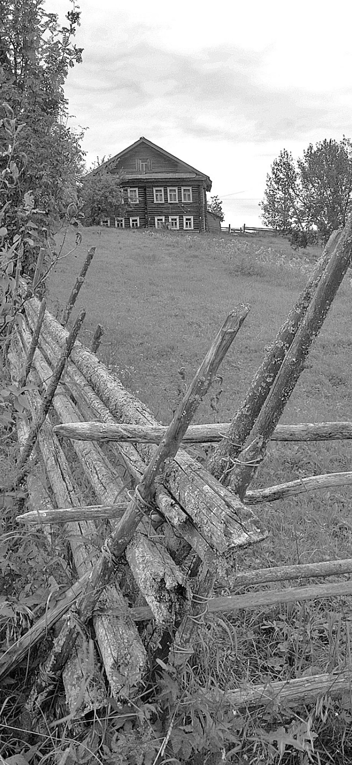
Раньше каждый такой дом являлся Домом ремесел, а теперь радуемся одному на всю округу.

Информация о том, что в село Покровское, где расположена одна из жемчужин старинной архитектуры - усадьба Брянчаниновых, отныне запрещен допуск свадебных автокортежей быстро облетела ленты местных информационных агентств и соцсетей. Реакция на это последовала незамедлительно. Вологжане выразили недовольствие на введение данных ограничений.