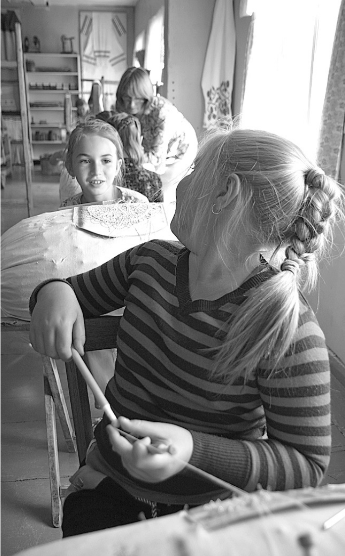
Девчонкам хочется сделать своими руками что-то особенное, неповторимое.