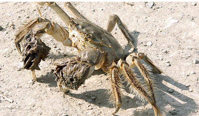
Свое название «мохноногий (мохнорукий)» краб получил из-за специфических волосков на лапках.