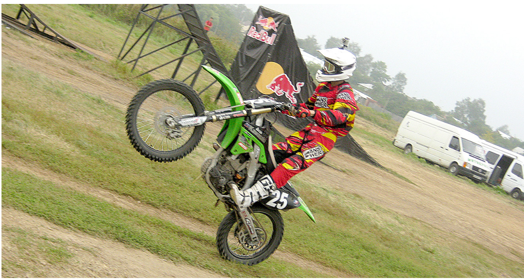
Прохождение трассы требует не только мастерства, но и мужества.