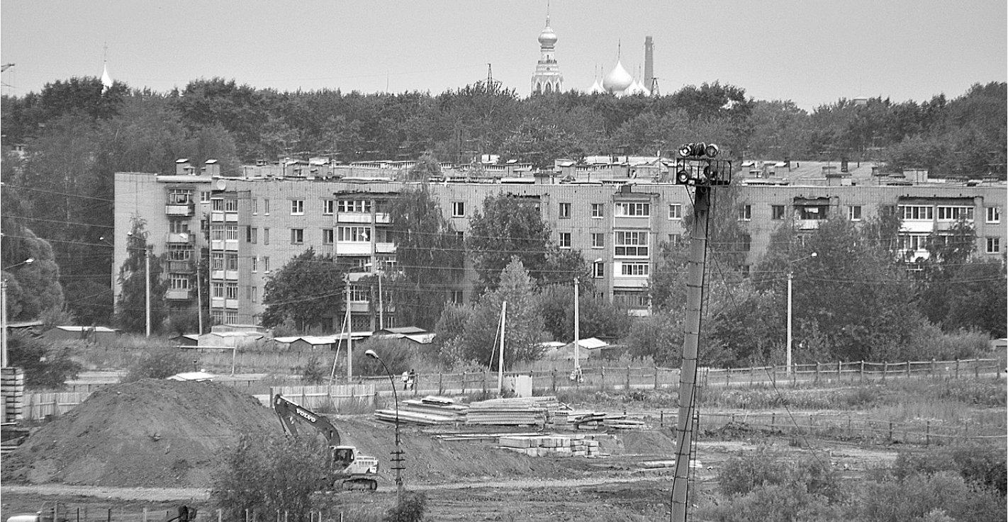
На территории промышленного парка «Восток» планируется разместить около 30 новых предприятий.

Однако площадь промышленного парка освоена пока едва ли на четверть и способна вместить еще примерно столь-