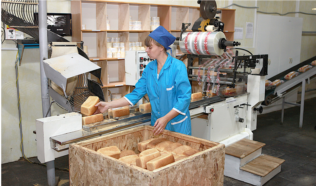
Руководители хлебокомбинатов готовы простимулировать местных фермеров и заключать с ними договоры на поставки зерна.

- Мы должны войти в федеральные сети. Для этого соберем региональных представителей сетевых супермаркетов и будем их настойчиво просить дать нам квоты на продажу нашей хлебо-