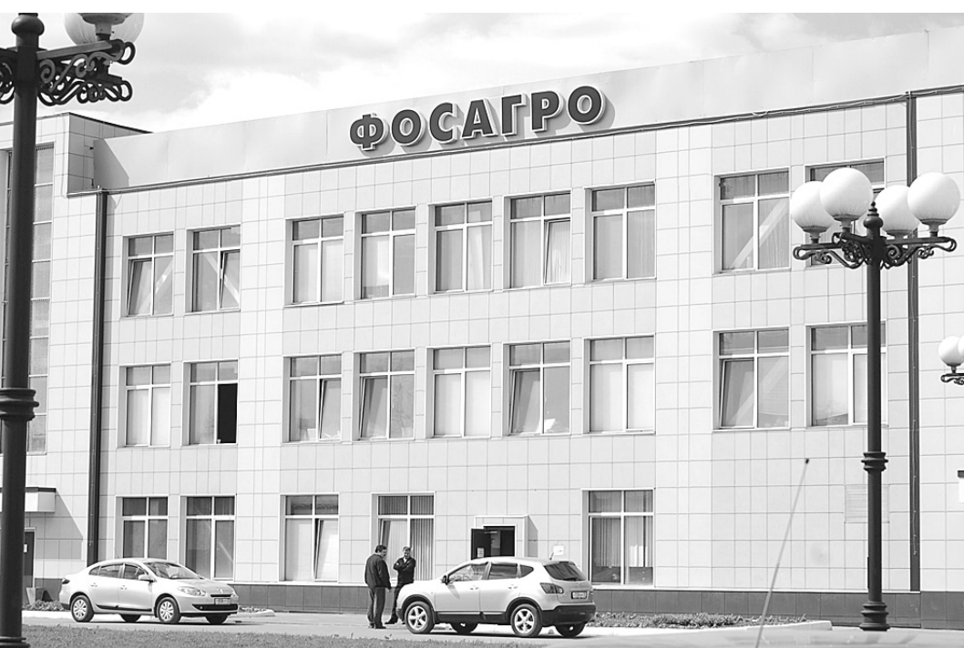
Около 70% продукции предприятий «ФосАгро» сегодня идет на экспорт.

внутренним рынком, поскольку, во-первых, его развитие всегда было одним из приоритетов «ФосАгро», и, во-вторых, существуют определенные договоренности в рамках РАПУ (Российская Ассоциация производителей удобрений - прим. автора), нацеленные на удовлетворение внутреннего спроса на минеральные удобрения», - отмечает генеральный директор ОАО «ФосАгро».