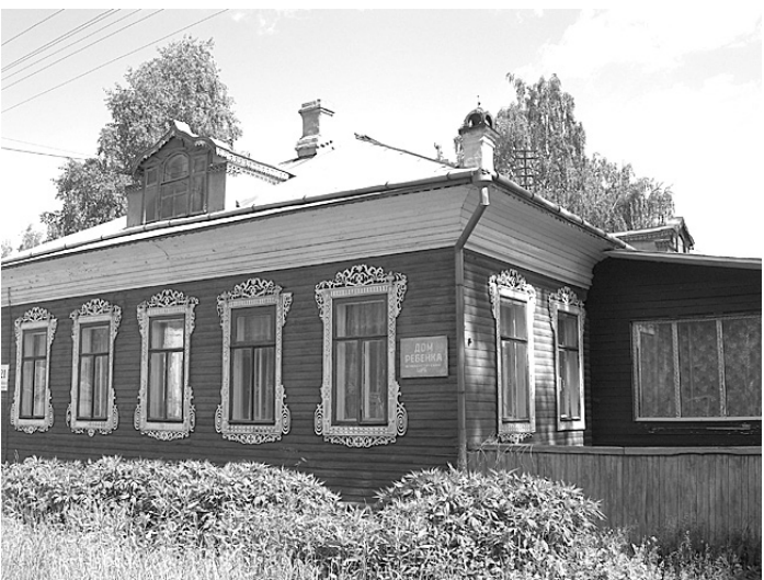
В здании бывшего дома ребенка разместятся группы детского сада.