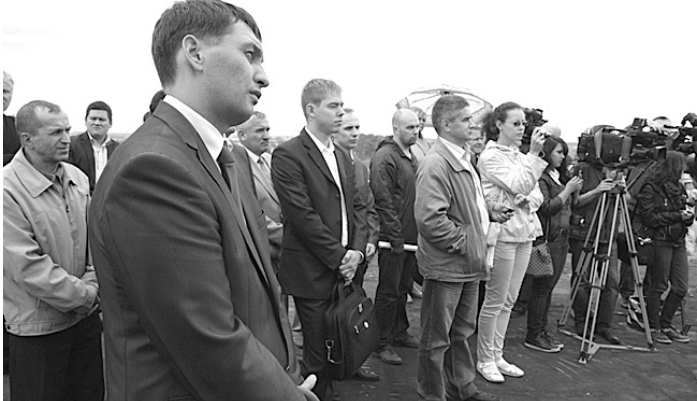
Презентация проекта вызвала большой интерес бизнесменов и представителей СМИ.

- Сегодня экономика нашего города развивается достаточно стабильно. Мы набрали неплохие темпы после кризиса.