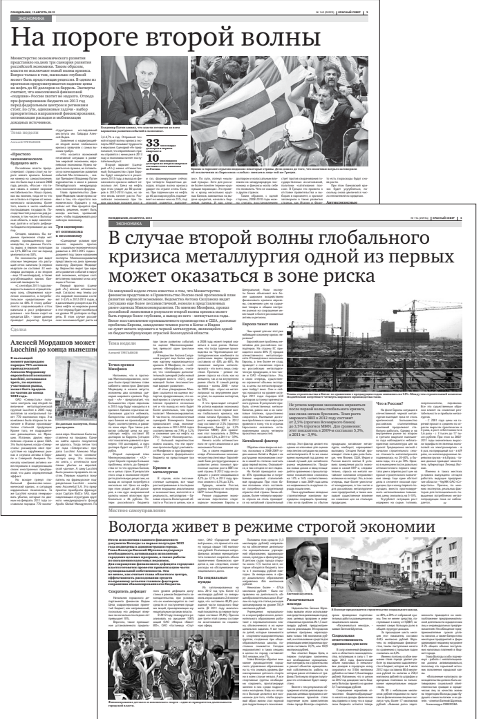
«Красный Север» продолжает оценивать состояние макроэкономики и возможные риски для нашей области.

В разгар кризиса область взяла на свой баланс принадлежавшие «Северстали» социальные объекты Череповца, запла-