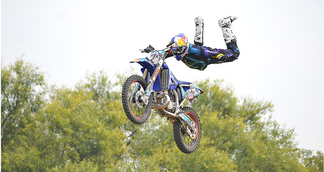
Вот такой трюк!