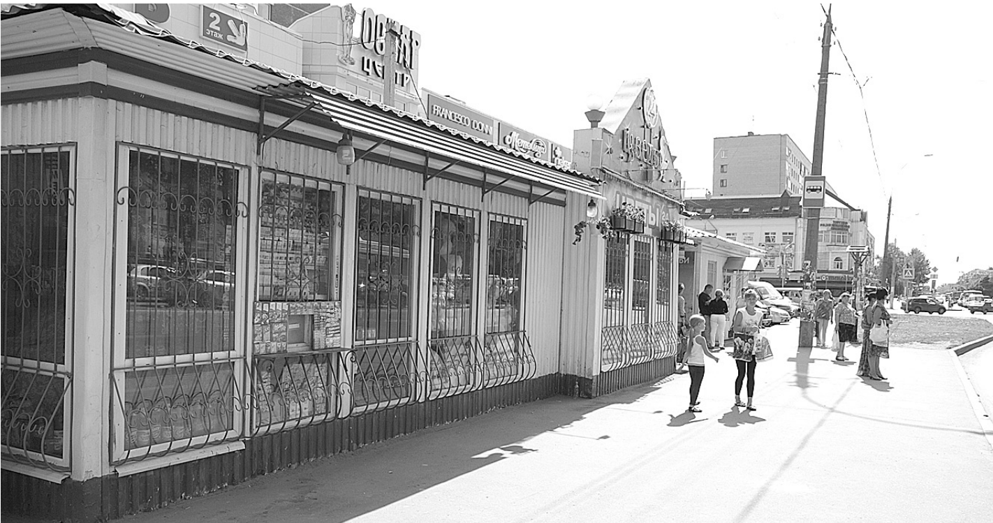
Продавать алкогольную продукцию в нестационарных объектах закон запрещает.

- Два месяца со дня получения извещения, направленного лицензирующим органом, то есть нашим департаментом. Оно производится в виде письма с уведомлением. Организация в это время может принять решение об исключении отдельных торговых точек из лицензии, а также оформить долгосрочный договор аренды. В случае если организация раньше устранила недостатки, она подает заявление в лицензирующий орган, прилагая договор, зарегистрированный в УФРС, и