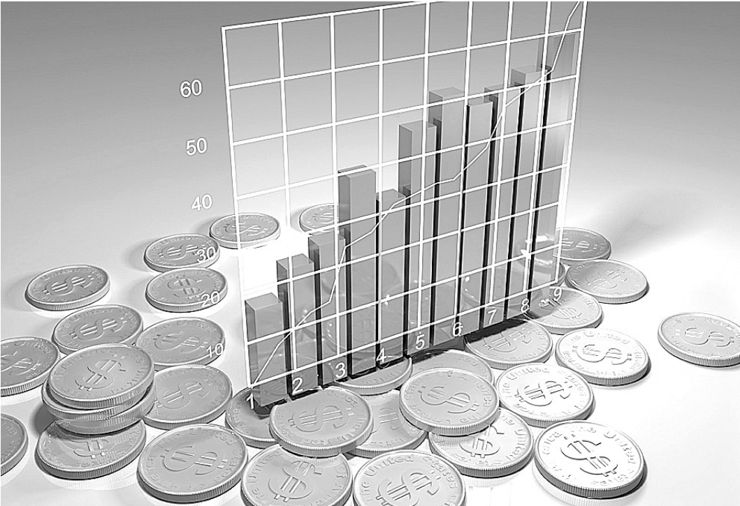
Экономика Вологодской области по-прежнему во многом зависит от циклических рынков металлов и химических удобрений.

Не будем больше вдаваться вглубь истории, а проследим за тем, как развивалась экономика