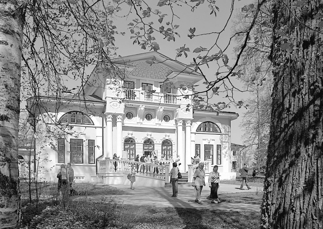
Реставрация усадьбы, отмечающей в этом году свое 200-летие, длилась более десяти лет.