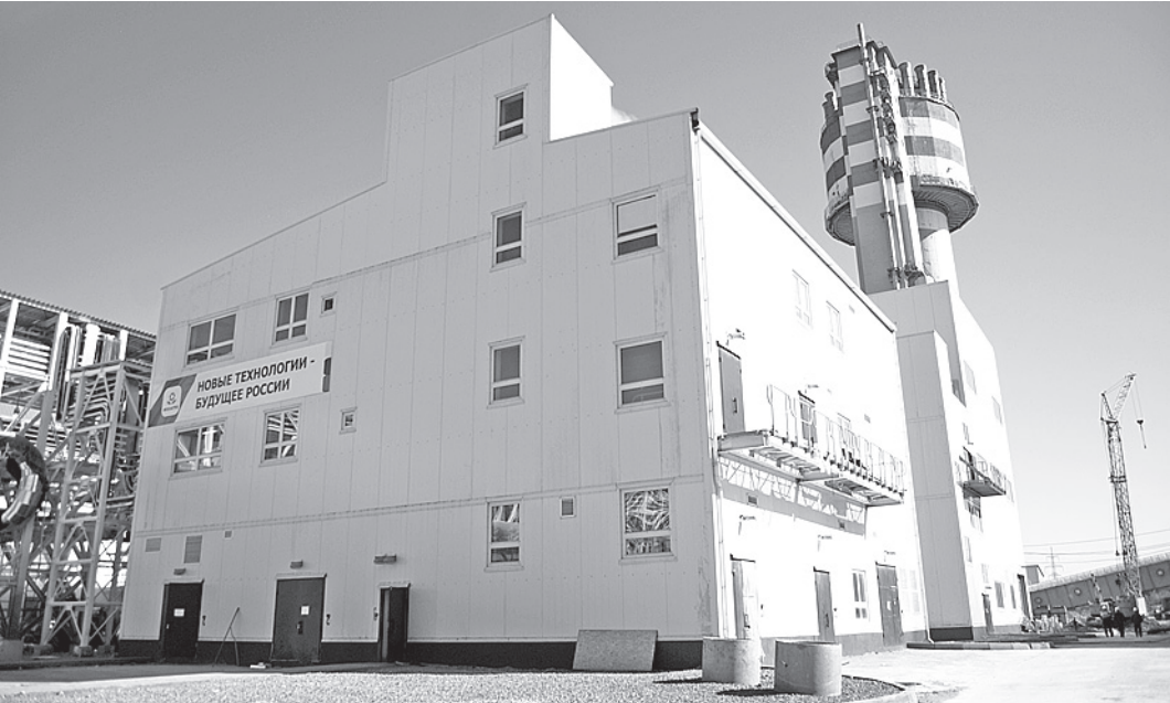
Строительство нового завода по производству карбамида завершится в ближайшее время.