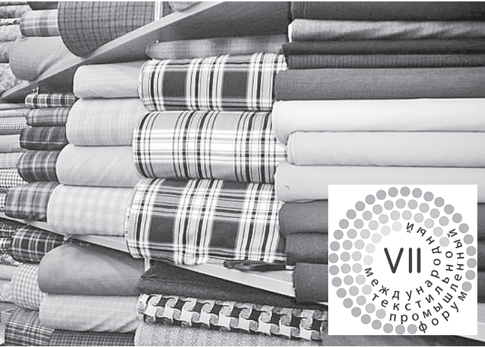
Развитие отечественного швейного производства станет основной темой форума.

7-8 сентября при поддержке Министерства промышленности и торговли Российской Федерации в городе Плёсе Ивановской области пройдет VII Международный текстильно-промышленный форум «Золотое кольцо».