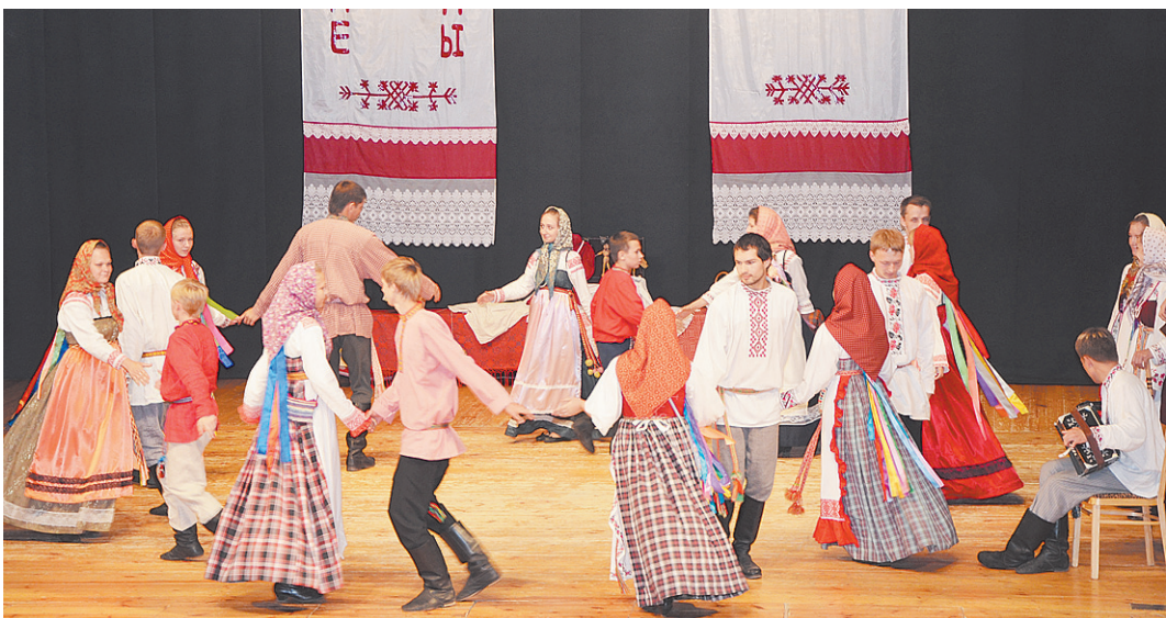
Вологодский коллектив выступает на открытии XI Всероссийского фольклорного фестиваля «Псковские жемчужины».

Победителями из Вологодского центра традиционной народной культуры стали Ан-