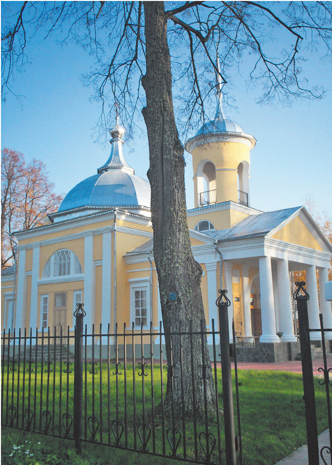
«Ранняя осень». Автор Олег Молодов. Номинация - «Времена года в Покровском».

Работы победителей конкурса будут представлены на специальной фотовыставке «Усадьба Брянчаниновых глазами посетителей», которая откроется в Покровском 16 ноября. Там же пройдет церемония награждения победителей и призеров. Кроме того, лучшие работы конкурса будут опубликованы в областной газете «Красный Север». кс