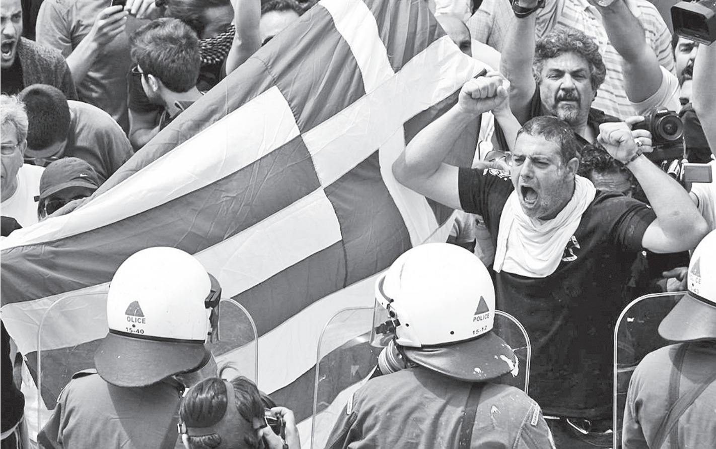
Кризис в еврозоне серьезно подкосил некоторые страны. Дело дошло до того, что политики всерьез заговорили об исключении из Евросоюза «слабых» звеньев в лице той же Греции.

Чем нынешняя ситуация отличается от событий четырехлетней давности? В 2008 году в США образовался тромб в финансовой системе, вызванный просроченными ипотечными кредитами. Он так и назывался - «ипотечный кри-