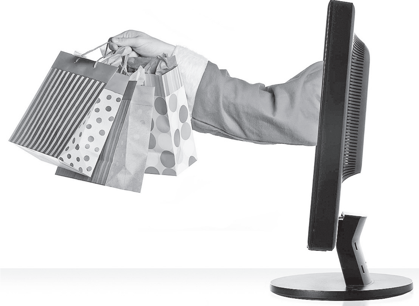
Продажа товаров и услуг через Интернет - один из самых быстро развивающихся сегментов мирового рынка.

ла зарегистрировать свое резюме на биржах копирайтинга (eTxt, Advengo, TextBroker). Там же необходимо указать, тексты какой тематики вы можете писать, разместить парочку своих материалов, а затем ждать, когда вами кто-нибудь заинтересуется.