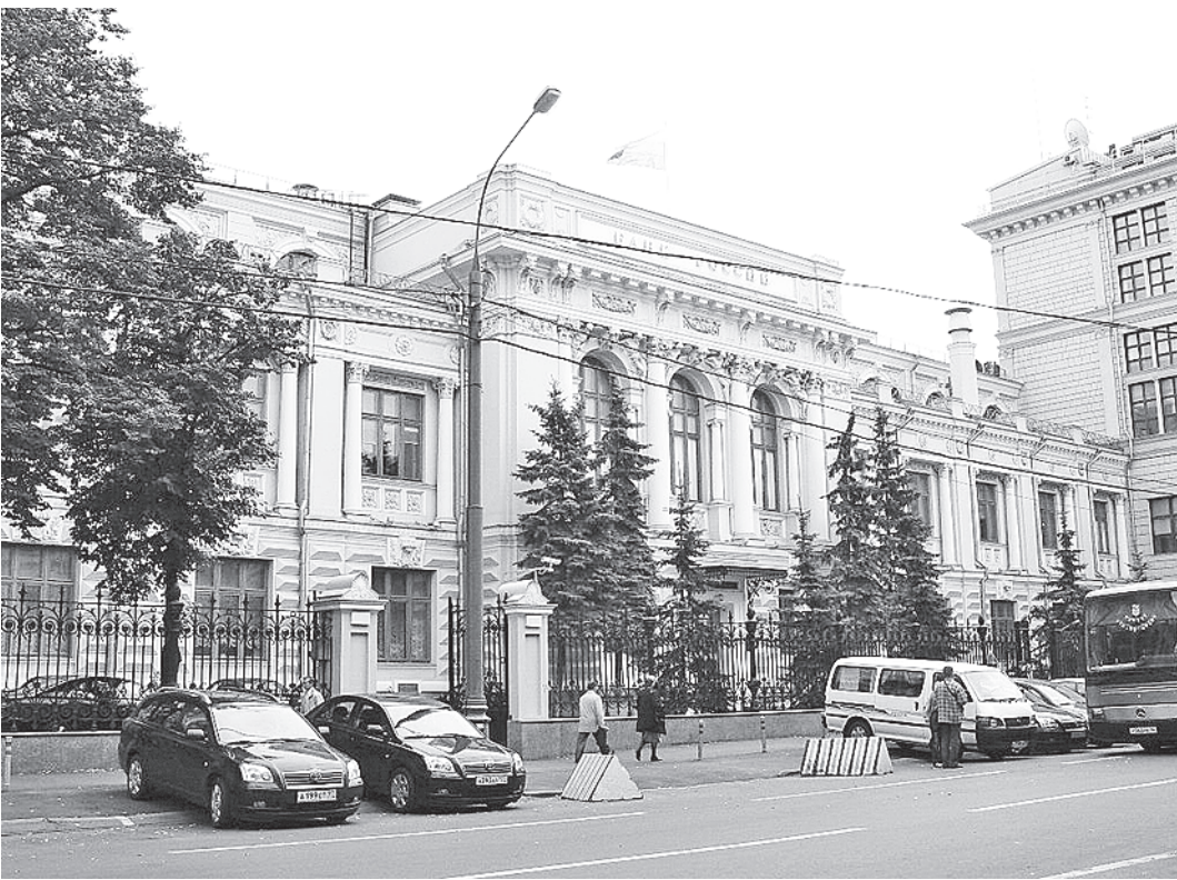
По мнению ряда экспертов, Центробанк вправе устанавливать ограничение на хранение наличных денег в кассе.

На днях Арбитражный суд Москвы прекратил производство по делу, удовлетворив ходатайство Центробанка. Тот указал, что спор «не подведомствен арбитражному суду». Арбитраж согласился с этим доводом. В определении суда отмечается, что Арбитражный процессуальный кодекс не дает