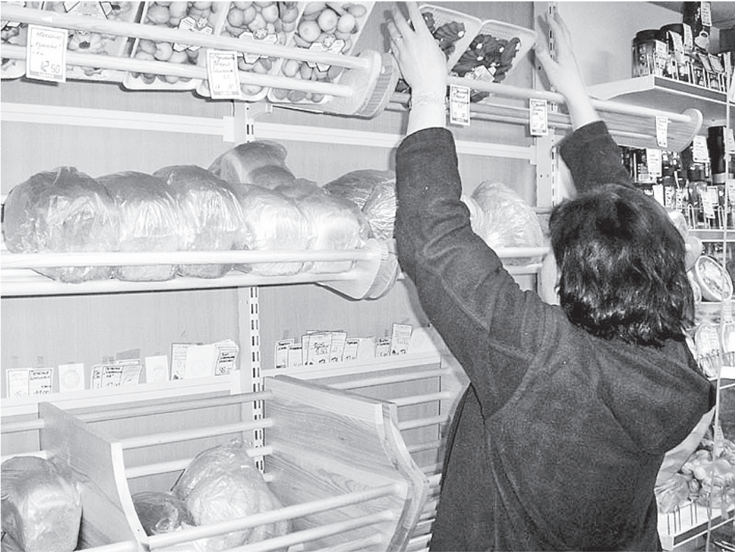
Многие производители хлеба и других продуктов питания говорят о необходимости поднять цены на выпускаемую ими продукцию.