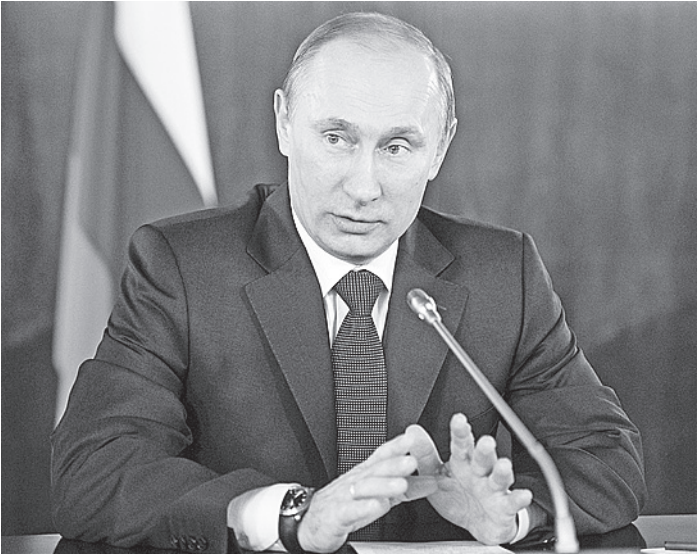
Владимир Путин заявил, что власти готовятся ко всем вариантам развития событий в экономике.

Первый прогноз (сценарий «А») вполне оптимистичный. Согласно ему темпы роста мировой экономики составят 3-3,5% в 2012-2013 годах, а в дальнейшем ускорятся до 4%. Цена нефти на мировом рынке в этот период будет колебаться на уровне 90 долларов за баррель. В этом случае российская экономика будет расти на