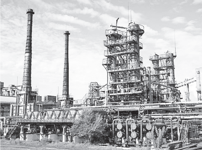
По данным экспертов, большая часть активов Lucchini уже продана.

Но вскоре грянул глобальный финансово-экономический кризис, и ситуация кардинально поменялась. Та же Lucchini начала генерировать убытки, которые по данным на февраль 2011 года составляли порядка 770 милли-