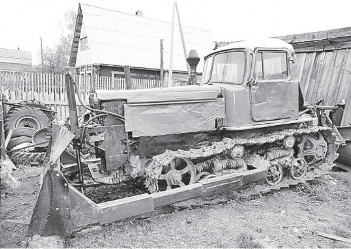
Следы от трактора навели на преступника.