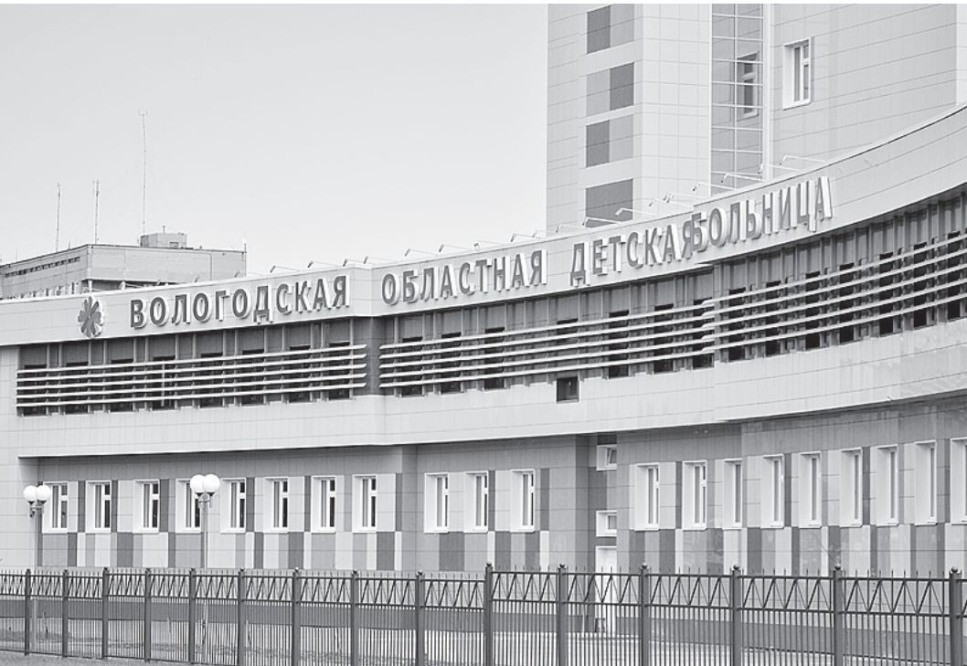
Детская областная больница, построенная в Вологде, - уникальный комплекс, не имеющий аналогов на Северо-Западе.

Обсудили стороны и программу «Здоровые города». Напомним, этот международный проект Европейского регионального бюро Всемирной организации здравоохранения развивается уже более 20 лет. Новым этапом его развития в России стало создание Ассоциации «Здоровые города, районы и поселки», председателем которой на сегодняшний день является губернатор Вологодской области Олег Кувшинников. Глава региона рассказал о том, что еще несколько городов написали заявления о вступлении в ассоциацию, в том числе Санкт-