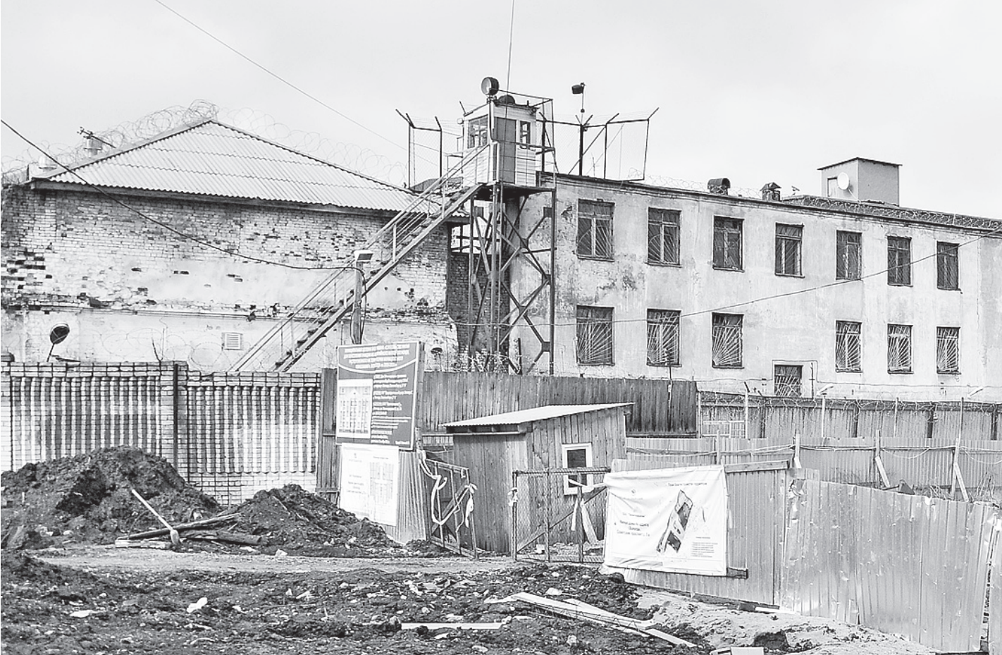
Здание нынешней тюремной больницы, которое не отвечает санитарным требованиям, планируют снести.

Вход в помещения приемного покоя и штрафных изоля-