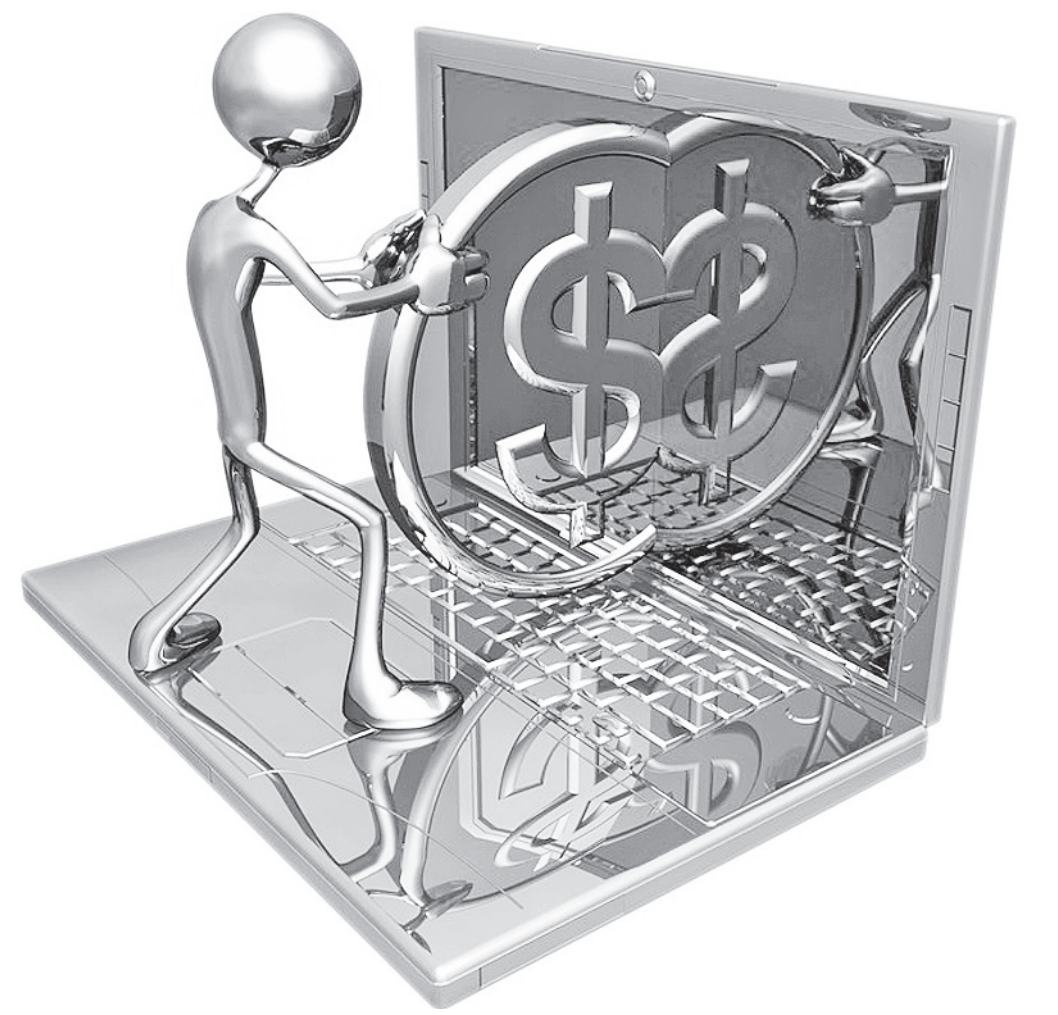
Число способов заработать в Интернете уже перевалило за сотню. Нужно просто выбрать подходящий.

Некоторые ресурсы доплачивают пользователям, которые для раскрутки какой-либо статьи пишут к ней провокационные комментарии. Один «пост»