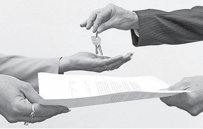
Разработчики новой «дорожной карты» уверены, что нужно сократить не только собственно сроки регистрации, но и сформировать единый реестр недвижимости.