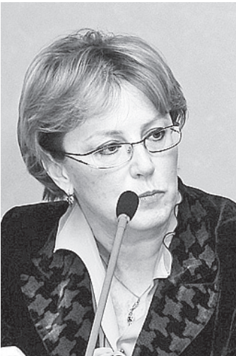
Министр здравоохранения Вероника Скворцова.

- Были отмечены успехи Вологодской области. По итогам 2011 года мы вошли в число регионов, наиболее эффективно использующих бюджетные средства в сфере медицины. Ходом работ министр полностью удовлетворена. Все они проводятся в строгом соответствии с графиком. Федеральные средства осваиваются в полном объеме для модернизации субъектов здравоохранения в 26 районах области и двух городах - Вологде и Череповце. Благодаря этому нам было выделено дополнительно 352 миллиона рублей для продолжения программы модернизации в 2012 году, - рассказал Олег Кувшинников.