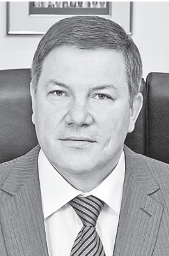
Губернатор области Олег Кувшинников.

На совещании с Вероникой Скворцовой глава региона обсудил и тему строительства детской областной больницы. Стоимостью работ составляет более 4,5 миллиарда рублей. Общая площадь зданий - более 36 тысяч квадратных метров. Это будет уникальный комплекс, не имеющий аналогов на Северо-Западе. Олег Кувшинников попросил у министра здравоохранения поддержки со стороны федерального бюджета для окончания расчетов со строительной организацией в 2012 году, - рассказал Олег Кувшинников.