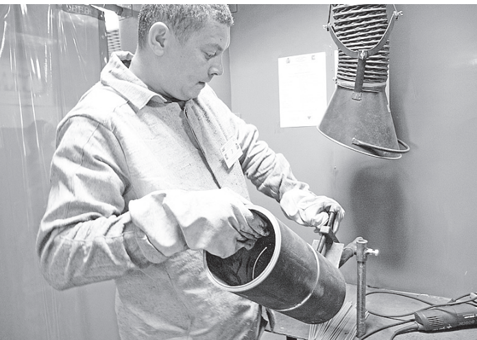
На рынке труда растет спрос на сварщиков.

Перед практической частью все без исключения опробовали оборудование на местном производственном участке. Для максимальной объективности судейства на бейджах участни-