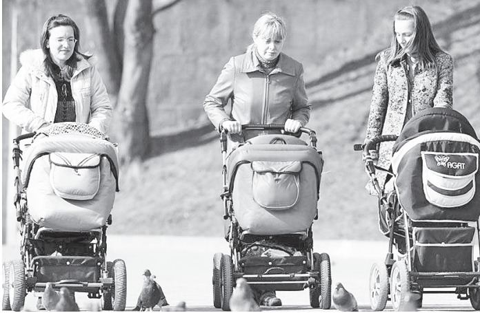
За последние пять лет после принятия Концепции демографической политики количество рожденных в России увеличилось на 21,2%.

С 1 января Россия перешла на новый критерий регистрации новорожденных детей. Те-