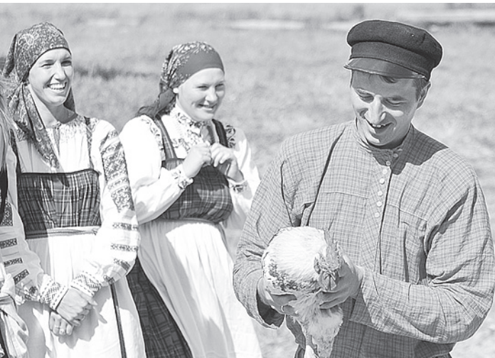
По старинной русской традиции первым в обновленный дом запустили петуха.