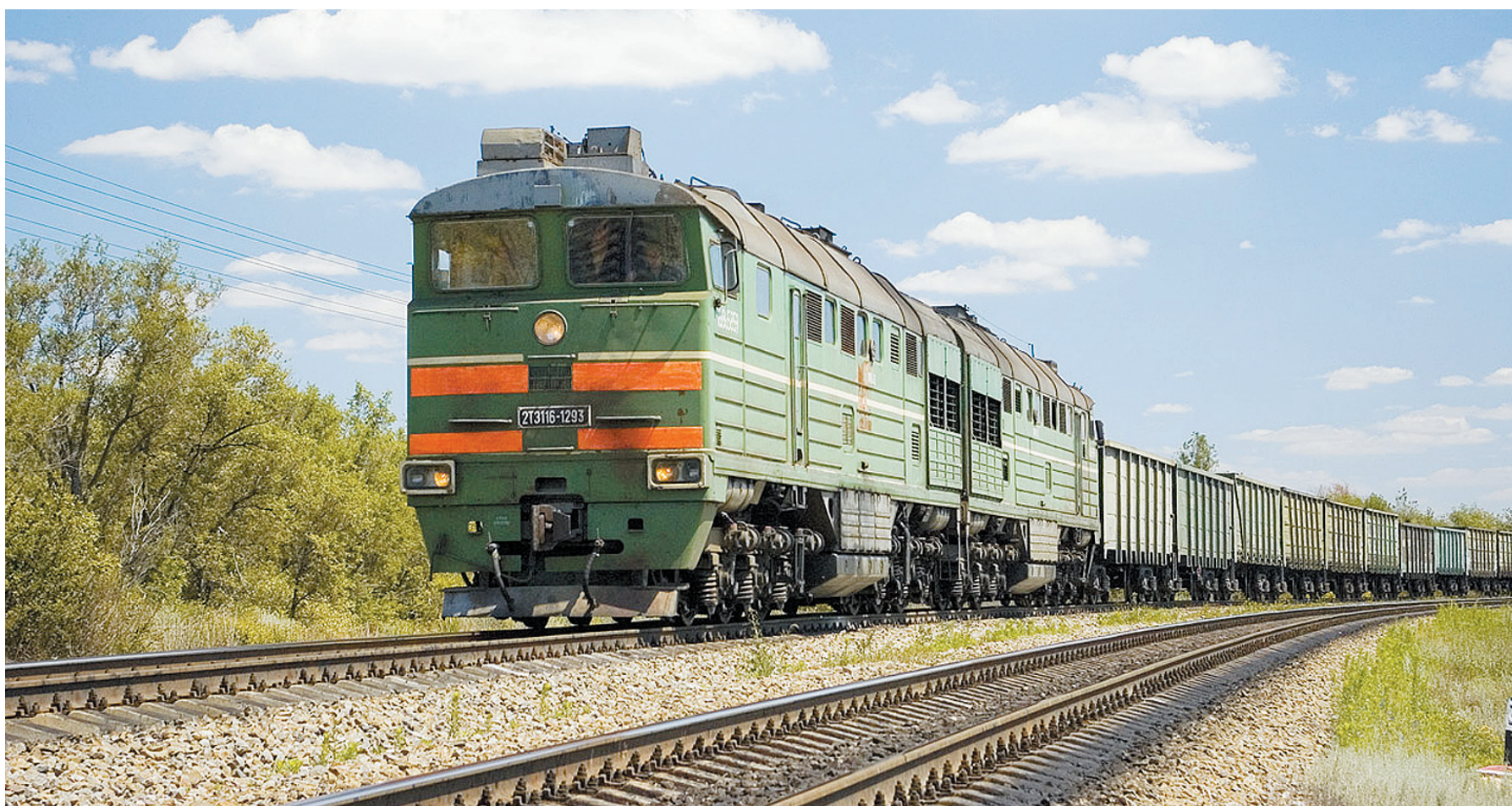
Развитие железнодорожного узла в индустриальном парке «Шексна» и реконструкция станции Шеломово позволили бы улучшить инвестиционную привлекательность региона.

В последние два года капитальный ремонт трассы Вологда - Новая Ладога идет довольно интенсивно. На большей протяженности дороги от Вологды до Череповца уже уложен новый асфальт. При рекон-