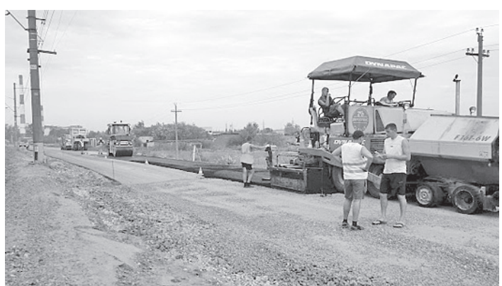
Работы сейчас ведутся в две смены.