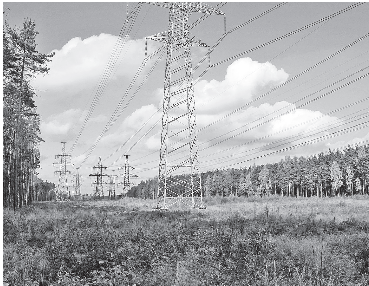
Новые правила работы розничного рынка электроэнергии не урегулировали один из самых актуальных вопросов отрасли - перекрестного субсидирования. Предприятия и бизнес по-прежнему берут на себя часть расходов по оплате электроэнергии, предназначенной для населения.

Вместе с тем ряд принципиальных для промышленников и энергетиков тем так и не нашел своего отражения в новых правилах, регулирующих розничный рынок электроэнергии. Прежде всего остается нерешенным вопрос о перекрестном субсидировании. Оно остается. Промышленные предприятия по-прежнему будут брать часть расходов на оплату за электроэнергию на-