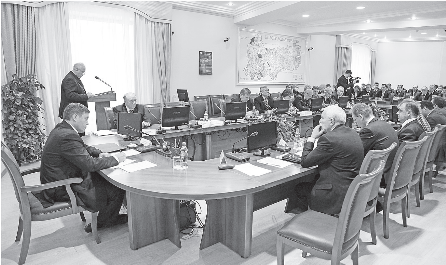
Олег Кувшинников напомнил главам, что вопросы безопасности граждан власть должна контролировать в ежедневном режиме.

Подробнее о результатах мониторинга вынесенных решений в отношении органов местного самоуправления на совещании рассказал начальник государственного правового департамента об-