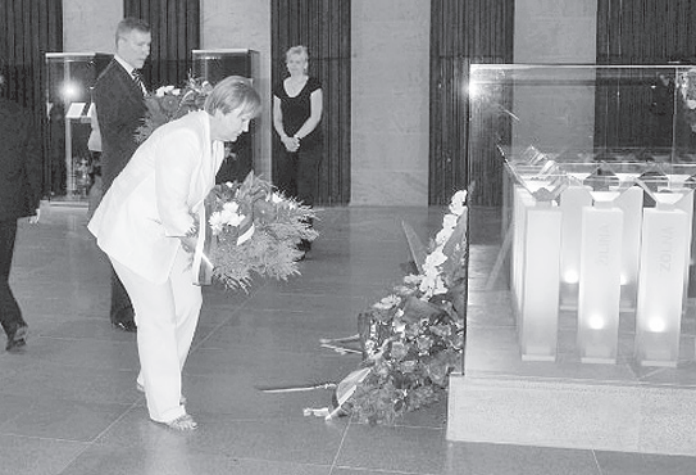
Вологжане возложили венки к мемориалу русским воинам в Грабине.