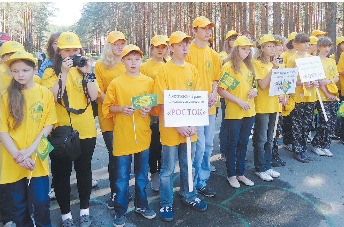
Первое место в старшей возрастной группе заняло школьное лесничество «Росток» Вожегодского района.