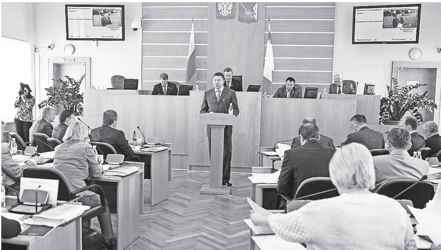
Олег Кувшинников представил ежегодный отчет депутатам областного парламента.

тельного кластера будет положено развитие производства конструкционных материалов для деревянного домостроения. На сегодняшний день его востребованность очевидна. По сравнению с 2010 годом в прошлом году производство малозатяжных модульных домов было увеличено на 5 тысяч квадратных метров общей площади и составило 38 тысяч квадратных метров.