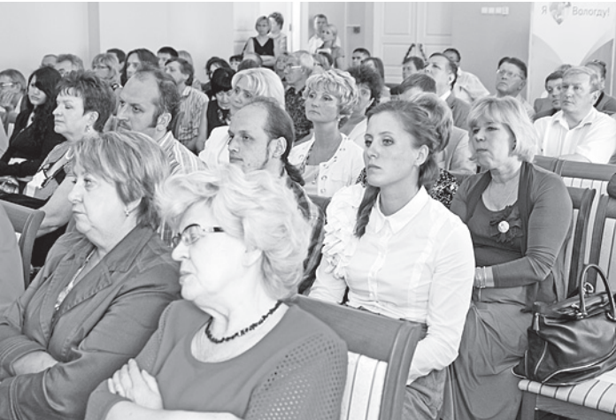
Общественный совет Вологды обеспечивает обратную связь между властью и горожанами.

значимых проектов власти, бизнеса и населения объединены под брендом «Вологда - город добрых дел». Один из конкретных примеров - благодаря «Цветущему городу» в нынешнем году Вологду украсили 3,5 миллиона цветов.