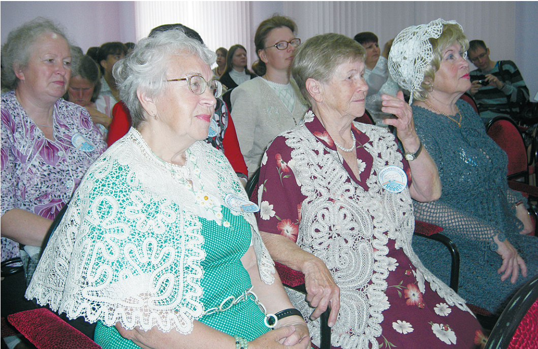
В мастерстве кружевоплетения состязались как представительницы старшего поколения, так и совсем юные мастерицы.

следние десятилетия практически угас, он постепенно начинает возрождаться, - отметила она. «Серебряная коклюшка» - это, по сути, два конкурса в одном - конкурс готовых изделий и конкурс профессионального мастерства. На конкурс готовых изделий, которому на сей раз была задана «цветочная» тема, свои работы представили десять участниц. В экспозиции, развернутой в одном из кабинетов Губернаторского колледжа народных промыслов, где традиционно проходит конкурс, были представлены самые разнообразные произведения кружевного мастерства: от крохотных до «монументальных полотен» из кружева - воротников, жилетов, шарфов и панно. А вот участницам конкурса проммастерства предстояло по предложенным сколкам сплести небольшие «снежинки» в цепной технике плетения, соблюдая при этом все каноны традиционного вологодского кружева. На выполнение этого задания им было выделено три часа.