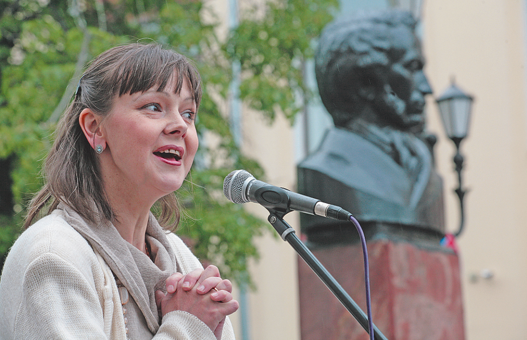
Актриса Лариса Кочнева читала «Барышню и крестьянку».