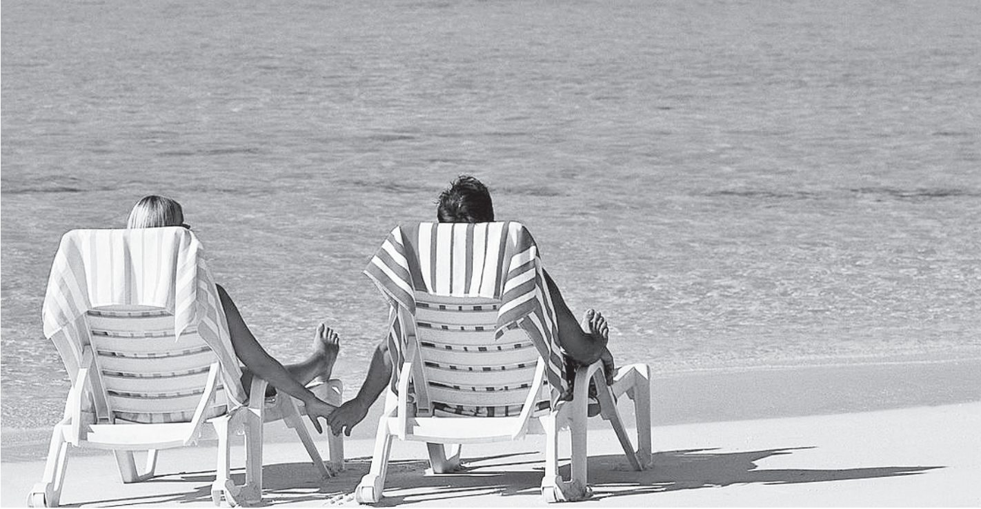
Рост доллара и евро по отношению к рублю делает более дорогим отдых за границей.