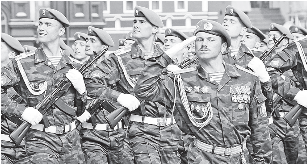
Не исключено, что российским десантникам придется участвовать в урегулировании конфликта в Сирии.