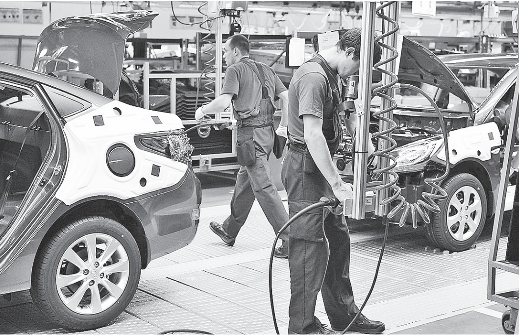
Пока сборочные линии зарубежных автоконцернов серьезно не повлияли на доходы бюджета Санкт-Петербурга.