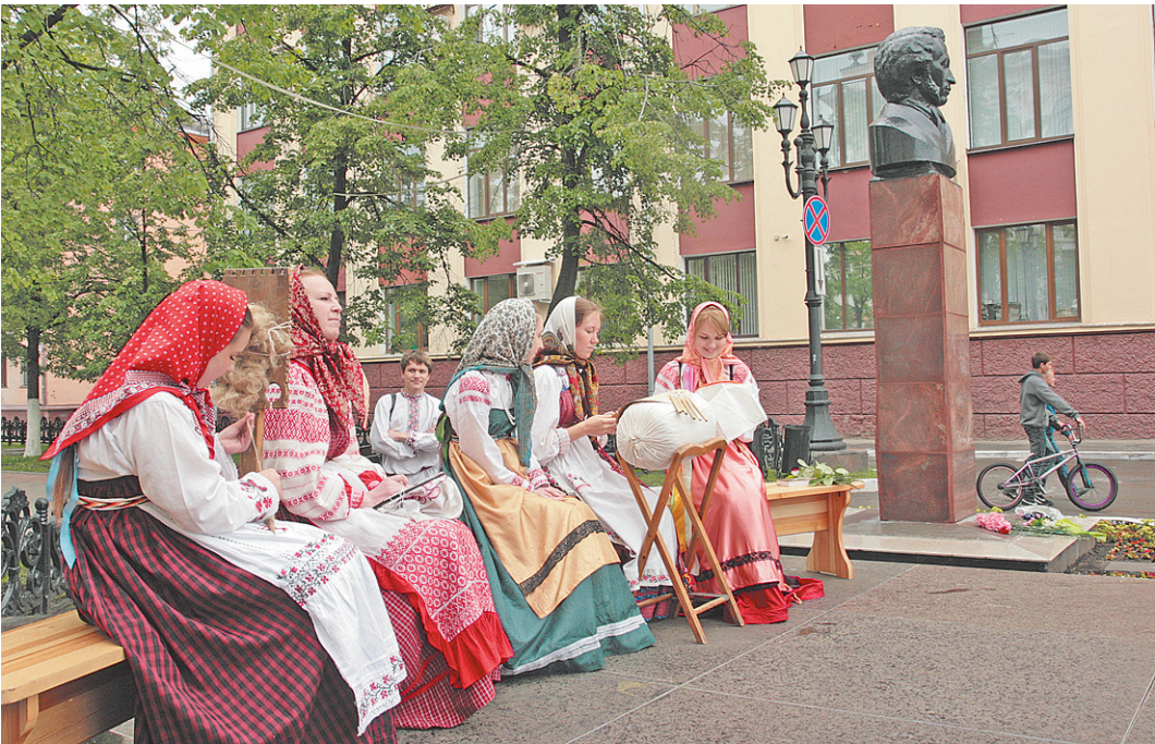
Учащиеся областного детско-юношеского центра традиционной народной культуры.