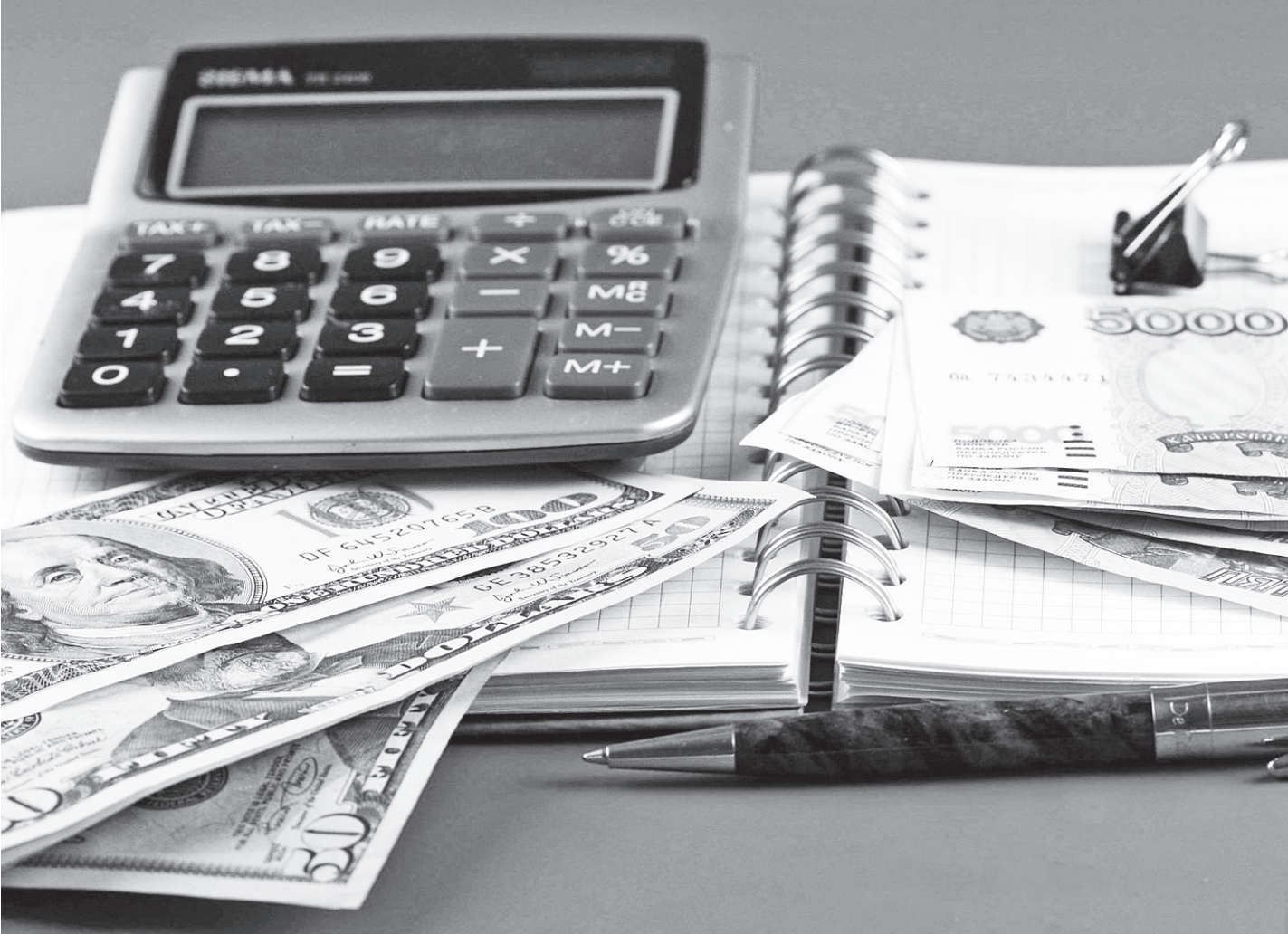
Только за май американская валюта подорожала на 2,5 рубля.

Для противодействия «американской экспансии» Банк России увеличил биржевые валютные интервенции в несколько раз, однако на этом предпочел пока остановиться. Специалисты уверены, что нынешняя пока что вполне управляемая девальвация национальной валюты выгодна ЦБ и российским властям. Нужно выполнять взятые на себя социальные обязательства. Ослабление рубля облегчит это бремя, так как серьезно увеличатся доходы от экспорта, - комментирует ситуацию директор банка «Альба Альянс» Артем Рошин. Между тем верхняя планка коридора, установленного Банком России, на сегодняшний день недостижима - 38,15 рубля ждать, конечно, не стоит. Поэтому надеяться на активную продажу долларов рано, да и не очень-то любит регулятор продавать валюту. Вотряп финансистам и трейдерам, которые непосредственно участвуют в формировании курсов на биржевых площадках.