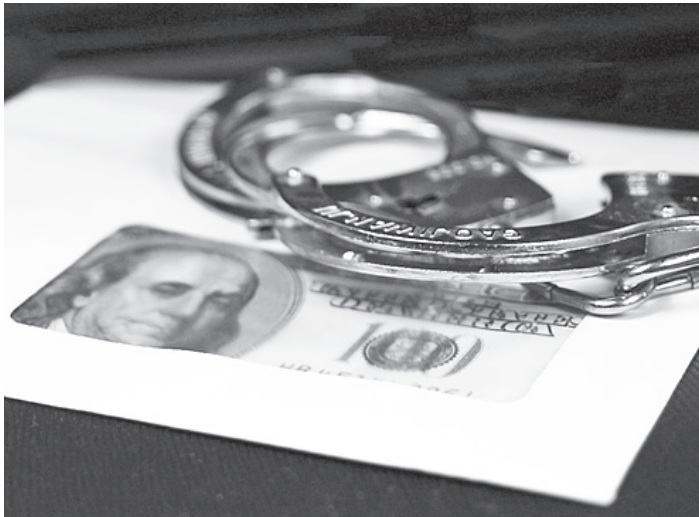
За выплату зарплат в «конвертах» может грозить не только штраф, но и арест.