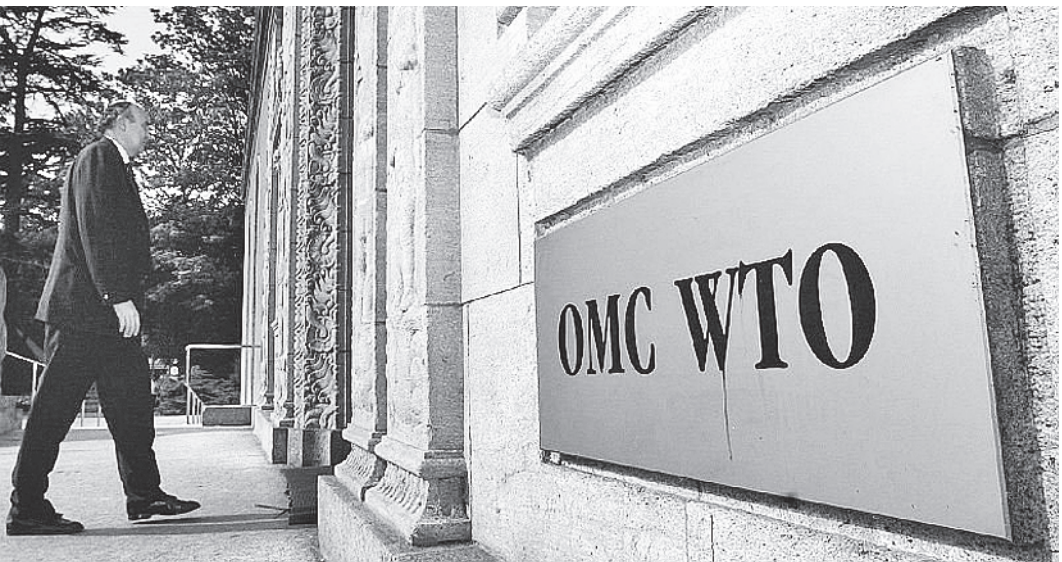
Ратификация пакета документов о вступлении в ВТО должна быть завершена Россией до 23 июля текущего года.