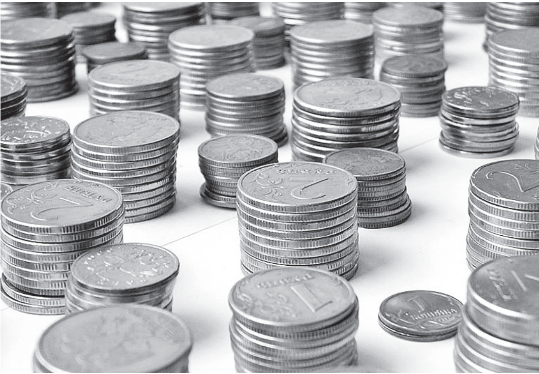
То, что налог на доходы физических лиц находится теперь в федеральном бюджете, позволит органам местного самоуправления более активно заниматься формированием рыночного уклада в экономике муниципального образования.

Мои оппоненты могут меня обвинить в стремлении увеличить налоговые нагрузки на население и предприятия. Это не так. Речь идет о формировании рыночного уклада в муниципальных образованиях. Сегодня собственники квартир с полным комфортом на уровне саун, бассейнов, кондиционеров, гаражей, спутниковых тарелок и так далее платят налоги, практически одинаковые с жителями панельных домов постройки 50-х годов прошлого столетия. А предприятия на окраине города с маленькими доходами платят большие налоги на землю, чем высокодоходные предприятия в центре города. Рыночные отношения в части земли и объектов недвижимости существуют сегодня вне нало-