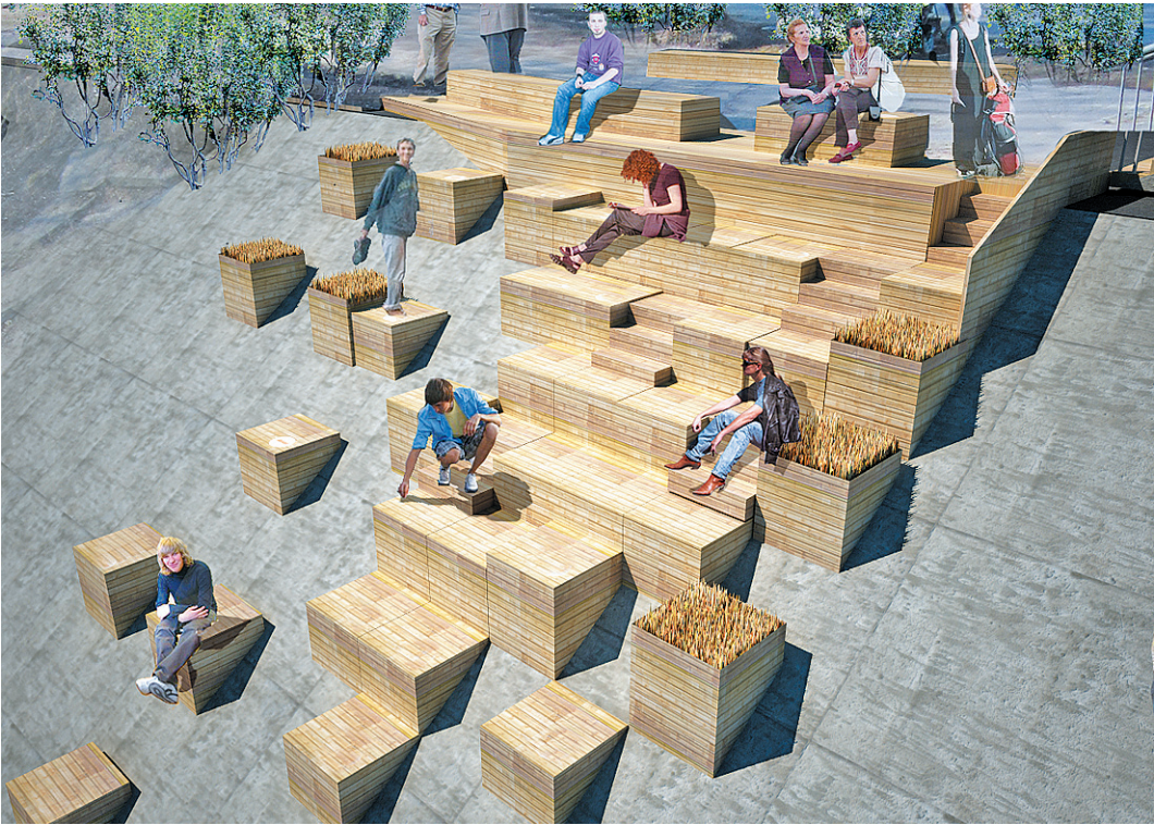
А так ее планируется преобразить в рамках проекта «Активация».