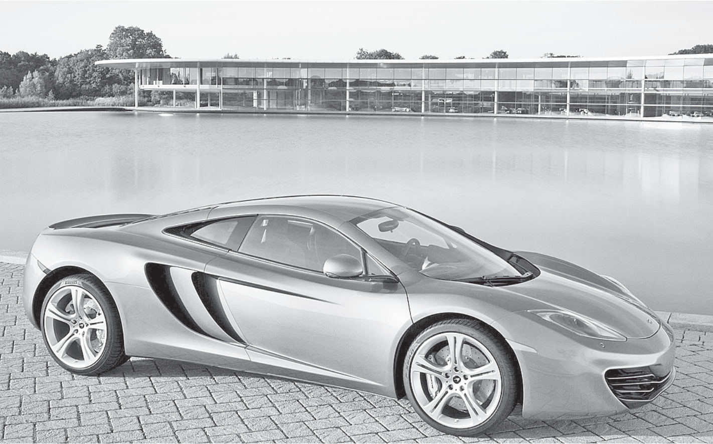
На таком эксклюзивном «Мерседесе» рассекает наследный принц Абу-Даби.