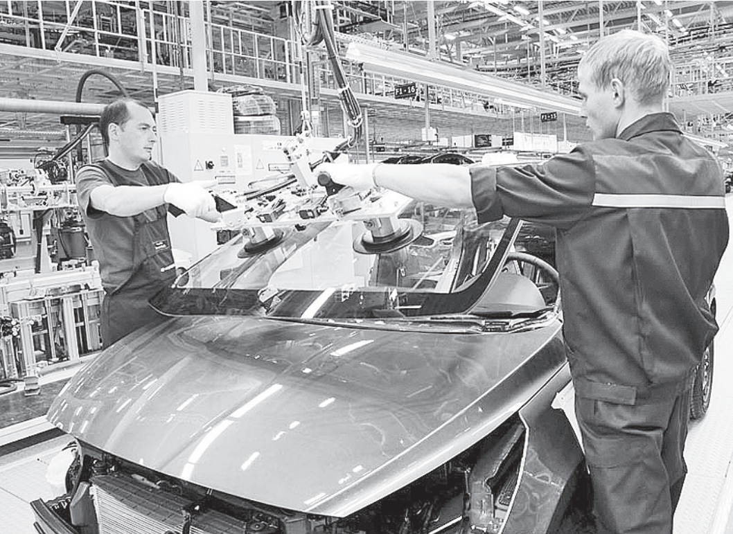
Инициатива Владимира Путина плодотворно скажется на развитии всего российского автопрома.

одно перечисление авто, собираемых в Калининграде, Всеволожске или Калуге, выглядит вполне внушительно. Например, в Петербурге производят Toyota, в том числе даже сейчас довольно популярную у чиновников модель бизнес-класса Camry. В городе на Неве обособилось и производство Nissan, производящее модели Teana, а также X-Trail и Murano. На таких кроссоверах и внедорожниках не стыдно и по районному бездорожью порассекать. Ford Focus во всяческих комплектациях собирают в Все-