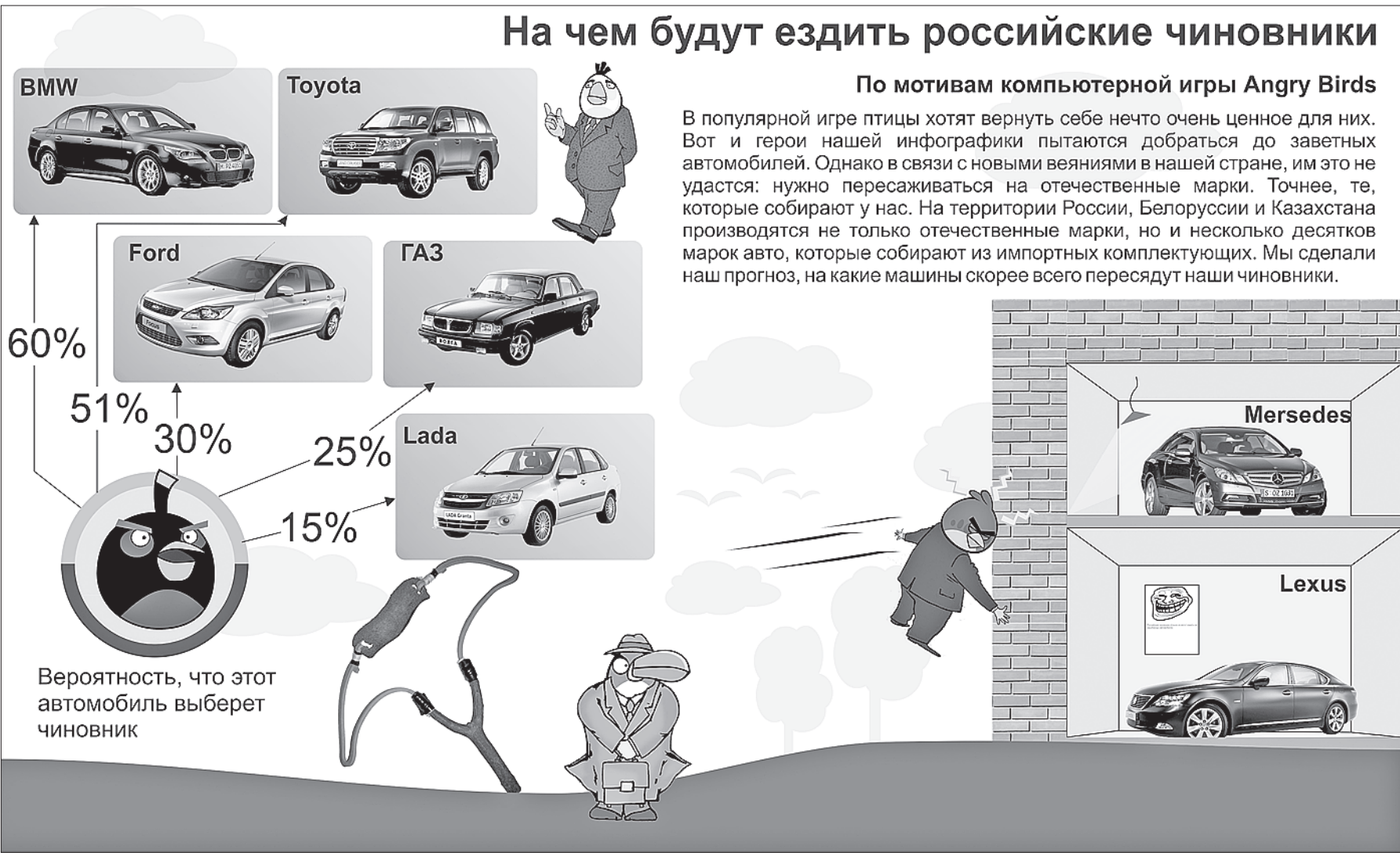
Инфографика Сергея Юрова.

А сколько можно будет сэкономить на ремонте! В прессу на этой неделе «утекла» информация о том, что