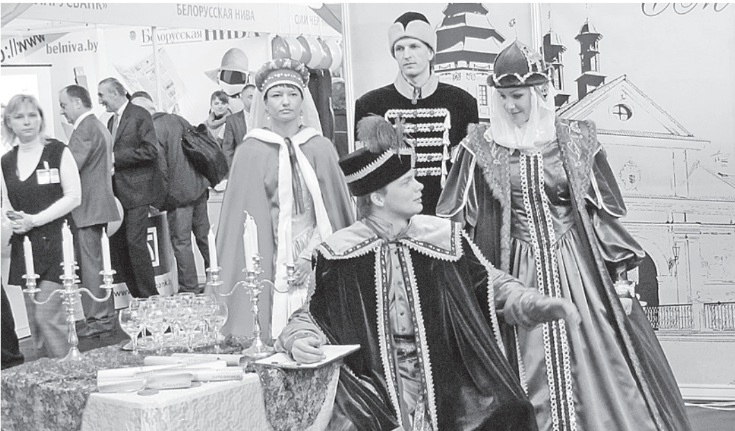
Каждое СМИ старалось привлечь внимание к своему стенду.

- Сейчас все больше изданий отходит от понятия «тираж» и используют термин «циркуруемость», чтобы как можно больше было ссылок на ваш