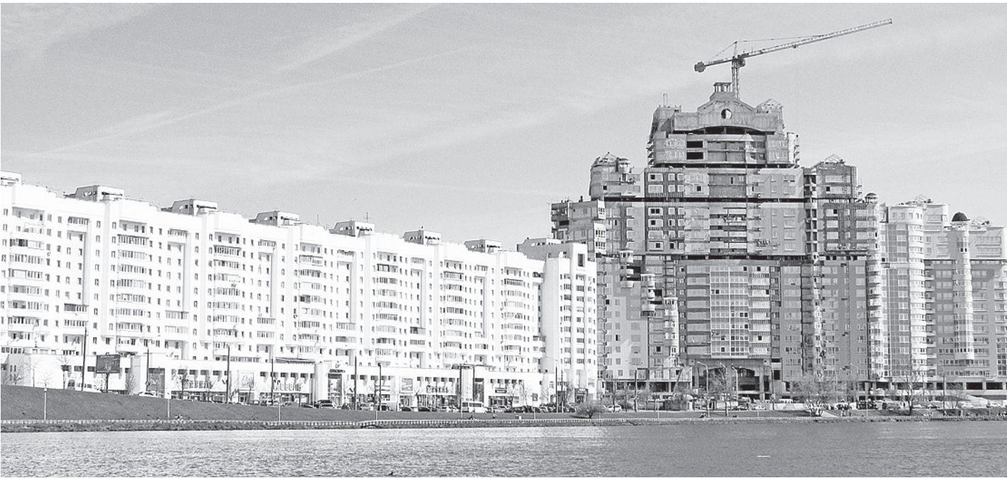
Так выглядит современный Минск - чистый, комфортный, строящийся.

Сегодня в ОАО «БМЗ» работает около 12,5 тысячи человек. В прошлом году завод выпустил 2 миллиона 600 тысяч тонн жидкой стали, а через три года планирует выйти на трехмиллионный рубеж, в связи с чем на предприятии проводится масштабная модернизация производства. Один из приоритетов инвестиционной программы, как и на Череповецком металлургическом комбинате - это экологические мероприятия. Более 80% продукции БМЗ экспортируется в Европу, Россию и другие страны. Недавний кризис заставил белорусских металлургов переориентировать часть своих поставок на рынки