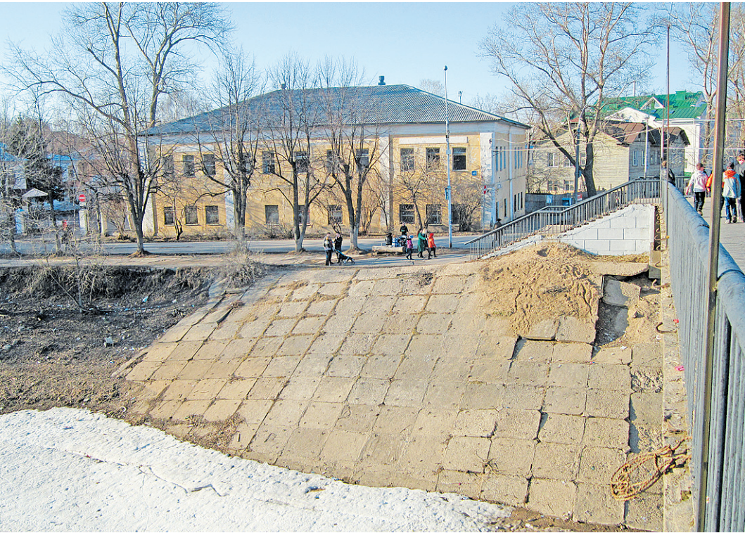
Так сейчас выглядит площадка у пешеходного моста.