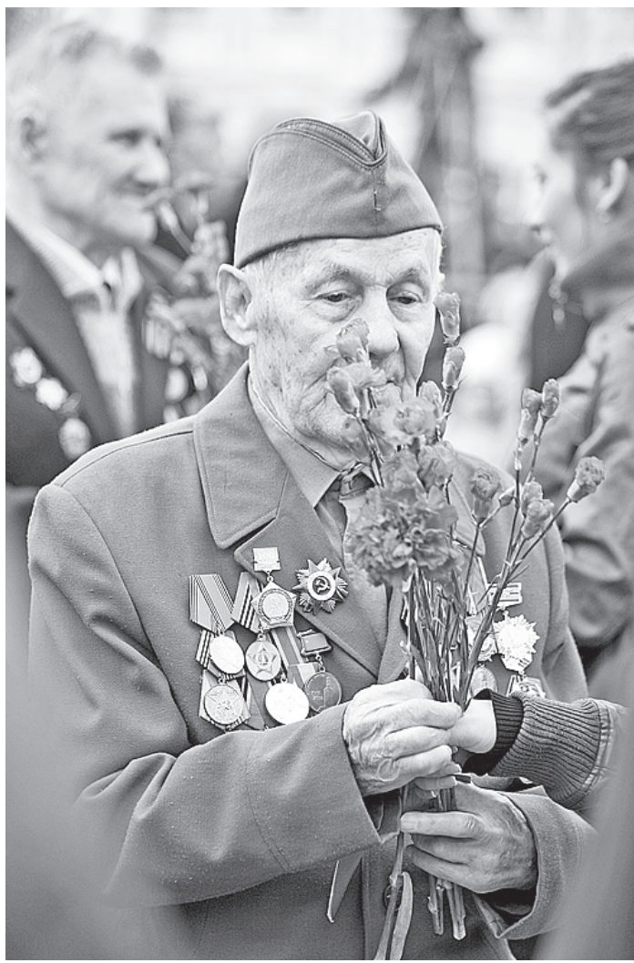
Прохожие дарили ветеранам цветы.