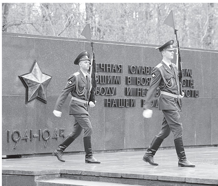
На Воинском мемориале в Череповце почтили память павших героев.