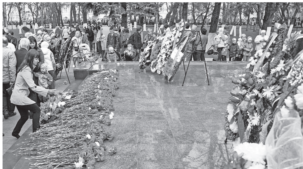
9 Мая мемориальный комплекс у Вечного огня в Вологде был весь устан цветами и венками.

45035 ветеранов Великой Отечественной войны проживают сегодня в Вологодской области. Из них: 3123 человека - инвалиды и участники Великой Отечественной войны; 358 человек - жители блокадного Ленинграда; 41554 человека - труженики тыла.