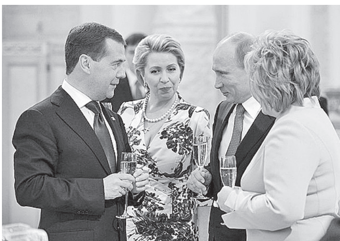
Президент Владимир Путин с супругой Людмилой и премьером Дмитрием Медведевым с супругой Светланой на торжественном приеме в честь инаугурации.

Владимиру Путину он пожелал успехов в новой долж-