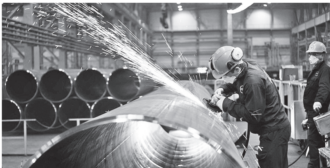
Пока в индустриальном парке «Шексна» запущено только одно производство - трубопрофильный завод.

тифицированных парков России. По мнению экспертов, это позволит шексинской площадке значительно продвинуться в работе по привлечению инвесторов и получить определен-