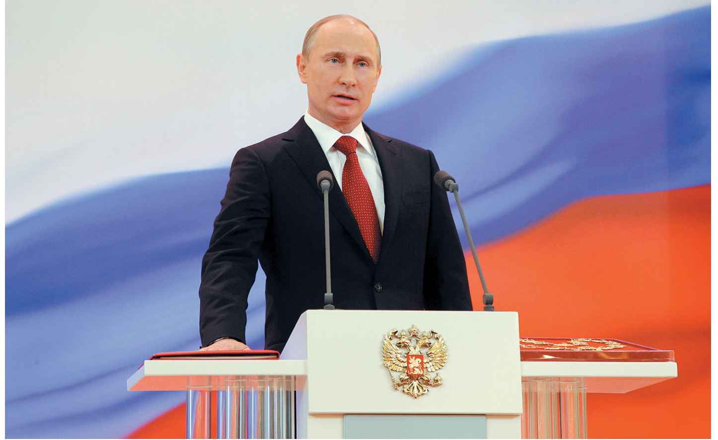
Владимир Путин заявил, что интересы России и благополучие ее граждан всегда будут для него на первом месте.

Все это время гости, собравшиеся в трех залах - Георгиевском, Александровском и Андреевском, с нетерпением ожидали прибытия избранного президента и наблюдали за происходящим на больших плазменных экранах. Среди них были и известные политики, и бизнесмены, и общественные и религиозные деятели, и звезды культуры и спорта, и дипломаты. Пригласили также тех, кто при-