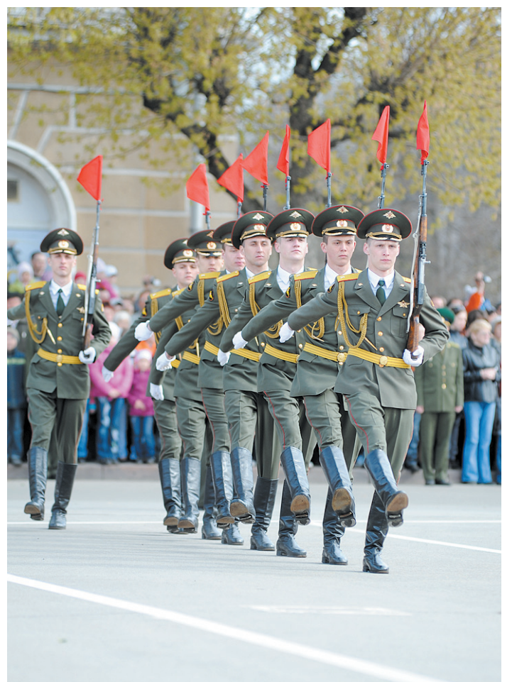
Парад Победы в Череповце.