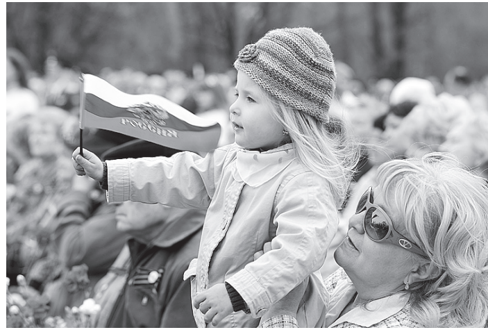
Дети с интересом наблюдали за парадом.

45035 ветеранов Великой Отечественной войны проживают сегодня в Вологодской области. Из них: 3123 человека - инвалиды и участники Великой Отечественной войны; 358 человек - жители блокадного Ленинграда; 41554 человека - труженики тыла.