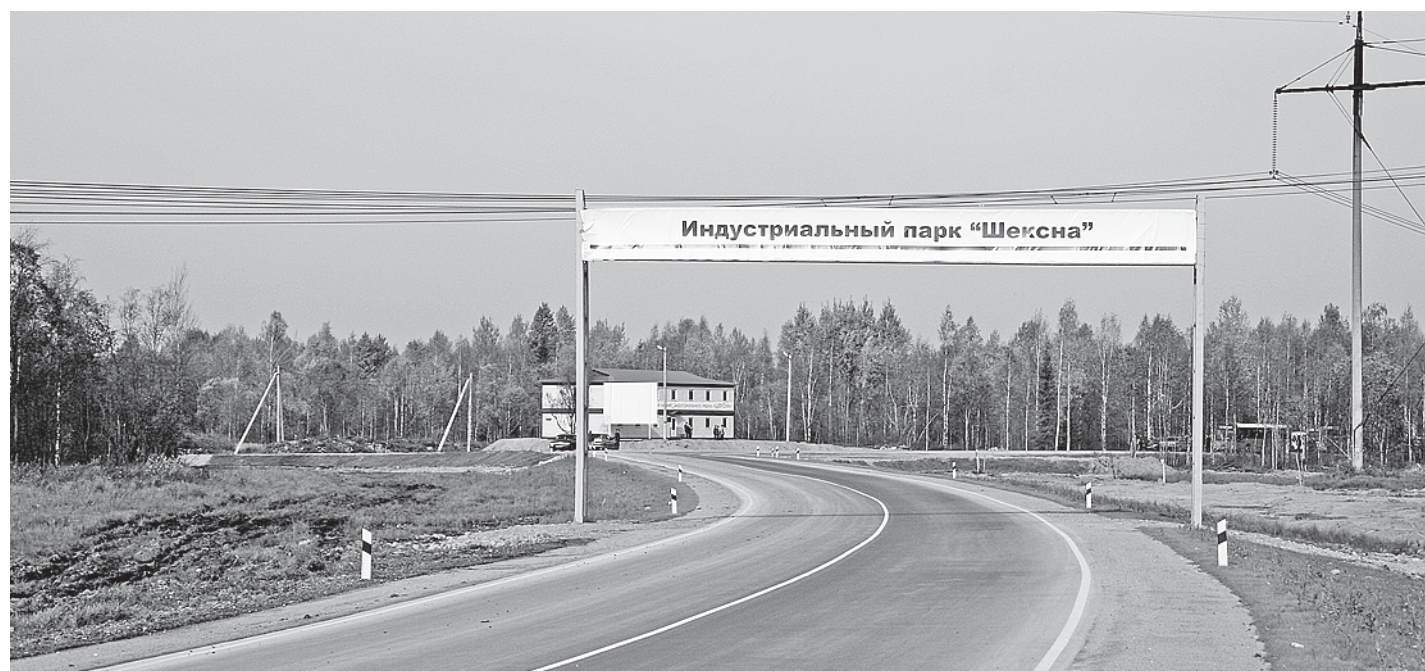
Автотранспортная доступность - одно из главных требований для сертификации индустриальных парков.

В результате индустриальный парк «Шексна» в рамках Международного инвестиционного форума «InvestRussia-2012» получил столь желанный сертификат Ассоциации под номером 14 и вошел в число сер-