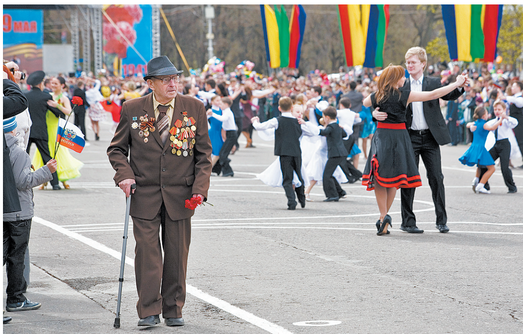
Трогательная и светлая музыка песен военных лет звучала в центре Вологды до самого вечера.

Многие воложане благодарно собравшихся ветеранов за Великую Победу, дарили им гвоздики и открытки с поздравлениями. Поздравили участников Великой Отечественной войны и первые лица области. - Мы помним и чтим имена наших героев-земляков, 172 из которых были удостоены звания Героя Советского Союза, 35 солдат-воложан стали полными кавалерами ордена Славы. Этими людьми, этими героями гордятся фронтовики, Вооруженные Силы, весь народ России. Нам есть что помнить. Нам есть чем гордиться. И мы хотим, чтобы эта память не ушла никогда. Спасибо вам, дорогие ветераны, за то, что вы сделали для страны, для каждого из нас!