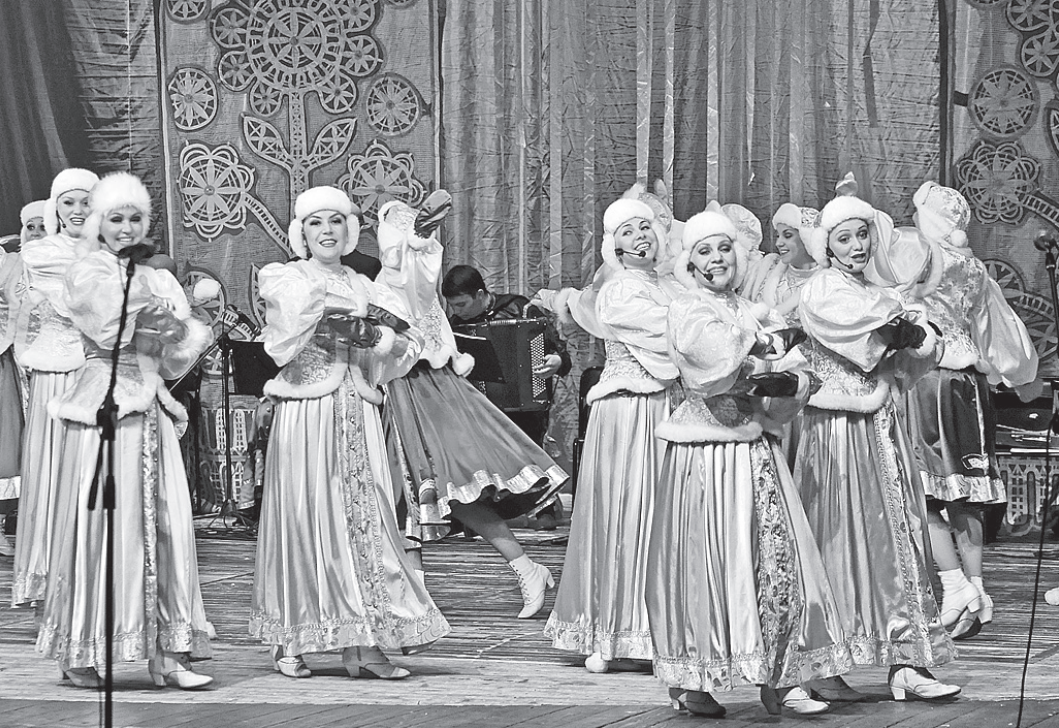
Один из номеров посвящен традиционным зимним забавам.

Русским задором были наполнены все номера программы, которые гармонично вписались в один музыкально-танцевальный спектакль. Вот