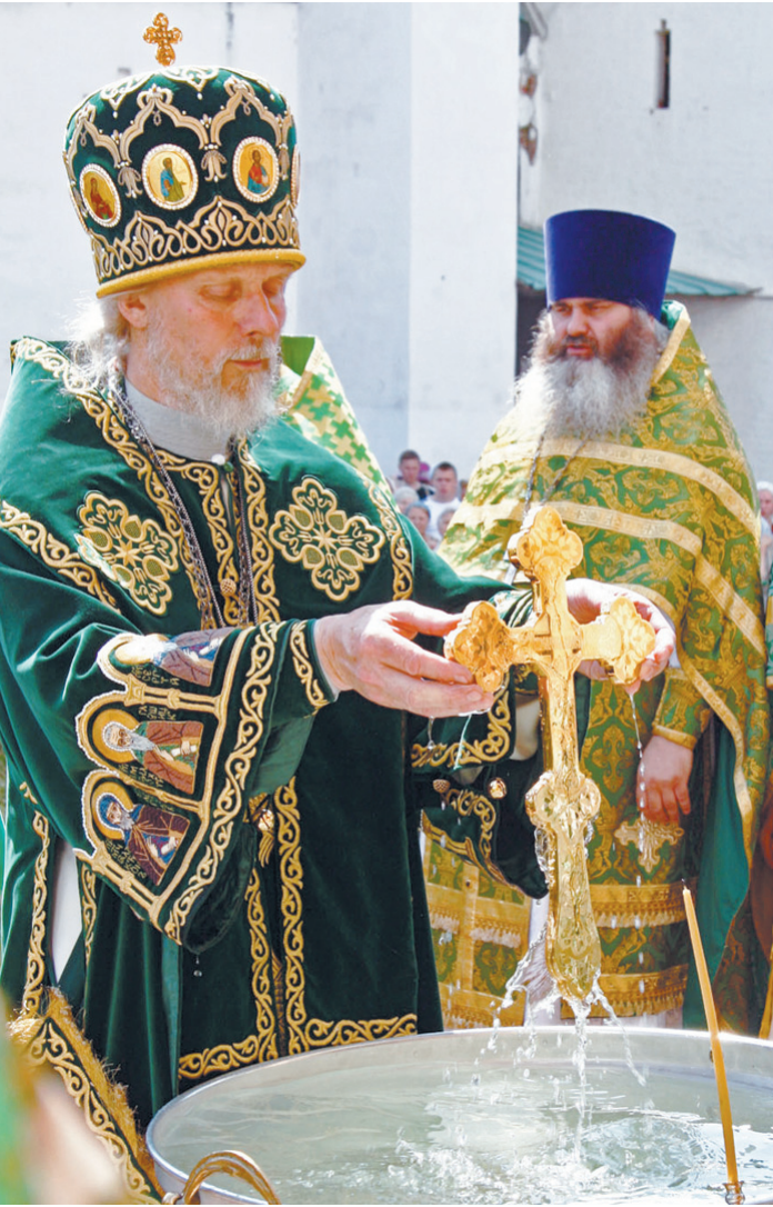
Алексей Колосов «Из серии братья и сестры», 2011 год.

Сегодня в Центральном выставочном зале областной картинной галереи, в 17 часов, открывается выставка художественной фотографии «Душа Вологды», посвященная 865-летию областной столицы.