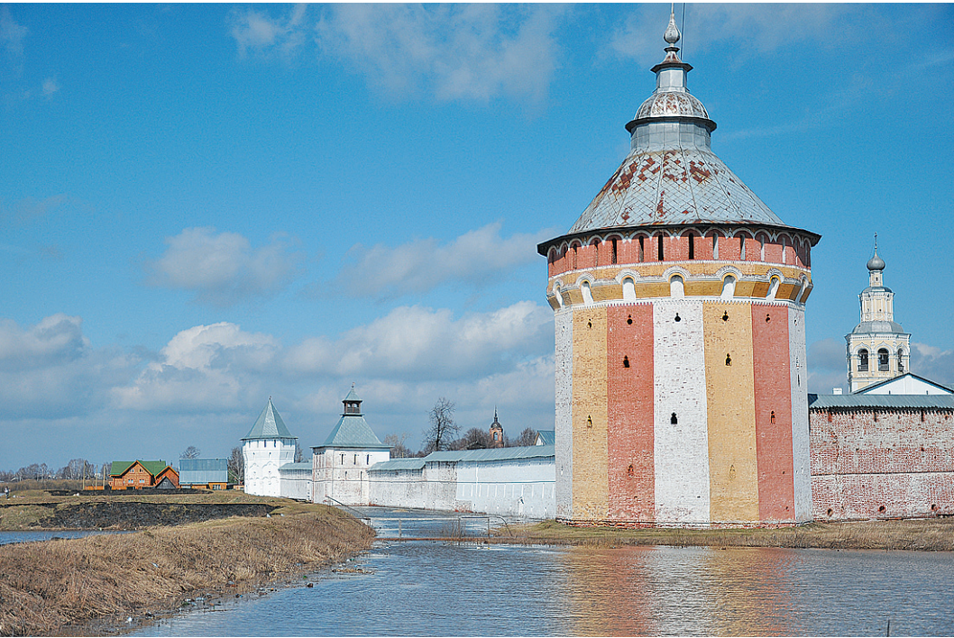
Вода заполнила ров Спасо-Прилуцкого монастыря и подошла к его стенам.

В Баранкове, в том месте где низинный берег, дачи заливаются почти ежегодно, но такого, как нынче, не припомнят даже старожилы. «У меня дача