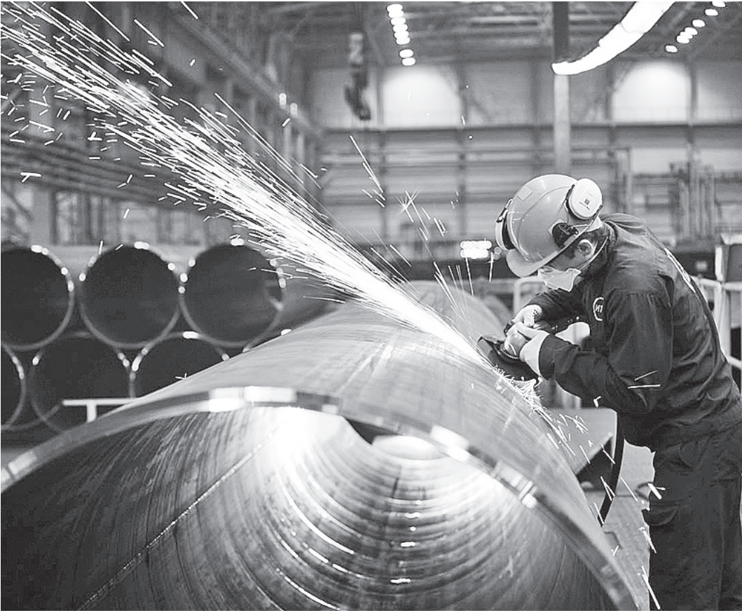
До рекордного уровня увеличился выпуск продукции на Ижорском трубном заводе.

Придуманная еще в 90-е годы прошлого столетия фраза «хорошо для «Северстали» - хорошо для области» не теряет своей актуальности и сейчас. Разумеется, сегодня налоговые платежи металлургов не составляют 80% доходов областной казны, как это было лет десять-пятнадцать на-