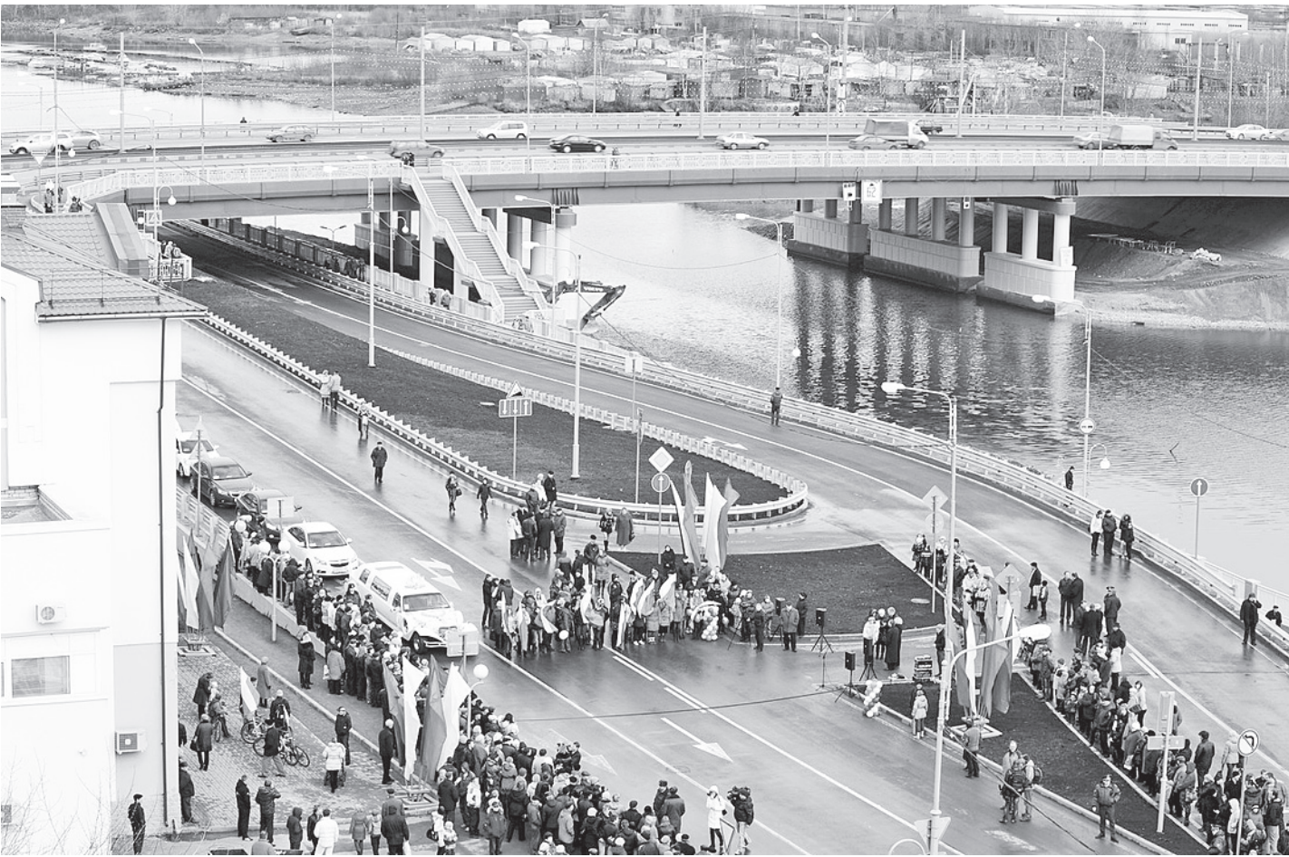
В прошлом году завершились работы по ремонту моста и созданию транспортной развязки через Ягорбу.

Зато в Череповце «поднял голову» малый и средний бизнес. На сегодняшний день это самый крупный череповецкий «работодатель». Причем, если доля промышленности в экономике города в прошлом году составила 96,7%, а на «прочие» виды экономической деятельности приходится» (сюда входят и предпринимательство) - всего 3,3%, то налоговые отчисления от малого и среднего бизнеса в бюджет Череповца в прошлом году составили 700 миллионов рублей (на 22% больше, чем в 2010 году). Это примерно пятая часть от всех налогов, собираемых в городскую казну.