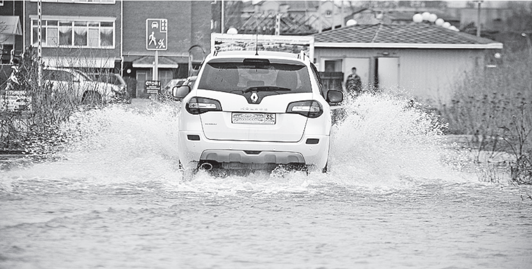
В микрорайон «Прибрежный» по подтопленной набережной можно попасть только на внедорожнике.