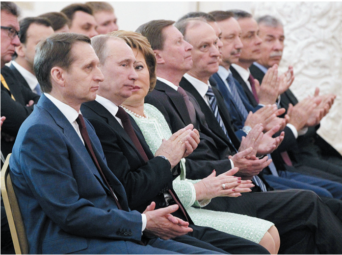
В зале были люди, которые непосредственно влияют на политическую и экономическую ситуацию в стране.

не только развивать демократию, но и добиваться конкретных целей. Медведев их обозначил, как и срок реализации - 2018 год. Во-первых, повышение продолжительности жизни до 75 лет (сейчас в России она составляет 68 лет). Во-вторых,