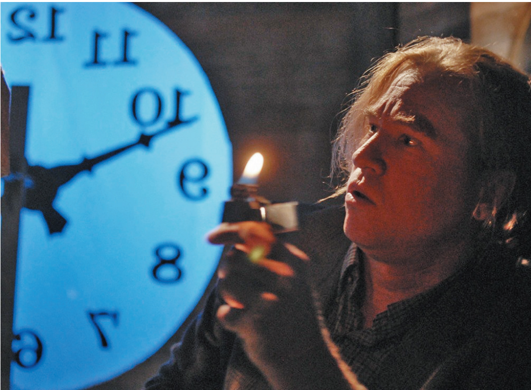
Разгадать тайны городка доверено актеру Вэлу Килмеру.

Сюжет мне приснился, когда я был на отдыхе в Стамбуле десятилетие назад, - рассказывает Френсис Форд. - После этого я увлекся готическим детективом как жанром искусства. Меня поразило умение таких авторов, как