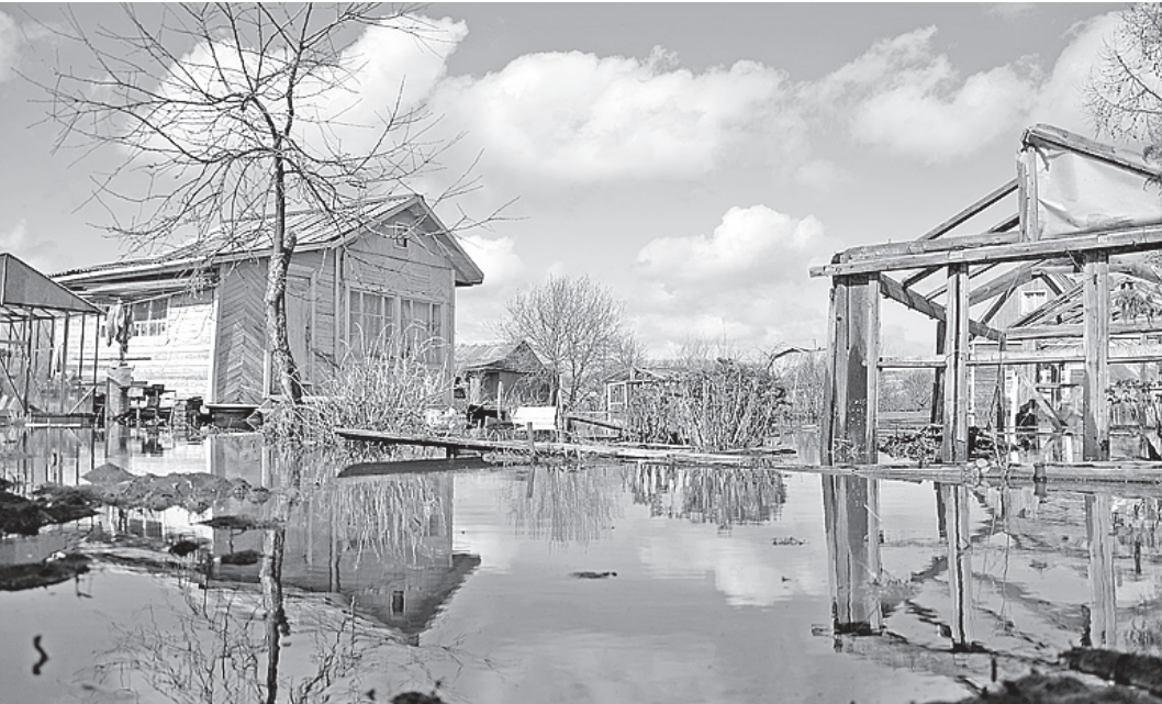
Так теперь выглядят некоторые дачные участки в Екимцево.