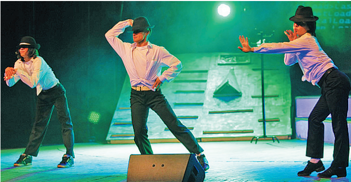
Гран-при фестиваля достался исполнителям хореографического номера, посвященного памяти Майкла Джексона.

- Все выступления поражают своей глубиной, видно, что ребята очень старались. Не перестая удивляться и тому, что студенты каждый год придумы-