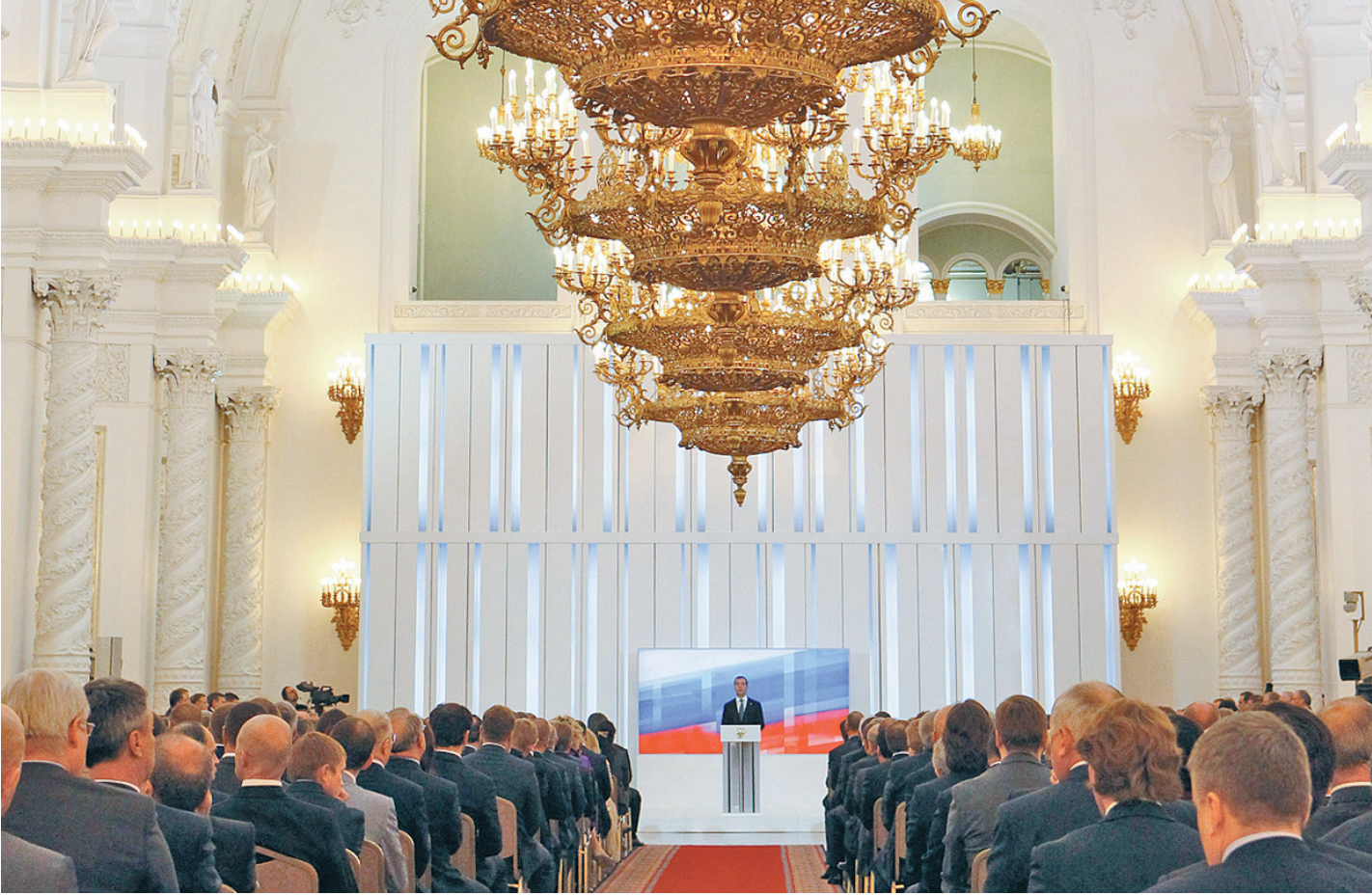
Расширенное заседание Госсовета прошло в Георгиевском зале Большого Кремлевского дворца.

Для того, чтобы одолеть главных врагов свободы, нужно