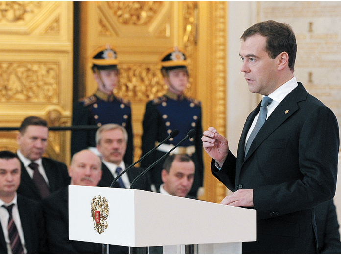
Озвученные задачи по развитию страны Дмитрию Медведеву, вероятно, придется решать уже будучи премьером.

не только развивать демократию, но и добиваться конкретных целей. Медведев их обозначил, как и срок реализации - 2018 год. Во-первых, повышение продолжительности жизни до 75 лет (сейчас в России она составляет 68 лет). Во-вторых,