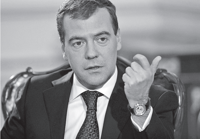
Дмитрий Медведев: «Правительству нужно набраться мужества и провести приватизацию в полном объеме».

Пока же, до того как проведена приватизация, возникает другая проблема - госсобственность незаметно расширяется, когда госкомпания приобретает другой бизнес. «Государство должно прекратить ползучее расширение», - призывал Аганбегян. «Необходимо ввести запрет на увеличение доли госкомпаний за счет расшире-