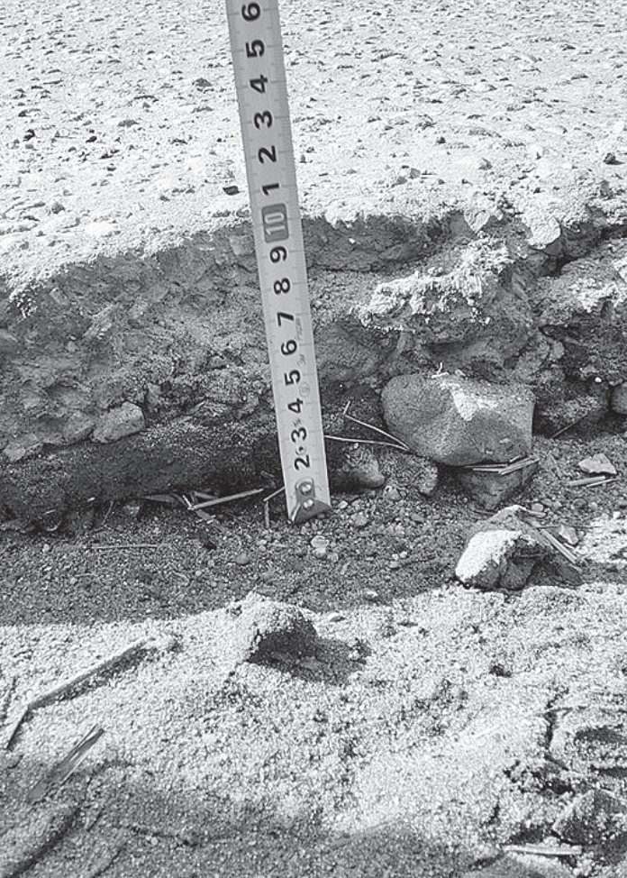
Глубина ямы не должна превышать 5 сантиметров.