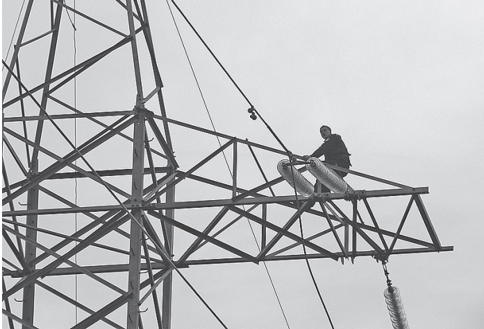
По мнению экспертов, заявленная и фактически потребляемая энергия отличаются в разы.

По мнению Леонида Мазо, отсутствие подобного законодательно закрепленного механизма оплаты зарезервированной, но не используемой потре-