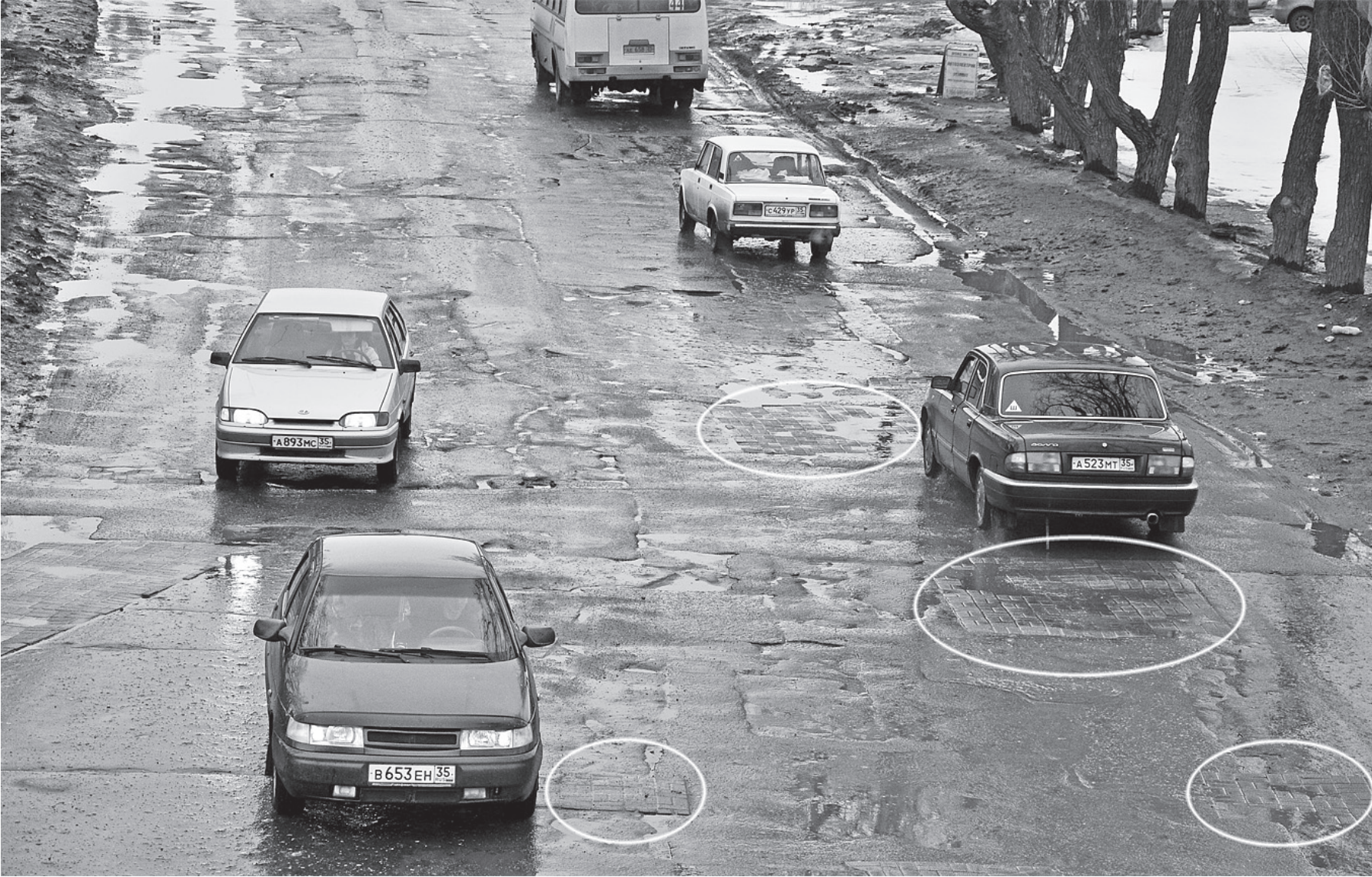
Ямы на дорогах в Вологде заделывают тротуарной плиткой, потому что при минусовых температурах укладывать асфальт запрещено. По технологии плитку должно убирать и заливать ямы асфальтом. Однако в действительности брусчатку можно встретить круглый сезон практически на любой улице областного центра.

- нашим дорогам можно позавидовать, оценка «отлично».