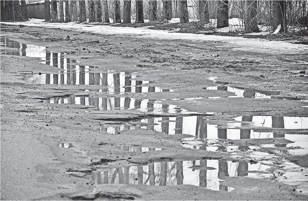
Улица Можайского в Вологде. Сотрудники городского отделения ГИБДД предупреждают: по таким дорогам следует ехать, строго соблюдая дистанцию.

На самом деле, проблема с ямами на дорогах в Вологде стоит значительно острее, чем в Череповце. И связано это с тем, что в городе на части дорог отсутствует, либо неисправна ливневая канализация. Вода стоит на дорожном полотне, постепенно просачиваясь внутрь. При ночных перепадах температур начинается потихоньку образовывать маленькую трещину. Дальше - больше. Поэтому Вологда сможет справиться с этим стихийным бедствием только в том случае, если создаст в городе нормальную функционирующую ливневую канализацию. В планах у городской администрации это есть, но бюджет не позволяет решить проблему разом.