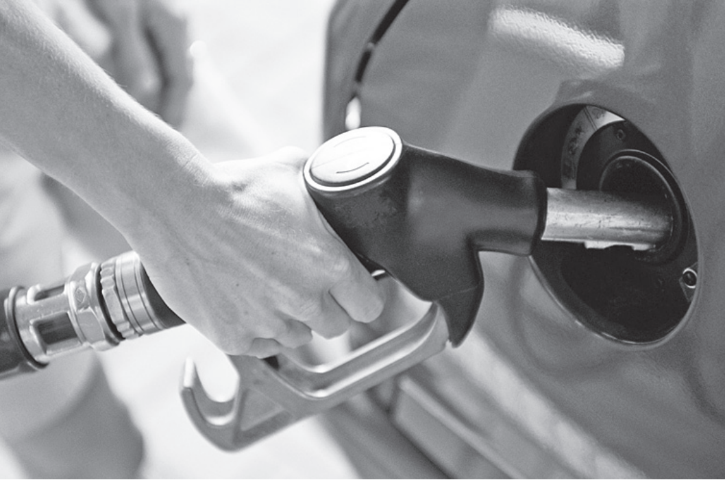
Завершена разработка законопроекта, предусматривающего введение плавающих акцизов на топливо.

Но в ноябре прошлого года был подписан закон, который повысил ставки акцизов: в этом году дважды (с 1 января и 1 июля), затем в январе 2013-го и январе 2014 года. Средства от акцизов на топливо поступают в дорожные фонды. «Это значительные ресурсы - если от