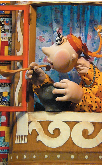
На героев спектакля нельзя смотреть без улыбки.

мочь коллегам с Урала в этой презентации. Екатеринбургский муниципальный театр кукол, второй участник конгресса от России, представит спектакль «Карнавал Петрушек». Четыре года назад он уже претендовал на место проведения конгресса кукольных театров, но уступил китайцам шесть голосов. Надемся, в этом году им повезет больше, и все куклы мира вскоре встретятся в Екатеринбурге. Кстати, именно в этом регионе в