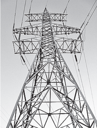
Реконструкция ЛЭП обеспечит безопасность электросети.