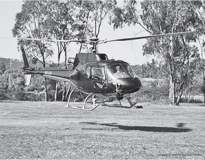
В этом году к авиатроллингованию лесов Вологодчины впервые будет привлечен небольшой вертолет «Eurocopter».

В этом году впервые будут выделены федеральные средства на авиатроллингование Национального парка «Русский Север» и Дарвинского государственного заповедника. Этот вопрос обсуждался в департаменте лесного комплекса региона на совещании, посвященном подготовке к пожароопасному сезону.