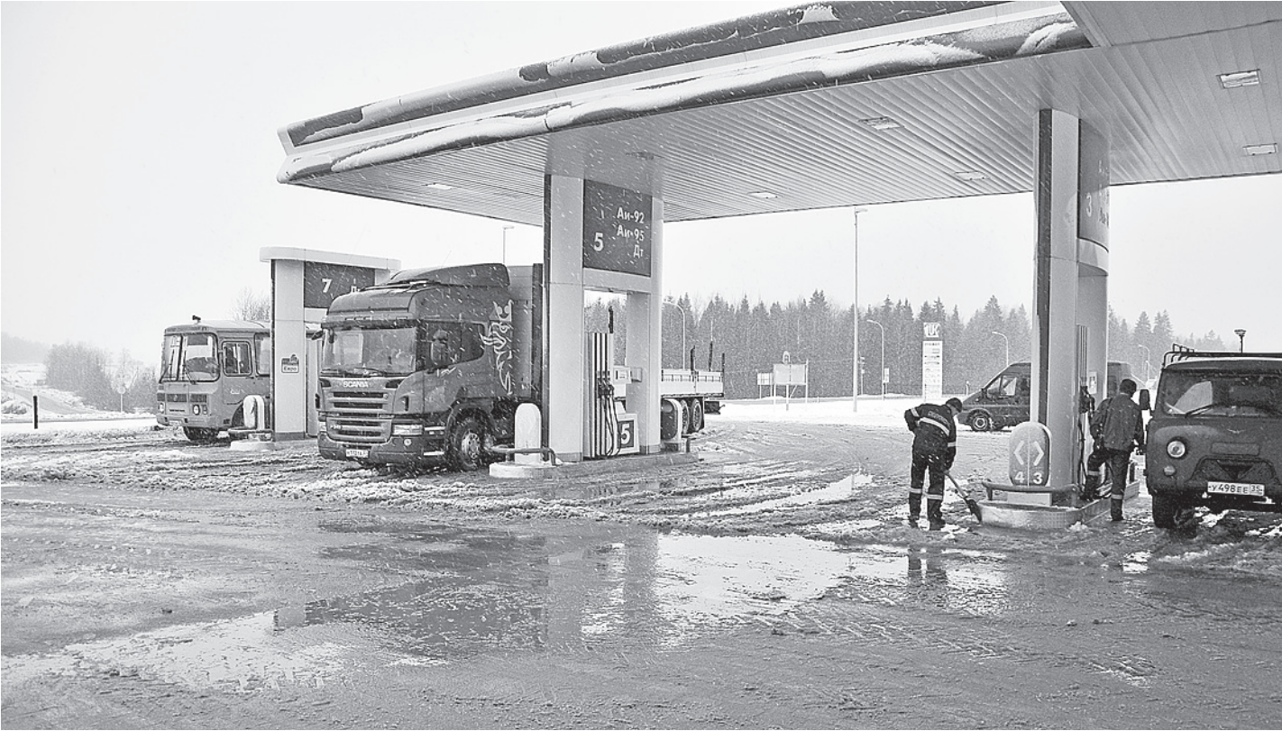
Сеть АЗС «ЛУКОЙЛ» самая разветвленная в нашей области.

Затронули на встрече и тему поставки льготного топли-