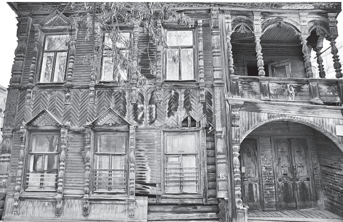
На восстановление таких домов нужны немалые средства.

В начале апреля в «Новостях культуры» показали сюжет о нашем городе. Жаль только, что повод для передачи был совсем нерадостный - «кружевная» столица России рискует остаться без резных палисадов.