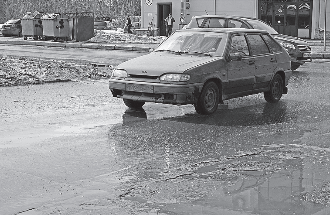
Московский проспект в Череповце. Несмотря на то, что дорога была отремонтирована в прошлом году, на ней уже ямы.