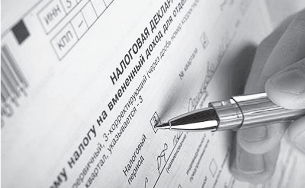
С начала года налогоплательщики Вологодской области представили в налоговые органы более 30 тысяч деклараций о доходах за 2011 год.

- Нынешняя декларационная кампания в самом разгаре. Что можно сказать о ее предварительных результатах?