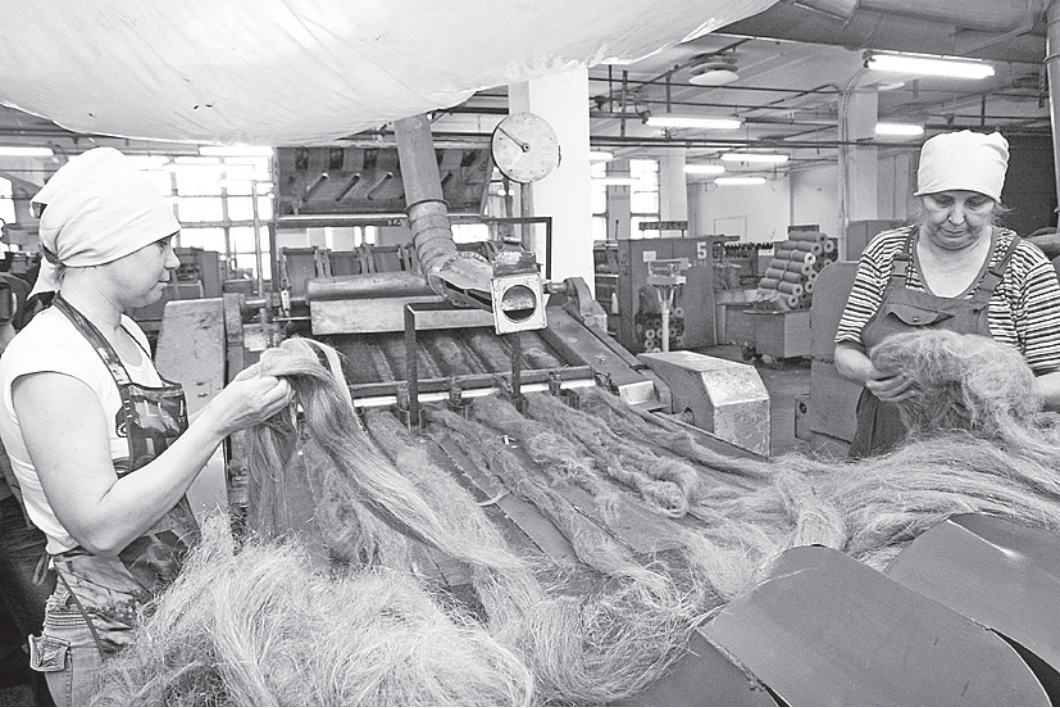
«Вологодский текстиль» использует только 30% местного льноволокна, остальное покупает за пределами области.