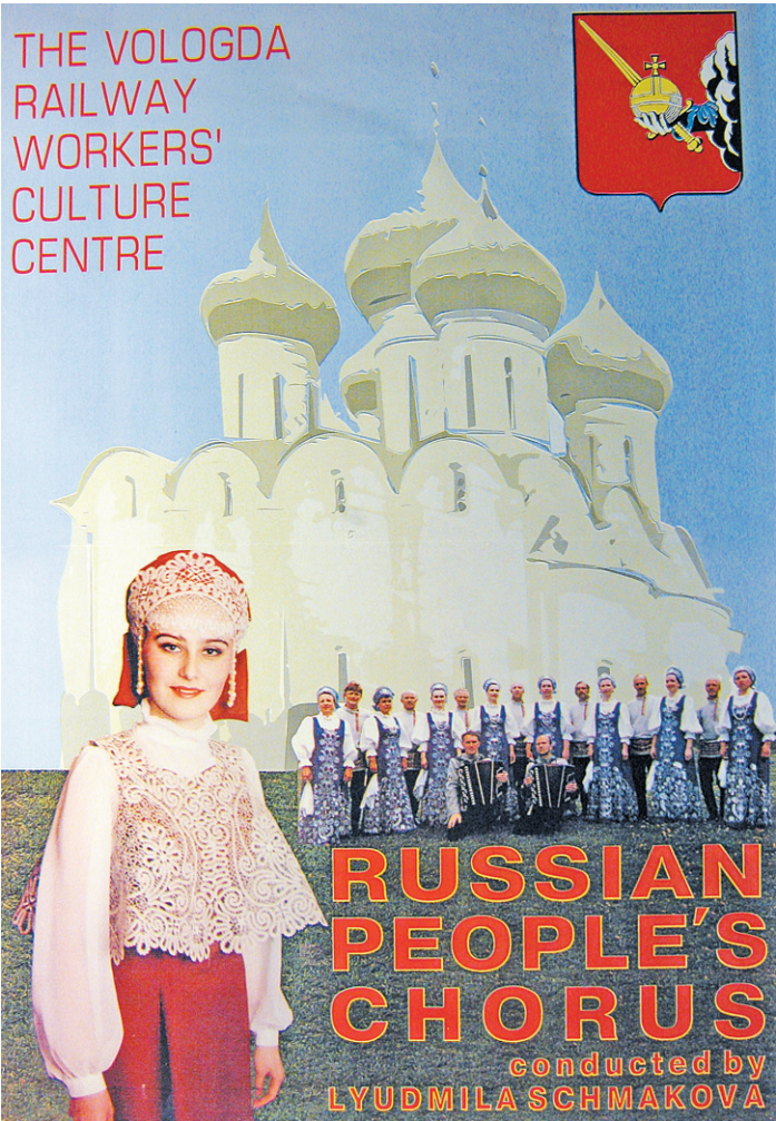
Вологодский коллектив с большим успехом гастролировал по Финляндии.