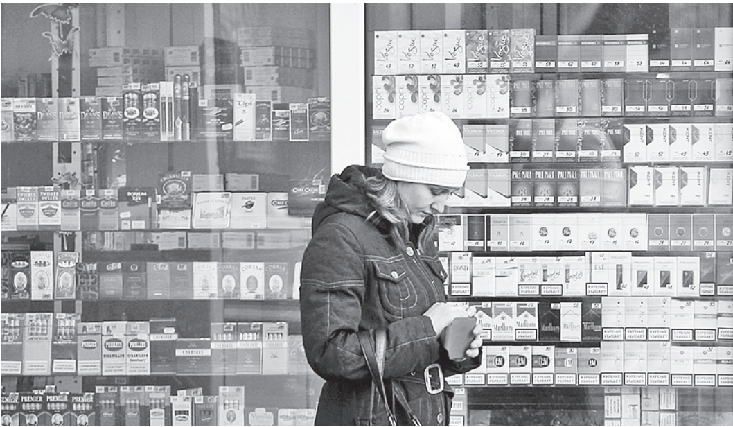
Маленькие магазинчики, павильоны и киоски шаговой доступности живут в основном за счет торговли пивом и табачной продукцией.