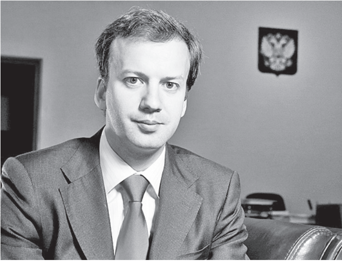
Аркадий Дворкович уверен в необходимости монетизировать льготы госслужащих.

На том же заседании президент назвал ситуацию с зарплатами чиновников пестрой. На федеральном уровне есть управленцы с зарплатой 100 тысяч рублей в месяц. Но есть