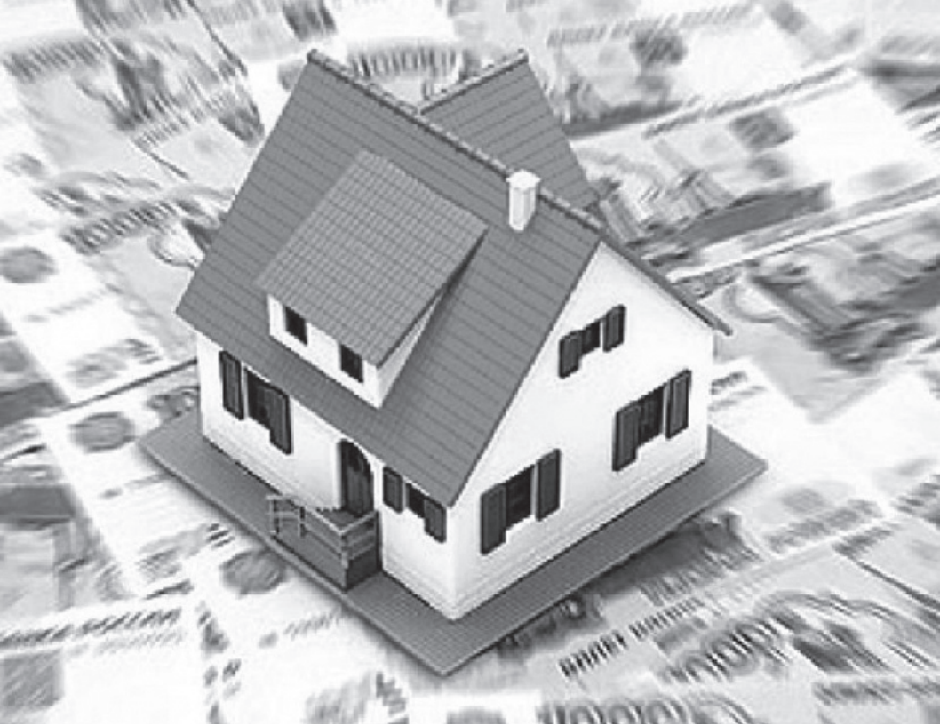
Сделать налогообложение более справедливым должно введение единого налога на недвижимость.