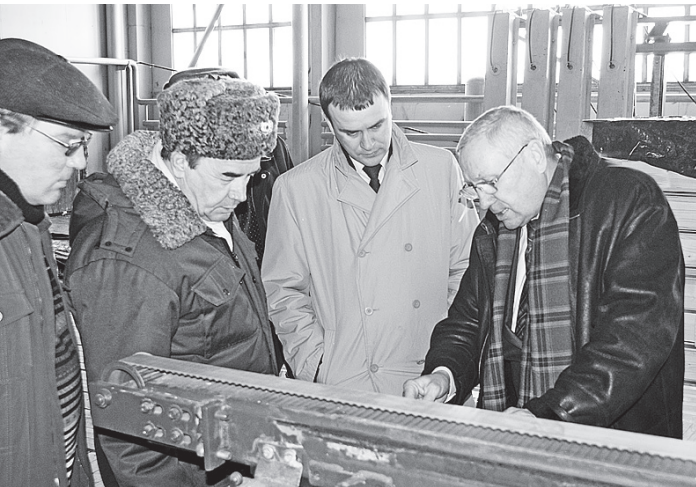
На Новаторском лесопромышленном комбинате.

Также в рамках ярмарки профессий состоялся семинар