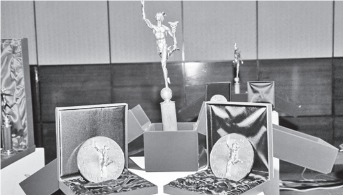
Победители регионального конкурса «Серебряный Меркурий» смогут побороться за «Золотого Меркурия».