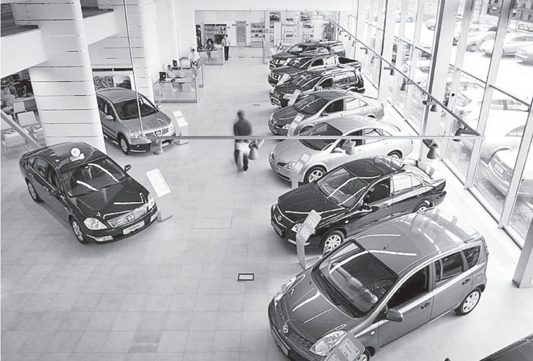
По мнению экспертов, вступление России в ВТО приведет к падению продаж новых бюджетных автомобилей отечественного производства.

Альянс Renault-Nissan продолжит инвестировать в локальное производство, так как вступление в ВТО не снизит валютных рисков в случае изменения курса рубля по отношению к другим валютам, продолжил он. За счет объе-