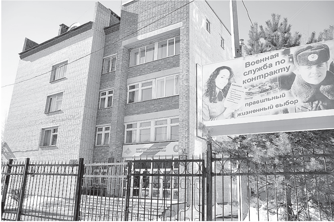
В областном военном комиссариате сейчас двоевластие.

Затем грабители заперли его в сторожке, погрузили похищенное в ВАЗ пятнадцатой модели и уехали в неизвест-