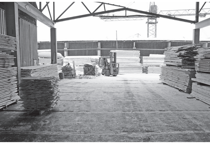
Лесной комплекс наращивает объемы производства.

«Кадровое обеспечение лесного комплекса Вологодской области».