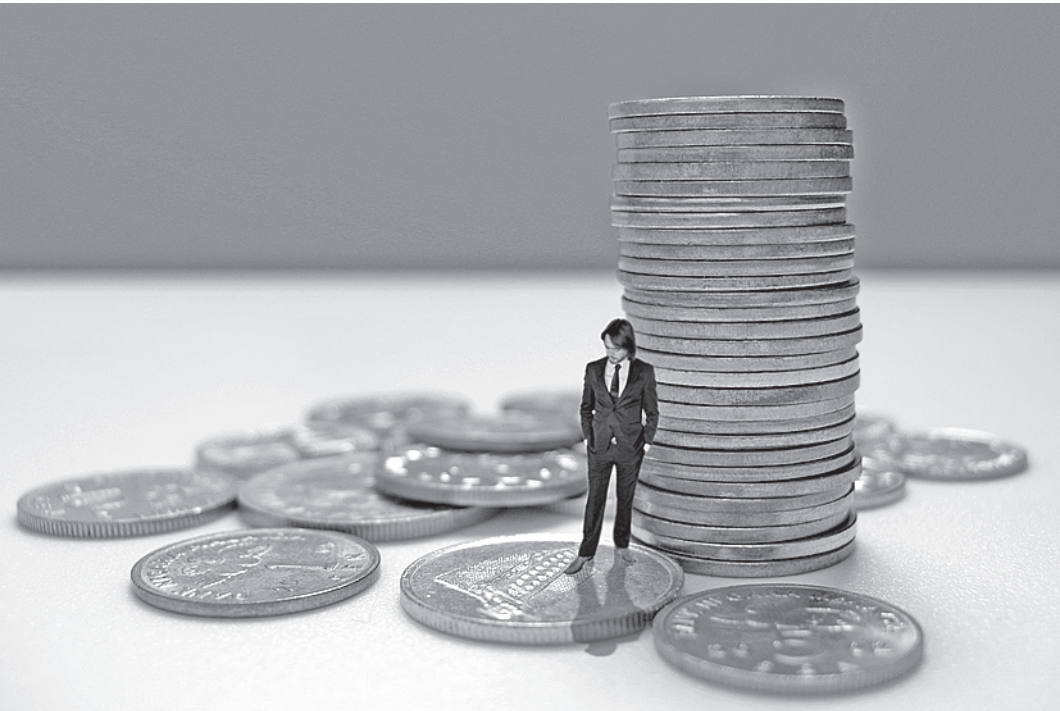
Субсидирование процентных ставок по кредитам - наиболее востребованная помощь, которую государство сегодня может оказать малому бизнесу.