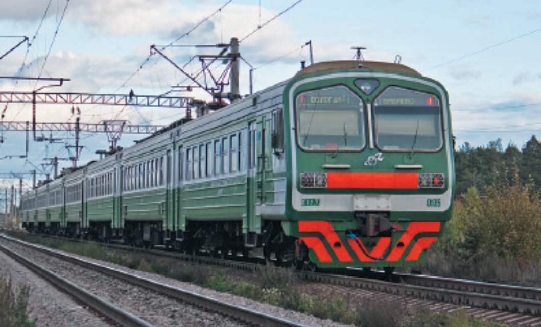
Затраты на организацию пригородных пассажирских перевозок железнодорожникам компенсирует Правительство области из региональной казны.