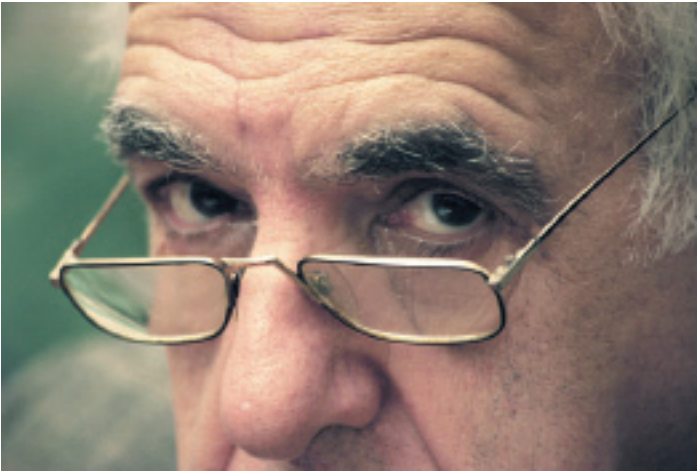
«Пойми меня хоть ты, мой лучший адресат!» - обращение Евгения Рейна к Иосифу Бродскому.

Спустя 80 лет в Москве вышел в свет первый номер альманаха «Вавилон», объединивший молодых литераторов, ставших во главу угла представление о литературе как о сфере поиска. В частности, в нем была опубликована подборка стихот-