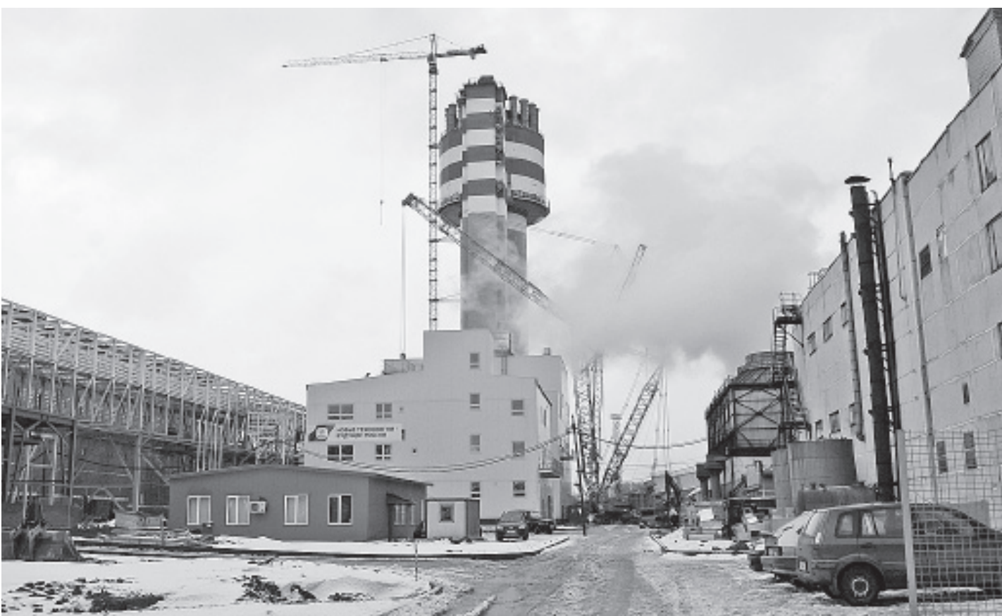
Пуск второго агрегата по производству карбамида в Череповце должен стать одним из главных событий в экономике области в 2012 году.

В 2012 году произошло снижение страховых взносов. То, вокруг чего было сломано немало копий, все же случилось. Хотя и не так кардинально, как того добивались предприниматели, с 34 до 30%. А для малых и средних предприятий, работающих на «упрощенке» в социальной и производственной сферах, ставка снижена до 20%. Другая приятная новость: ЕНВД, который планировали постепенно заменить на патент, вероятнее всего, останется.