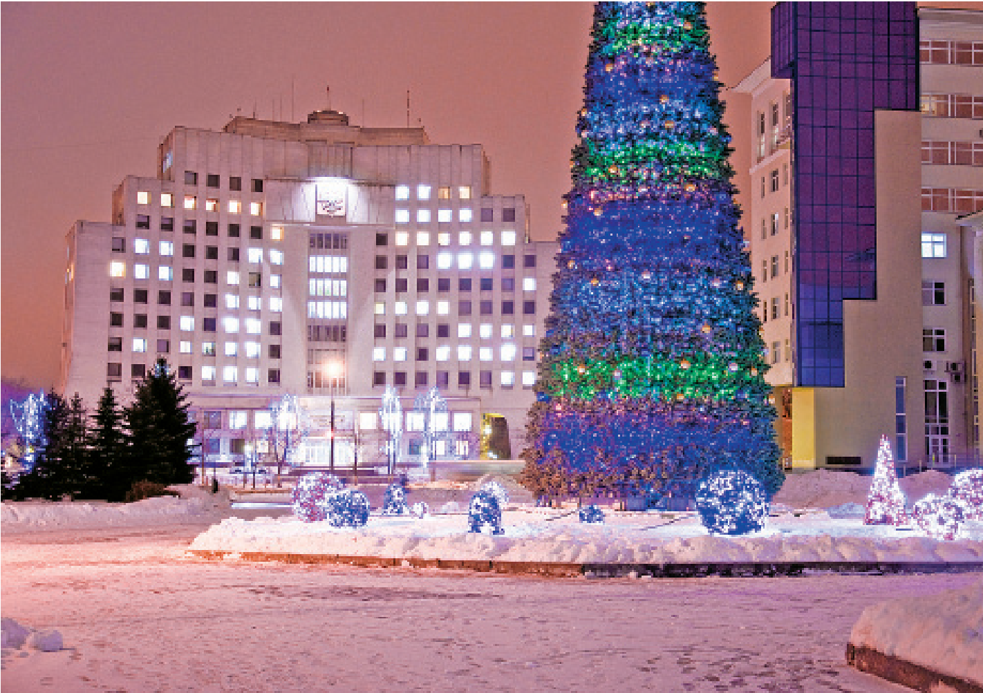
Определенность в Правительстве Вологодчины может наступить уже на следующей неделе.