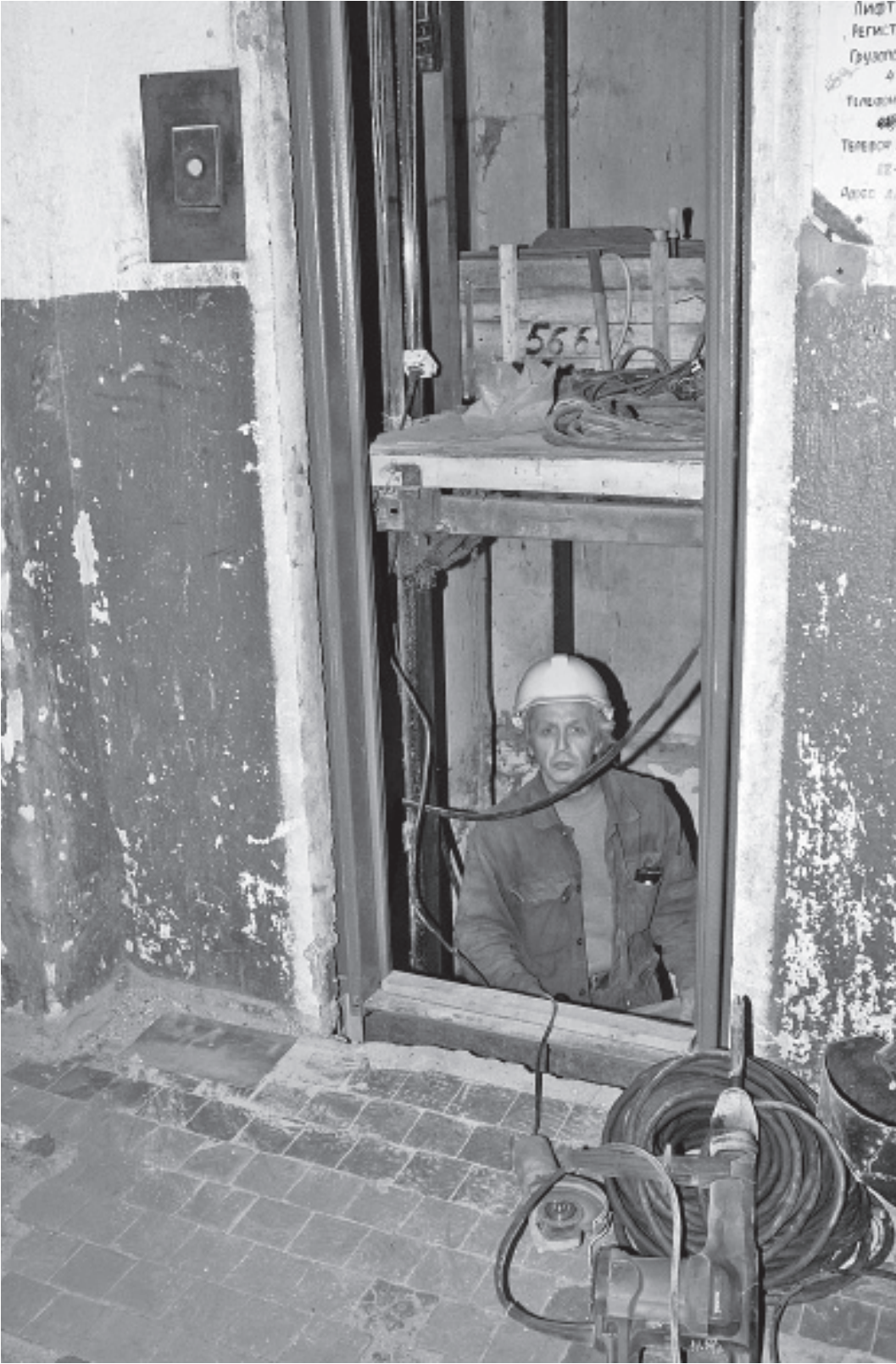
Как полагают следственные органы, замена 22 лифтов в разных домах города металлургов обернулась ущербом в размере более двух миллионов рублей.