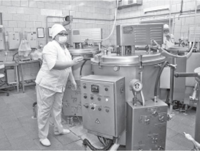
Молочная кухня будет закрыта до конца января.