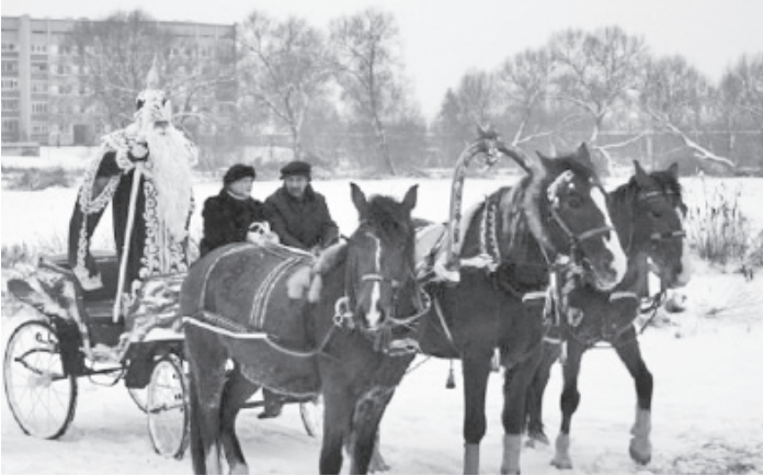
Поездки Деда Мороза в Латвию давно стали традиционными. Чем же он помешал латышским чиновникам?