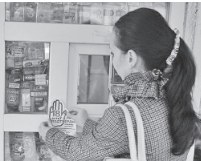
Сразу несколько торговых точек попались на продаже сигарет и спиртного несовершеннолетним.