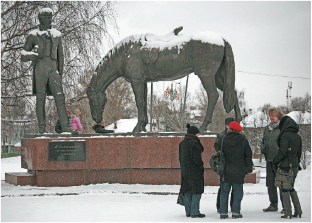
«Снежный Опен-Эйр» состоялся у памятника Батюшкову.