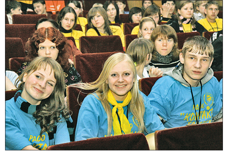
Среди участников фестиваля много молодых людей, прекрасно зарекомендовавших себя в самых различных отраслях деятельности.

ботанные механизмы и изделия, а значит, получить деловые предложения по работе и продвижению по карьерной лестнице». Стоит отметить, что в ходе проведения фестиваля представителями молодежного общественного движения была достигнута договоренность о создании Ассоциации детских и молодежных общественных объединений Вологодской области. «Создание ассоциации станет важным шагом на пути вступления общественного молодежного движения области в Национальный совет детских и молодежных общественных объединений России. Кроме того, через ассоциацию смогут полу-