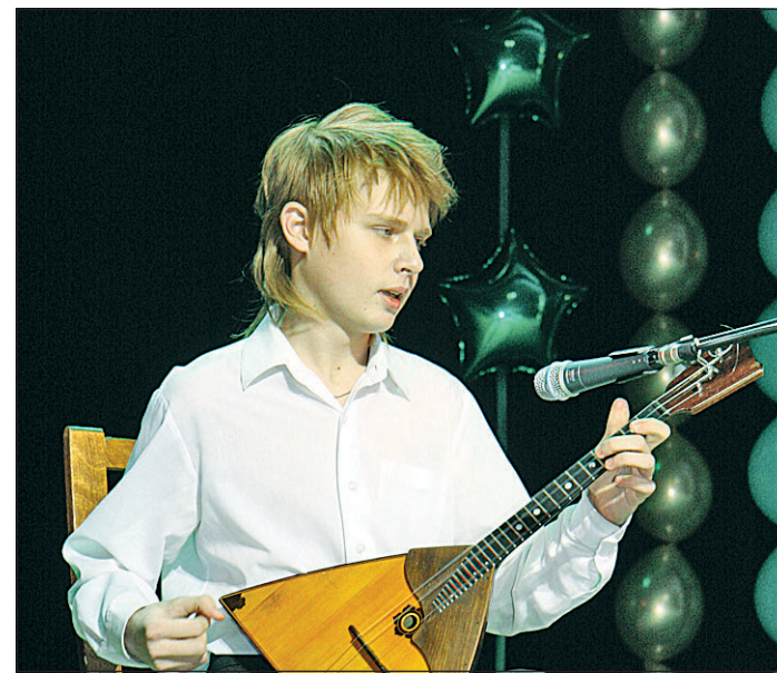
На заключительном концерте фестиваля молодые исполнители блистали своим мастерством.