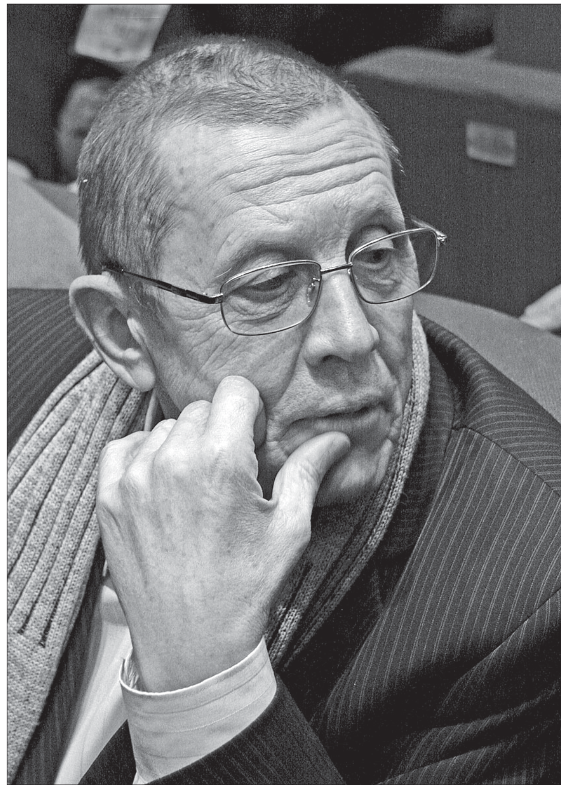
Народный артист России Валерий ЗОЛОТУХИН читал стихи Николая РУБЦОВА.