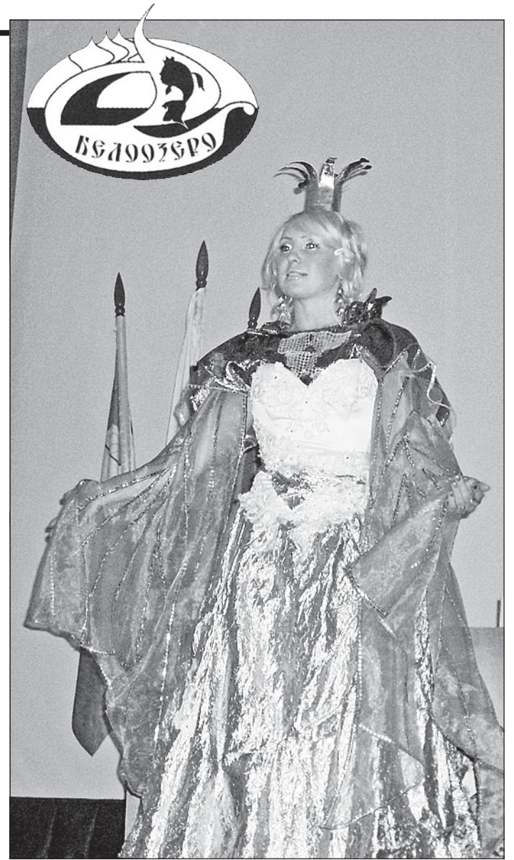
Все желания сбудутся, если Золотая рыбка поможет.