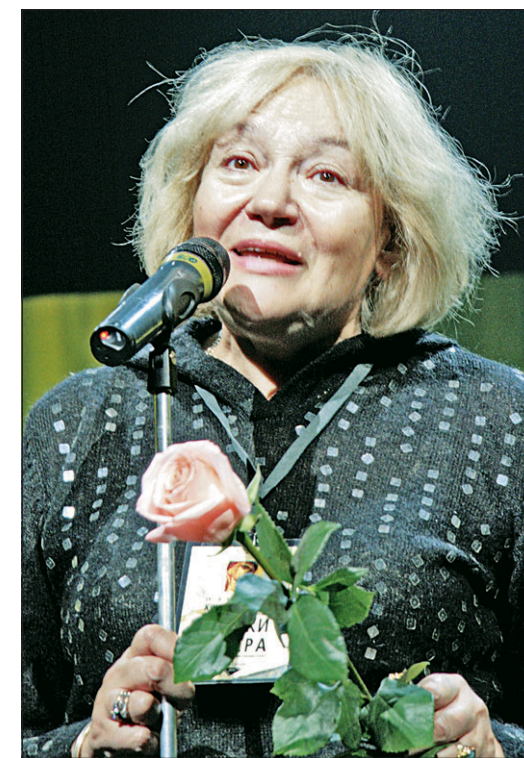
Заслуженная артистка России Елена САНАЕВА.