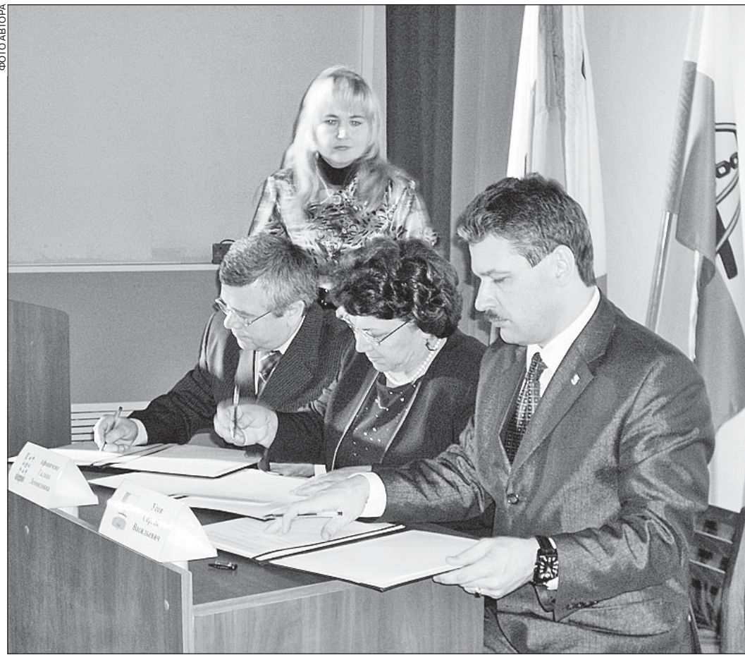
Торжественный момент подписания Соглашения о межмуниципальном сотрудничестве в сфере туризма.

За последние десять лет туризм в области признан фактором активизации экономики и социальной жизни, важнейшим стимулом сохранения и возрождения исторических территорий. Развивается туризм - развивается и весь комплекс индустрии гостеприимства: транспорт, отдых, лечение, экскурсии, досуг, образование. Особенно активно область посещается в программах речных круизов