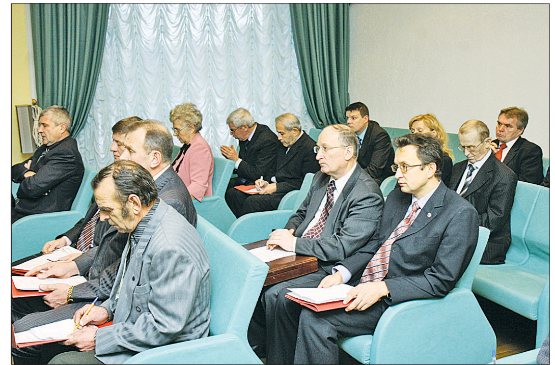
У каждого из участников заседания были свои конкретные предложения по улучшению создавшейся ситуации.

В пятницу, 28 ноября, состоялось первое расширенное заседание Совета по физической культуре и спорту при Губернаторе области.