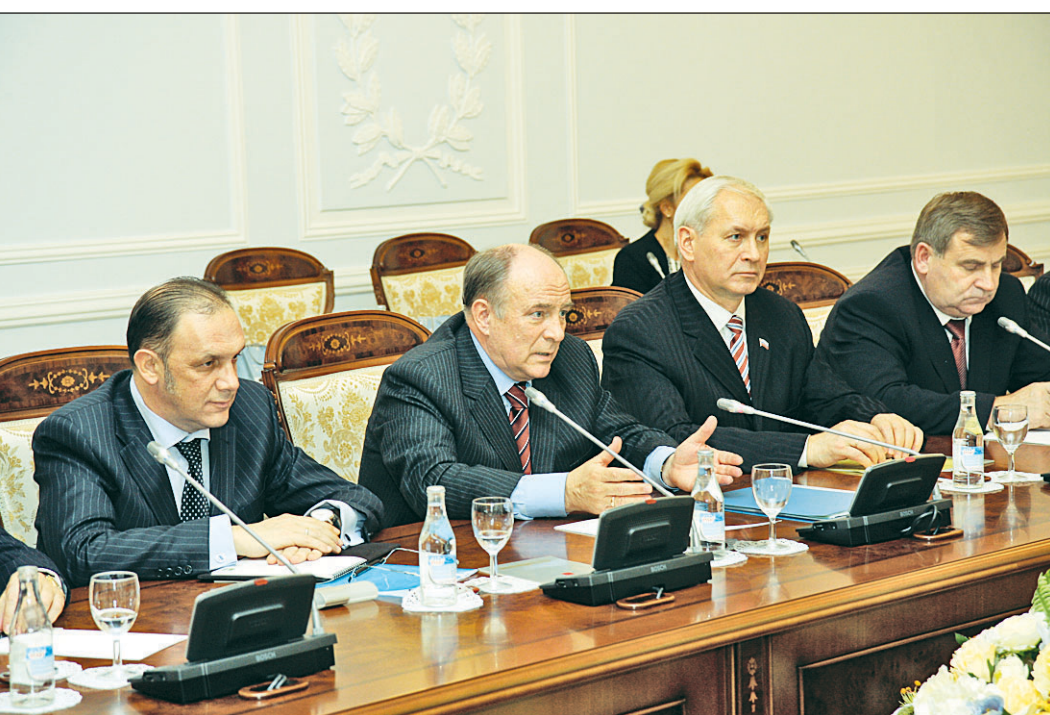
Во время встречи Губернатор Вячеслав ПОЗГАЛЕВ озвучил приоритетные направления сотрудничества.