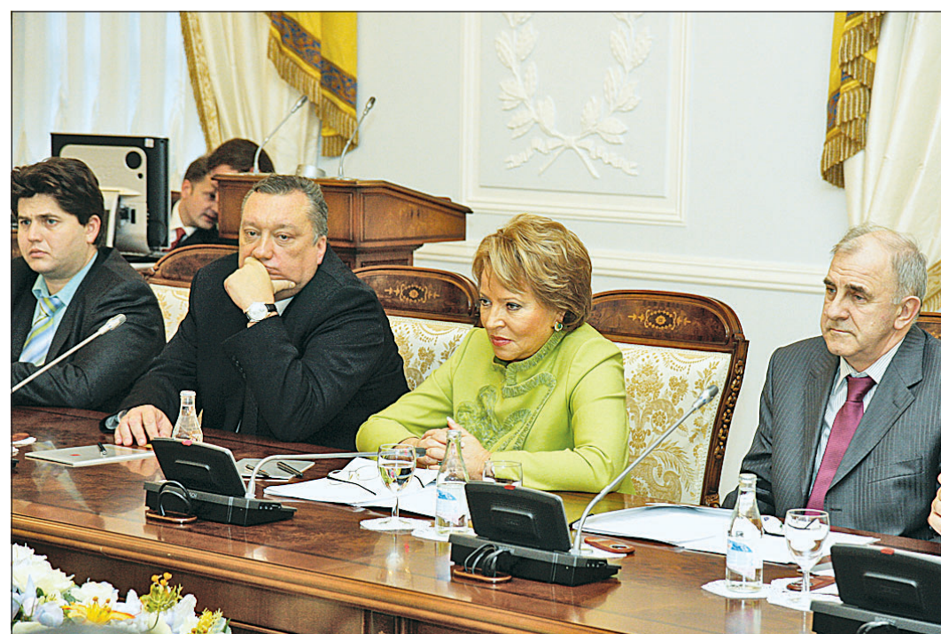
Губернатор Санкт-Петербурга Валентина МАТВИЕНКО: «С Вологодской областью у нас установились самые близкие и самые тесные отношения».