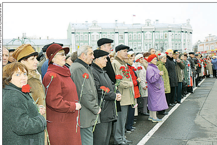
Ветераны комсомола верят в то, что подрастающее поколение найдет достойное место в жизни.