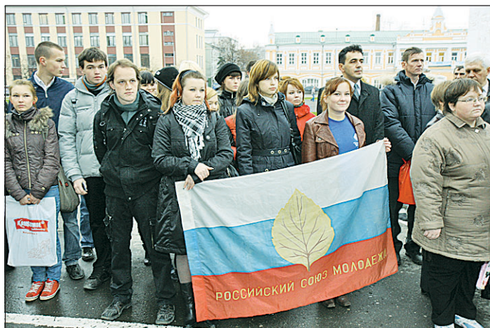
Традиции комсомола продолжают в делах молодежи нашего времени.