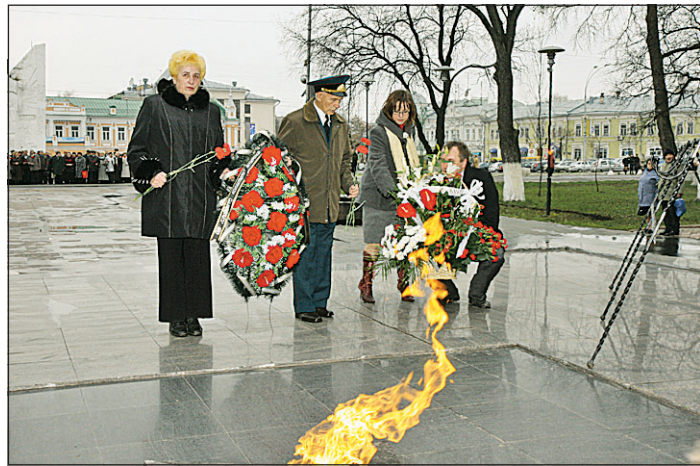
У Вечного огня.