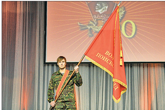
В «Русском доме» прошел торжественный вечер, посвященный знаменательной дате - 90-летию ВЛКСМ.