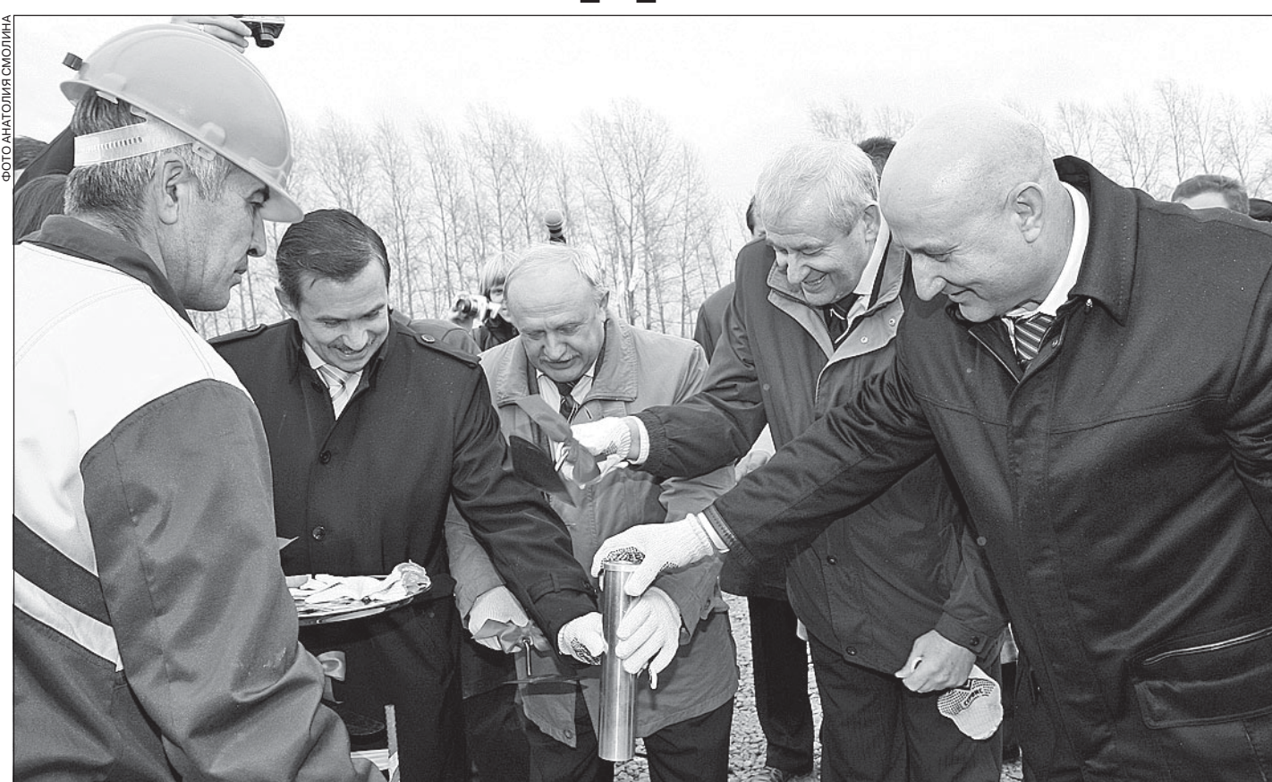
Торжественный момент закладки капсулы с посланием потомкам.

- Это позволит в несколько раз сократить размеры площадки под строительство: сейчас она занимает 8 гектаров, новая подстанция разместится на 2,9 гектара. Кроме того, новое оборудование обладает более продвинутой долговечностью сроками эксплуатации, более высоким уровнем надежности и безопасности, поскольку вся станция разместится под крышей в современном, органично вписывающемся в городской ландшафт здании. В результате реконструкции мы получим самый надежный узел в энергосистеме области, к