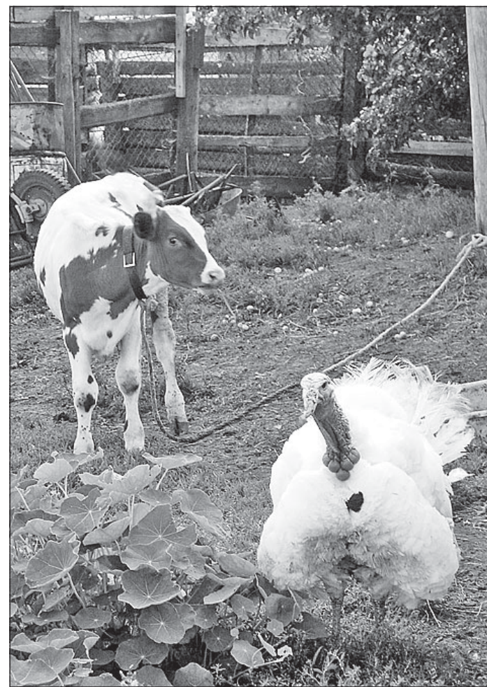
Индюк теленку - товарищ.

Меня хозяйка угостила бифштексом из индюшатины, было очень вкусно. Пока мы трапезничали, ко мне подбежали познакомиться котенок и щенок. Они маленькие, поэтому