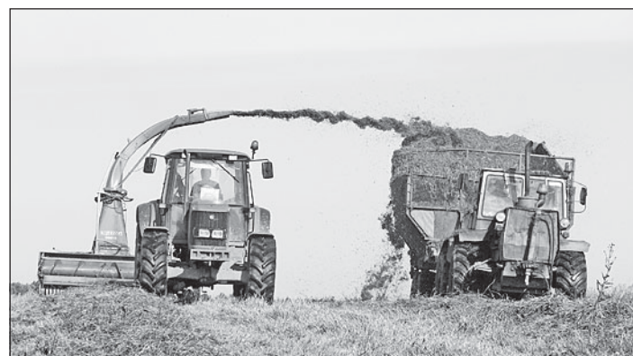
В МТС - современная высокопроизводительная техника.