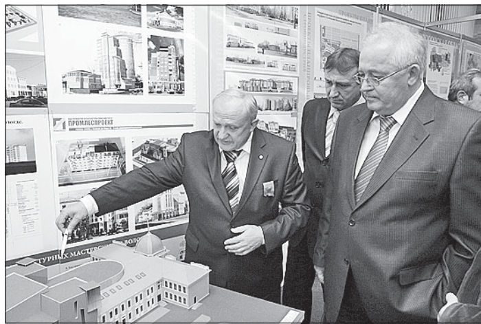
Внимание руководителей области привлек макет проекта реконструкции ДКЖ.